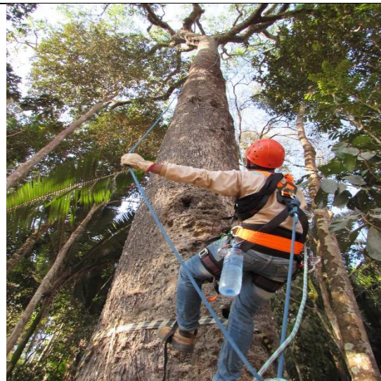
Figura 03: Escalador da Biocev, iniciando a subida para realizar a manobra de instalação.