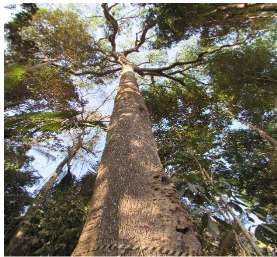
Figura 02: Vista geral da árvore escolhida para fixação da passagem.