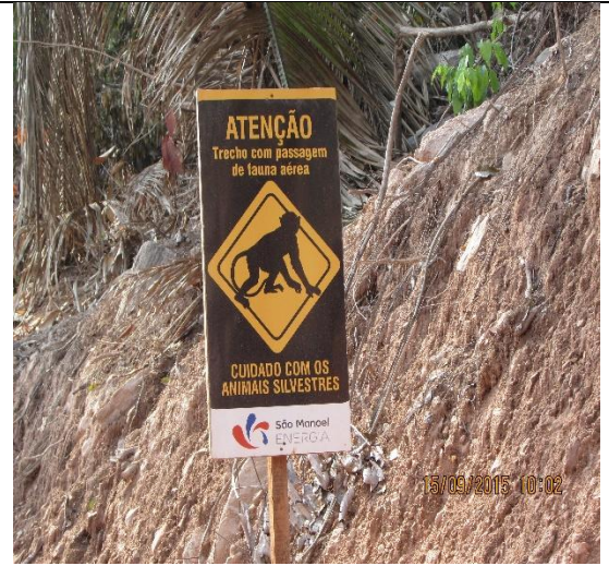
Figura 10: Detalhe na placa informativa, contendo as seguintes orientações: Atenção trecho com passagem de fauna aérea / Cuidado com os animais Silvestres.