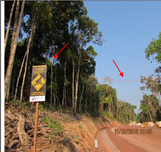
Figura 09: Vista ampla do acesso, sendo contemplado pela as placas de identificação e sinalização, e seta superior ao fundo mostrando a passagem já fixada.