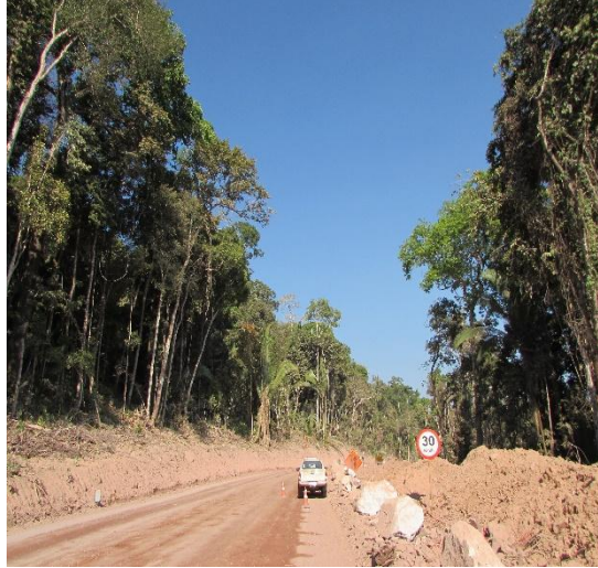
Figura 01: Identificação dos pontos para amarração da passarela nas arbóreas