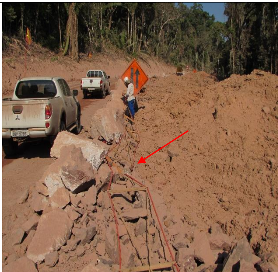
Figura 04: Integrantes da Biocev, realizando os últimos ajustes da passagem, antes da instalação aérea.