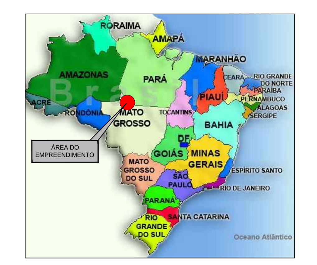
LOCAÇÃO DO EMPREENDIMENTO NO BRASIL ESC: 1/1500