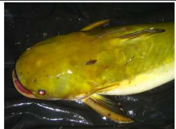
Foto 77: Vandellia sp. (Trichomycteridae; seta) presa a exemplar grande de Tocantinsia piresi capturado.