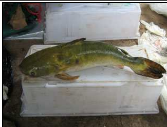
Foto 76: Tocantinsia piresi exemplar de grande porte capturado no Rio Teles Pires durante a estação úmida.