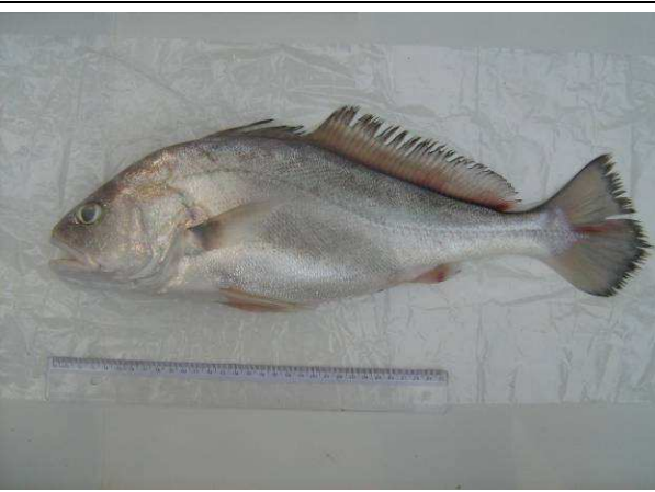
Foto 89: Curvina, Pescada do Piauí ( Plagioscion squamosissimus ).