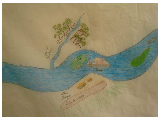
Foto 11: Detalhe da região da aldeia Munduruku de Sapezal, localizada na margem esquerda do rio Teles Pires, com indicação dos buritizais existentes ao longo do igarapé Boritizal, pista de pouso da aldeia e de draga de exploração de ouro.