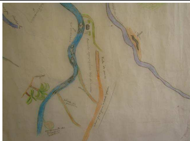
Foto 10: Detalhe da região do rio Santa Rosa, afluente da margem esquerda do rio Teles Pires, com indicação de locais de pesca, de açaiçal e da estrada que vai para a cidade de Apicacás.