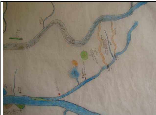
Foto 01: Detalhe representando a região da aldeia Kaiabi de São Benedito, na margem do rio de mesmo nome, afluente do rio Teles Pires, área de caça de anta e movimento migratório de peixes subindo o rio Cururu-açu.