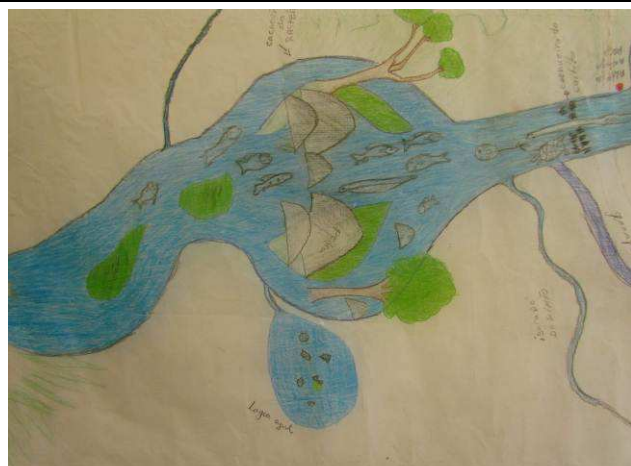
Foto 09: Detalhe da região entre as cachoeiras do Caititu e Rasteira, com destaque para a lagoa Azul.