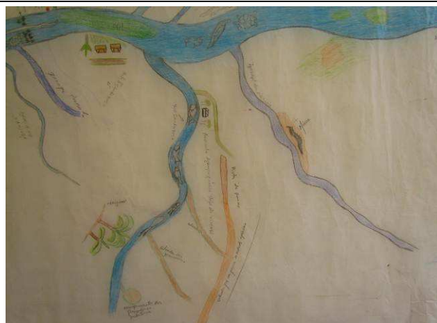
Foto 06: Detalhe da margem esquerda do rio Teles Pires, nas proximidades da aldeia Kaiabi de Kuruzinho, com indicação do rio Santa Rosa, de locais de pesca e da estrada que vai para a cidade de Apicás.