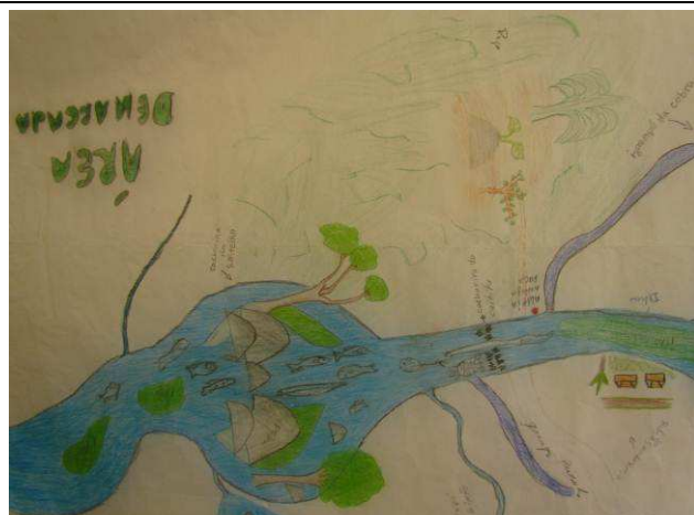
Foto 08: Detalhe da região entre as cachoeiras do Caititu e Rasteira, com indicação da antiga aldeia Pacu e de locais de pesca.