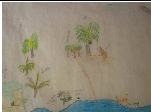
Foto 07: Detalhe da região das aldeias Kaiabi de Tucumã e Dinossauro, localizadas respectivamente nas margens direita e esquerda do rio Teles Pires, com indicação de locais de caça da paca e do extrativismo de palha, castanha e da palmeira inajá.