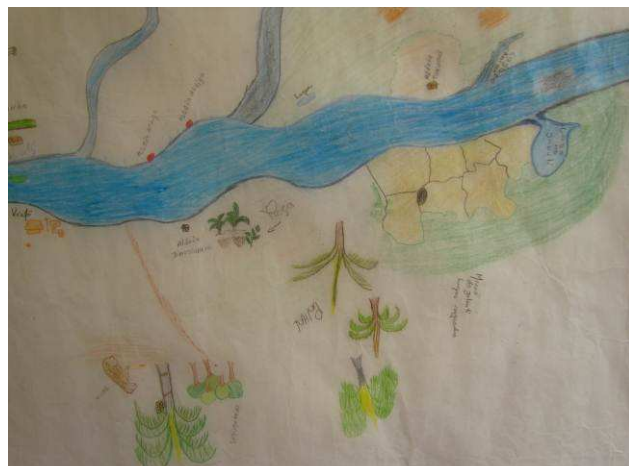
Foto 04: Detalhe da região das aldeias Kaiabi de Tucumã e Dinossauro, localizadas respectivamente nas margens direita e esquerda do rio Teles Pires, com indicação de locais de roça, caça e extrativismo de palha, castanha e inajá.