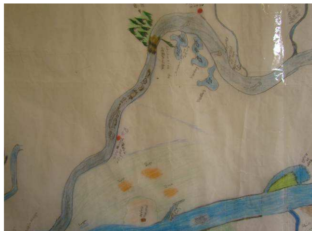
Foto 03: Detalhe da região da aldeia Kaiabi de Tucumã, na margem direita do rio Teles Pires, com representações de locais de roças, fluxo migratório de peixes no rio Cururu-açu e locais de pesca.