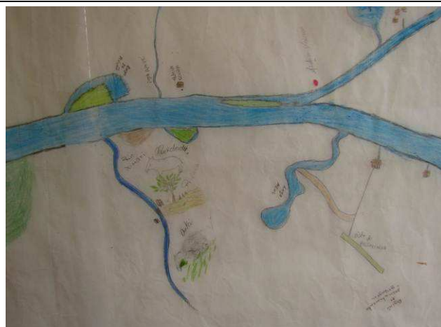
Foto 02: Detalhe da região da aldeia Kaiabi de Coelho, com áreas de caça de anta e queixada ao longo do rio Ximari, afluente do rio Teles Pires.