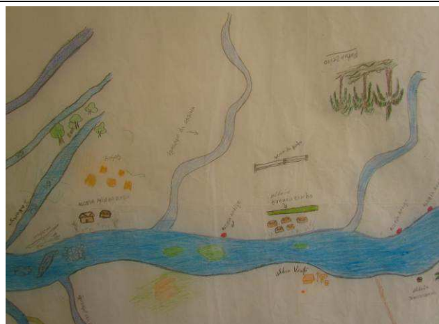
Foto 05: Detalhe da região das aldeias Kaiabi de Kuruzinho e Minhocuçu, localizadas na margem direita do rio Teles Pires, com indicação de locais de roça, pesca e caça do tracajá.