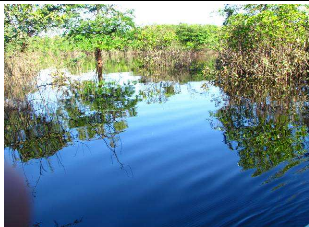
Foto 19: Lagoa da Tartaruga, ponto de pesca, utilizado pelos Apiaká para pescar.