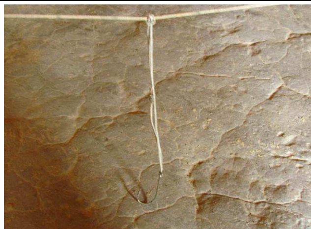
Foto 27: Espinhel utilizado para pescar filhote, tambaqui, surubim e jandiá pelo Seu Cristovão, morador de uma casa ligada a Aldeia Mairowi.