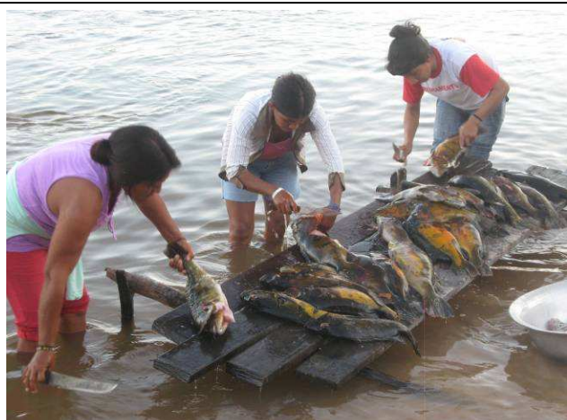
Foto 03: Moradoras da Aldeia Kururuzinho limpando os peixes na beira do Rio Teles Pires.