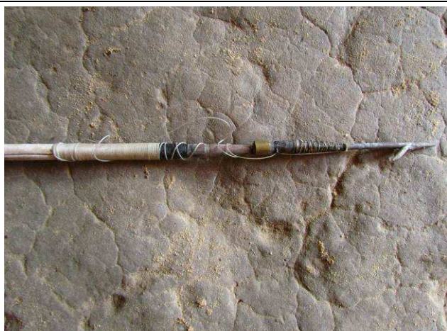
Foto 26: Sararaca (flecha) utilizada para pescar várias espécies de peixes, pelo Seu Cristovão, morador de uma casa ligada a Aldeia Mairowi.