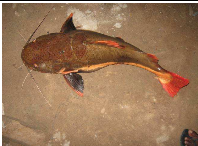
Foto 17: Pirarara ( Pharactocephalus hemiolipterus ) pescada na foz do Igarapé do Boto, por índio Apiaká da Aldeia Mairowi.