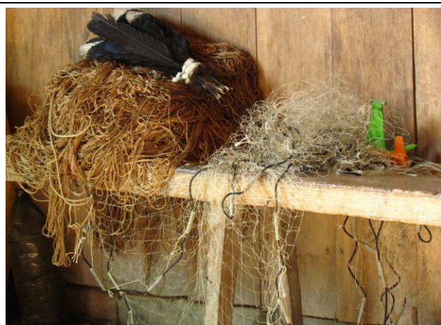
Foto 29: Redes malhadeiras utilizadas para pescar no Rio Teles Pires, pelo Seu Cristovão, morador de uma casa ligada a Aldeia Mairowi.