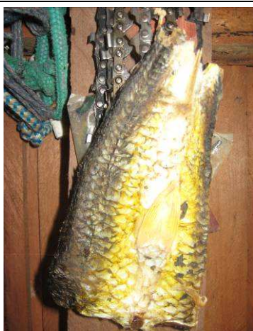
Foto 11: Peça de Traíra ( Hoplias malabaricus ) conservada com sal para ser utilizada como isca para a captura do Tracajá ( Podocnemis unifilis ), na Aldeia São Benedito.