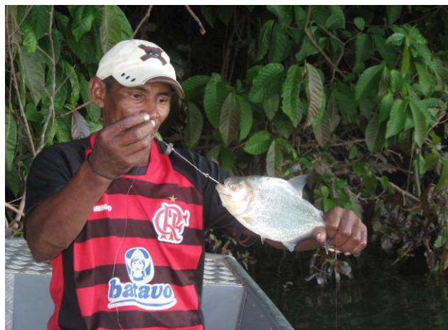
Foto 15: piranha preta ( Serrasalmus rhombeus ) pescada em um trecho do Rio Teles Pires por índio Apiaká, morador da Aldeia Mairowi.