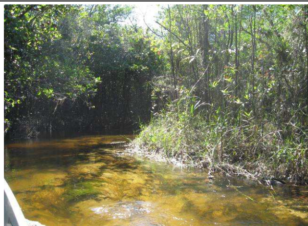
Foto 20: Igarapé do Boto, ponto de pesca utilizado pelos índios Apiaká