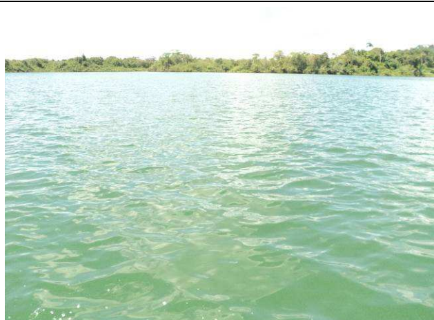
Foto 08: Lago localizado próximo ao rio Teles Pires utilizados pelos índios Kayabi para pescar.