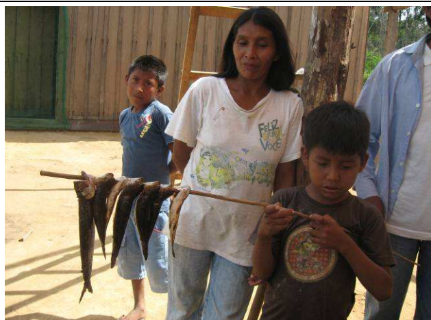
Foto 12: garoto Kayabi com os peixes pescados em um lago próximo da Aldeia São Benedito.