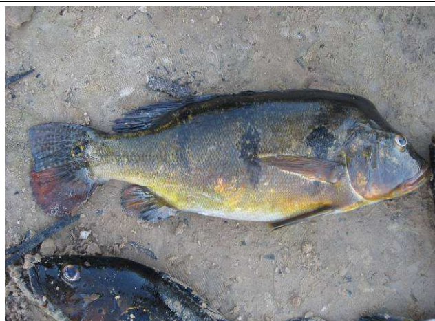
Foto 01: Tucunaré ( Cichla sp.) pescado no Rio Cururu-Açu por moradores da Aldeia Kururuzinho, durante a pesca comunitária.