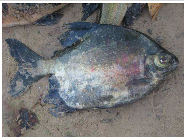
Foto 04: Pacu ( Myleus sp.) pescado no rio Cururu-Açu por moradores da Aldeia Kururuzinho, durante a pesca comunitária.