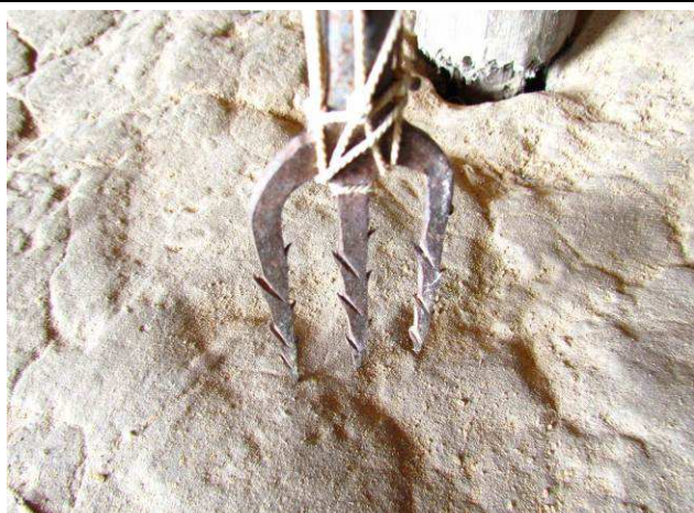
Foto 28: Zagaia utilizada para pescar piau e pacu, pelo Seu Cristovão, morador de uma casa ligada a Aldeia Mairowi.