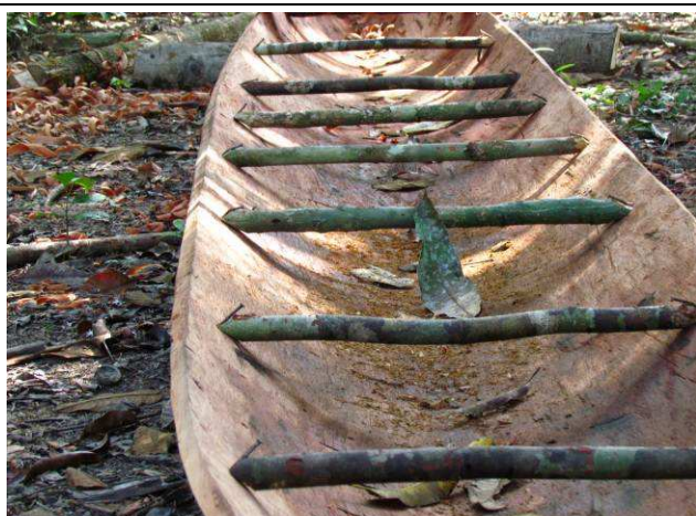
Foto 30: Embarcação utilizada para pescar pelo Seu Cristovão, morador de uma casa ligada a Aldeia Mairowi.