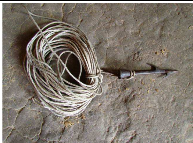
Foto 25: Arpão utilizado para pescar várias espécies de peixes, pelo Seu Cristovão, morador de uma casa ligada a Aldeia Mairowi.