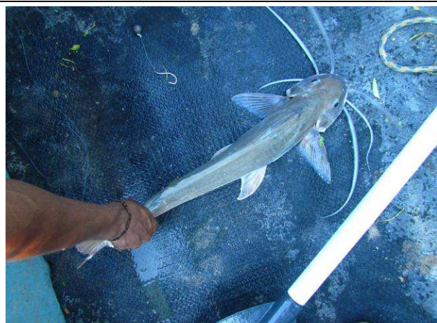
Foto 18: Barbado ( Pinirampus pirinampu ) pescado pelo cacique Raimundo da Aldeia Mairowi na foz do Igarapé do Boto.