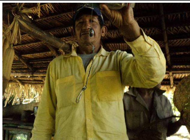
Foto 09: Aparelho de pesca (anzol e linha) utilizado pelos moradores da Aldeia Coelho para pescar.