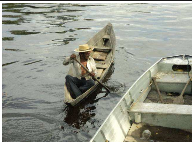
Foto 10: Embarcação utilizada por índio Kayabi morador da Aldeia São Benedito.