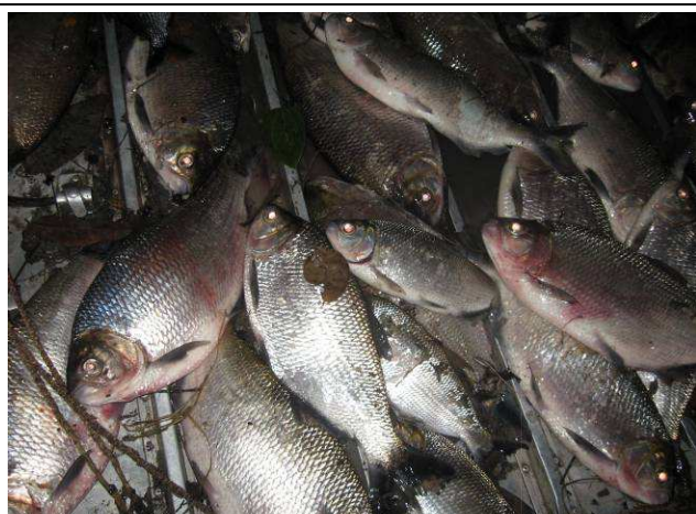
Foto 05: Matrinhãs ( Brycon sp.) pescados no Rio Santa Rosa por moradores da Aldeia Kururuzinho, durante a pesca comunitária.