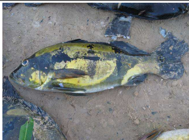
Foto 02: Tucunaré ( Cichla pinima ) pescado no Rio Cururu-Açu por moradores da Aldeia Kururuzinho, durante a pesca comunitária.