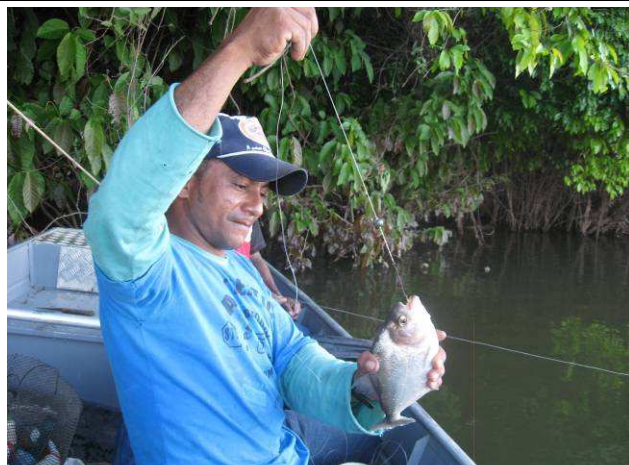
Foto 14: índio Apiaká pescando piranha ( Serrasalmus sp) com anzol e linha em um trecho do Rio Teles Pires.