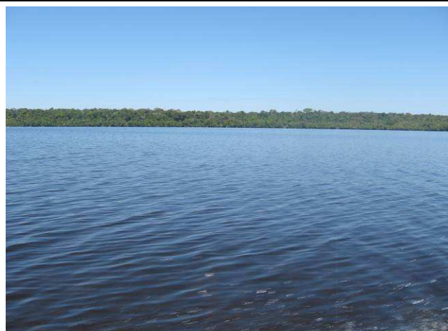
Foto 21: Lago Grande, ponto de pesca utilizado pelos índios Apiaká para pescar.