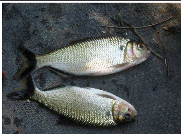
Foto 22: Matrinchã ( Brycon sp.) pescado no Igarapé do Boto por um morador da Aldeia Mairowi.