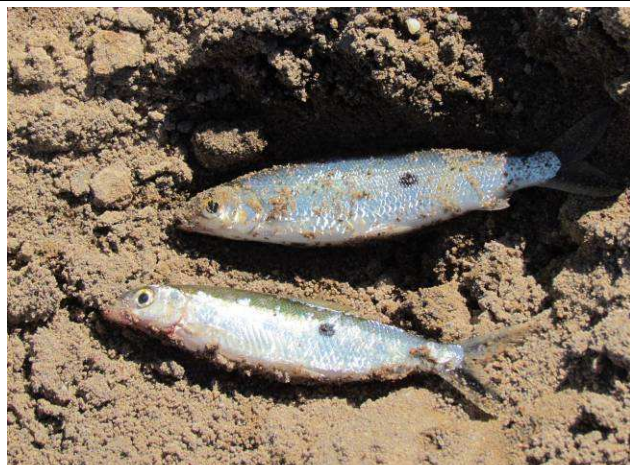
Foto 13: Charutinho ( Hemiodus sp.) utilizado como isca para pescar peixes carnívoros pelos índios Apiaká da Aldeia Mairowi.