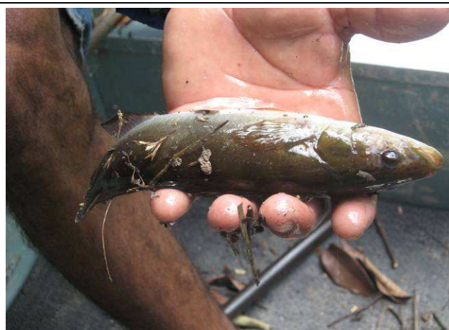
Foto 23: Jacundá ( Crenicichla sp.) pescado no Igarapé do Boto por um morador da Aldeia Mairowi.