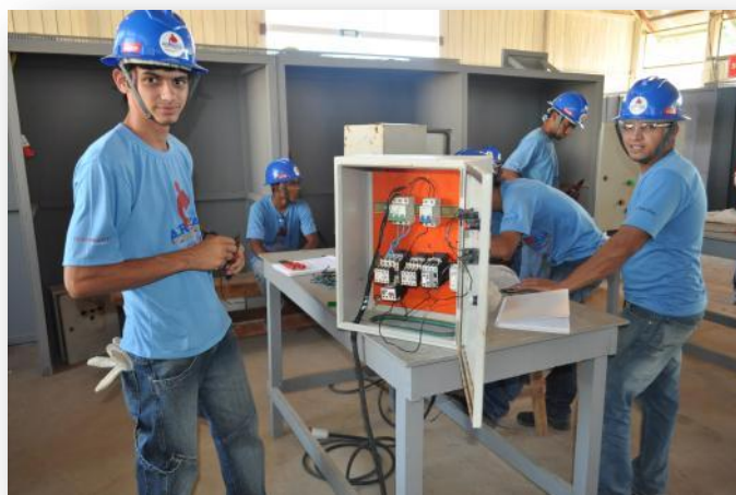
Figura 10 Módulo Técnico - Turma de Eletricista