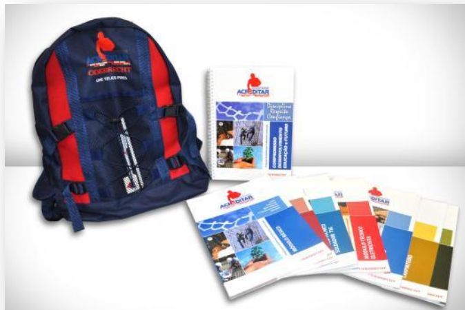
Figura 1 Material Didático do Programa Acreditar