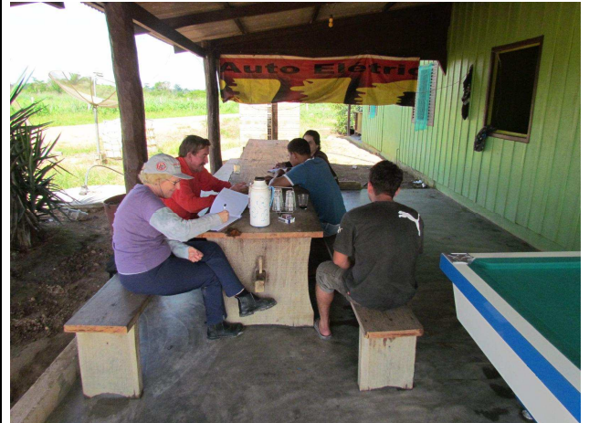
Foto 02: Entrevistas realizadas com garimpeiros, comerciante e trabalhadores da balsa que estavam presentes em 12.11.2011.