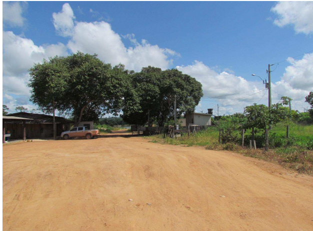
Foto 01: Acesso à balsa do Cajueiro de Paranaíta em 12.11.2011.