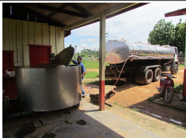
Foto 06: Tanque de armazenamento de leite produzido na Comunidade do Rio Jordão e carregamento de veículo que transporta a produção para a unidade de beneficiamento de leite.