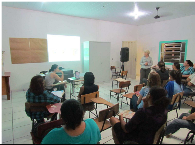
Foto 01: Apresentação inicial dos objetivos do Programa de Educação Ambiental e das atividades de DRP - Diagnóstico Rápido Participativo.