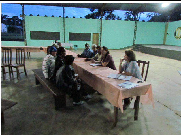
Foto 05: Discussão em grupos para identificação de sugestões e temas a serem tratados em projetos de educação ambiental.