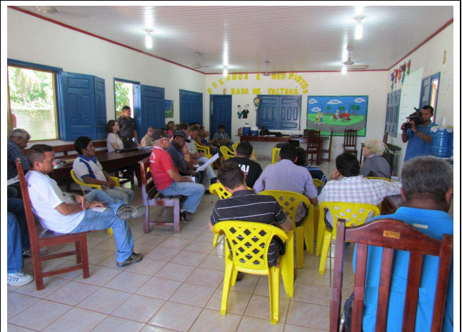
Foto 04: Participantes da oficina - prefeito, representantes das secretarias e funcionários da Prefeitura de Jacareacanga.