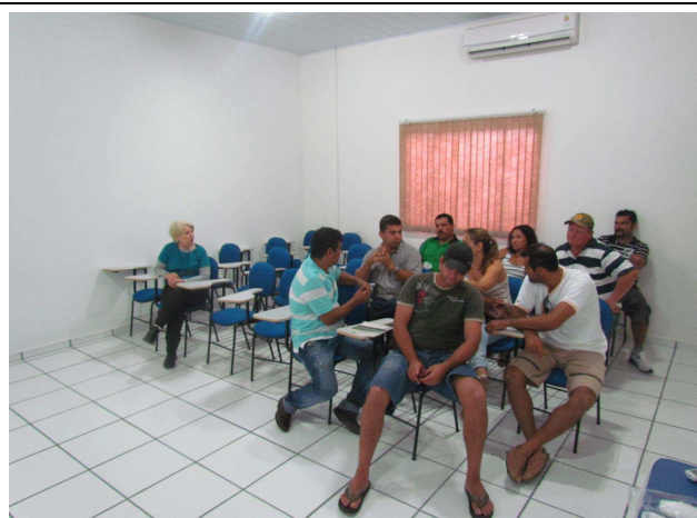
Foto 06: Participantes da oficina de DRP - garimpeiros, comerciantes, proprietário de pousada flutuante, pescadores e proprietário de balsa de garimpo.