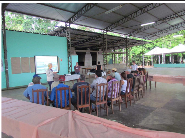
Foto 01: Apresentação inicial - objetivos do Programa de Educação Ambiental.