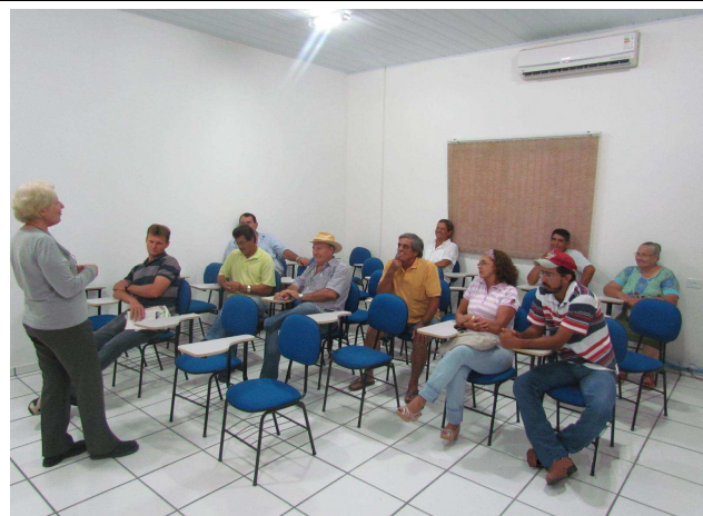
Foto 01: Apresentação inicial - objetivos do Programa de Educação Ambiental.