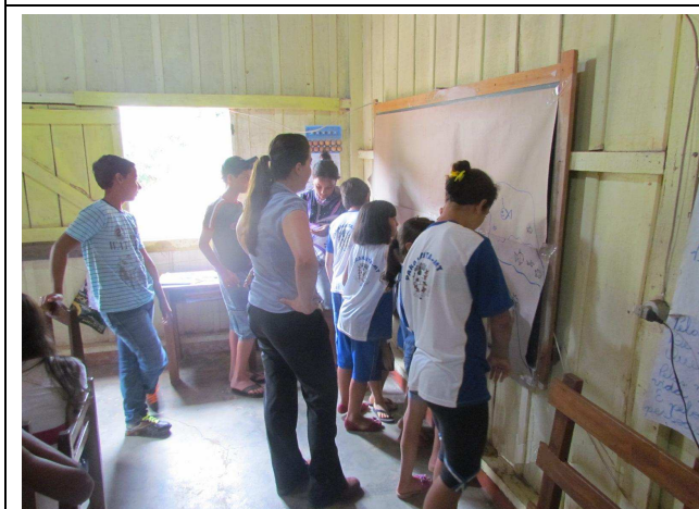
Foto 03: Participação dos alunos na construção do mapa da região sob a perspectiva dos alunos com faixa etária entre 6 e 16 anos.