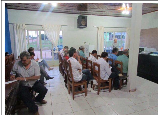
Foto 03: Atividade de levantamento dos pontos positivos e negativos de Paranaíta.