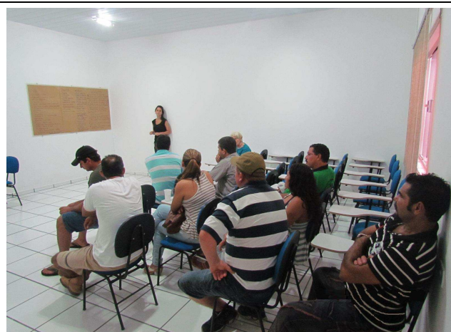
Foto 05: Discussão entre o público envolvido para o levantamento de sugestões e temas a serem tratados em Programas de Educação Ambiental.