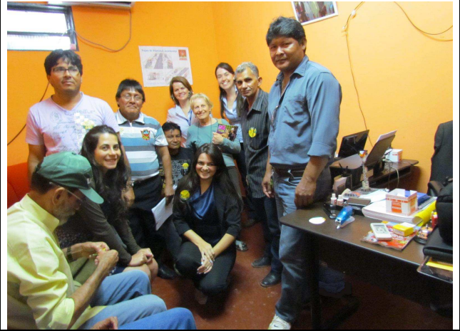
Foto 02: Participantes da reunião na Câmara Municipal de Jacareacanga - vereadores e advogada do poder legislativo.