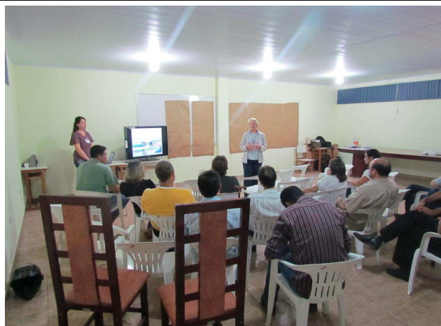
Foto 01: Apresentação inicial - objetivos do Programa de Educação Ambiental e atividades de DRP - Diagnóstico Rápido Participativo.