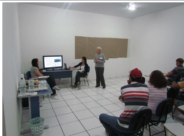
Foto 02: Apresentação das atividades de DRP – Diagnóstico Rápido Participativo.