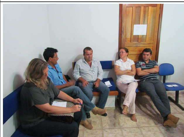
Foto 06: Discussão entre o público envolvido para levantamento de sugestões e temas a serem tratados em Projetos de Educação Ambiental.