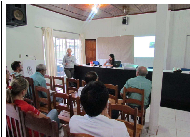
Foto 01: Apresentação inicial dos objetivos do Programa de Educação Ambiental e das atividades de DRP - Diagnóstico Rápido Participativo.