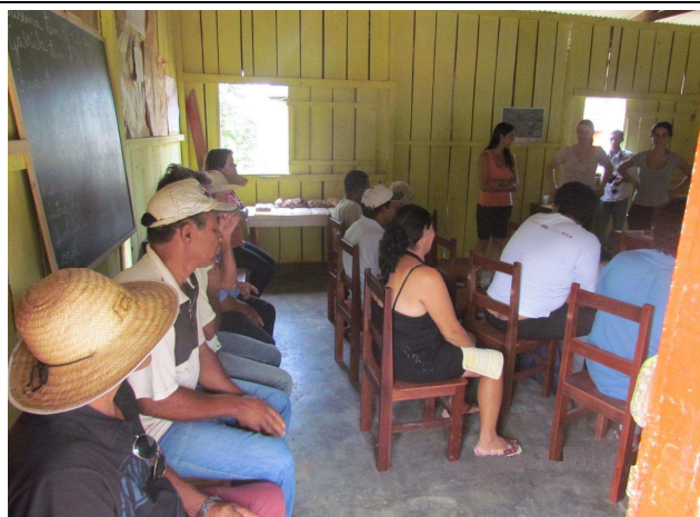
Foto 05: Discussão entre os participantes para levantamento dos pontos positivos e negativos da comunidade e identificação de sugestões de melhoria.