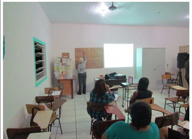
Foto 04: Apresentação e exposição em painéis dos pontos positivos e negativos levantados.