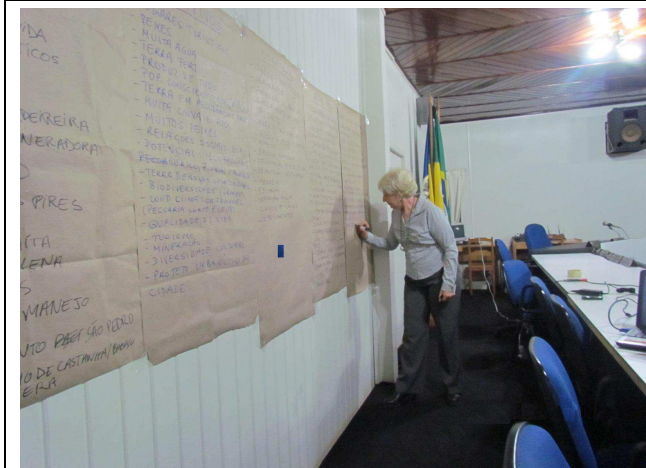
Foto 05: Painéis com as sugestões propostas pelo público participante.