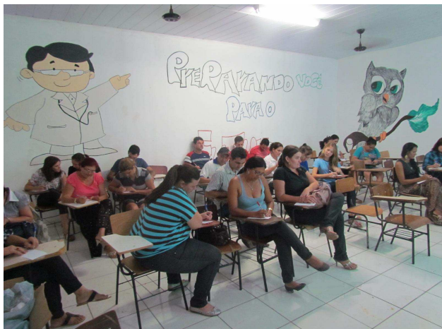
Foto 03: Levantamento dos pontos positivos e negativos de Paranaíta.