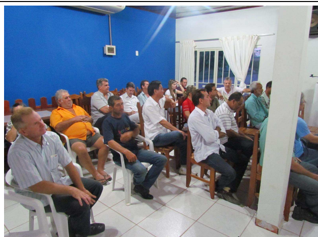
Foto 04: Participantes da oficina – pescadores profissionais, associados da Associação de Pesca Esportiva de Paranaíta e proprietários de ilhas.