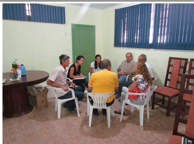
Foto 04: Discussão em grupos para identificação de sugestões e temas a serem tratados em projetos de educação ambiental.