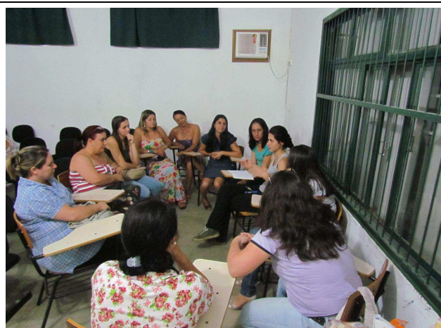
Foto 04: Discussão em grupos para identificação de sugestões e temas a serem tratados em projetos de educação ambiental.