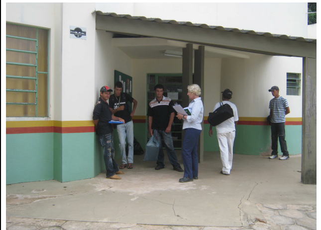
Foto 04: Ainda em frente ao SINE Alta Floresta em 14.11.2011, no dia do cadastramento dos pescadores profissionais para recebimento do seguro da Piracema.