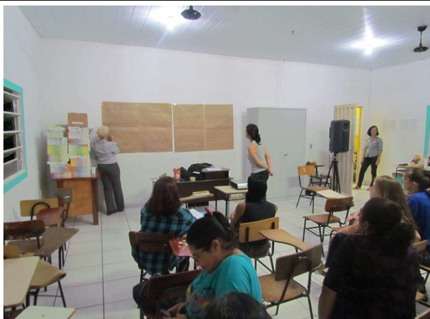
Foto 05: Exposição das sugestões propostas pelo público participante.