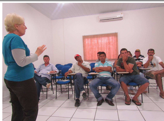
Foto 03: Esclarecimentos sobre os programas ambientais a serem desenvolvidos pela Companhia Hidrelétrica Teles Pires.