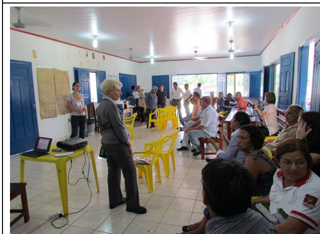
Foto 05: Discussão entre o público envolvido para o levantamento de sugestões e temas a serem tratados em Projetos de Educação Ambiental.