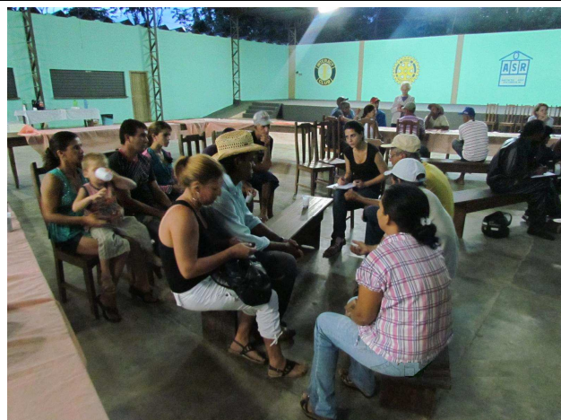
Foto 04: Discussão em grupos para identificação de sugestões e temas a serem tratados em projetos de educação ambiental.