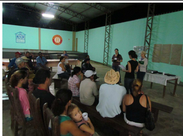
Foto 06: Apresentação dos resultados obtidos pelos grupos e esclarecimentos dos programas ambientais a serem desenvolvidos pela Companhia Hidrelétrica Teles Pires.