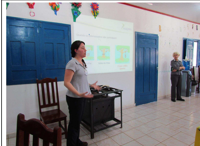
Foto 01: Apresentação dos objetivos do Programa de Educação Ambiental e das atividades de DRP - Diagnóstico Rápido Participativo.