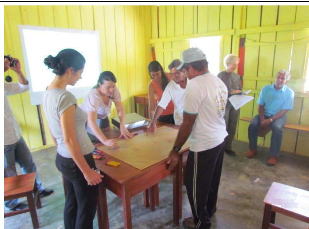
Foto 04: Participação dos moradores da Comunidade na construção do mapa local.