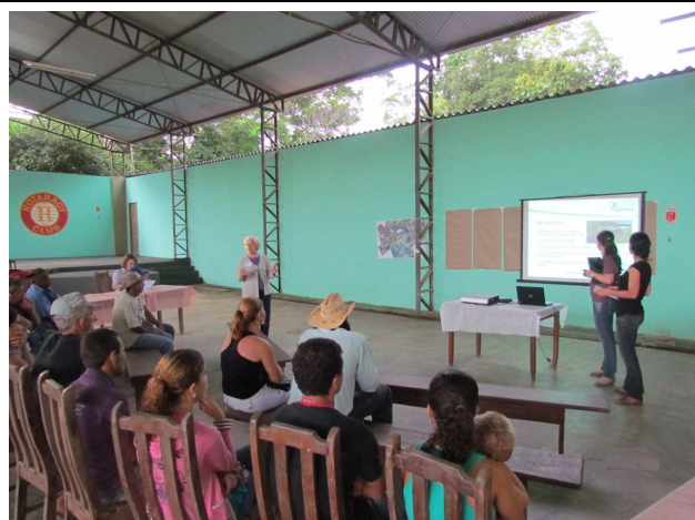
Foto 02: Apresentação das atividades de DRP – Diagnóstico Rápido Participativo.