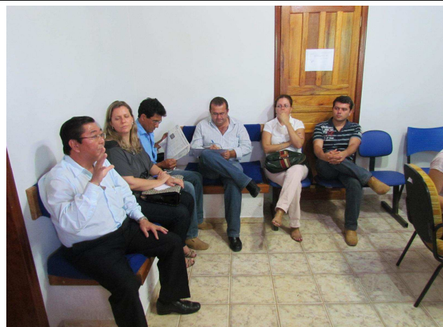
Foto 01: Participantes das atividades de DRP – Prefeito e Secretários da Prefeitura de Paranaíta.