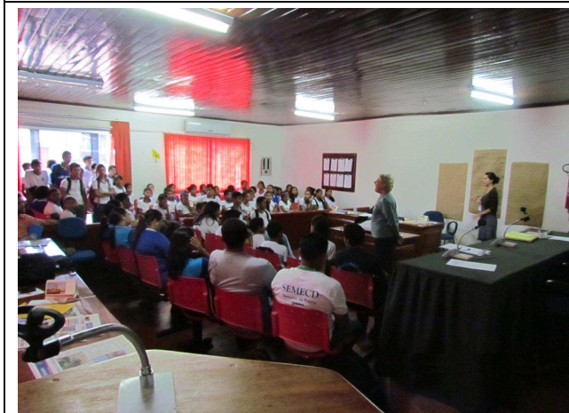
Foto 05: Público participante da oficina – alunos, professores e diretoria da Escola Municipal Carmen Valente da Silva, presidente da Associação Comercial, Coordenador do Sindicato Sindsaúde e Presidente da Colônia de Pescadores Z-86.