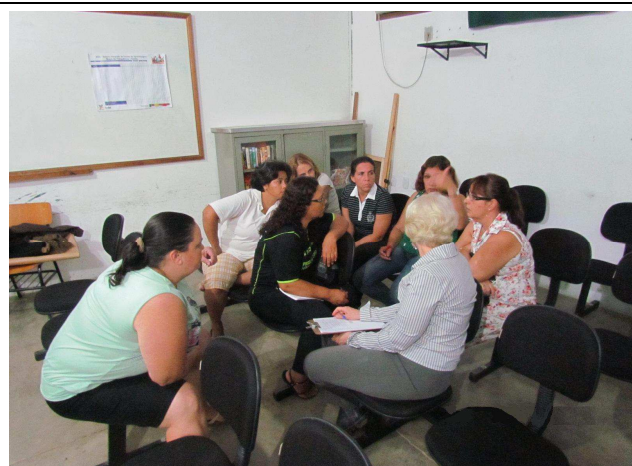
Foto 05: Discussão em grupos para identificação de sugestões e temas a serem tratados em projetos de educação ambiental.