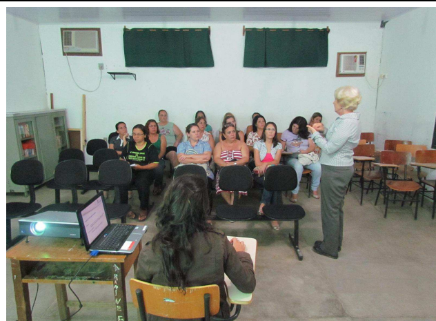
Foto 01: Apresentação inicial dos objetivos do Programa de Educação Ambiental e das atividades de DRP - Diagnóstico Rápido Participativo.