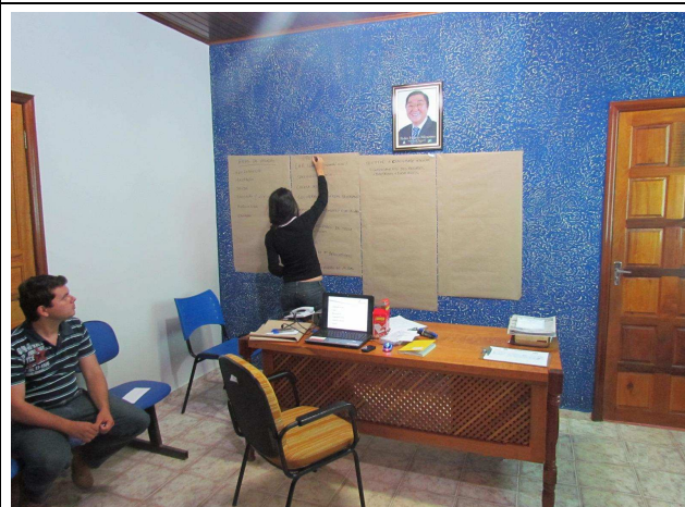
Foto 04: Apresentação em painéis das características do município identificadas durante a oficina.