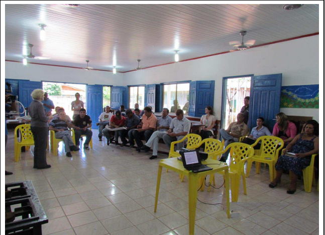
Foto 02: Esclarecimentos sobre os programas ambientais que serão desenvolvidos pela Companhia Hidrelétrica Teles Pires.