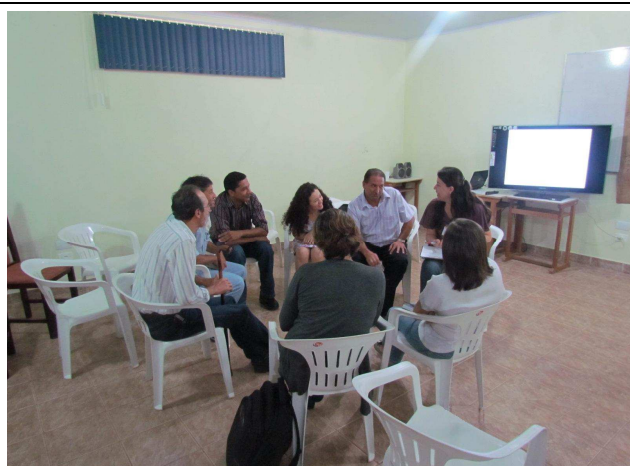
Foto 03: Discussão em grupos para identificação de sugestões e temas a serem tratados em projetos de educação ambiental.