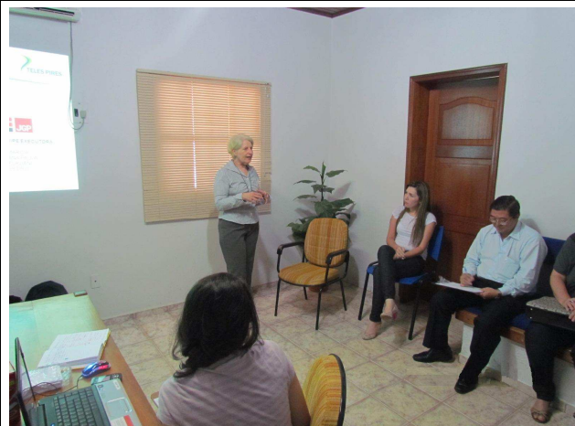
Foto 02: Apresentação dos objetivos do Programa de Educação Ambiental e das atividades de DRP - Diagnóstico Rápido Participativo.