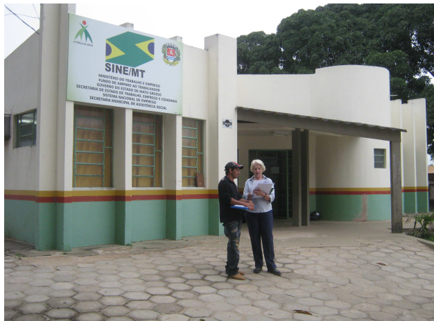
Foto 03: Entrevista com Pescador profissional na saída do SINE – Sistema Nacional de Empregos de Alta Floresta em 14.11.2011.