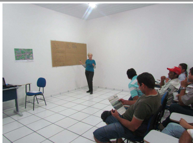
Foto 04: Levantamento dos pontos positivos e negativos da região.