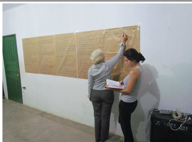
Foto 06: Exposição em painéis das sugestões propostas pelo público participante.