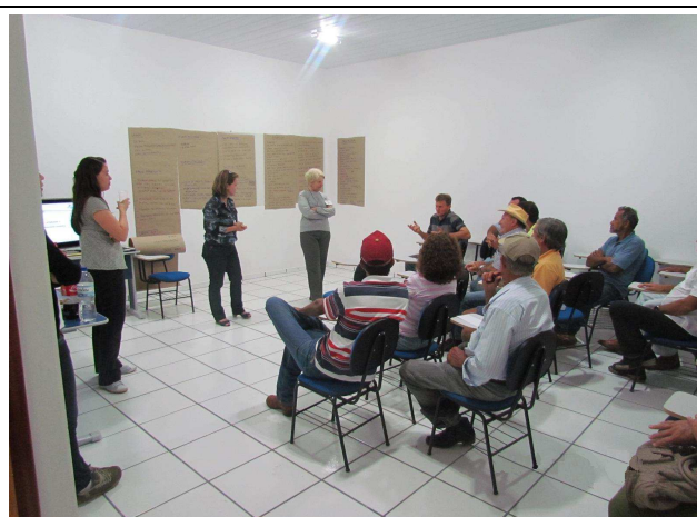
Foto 06: Esclarecimentos da representante da Companhia Hidrelétrica Teles Pires referente a dúvidas dos participantes.