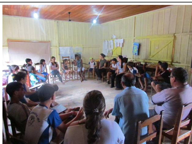
Foto 02: Atividade inicial – Dinâmica de apresentação dos participantes envolvendo alunos, professores e pais de alunos.