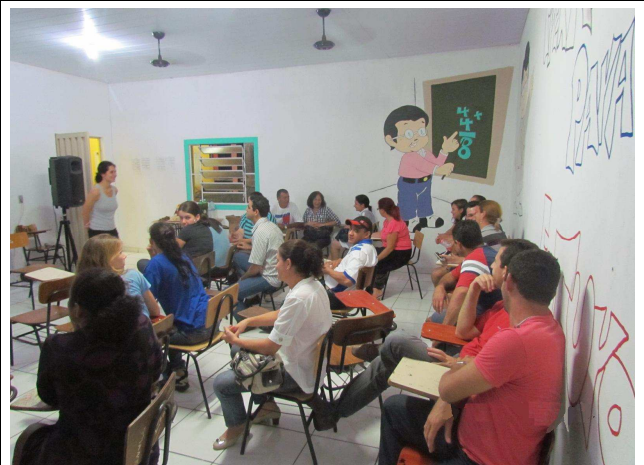
Foto 06: Discussão entre o público envolvido para o levantamento de sugestões e temas a serem tratados em Programas de Educação Ambiental.