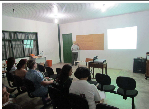
Foto 03: Levantamento dos pontos positivos e dos pontos negativos de Paranaíta e do ambiente escolar.