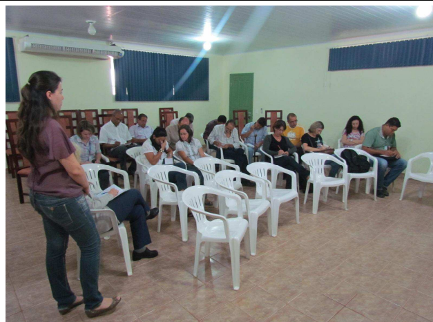
Foto 02: Primeira atividade – levantamento dos pontos positivos e negativos do município de Alta Floresta.