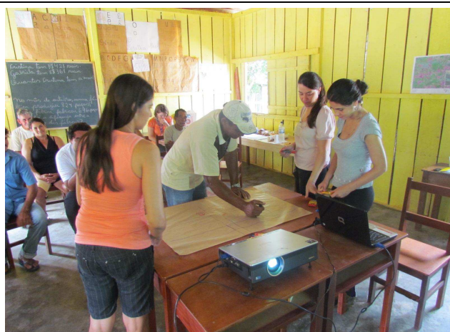
Foto 03: Participação dos moradores da Comunidade na construção do mapa local.