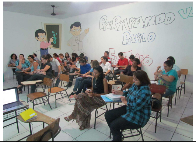
Foto 02: Participantes da oficina – professores, diretores e integrantes do Conselho Deliberativo da Comunidade Escolar.