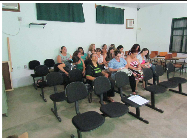
Foto 02: Participantes da DRP – professoras e diretores das escolas.