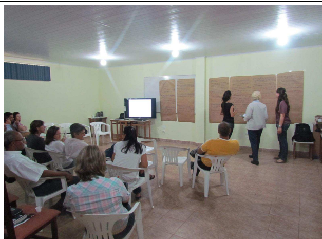
Foto 06: Discussão entre os participantes para identificação de outros temas a serem tratados em projetos de educação ambiental.