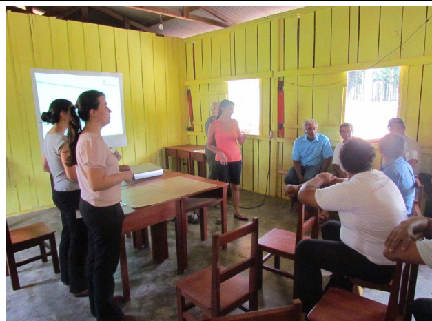
Foto 02: Apresentação da primeira atividade – construção do mapa local.