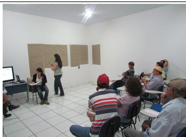
Foto 05: Discussão entre o público envolvido para levantamento de sugestões de temas a serem tratados em projetos de educação ambiental.