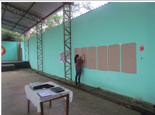
Foto 03: Atividades iniciais – levantamento do mapa local e identificação dos pontos positivos e negativos da região.