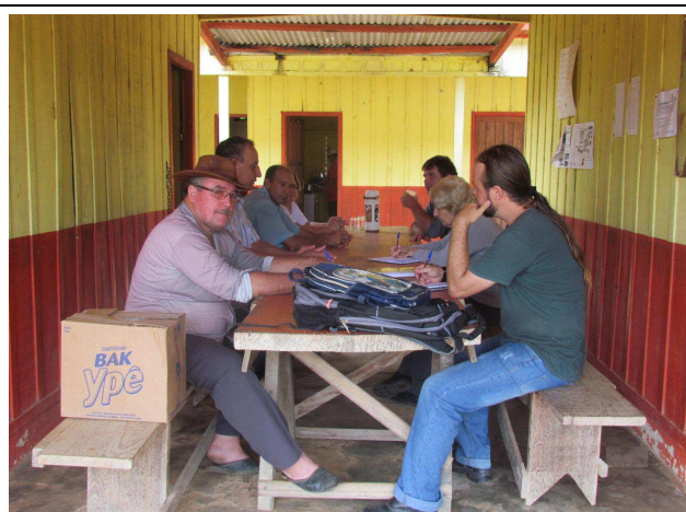
Foto 04: Reunião com professores e pais de alunos para levantamento de pontos positivos e negativos da região e identificação de sugestões de projetos de educação ambiental.