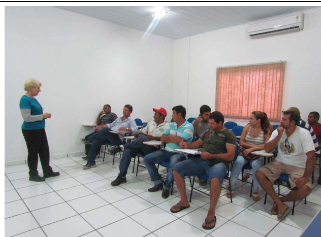
Foto 01: Apresentação dos objetivos do Programa de Educação Ambiental e das atividades de DRP - Diagnóstico Rápido Participativo.