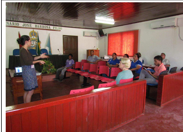
Foto 03: Apresentação dos objetivos do Programa de Educação Ambiental e das atividades de DRP – Diagnóstico Rápido Participativo.