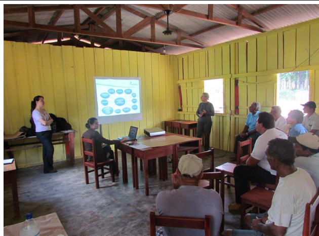
Foto 01: Apresentação dos objetivos do Programa de Educação Ambiental e das atividades de DRP – Diagnóstico Rápido Participativo.