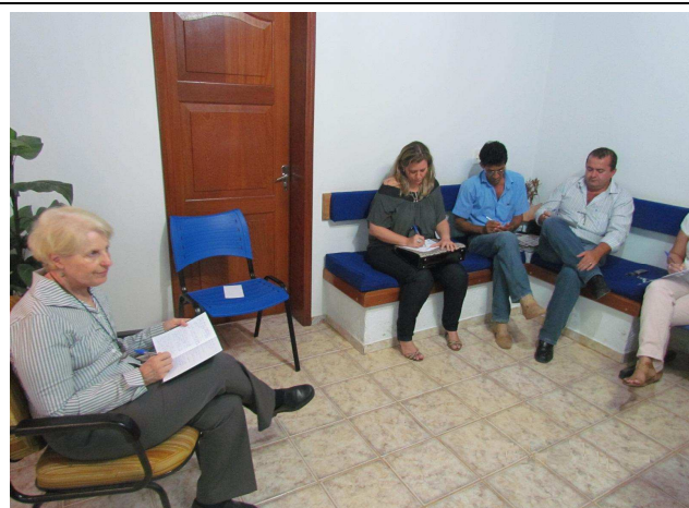
Foto 03: Primeira atividade – levantamento dos pontos positivos e negativos do município de Paranaíta.