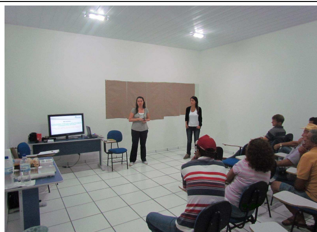
Foto 03: Primeiras atividades da oficina: levantamento do mapa local e identificação dos pontos positivos e dos pontos negativos do município e da Área de Influência Direta do empreendimento UHE Teles Pires.