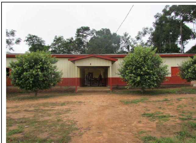
Foto 01: Fachada da Escola Municipal de Ensino Fundamental Getúlio Vargas.