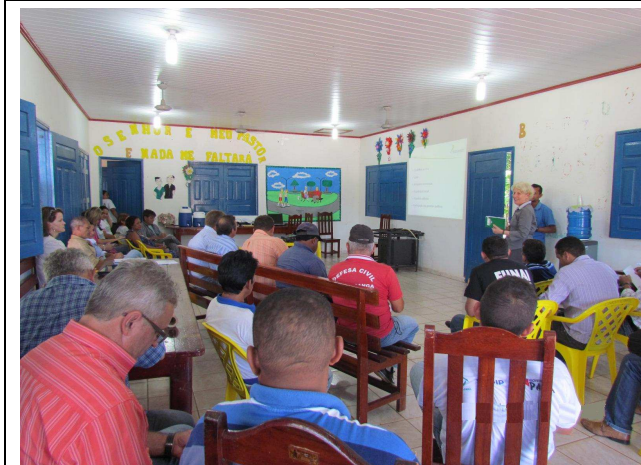
Foto 03: Primeira atividade – levantamento dos pontos positivos e negativos do município de Alta Floresta.