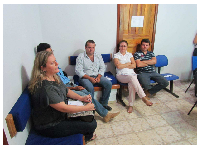
Foto 05: Discussão entre o público envolvido para levantamento de sugestões e temas a serem tratados em Projetos de Educação Ambiental.