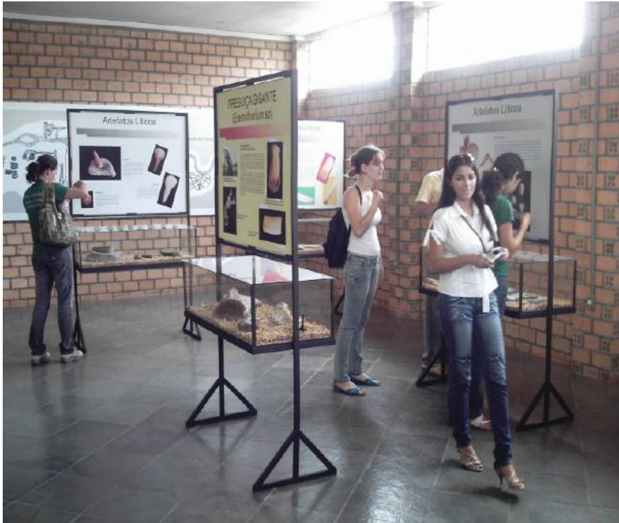
Figura 6 - 1 – Visão geral das instalações do Museu de História Natural de Alta Floresta/MT.