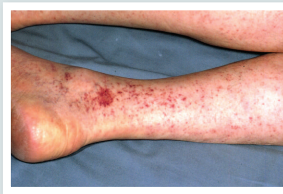
Manchas pelo corpo (exantema ou "rash")