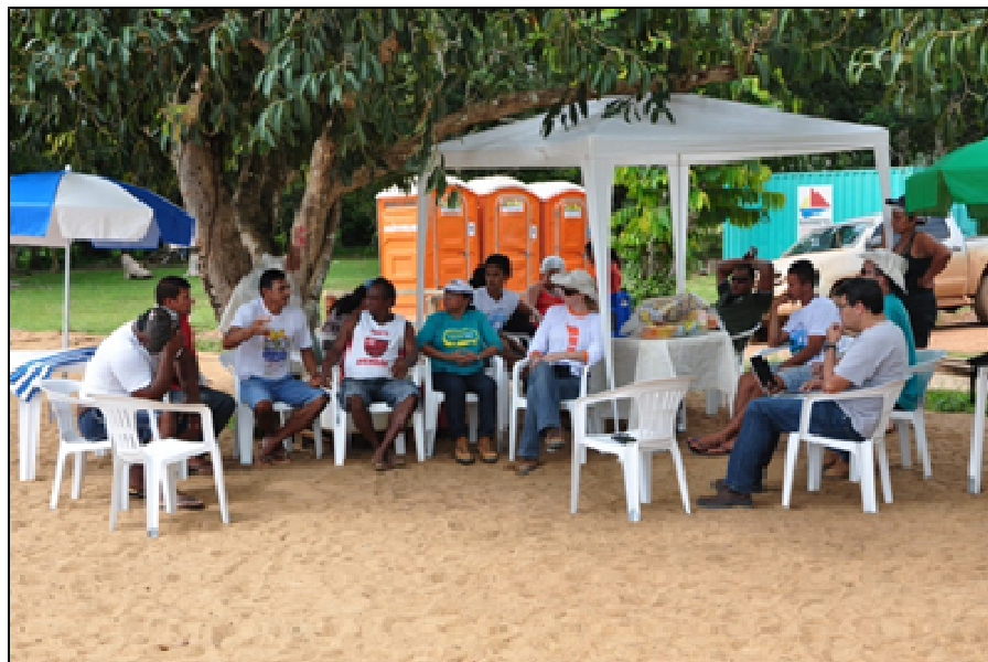
Imagem 1 – Reunião na comunidade Vila de Teotônio Fonte: J1PPQ, 17/03/2012

Dentre os produtos acordados entre a comunidade e a equipe da J1 e demais participantes ficaram definidas: a implantação da trilha ecológica e da pesca educativa para o público infantil.