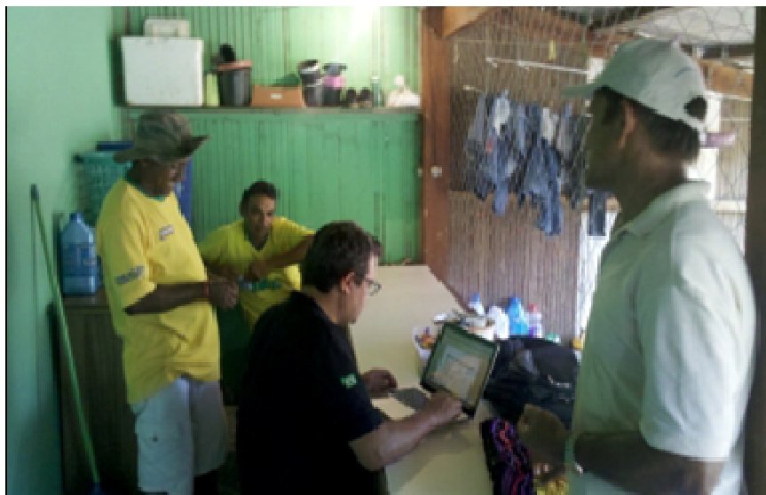
Imagem 3 - Levantamento sobre os itens necessários para pesca educativa