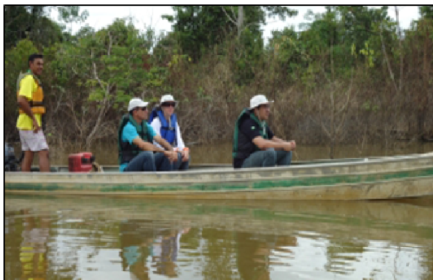
Imagem 4 - Visita Técnica no lago para definição dos pontos da pesca educativa