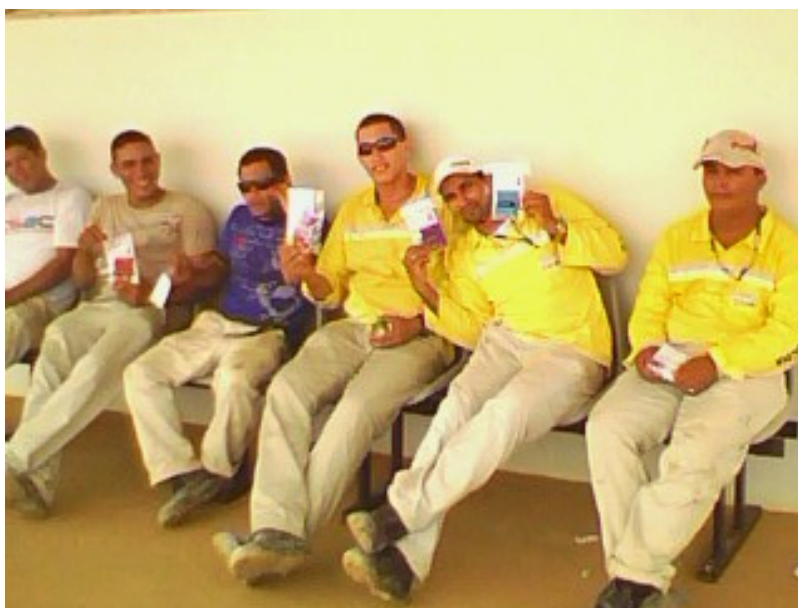
Distribuição de kits para os colaboradores.