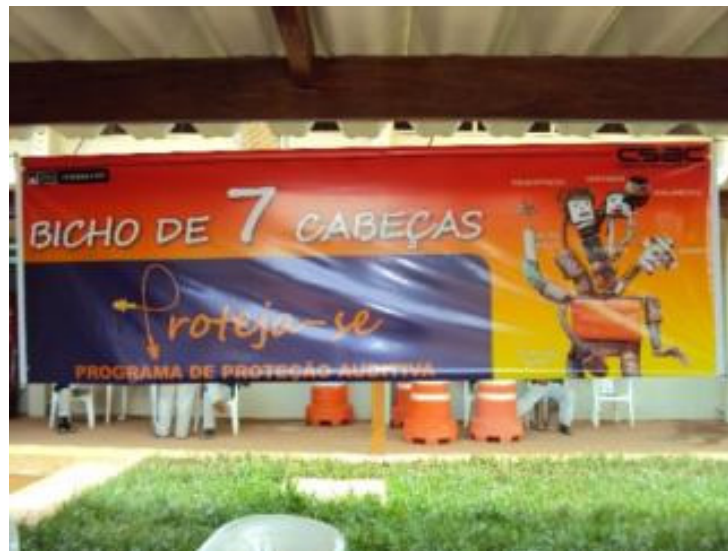
Material de divulgação da campanha.

Campanha de Prevenção de Perdas Auditivas realizada no período de 17 a 21 de novembro de 2009 em comemoração ao Dia Nacional de Prevenção e Combate à Surdez.