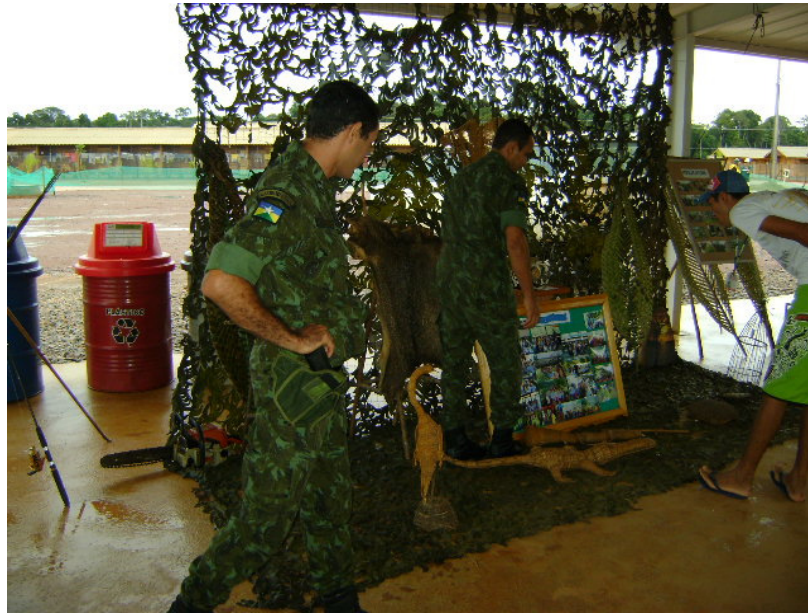
Exposição da Polícia Militar Ambiental – SIPAT.