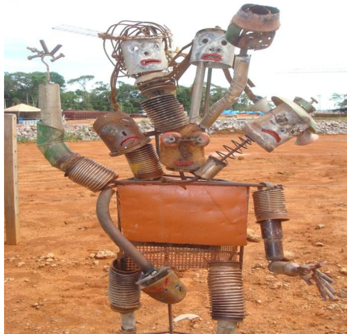
Criado por colaboradores o “bicho de sete cabeças” representa os problemas que os trabalhadores enfrentam quando estão expostos ao ruído, sem se protegerem