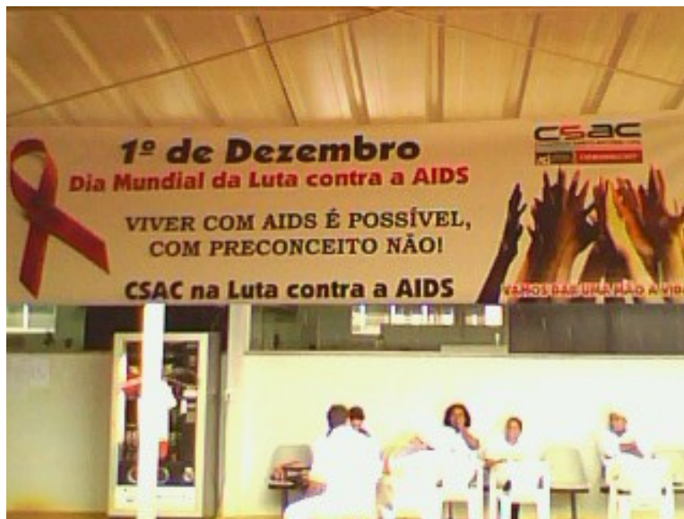
Divulgação da campanha nos refeitórios.

Campanha CSAC na Luta Contra a AIDS realizada no dia 1º de dezembro de 2009 com a distribuição de 8.000 kits formados por preservativos, folder informativo e o “laço” vermelho, símbolo mundial da campanha.