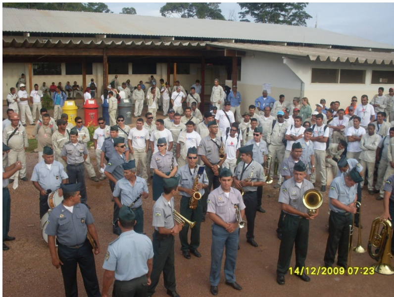
Abertura da SIPAT.