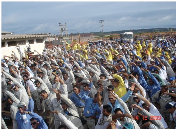
Realização de Ginástica laboral – SIPAT.