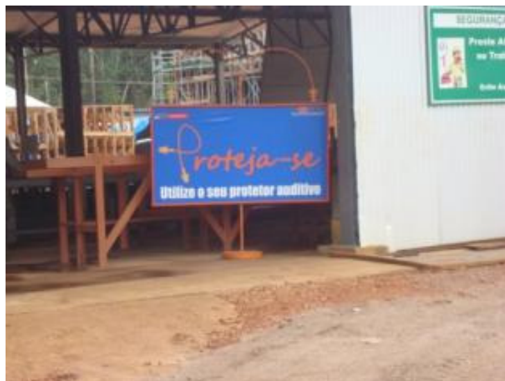
Placas instaladas nas frentes de serviço.