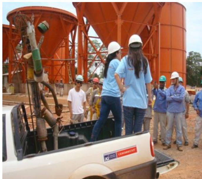
Divulgação do “bicho de sete cabeças” nas frentes de serviço da campanha de prevenção de perdas auditivas.