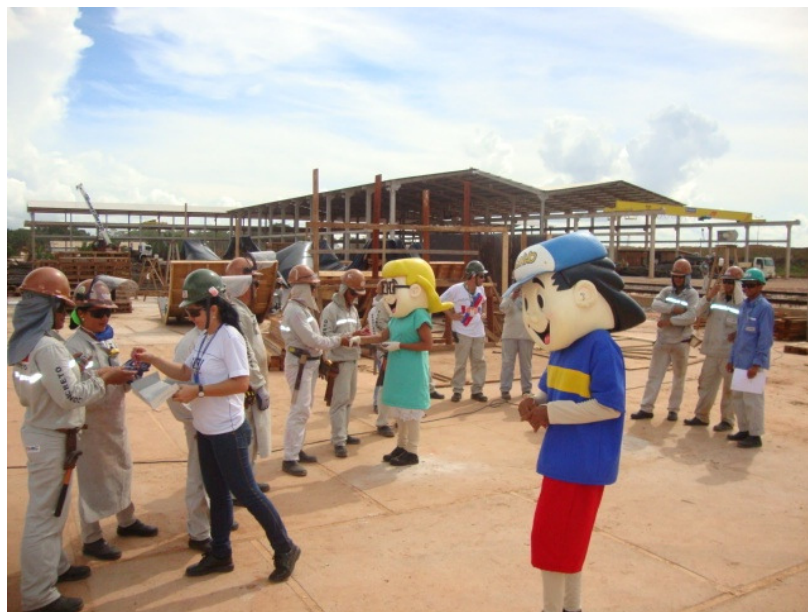
Blitz da educativa da segurança – SIPAT.