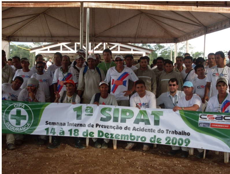
Faixa de divulgação da SIPAT.

Realização da 1ª SIPAT do CSAC no período de 14 a 18 de dezembro de 2009.