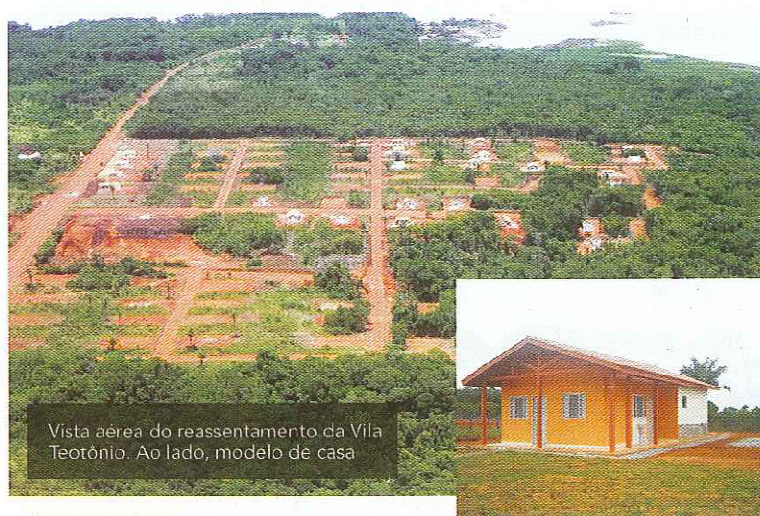
Vista aérea do reassentamento da Vila Teotônio. Ao lado, modelo de casa

Afinal, É MELHOR CONFERIR PESSOALMENTE , do que em fotografia, certo?