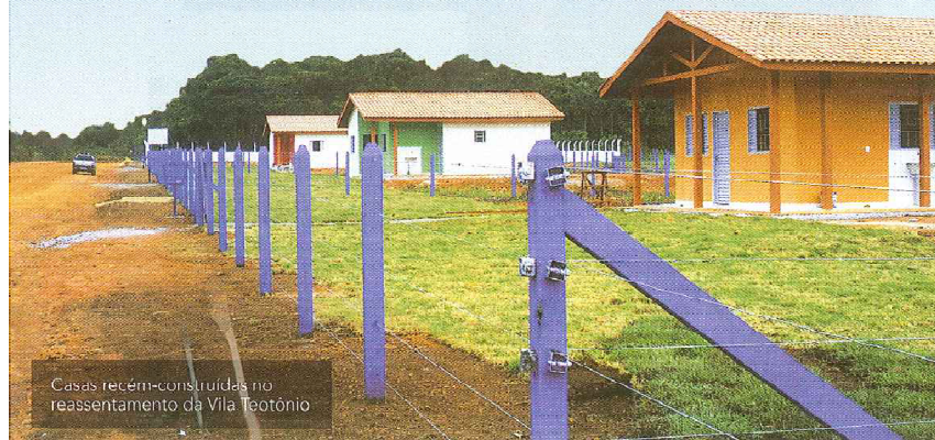
Casas recém-construídas no reassentamento da Vila Teotônio

Para não haver dúvida na hora da escolha, a Santo Antônio Energia organizou, na Vila Teotônio, uma exposição dos tipos de casas que serão construídas em Jacy-Paraná e nos Reassentamentos Rurais.