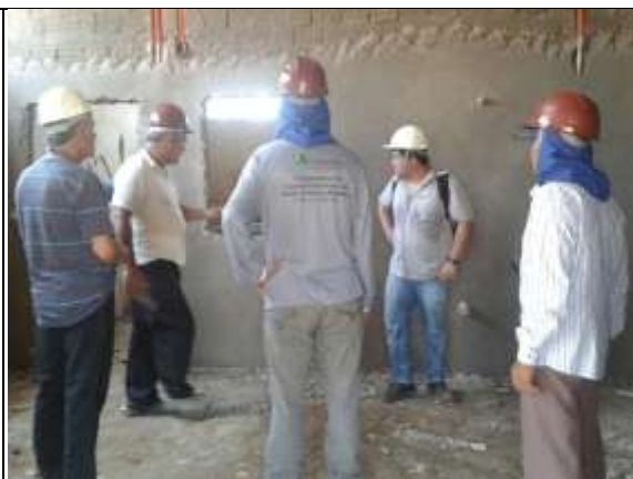
Figura 21: Consultor trocando informações com os diretores da COOMADE.

As próximas atividades desta ação consistem no levantamento de máquinas e equipamentos que atendam ao fluxo de processamento e principalmente a planta baixa da agroindústria. Essa atividade deverá ser facilitada através de estudos e sugestões do consultor com a participação da cooperativa.