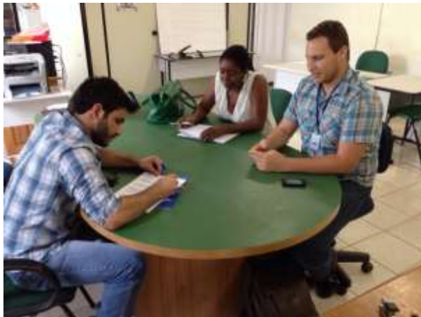
Figura 13: Reunião no Escritório Regional da EMATER-RO.