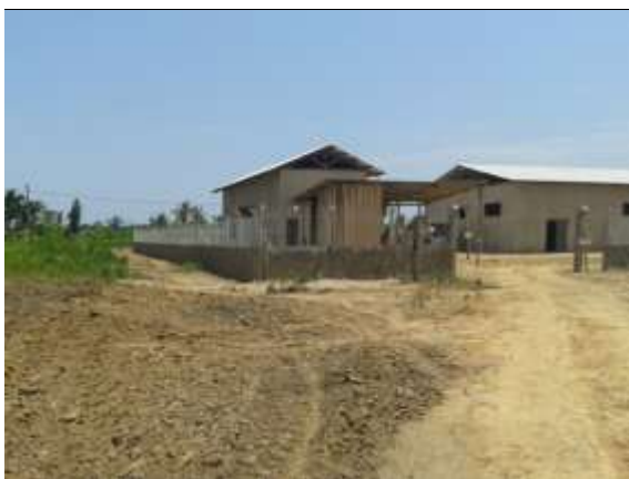
Figura 20: Vista da frente da agroindústria de Calama.