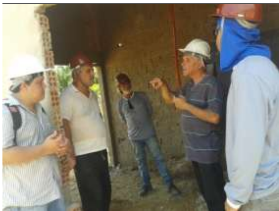
Figura 20: Consultor trocando informações com os diretores da COOMADE.