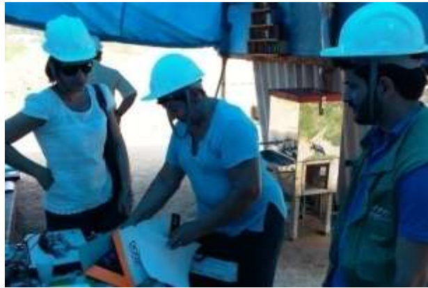
Figura 17: Entrega do Termo de Inspeção do MAPA.