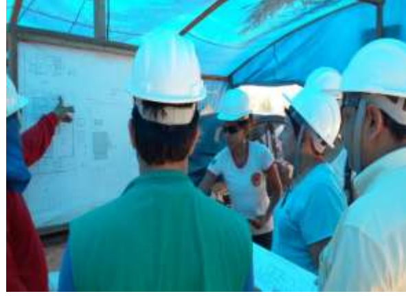
Figura 16: Apresentação da planta baixa da Agroindústria de Cujubim.