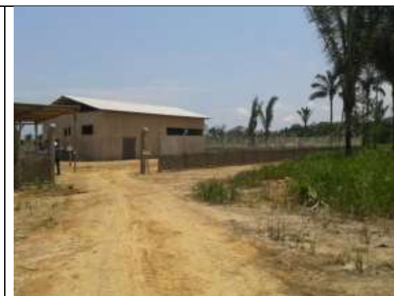
Figura 21: Vista da frente da agroindústria de Calama.

Durante a visita, realizada dia 17 de outubro de 2014, o consultor pôde contar com a presença de diretores da cooperativa em que explicaram, dentro da agroindústria, como e onde ocorrerá cada fase de processamento do coco babaçu, segundo o