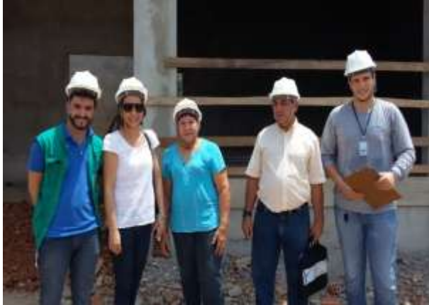
Figura 15: Visita ao canteiro de obras da Agroindústria de Cujubim Grande,