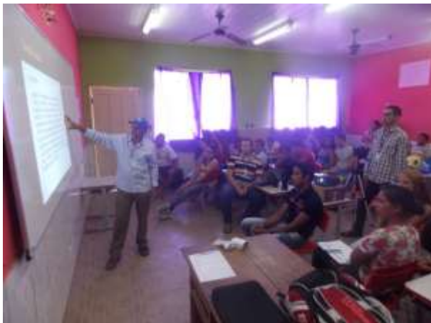
Figura 09: Reunião do Grupo Gestor da Agroindústria de Cujubim Grande.