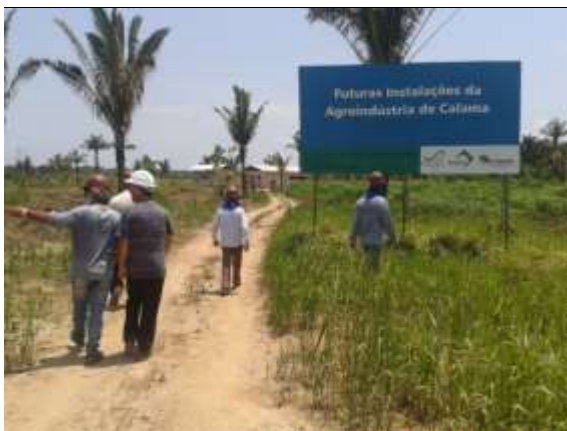
Figura 18: Acesso à agroindústria de Calama.

ocasião marca o início das ações, prevista no cronograma do PAJ, relacionadas à escolha, aquisição e instalação das máquinas e equipamentos da agroindústria. Nesse primeiro momento, a visita do consultor materializou o nivelamento de informações tanto sobre os conceitos e expectativas da cooperativa quanto à realidade local e do programa.