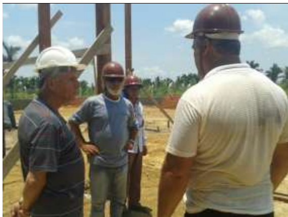
Figura 20: Representantes da cooperativa apresentando suas expectativas de produção.

planejamento conduzido. Após esse momento, os diretores receberam um feedback positivo do consultor fazendo-lhes algumas pequenas observações quanto ao processamento e expondo que, em linhas gerais, a planta industrial sempre funciona, entretanto, o maior gargalo produtivo é a gestão da agroindústria, principalmente quanto à mobilização e aquisição da matéria prima.