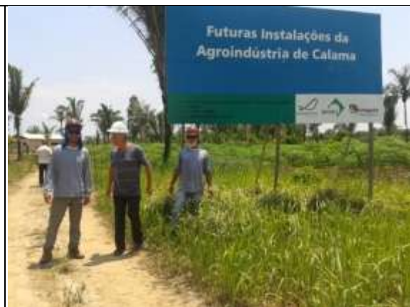
Figura 19: Consultor e representantes da cooperativa.