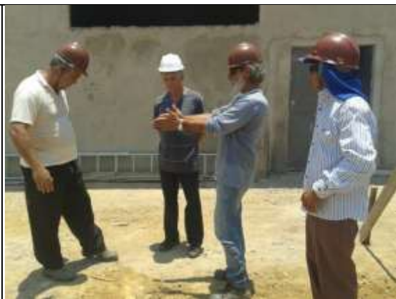
Figura 21: Representantes da cooperativa apresentando suas expectativas de produção.