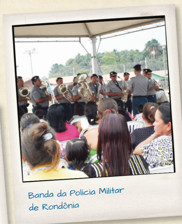
Banda da Polícia Militar de Rondônia