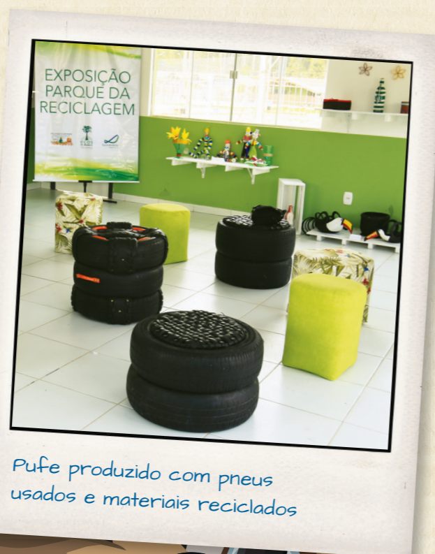
Pufe produzido com pneus usados e materiais reciclados