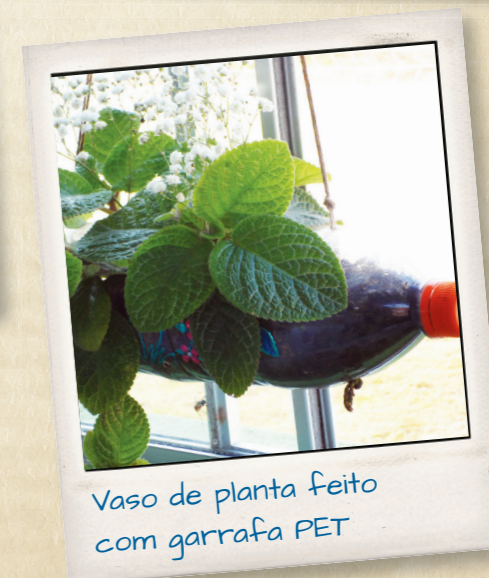
Vaso de planta feito com garrafa PET