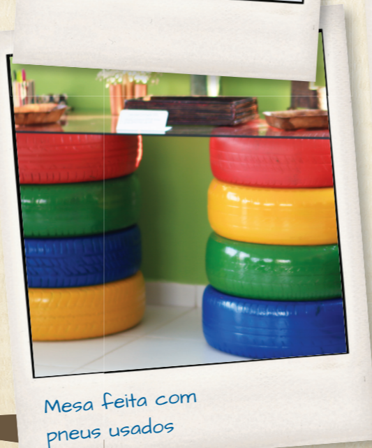
Mesa feita com pneus usados