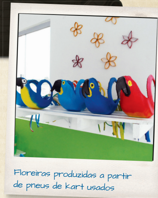
Floreiras produzidas a partir de pneus de kart usados