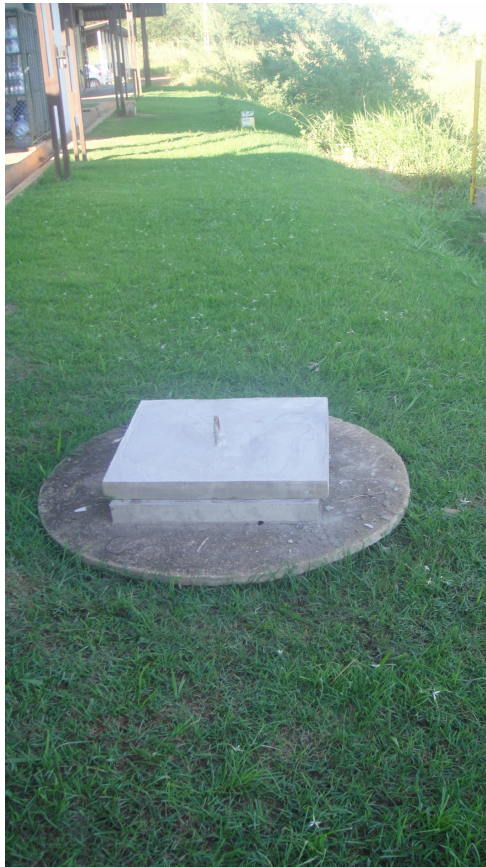
Foto 3 – Visão externa do poços da estação SANT1 após adaptação realizada.