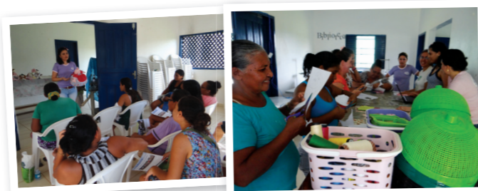
Nas aulas, as moradoras aprendem as técnicas. Na foto abaixo, elas mostram os primeiros trabalhos confeccionados.