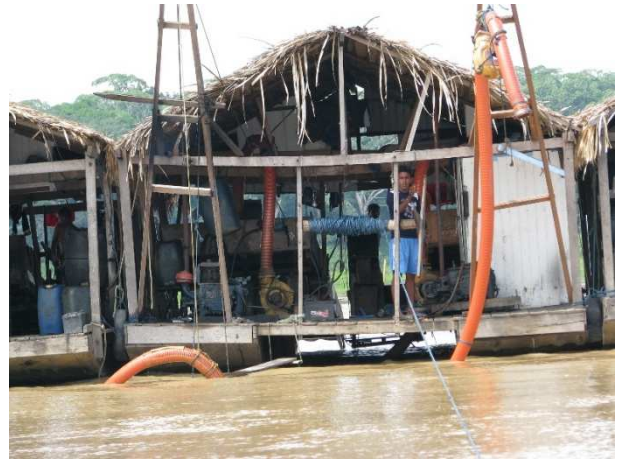
3ª Etapa – Outubro/2011