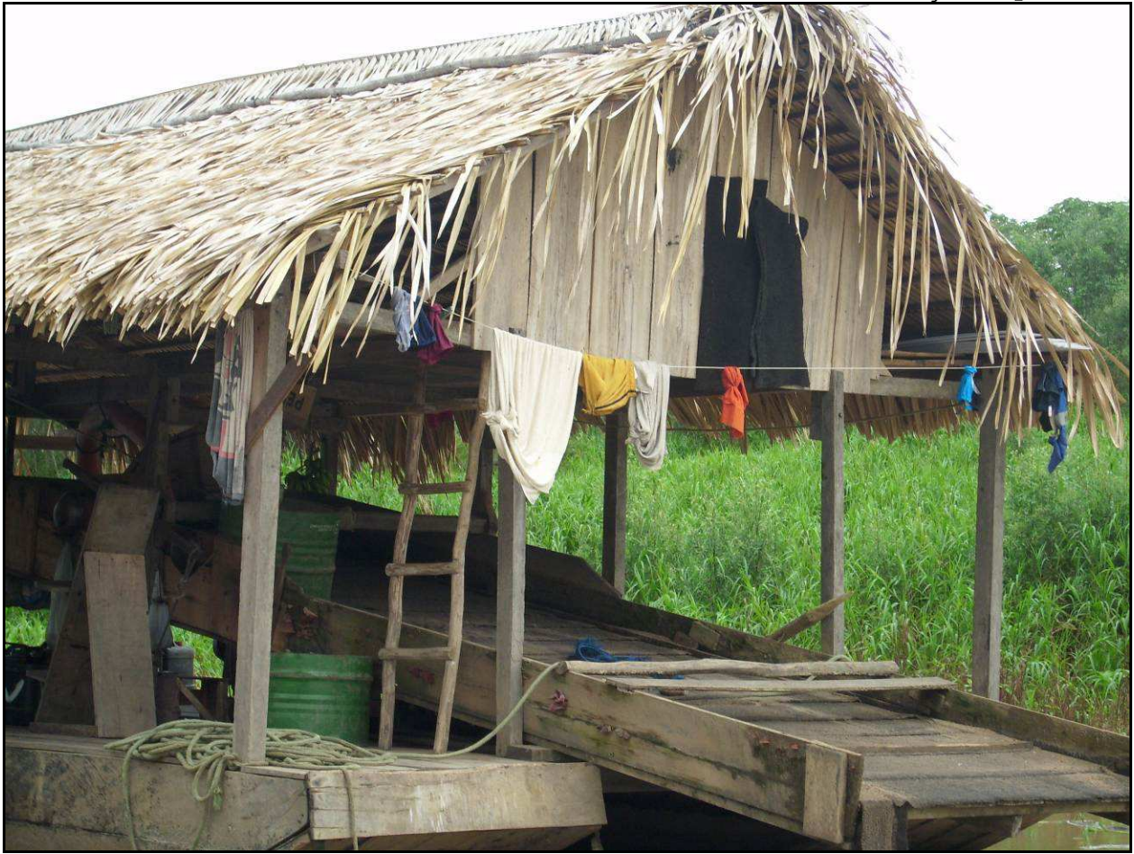
Foto da balsa cadastrada na Ficha 44