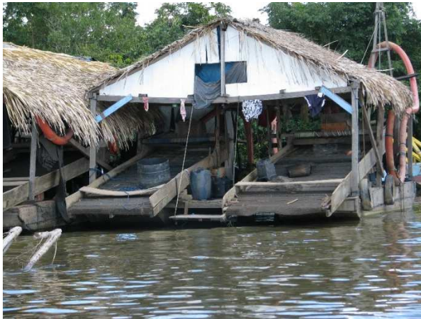
4ª Etapa – Dezembro/2011