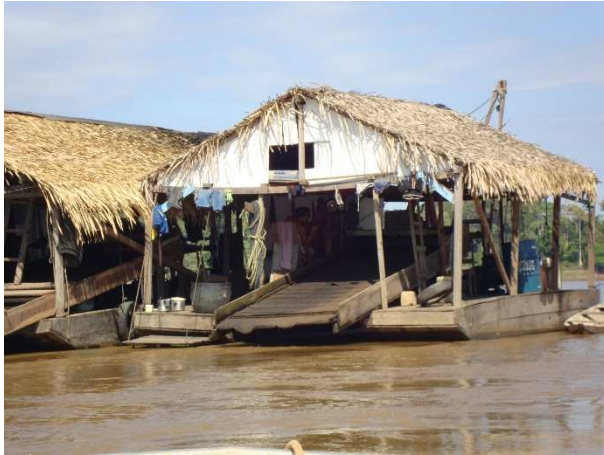
2ª Etapa – Julho/2011