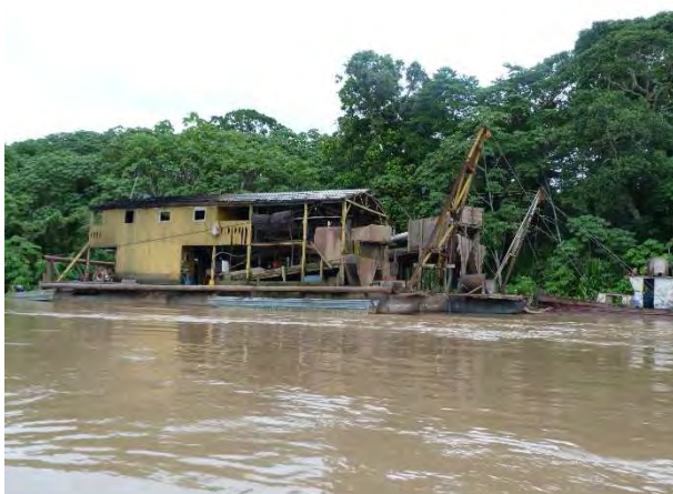
5ª Etapa – Fevereiro/2012