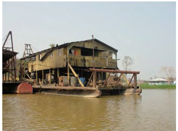
10ª Etapa – Setembro/2012