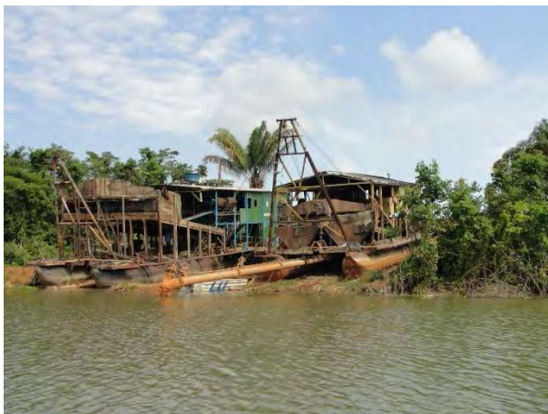
11ª Etapa – Novembro/2012