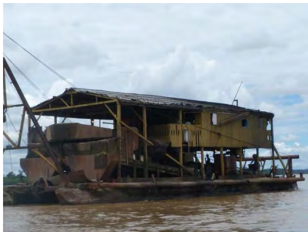
6ª Etapa – Março/2012