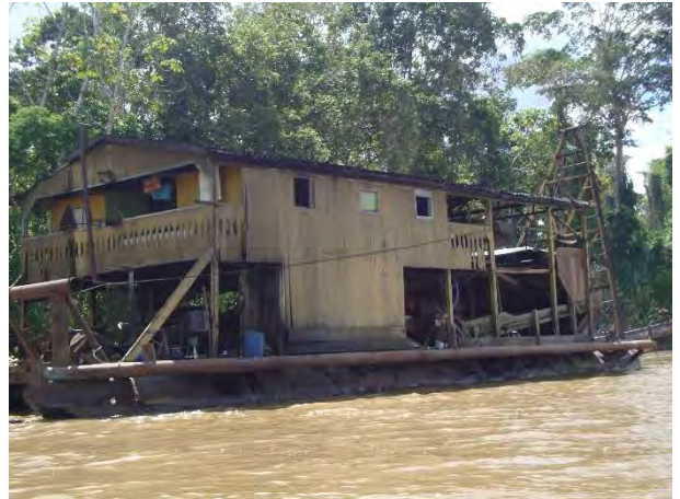
8ª Etapa – Junho/2012