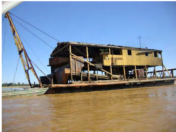
2ª Etapa – Julho/2011