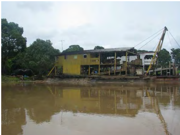
1ª Etapa – Março/2011