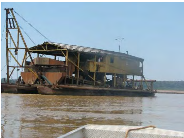
3ª Etapa – Outubro/2011