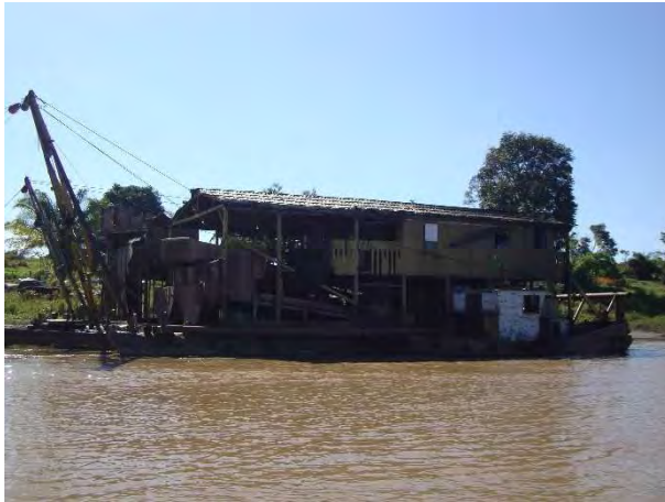
7ª Etapa – Maio/2012