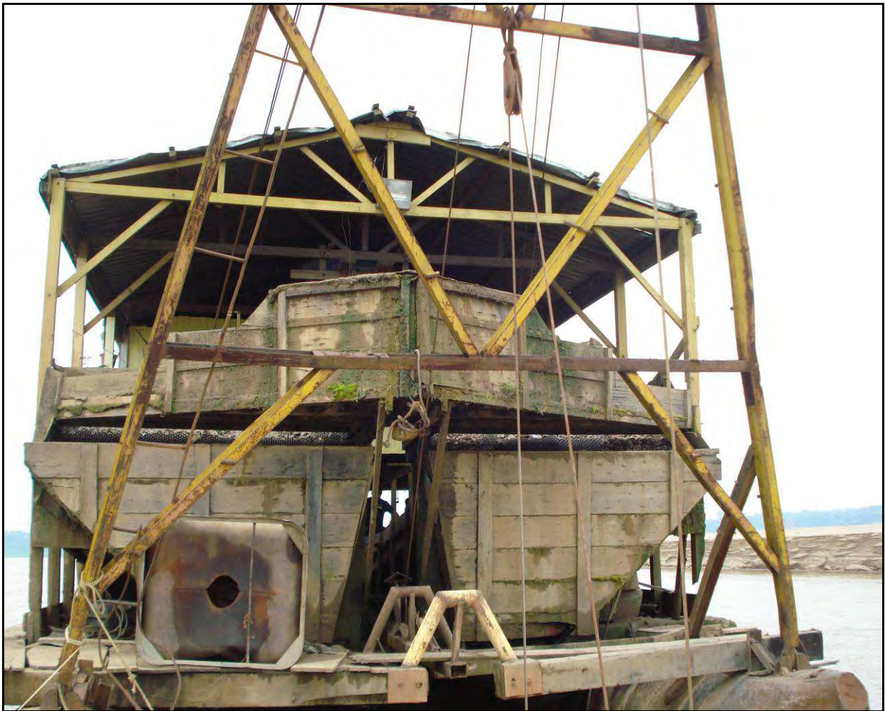
Foto da draga cadastrada na Ficha 80