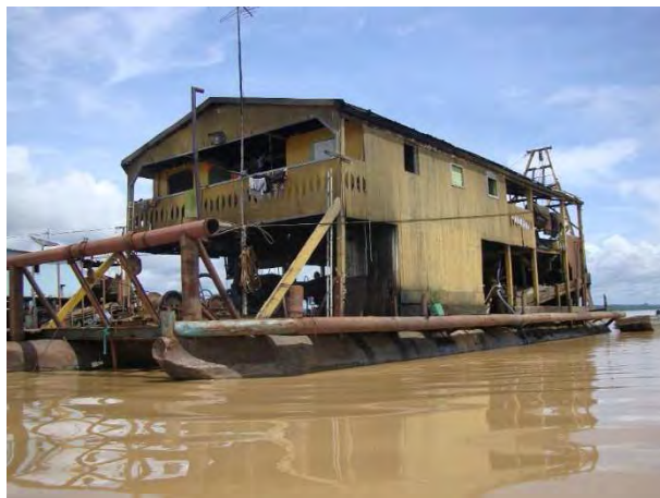
4ª Etapa – Dezembro/2011