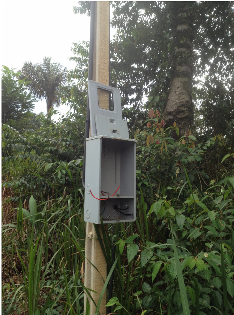
Foto 1 – Problema de vandalismo na rede elétrica ocorrido na estação SANT2.

A utilização dos registros da estação sismológica de Samuel como padrão para os registros da rede sismográfica que monitora a UHE Santo Antônio foi prática escolhida por termos, nesta estação, registros gerados no formato empregado em troca de dados sismológicos a nível internacional. Os registros das duas estações da UHE Santo Antônio são gerados a nível ainda mais detalhado de amostragem do sinal, porém em um formato de dados diferente. O acompanhamento dos eventos é normalmente feito com os registros das três estações.