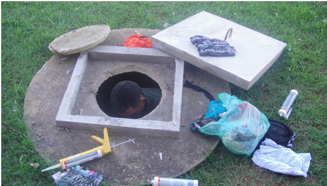
Foto 2 – Trabalho de secagem do poço anteriormente alagado da estação SANT1.

Procederemos agora à drenagem do poço que abriga o sensor, que será eventualmente instalado, com nova proteção, que evite futuros alagamentos, que ocorrem através de frestas no acoplamento da tampa do poço à moldura da mesma. Os reparos necessários na tampa do poço foram realizados em Julho de 2013, conforme mostrado nas fotos abaixo: