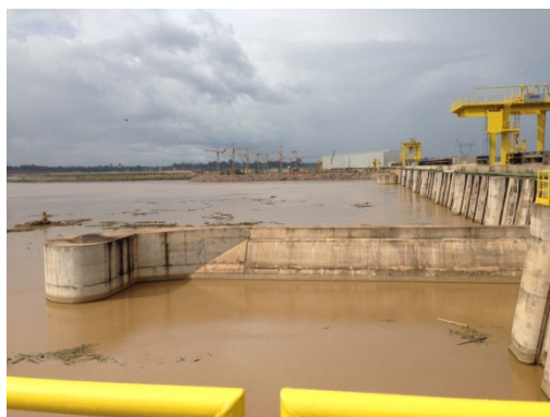
FOTO 04: Vista do ponto do local onde está o ponto de captação da CAERD na barragem da UHE Santo Antônio. Foto SAE 05/02/2014.

STATUS ATUAL: O atendimento dessa condicionante será verificado junto a análise do Relatório do Programa, conforme Parecer Técnico 19/2012/COHID/CGENE/ DILIC/IBAMA, encaminhado por meio do Ofício 162/2012/CGENE/ DILIC/IBAMA. A SAE entende que esta exigência está em atendimento e aguarda manifestação do IBAMA.