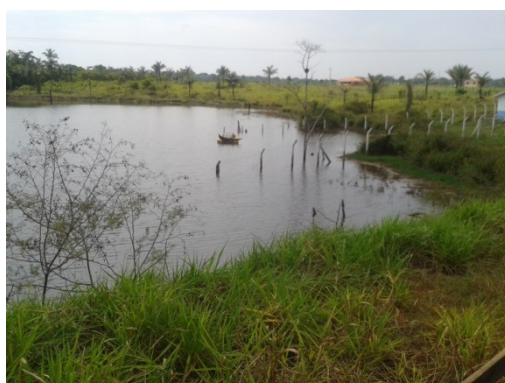
FOTO 03: Vista da captação da ETA do Riacho Azul.