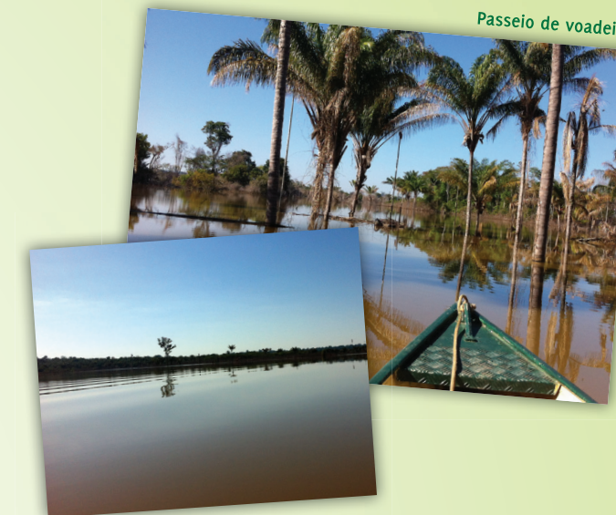
Passeio de voadeira

Com saída a partir da praia, há o passeio de voadeira — embarcação típica da região — guiada pelos barqueiros da comunidade.