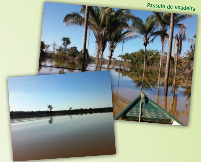
Passeio de voadeira

Com saída a partir da praia, há o passeio de voadeira – embarcação típica da região – guiada pelos barqueiros da comunidade.