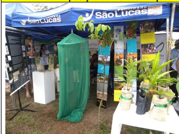
Foto 01 – 22/09/2012- Exposição de Material arqueológico embaixo da tenda dividida entre os Programas de Educação Patrimonial, da Scientia Consultoria e Flora, da SAESA.