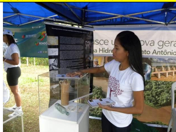
Foto 02 –22/09/2012- Organização da exposição de material arqueológico.