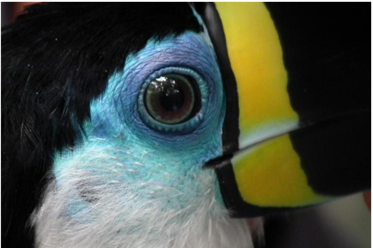
Foto 52. Ramphastos vitellinus . Morrinhos, 27/02/2011.