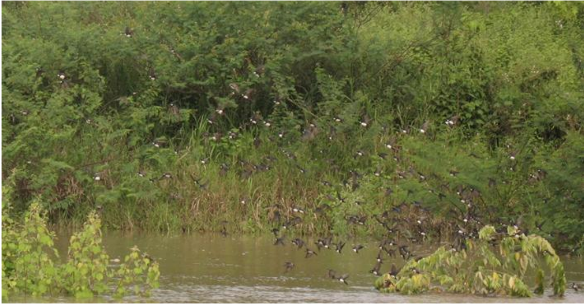
Foto 79. Pygochelidon melanoleuca . Rio Madeira, 14/02/2011.