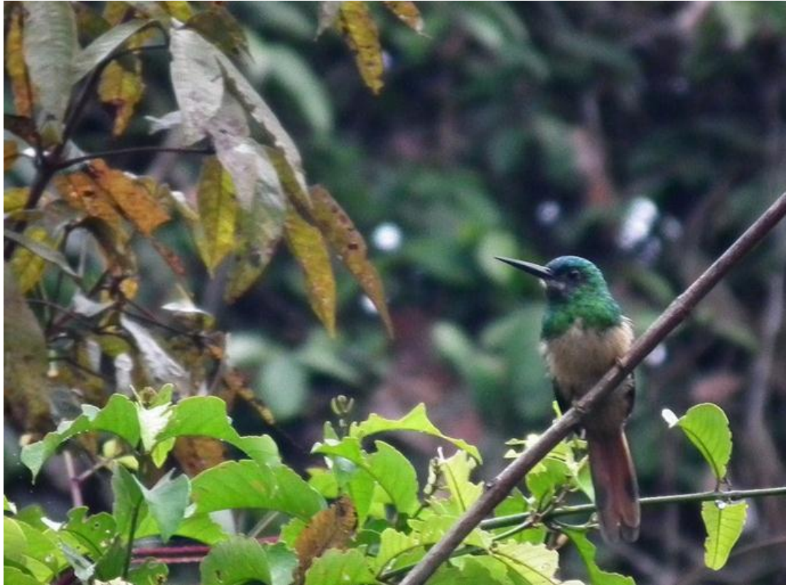
Figura 47. Galbula cyanescens . 20/02/2011.