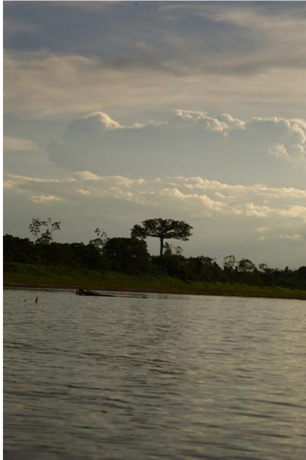
Foto 3. Árvore emergente no entardecer do Rio Madeira, 19/11/2011.