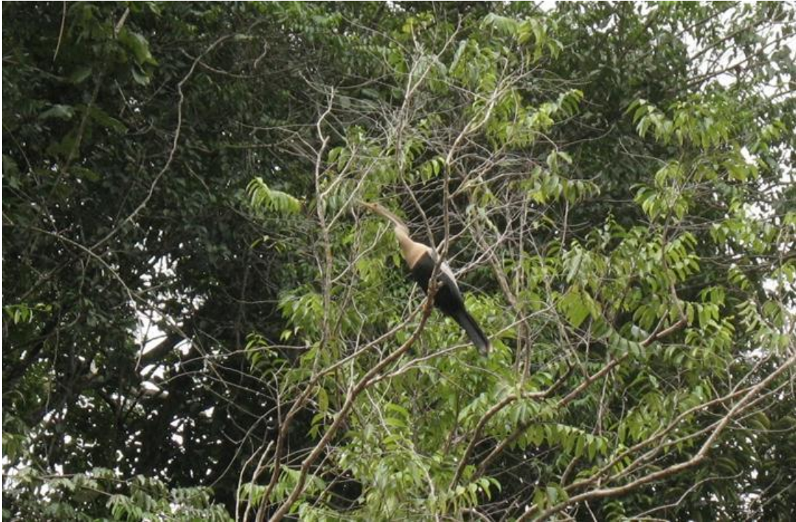
Figura 18. Aninga aninga . 27/02/2011.