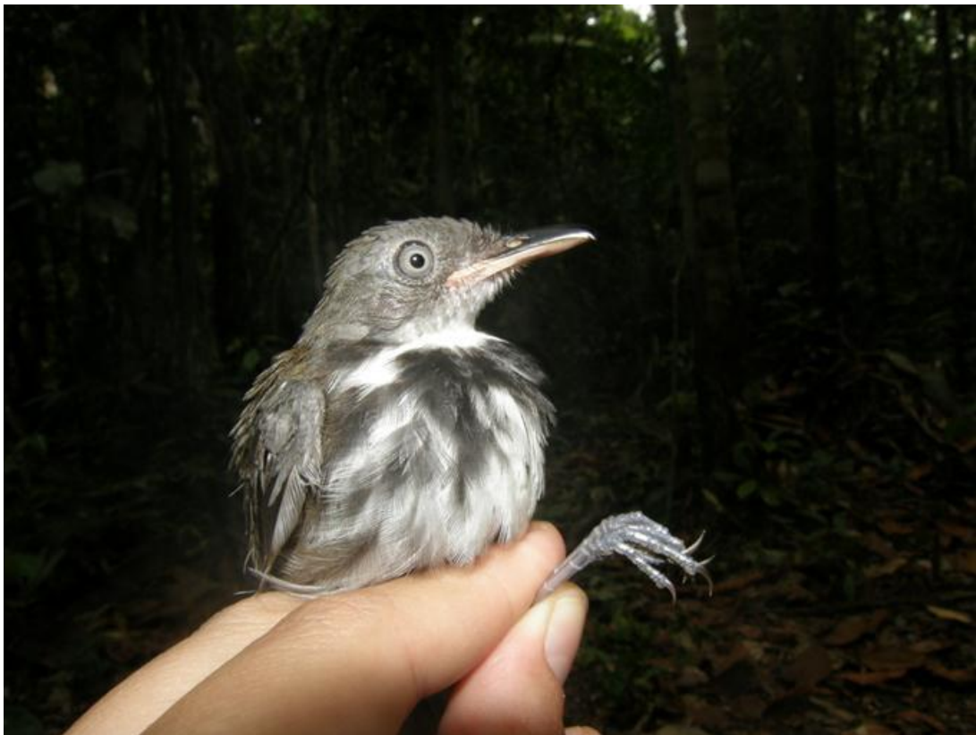
Figura 74. Corythopsis torquata . Ilha do Bufalo, 19/10/2010.