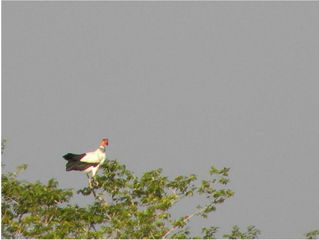
Foto 24. Sacoramphus papa. 03/12/2010.