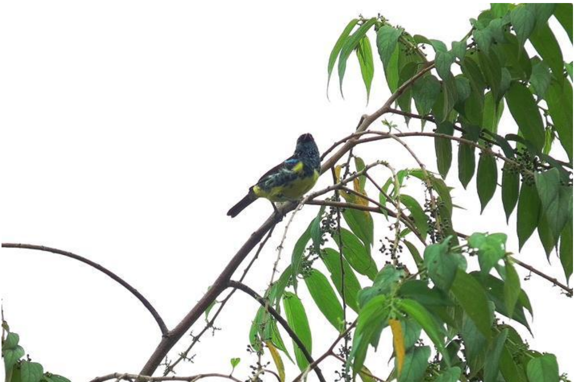
Foto 82. Tangara mexicana. 26/02/2011.