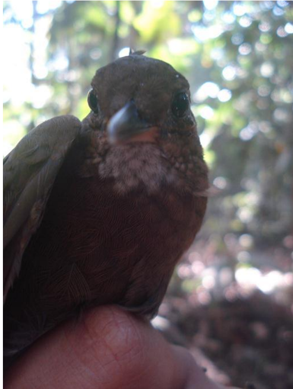
Foto 63. Sclerurus caudacutus . Jirau, margem esquerda do Rio Madeira, 02/08/2010.