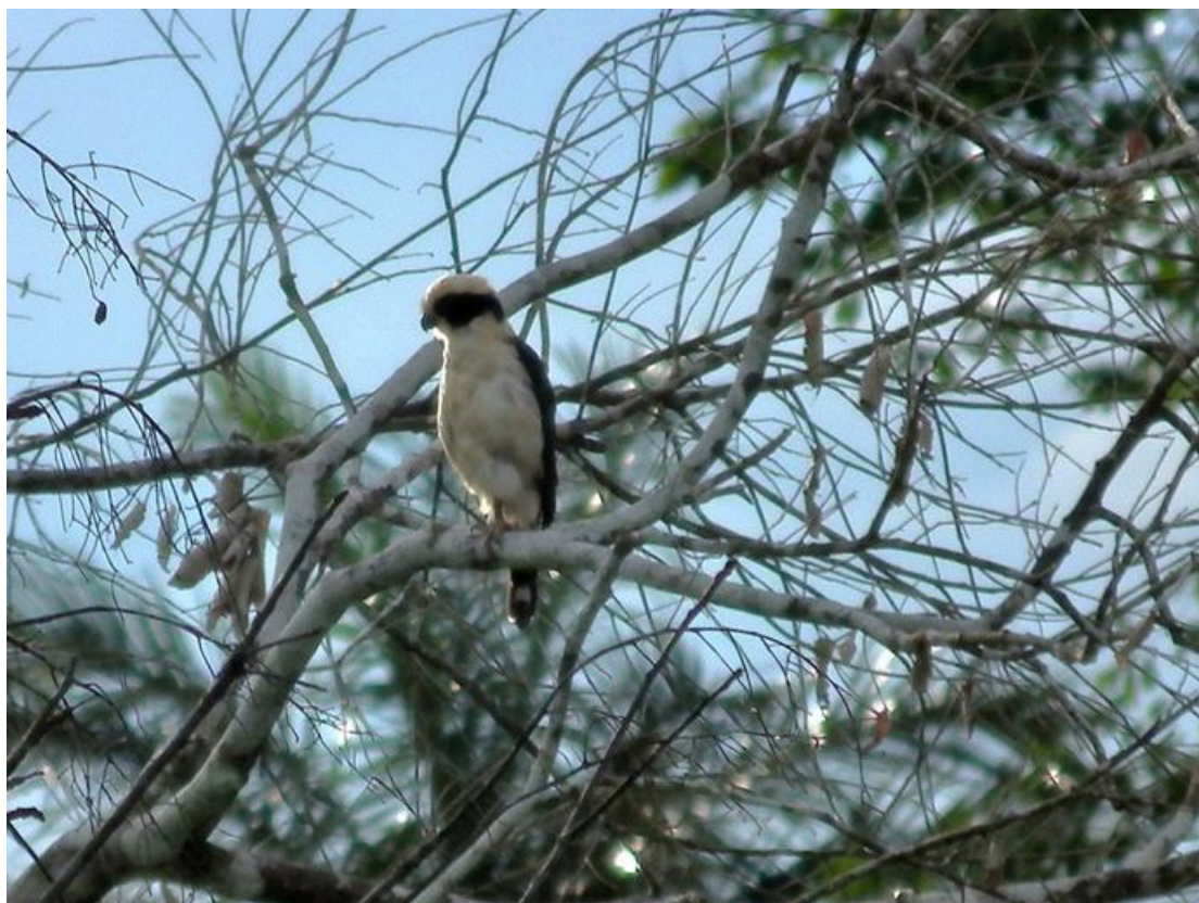
Figura 26. Herpetotheres cachinnans . 16/02/2011.