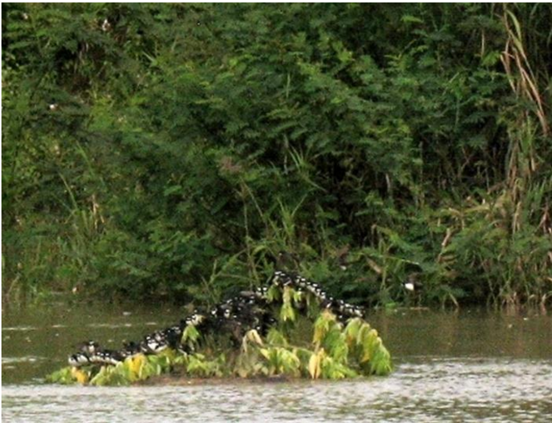
Foto 78. Pygochelidon melanoleuca . Rio Madeira, 14/02/2011.