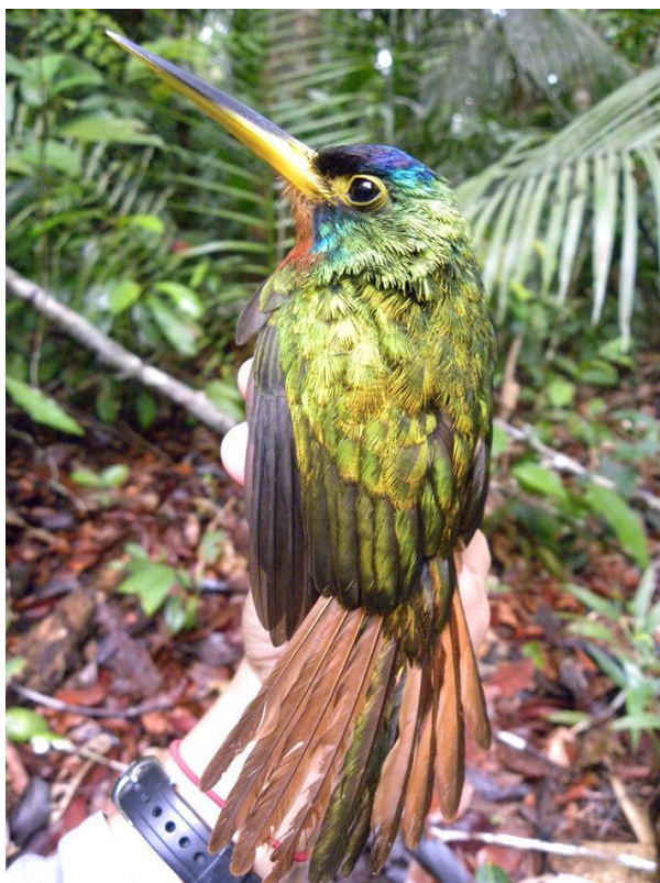
Figura 45. Galbula cyanicollis . Jirau, margem direita do Rio Madeira, 04/12/2010.