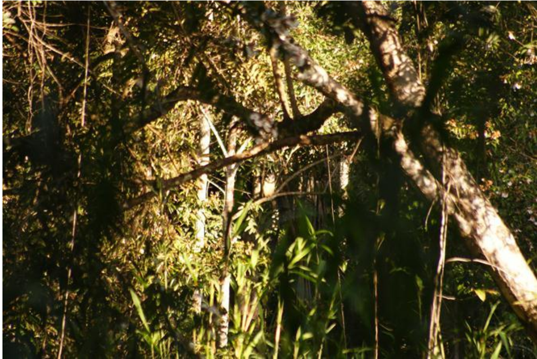
Foto 37. Pulsatrix perspicillata . Teotonio, 08/12/2010.