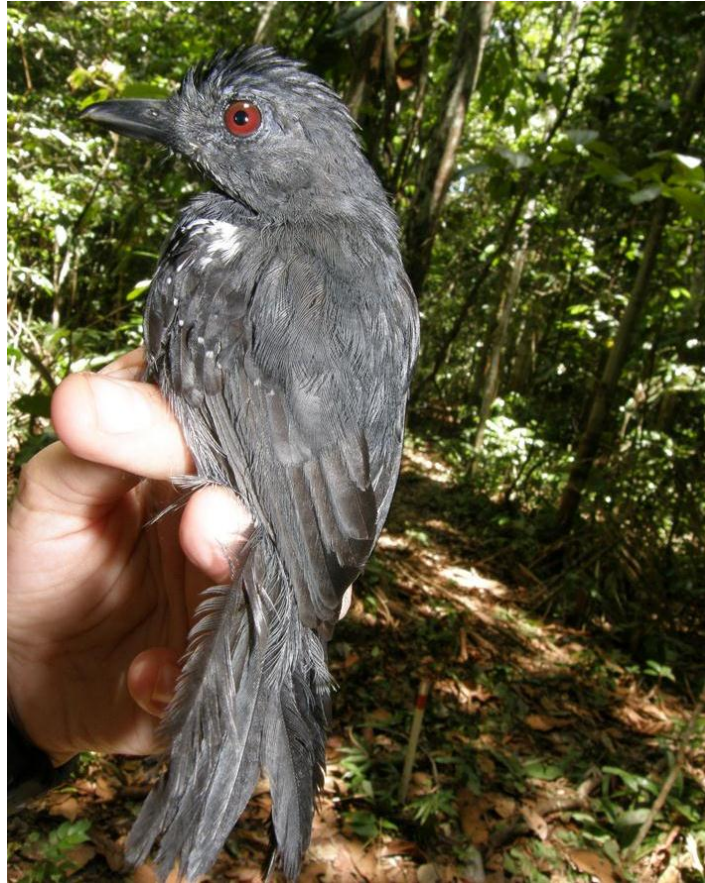
Foto 57. Thamnophilus aethiops (macho). Ilha do Bufalo, 20/11/2010.