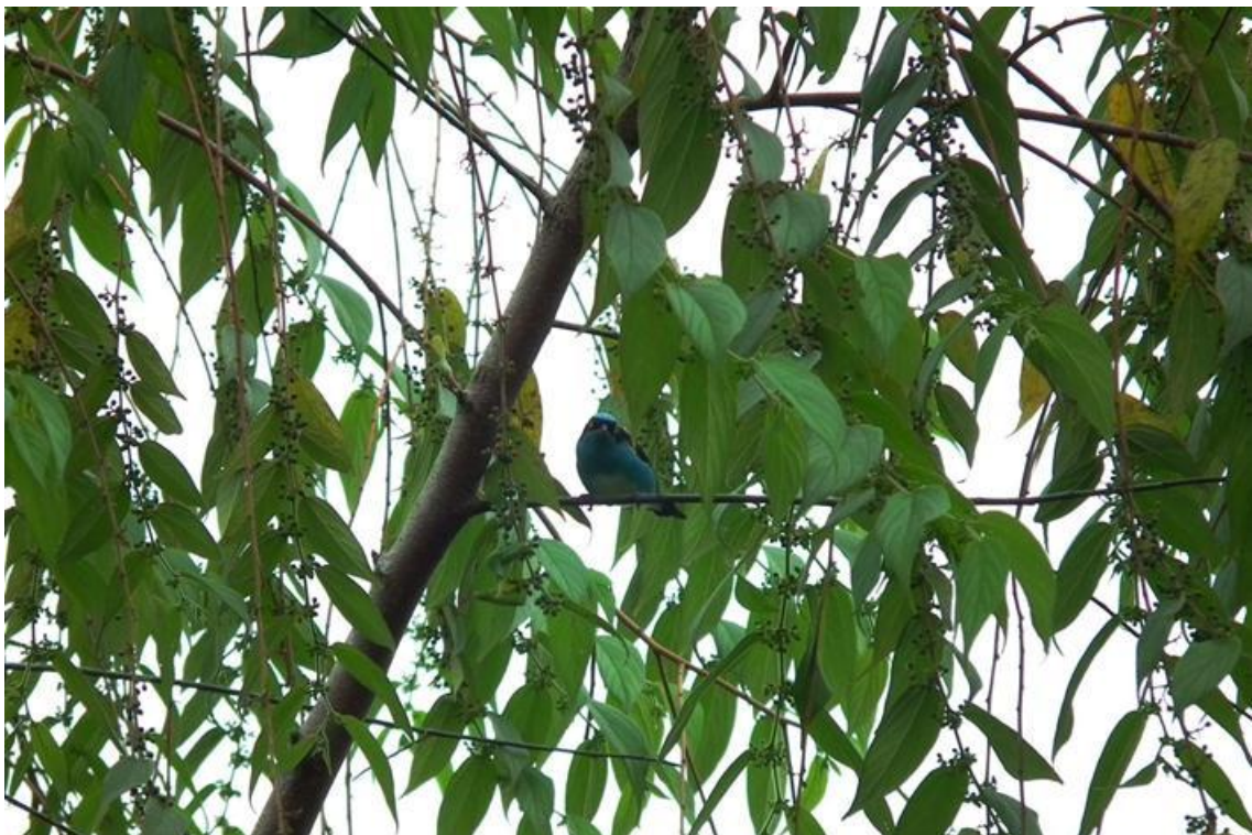
Figura 84. Dacnis lineata . Rio Jaci, 26/02/2011.