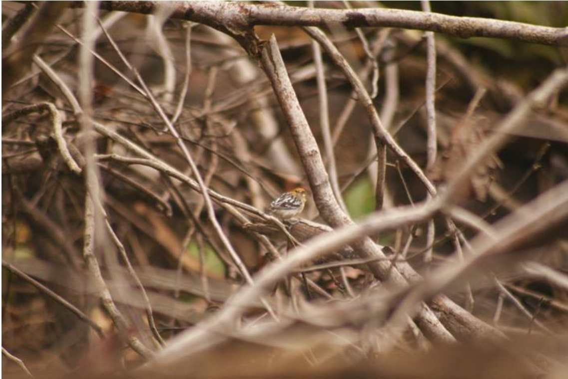
Foto 55. Myrmotherula multostriata . Rio Branco, 13/12/2010.