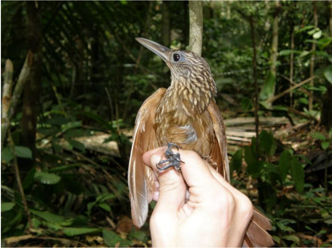
Figura 65. Xyphorhynchus guttatus . Ilha das Pedras, 23/11/2010.