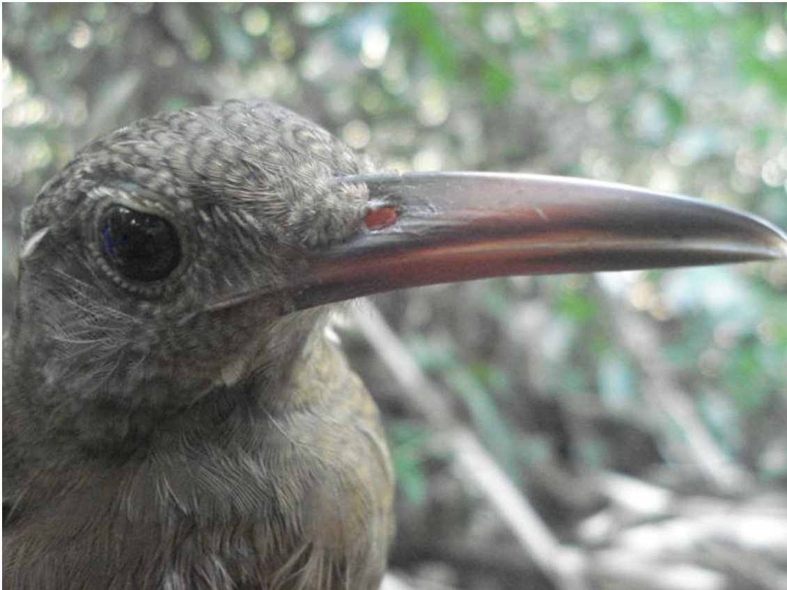
Figura 66. Dendrocolaptes certhia . Tres Praias, 07/08/2010.