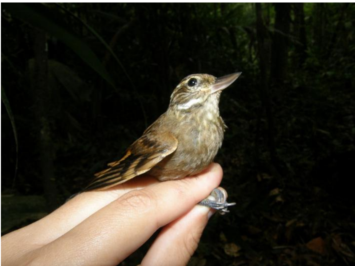
Figura 68. Xenops minutus . Morrinhos, 28/11/2010.