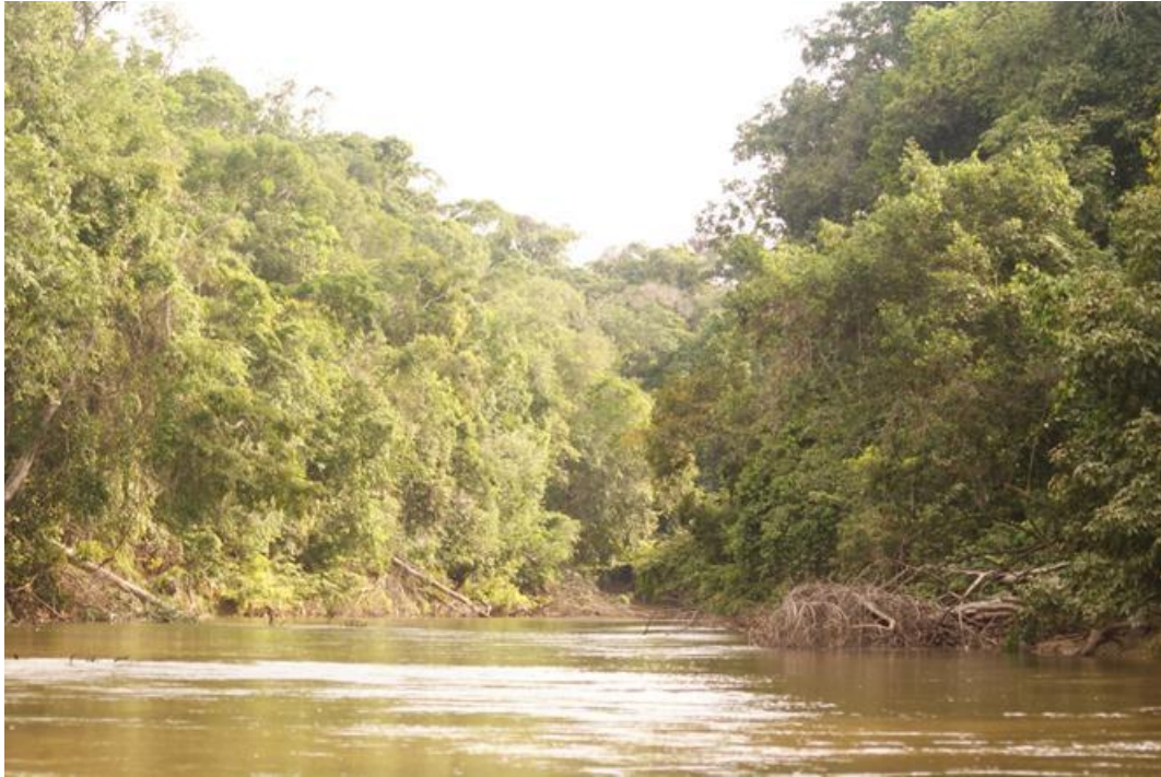
Figura 16. Rio Branco, 13/12/2010.