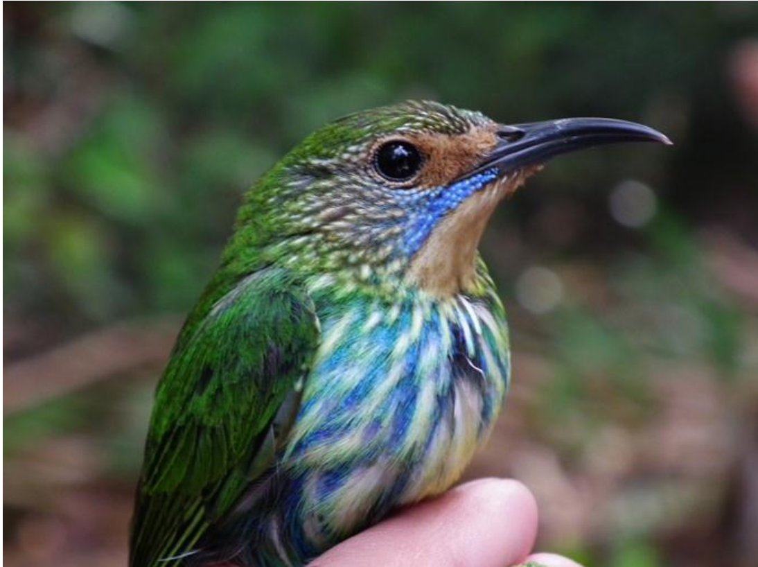
Figura 85. Cyanerpes caeruleus . Jirau, margem direita do Rio Madeira, 15/02/2011.