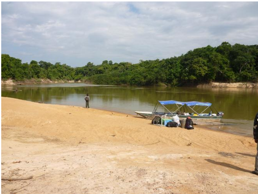
Figura 17. Transporte de equipamento e equipe para os acampamentos. Julho de 2010.