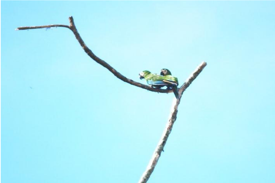
Figura 32. Orthopsittaca manilata . 25/02/2011.