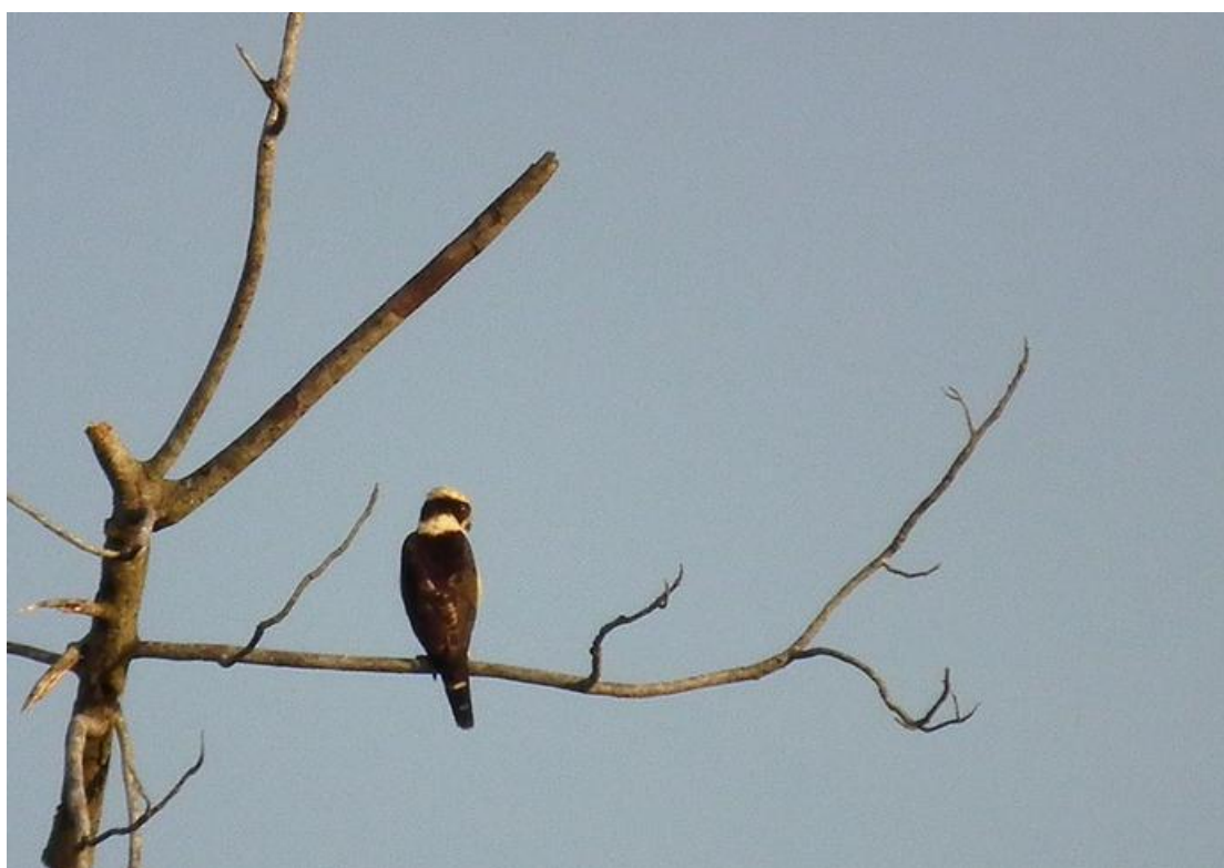
Figura 27. Herpetotheres cachinnans . 16/02/2011.