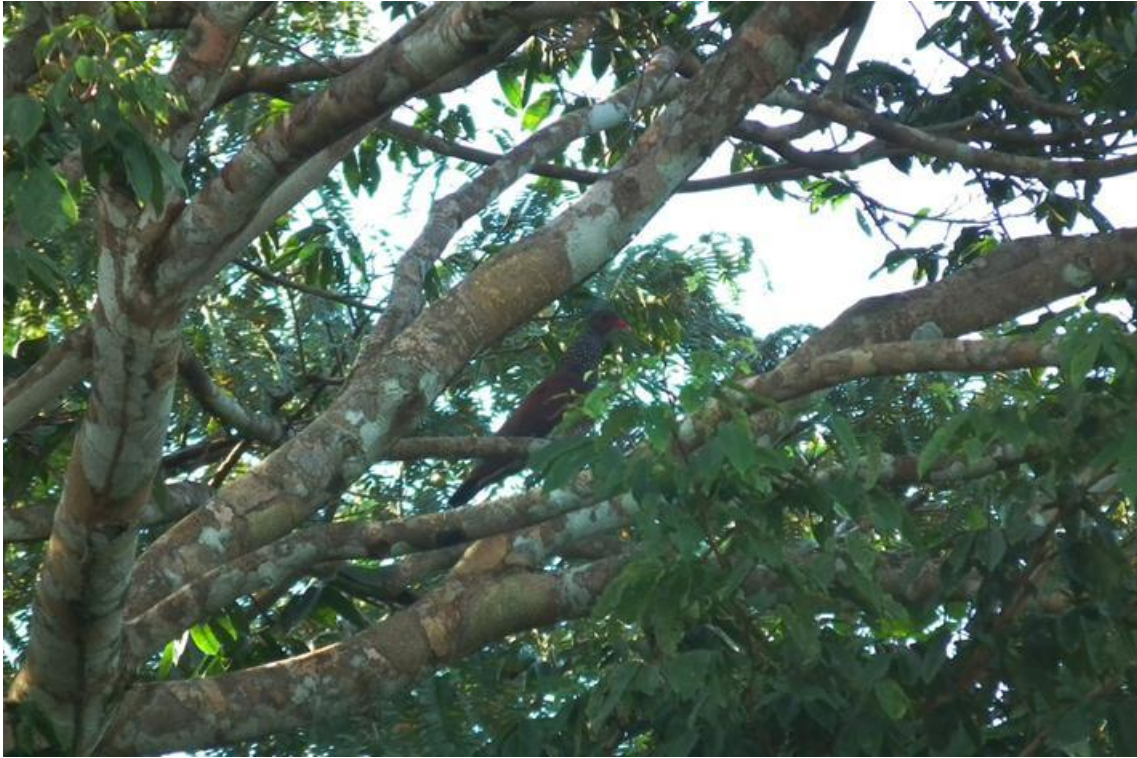
Figura 30. Patagioenas speciosa . Rio Jaci, 28/02/2011.