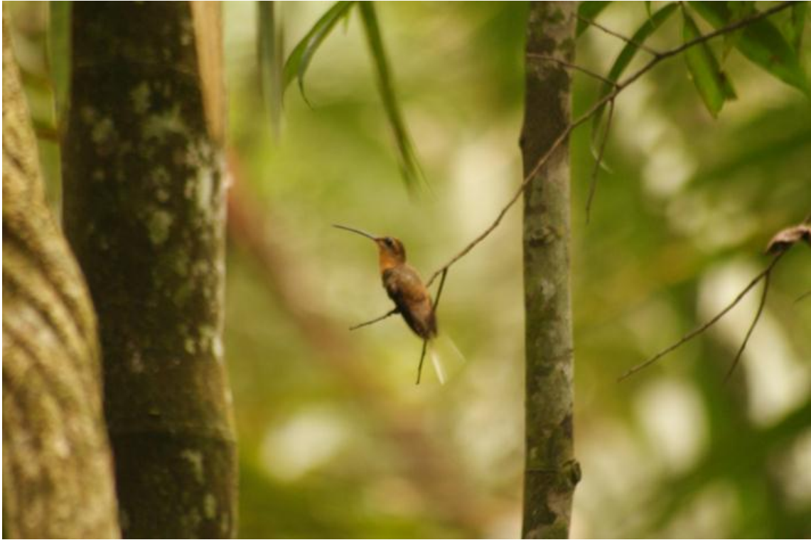
Figura 39. Phaetornis ruber . Ilha do Bufalo, 20/11/2010.