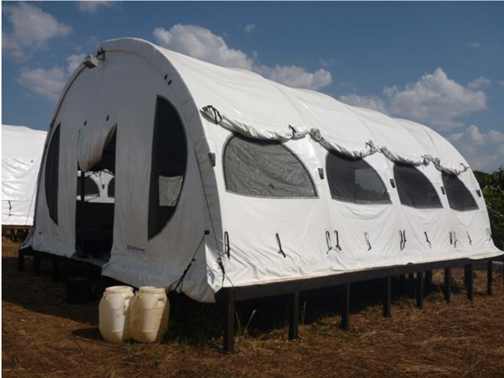
Foto 1. Acampamento no Módulo Teotônio, julho de 2010.

Anexo 6 – Registros fotográficos realizados durante o monitoramento de Aves da fase pré-enchimento do reservatório da UHE Santo Antônio, Rio Madeira, Estado de Rondônia.