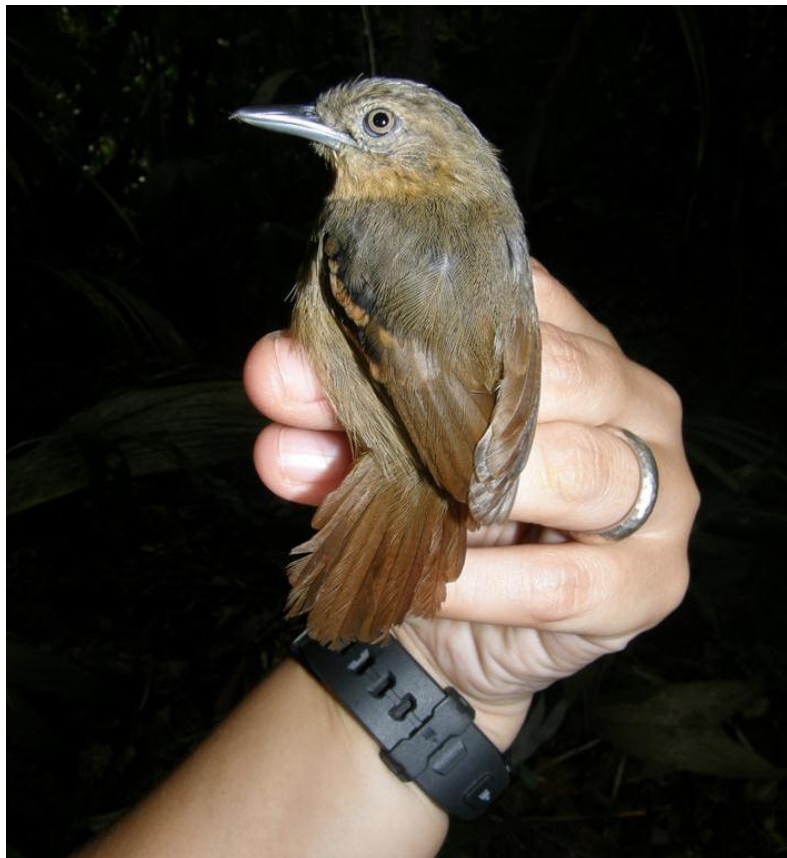
Foto 54. Epinecrophylla leucophthalma . Morrinhos, 28/11/2010.