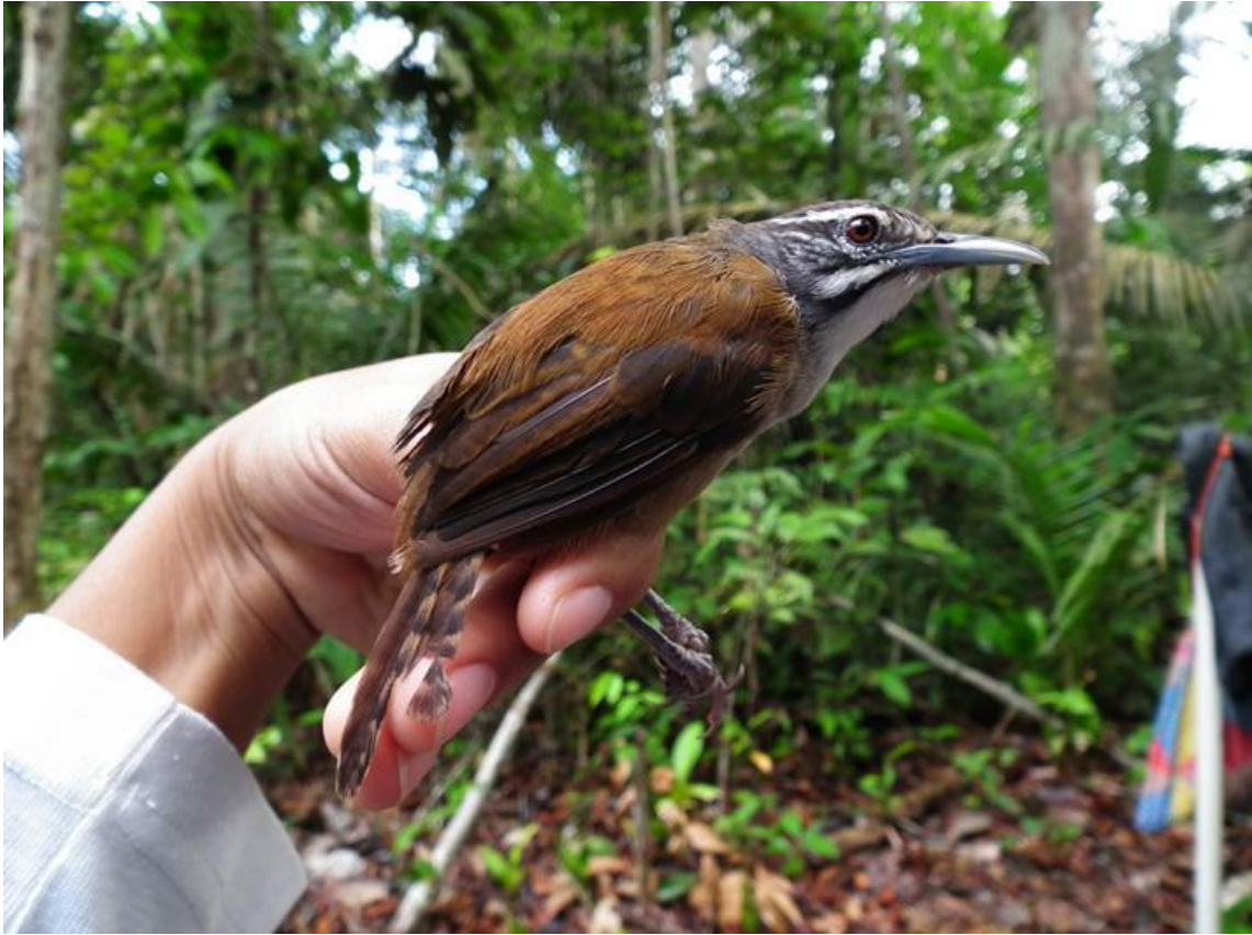
Figura 81. Pheugopedius genibarbis . Jirau, margem direita do Rio Madeira, 15/02/2011.