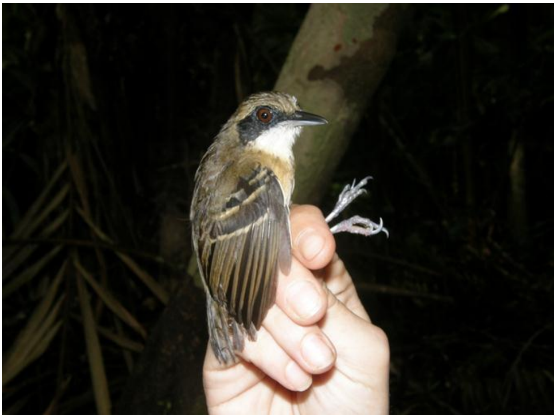
Figura 58. Myrmoborus myotherinus . Ilha das Pedras, 23/11/2010.