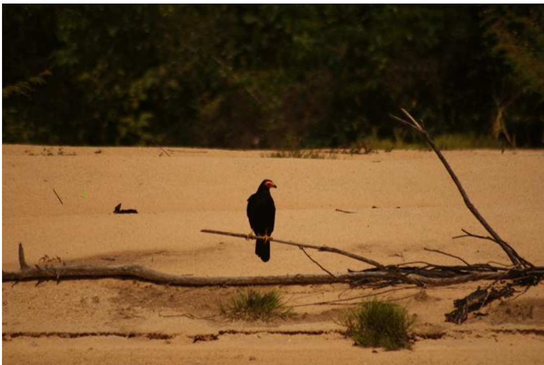
Figura 25. Daptrius ater . Rio Jaci, 12/12/2010.