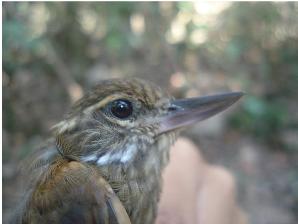
Figura 64. Glyphorynchus spirurus . Jirau, margem direita do Rio Madeira, 03/08/2010.