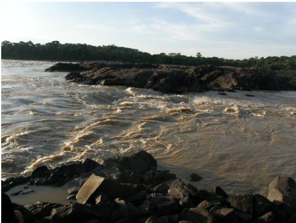
Foto 8. Corredeiras na região de Jirau, Rio Madeira, 03/12/2010.