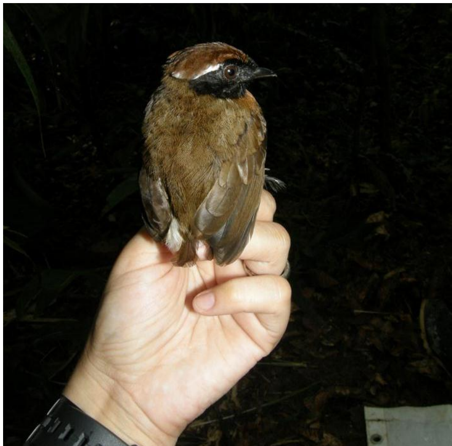
Figura 62. Conopophaga aurita . Morrinhos, 28/10/2010.