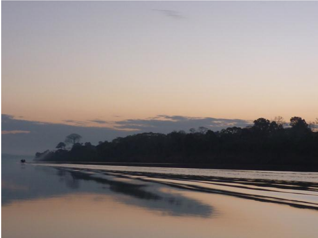
Foto 12. Amanhecer no Rio Madeira, julho de 2010.