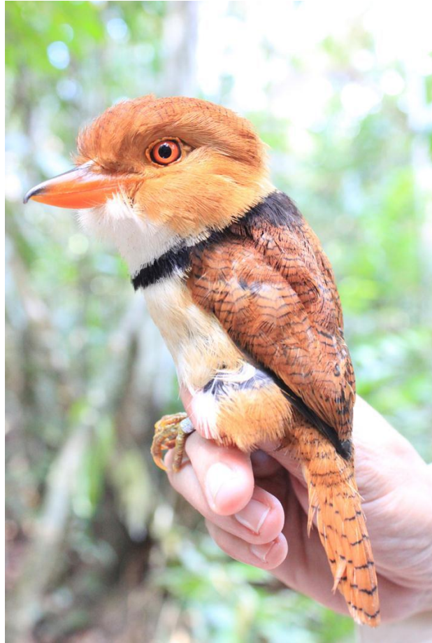
Figura 49. Bucco capensis . Julho de 2010.