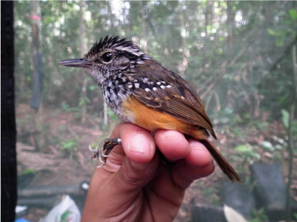
Figura 59. Hypocnemis peruviana . Jirau, margem esquerda do Rio Madeira, 10/02/2011.