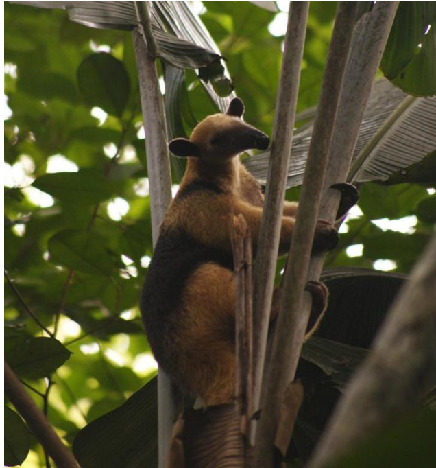
Figura 87. Tamandua mirim. Ilha do Bufalo 19/11/2010.