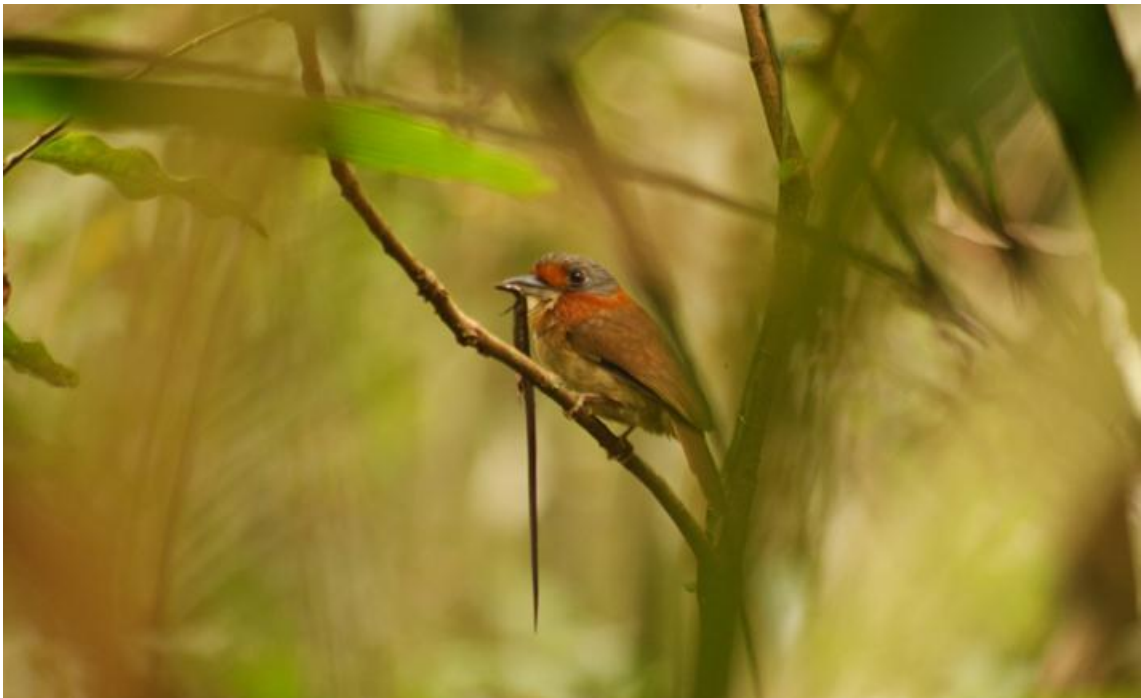
Figura 50. Malacoptila rufa . Ilha das Pedras 22/11/2010.