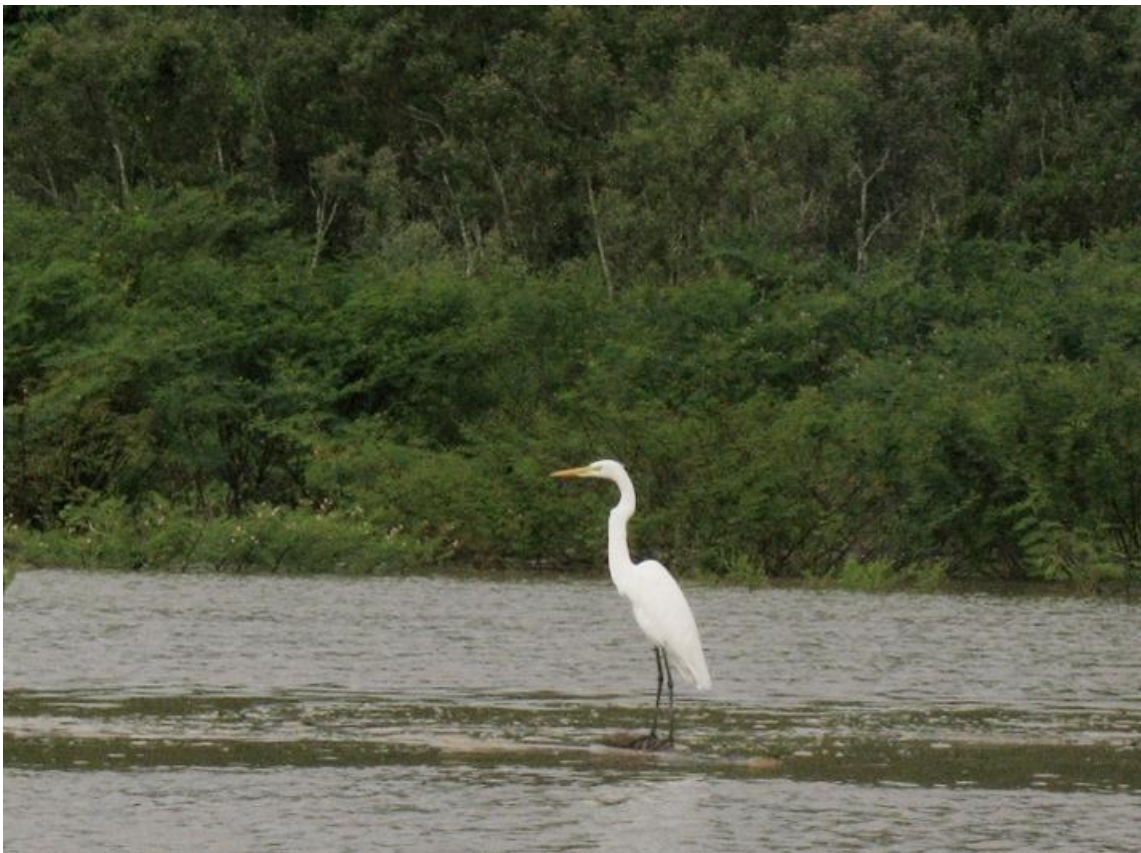
Figura 21. Ardea alba . Rio Madeira, 14/02/2011.