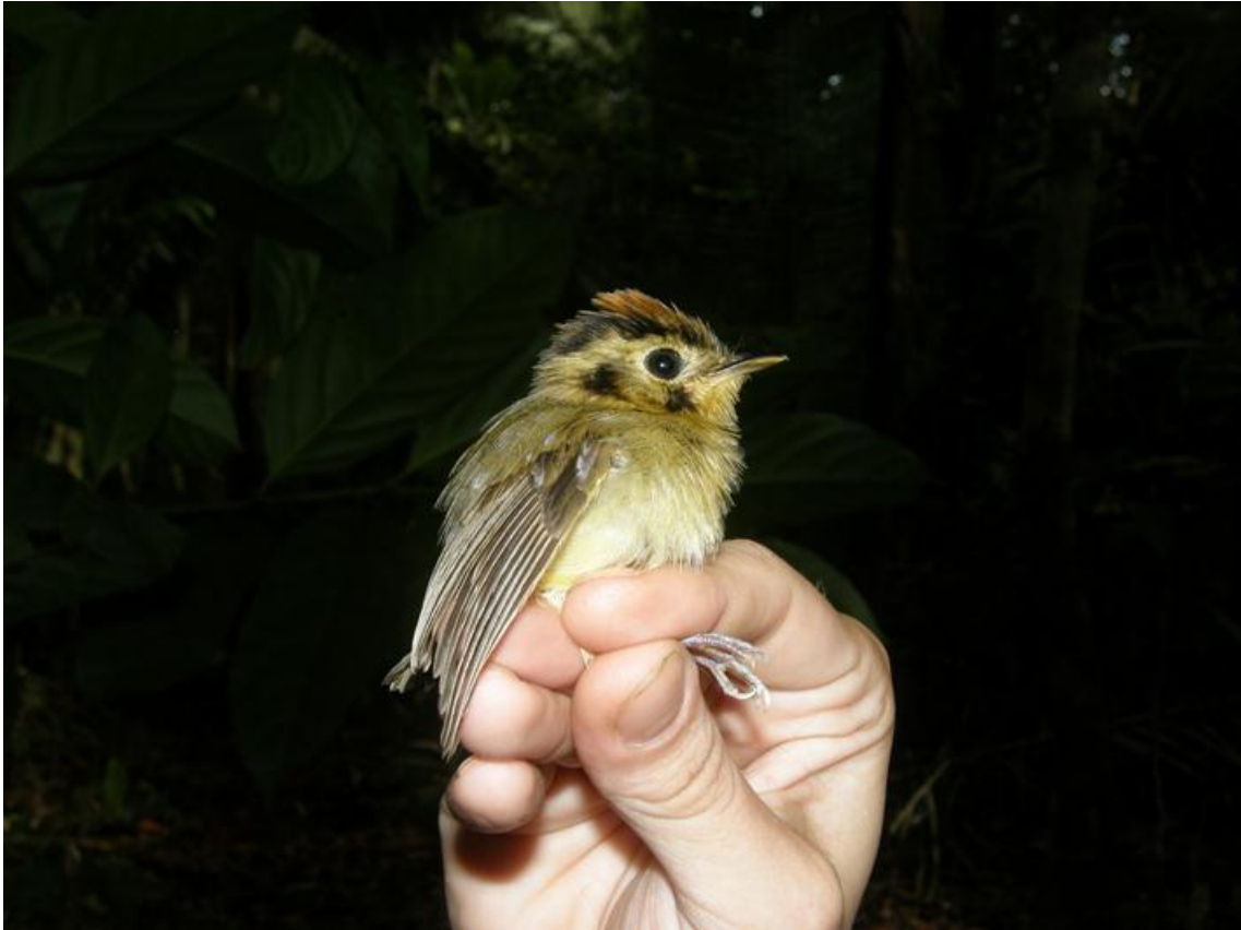
Foto 73. Platyrinchus coronatus . Ilha das Pedras 22/11/2010.