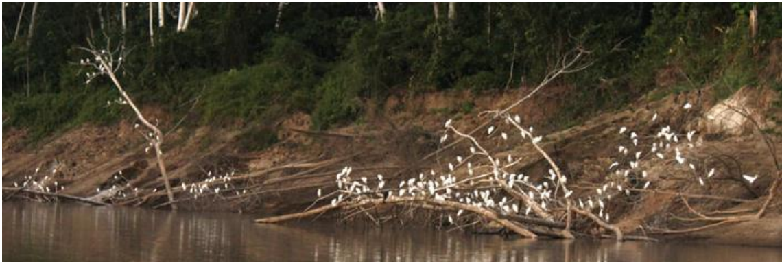
Figura 23. Dormitório. 22/07/2010.