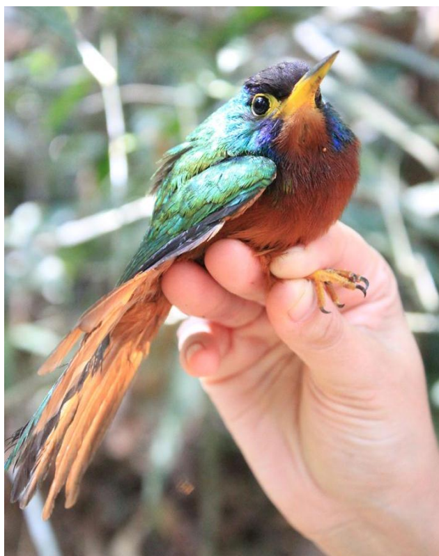
Figura 46. Galbula cyanicollis . Julho de 2010.