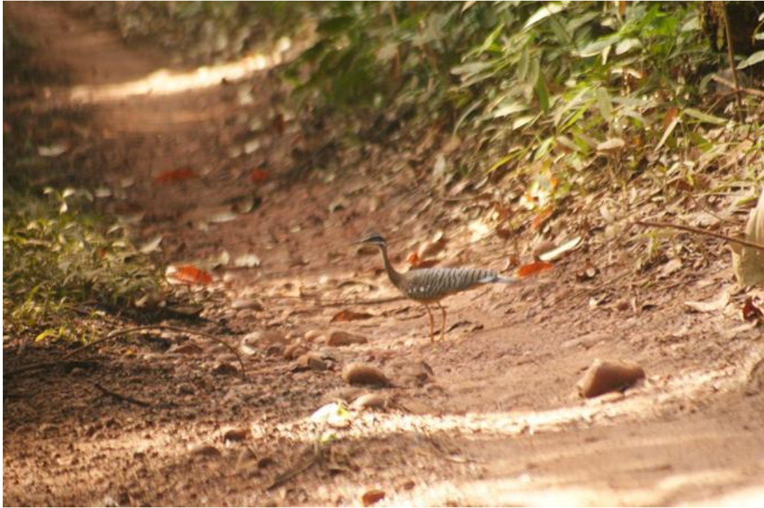
Figura 28. Eurypyga helia . 06/12/2010.