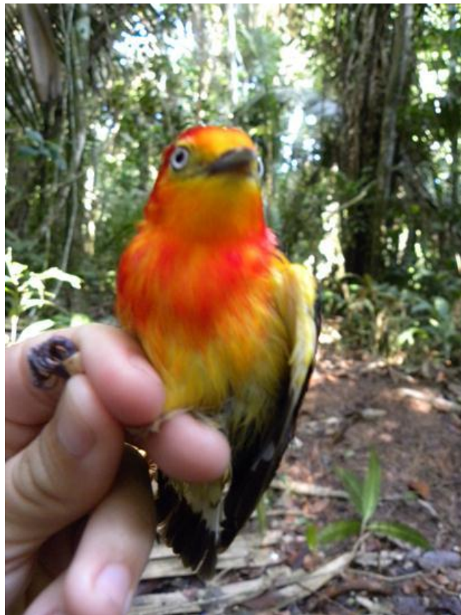
Figura 70. Pipra fasciicauda . Jirau, margem esquerda do Rio Madeira, 05/12/2010.