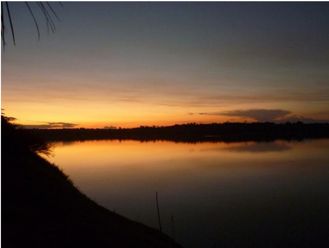
Foto 11. Entardecer no Rio Madeira, julho de 2010.