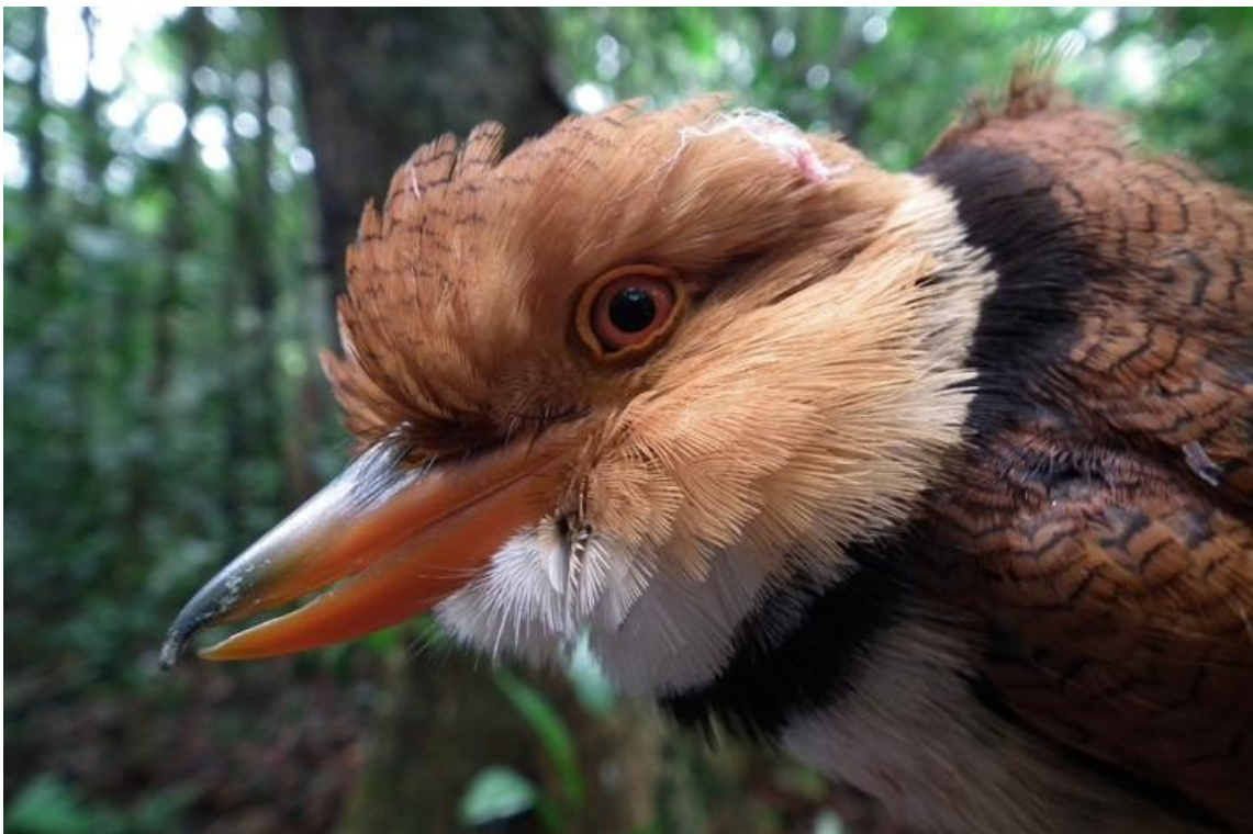
Figura 48. Bucco capensis . Morrinhos, 27/02/2011.