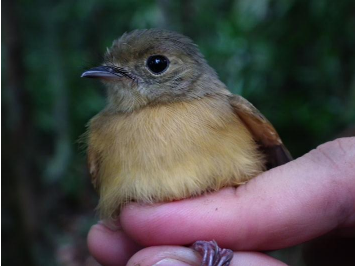
Foto 71. Terenotriccus erythrurus . Teotonio, 17/02/2011.