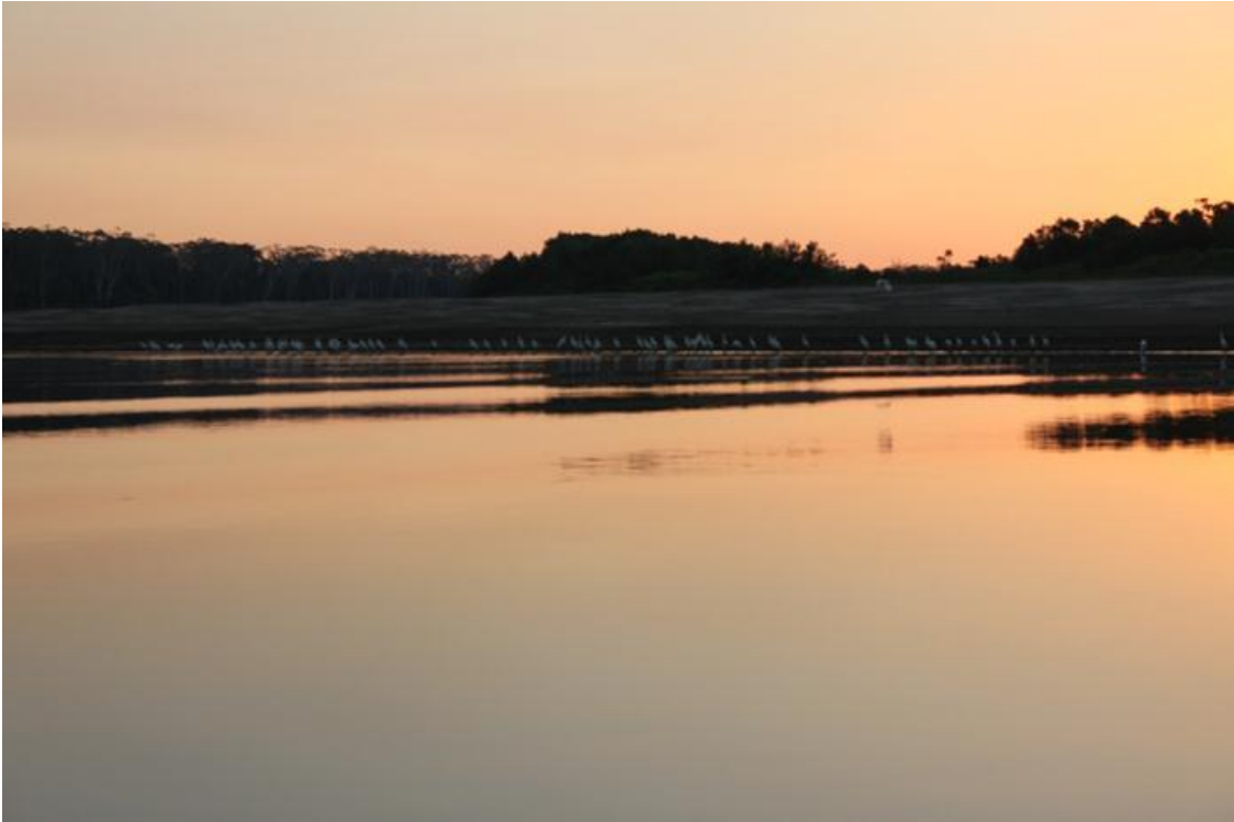
Foto 10. Entardecer no Rio Madeira, com Ardea alba e Egretta thula , julho de 2010.