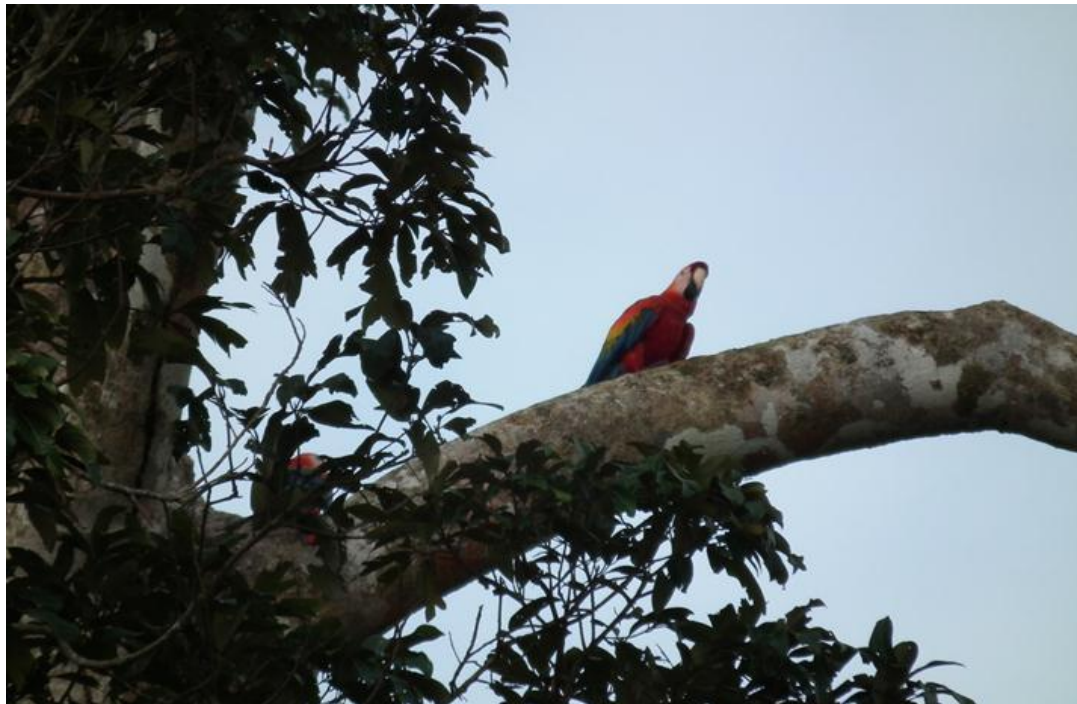
Figura 31. Ara macao . Rio Jaci, 25/02/2011.