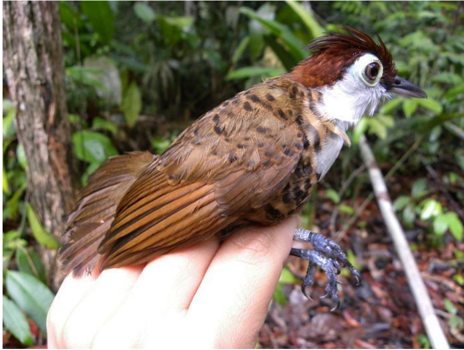
Foto 61. Rhegmatorhina hoffmannsi . Jirau, margem direita do Rio Madeira, 4/12/2010.