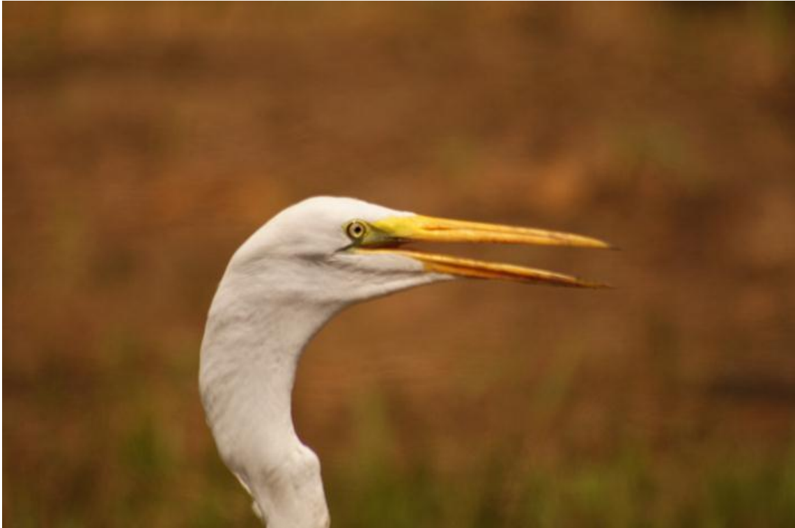
Figura 20. Ardea alba . 06/12/2010.