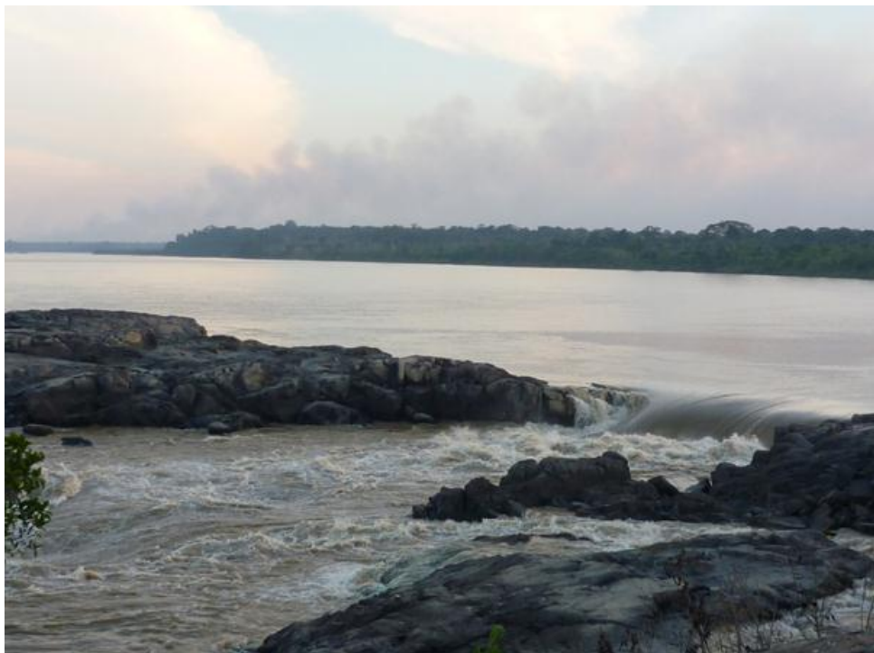
Foto 4. Cachoeira de Teotônio, Rio Madeira, julho de 2010.