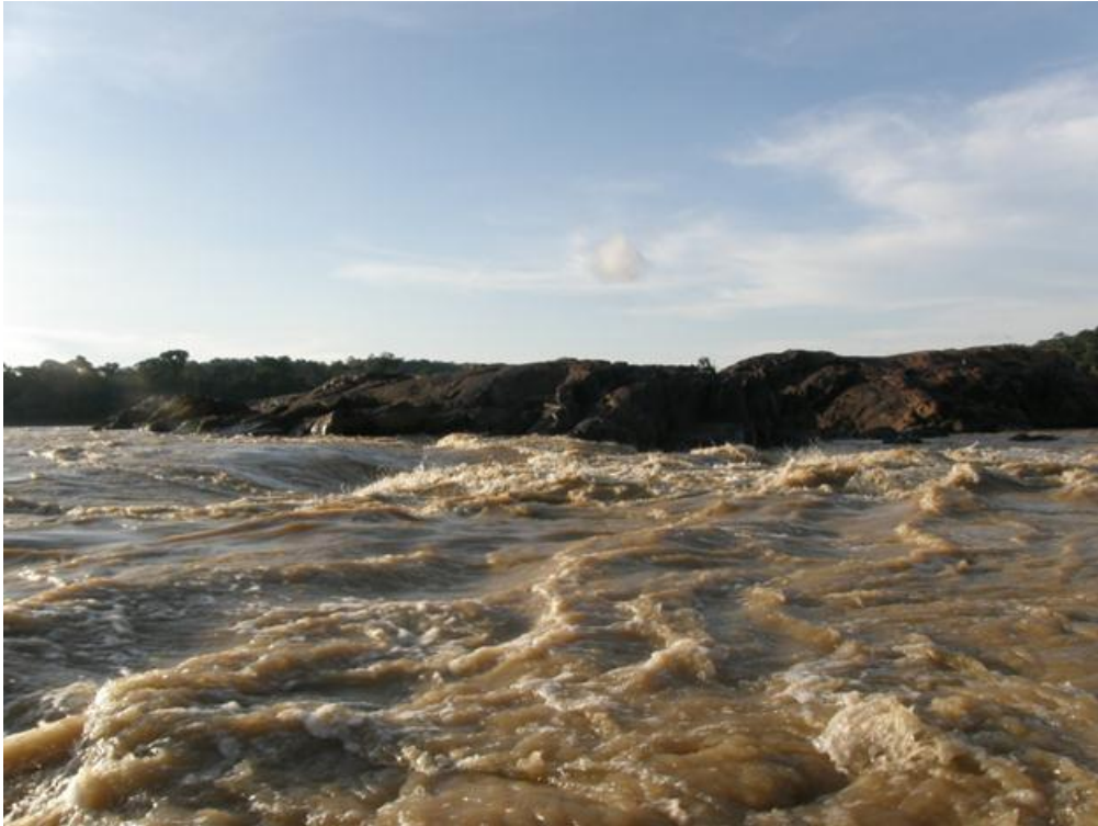
Foto 7. Corredeiras na região de Jirau, Rio Madeira, 03/12/2010.