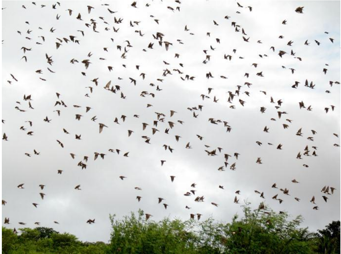
Foto 77. Pygochelidon melanoleuca . Rio Madeira, 14/02/2011.