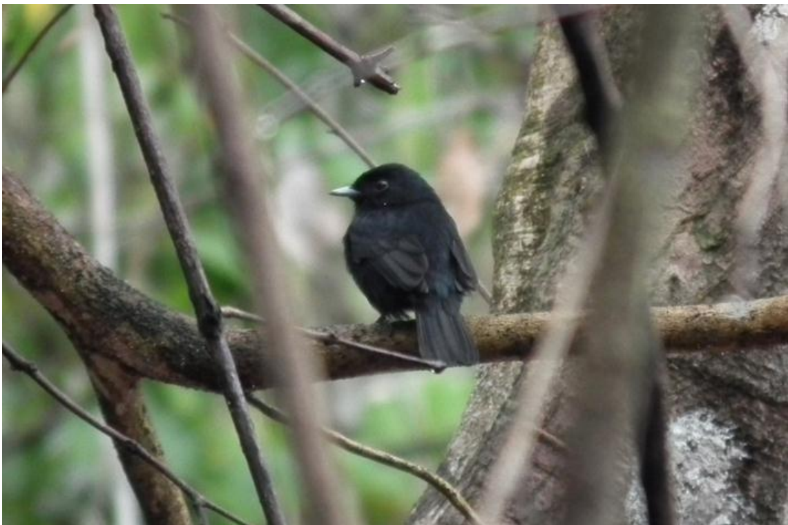
Figura 76. Knipolegus orenocensis . 26/02/2011.