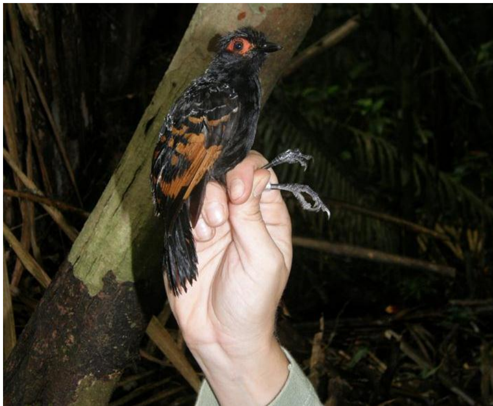
Figura 60. Phlegopsis nigromaculata . Ilha das Pedras, 23/11/2010.