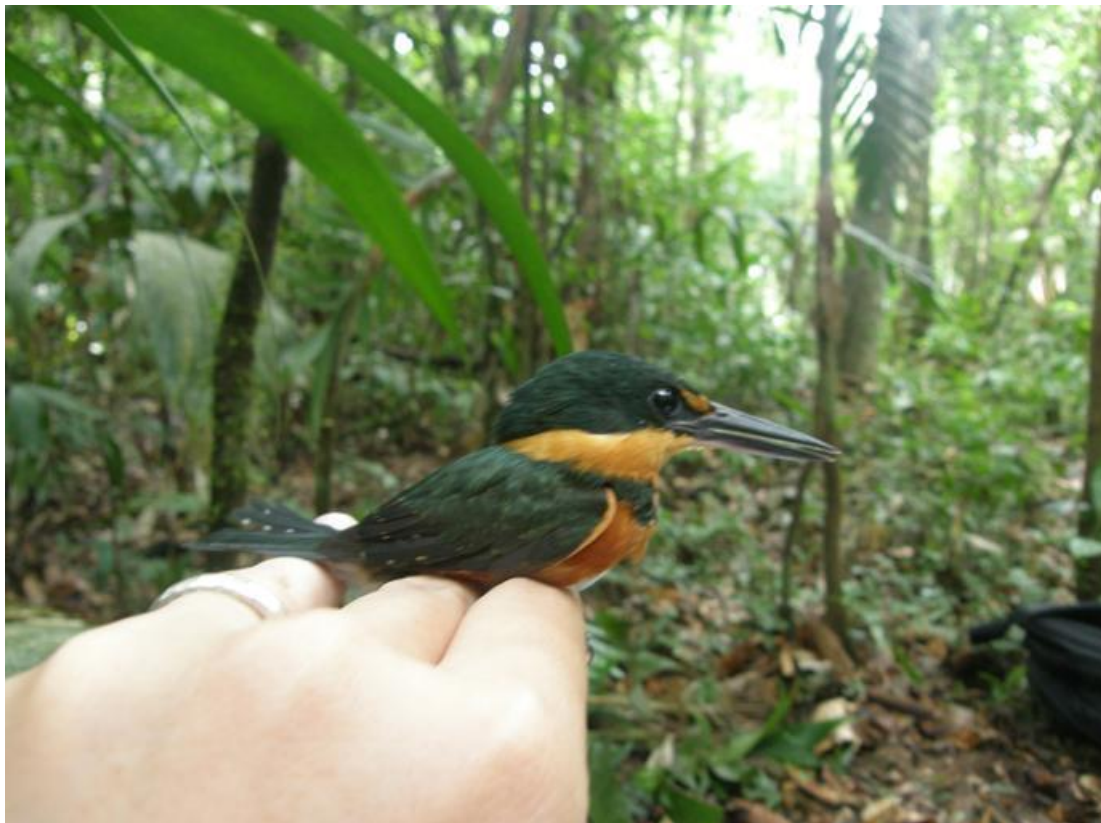
Figura 42. Chloroceryle aenea . Morrinhos, 28/11/2010.