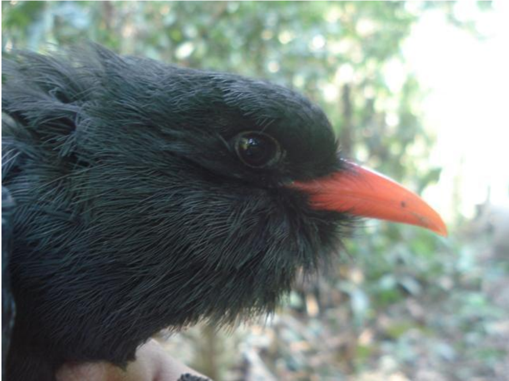
Figura 51. Monasa nigrifrons . Tres Praias, 07/08/2010.