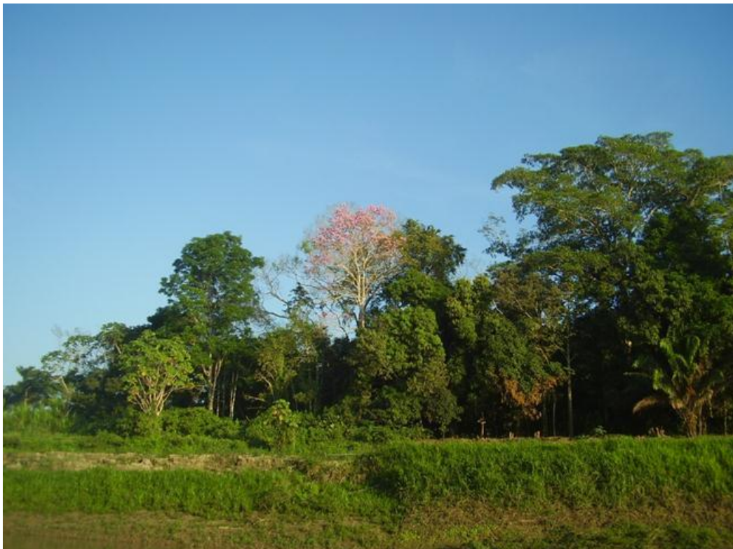
Foto 15. Ipe florido, margem do Rio Madeira, 29/07/2010.