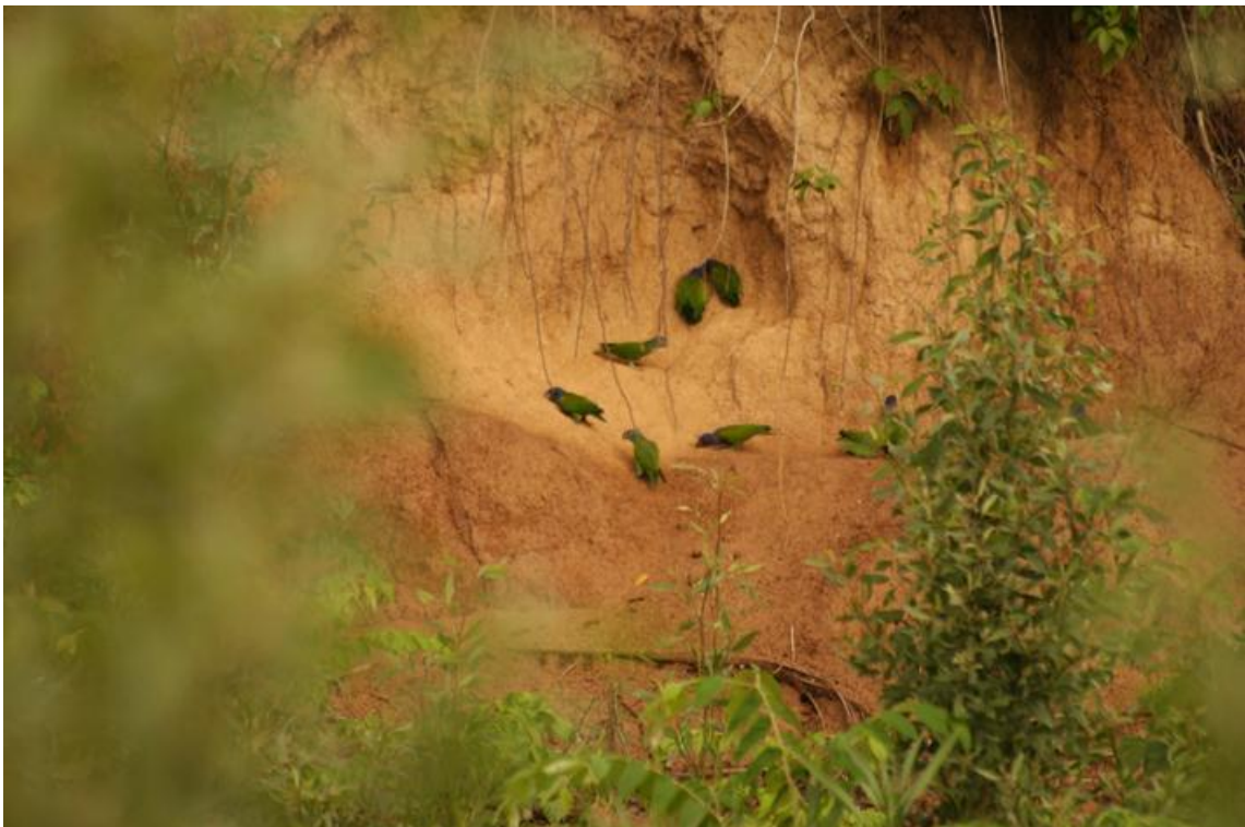
Figura 33. Pionus menstruus no Barreiro 9, 23/11/2010.