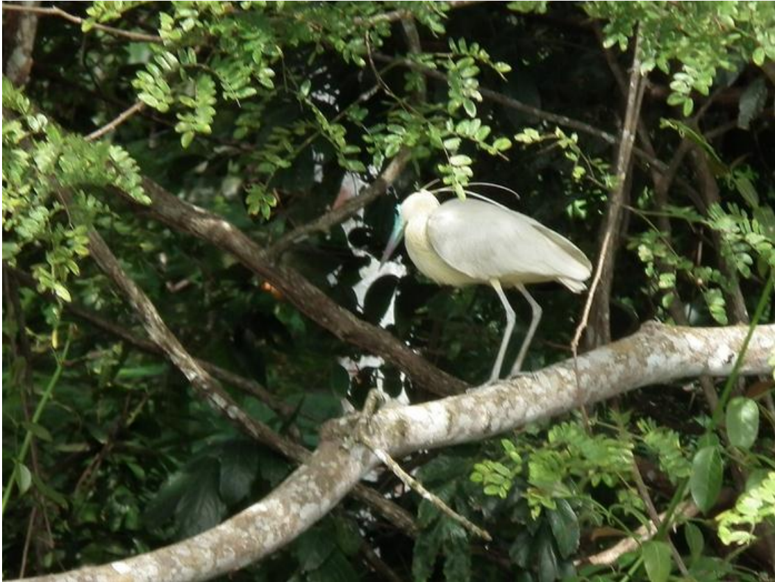
Figura 22. Pilherodius pileatus . 20/02/2011.