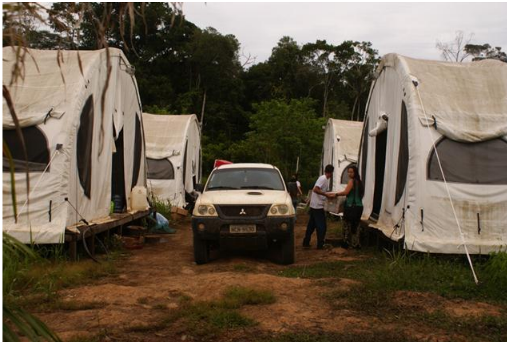
Foto 2. Chagada da equipe ao acampamento, Módulo Teotônio, 10/12/2010.