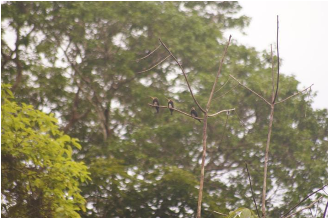
Figura 44. Brachygalba lugubris . Rio Branco, 13/12/2010.