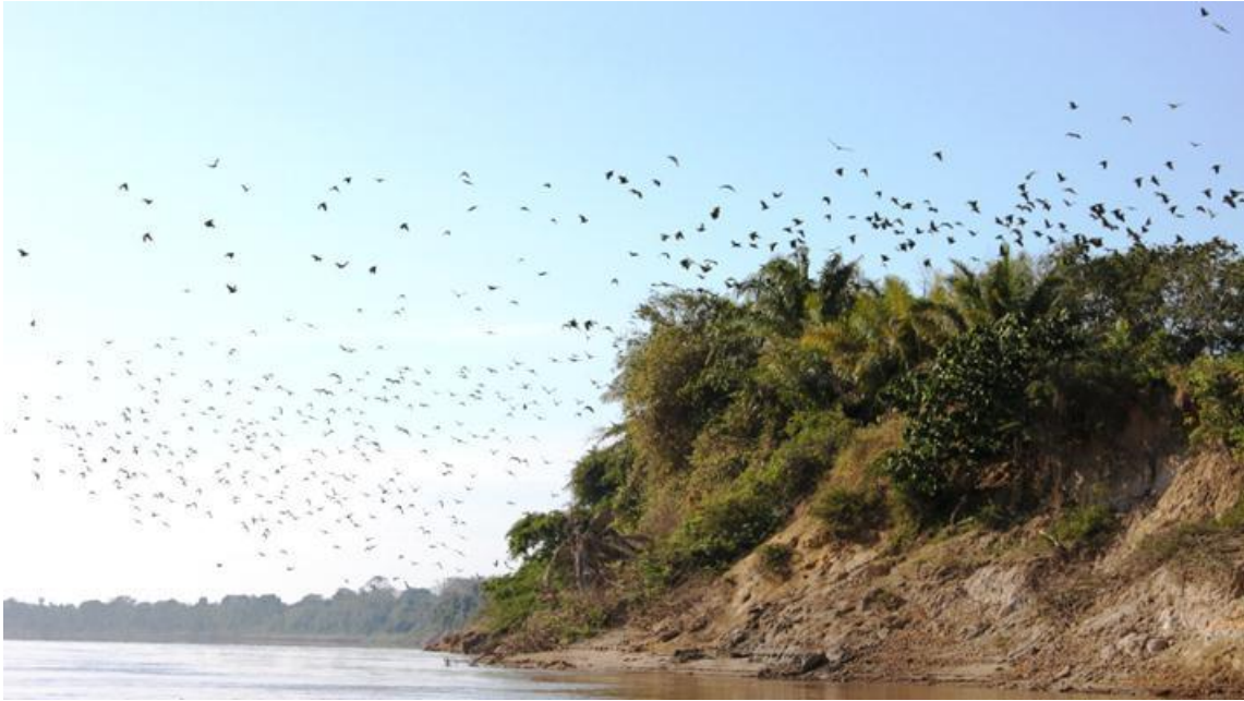
Figura 34. Pionus menstruus e Amazona farinosa no Barreiro 1, 19/07/2010.