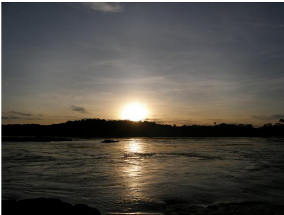
Foto 5. Entardecer no Rio Madeira, região de Jirau, 3/12/2010.