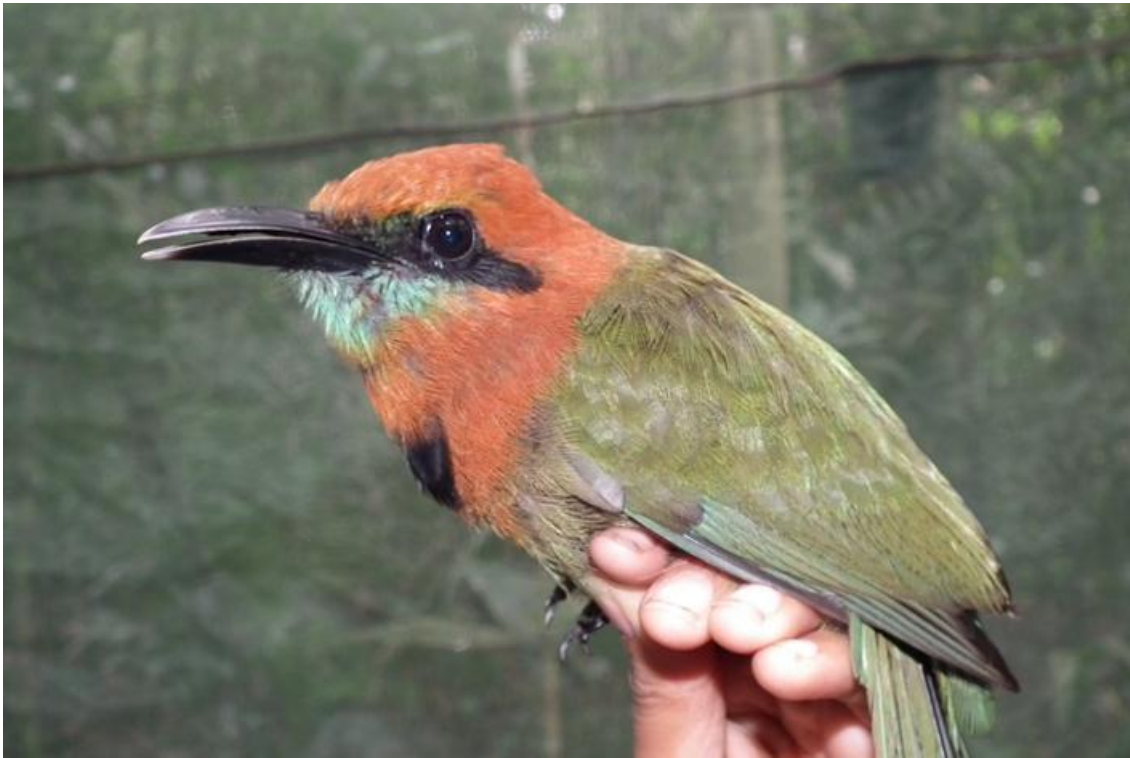
Figura 43. Electron platyrhincum . Morrinhos, 27/02/2011.