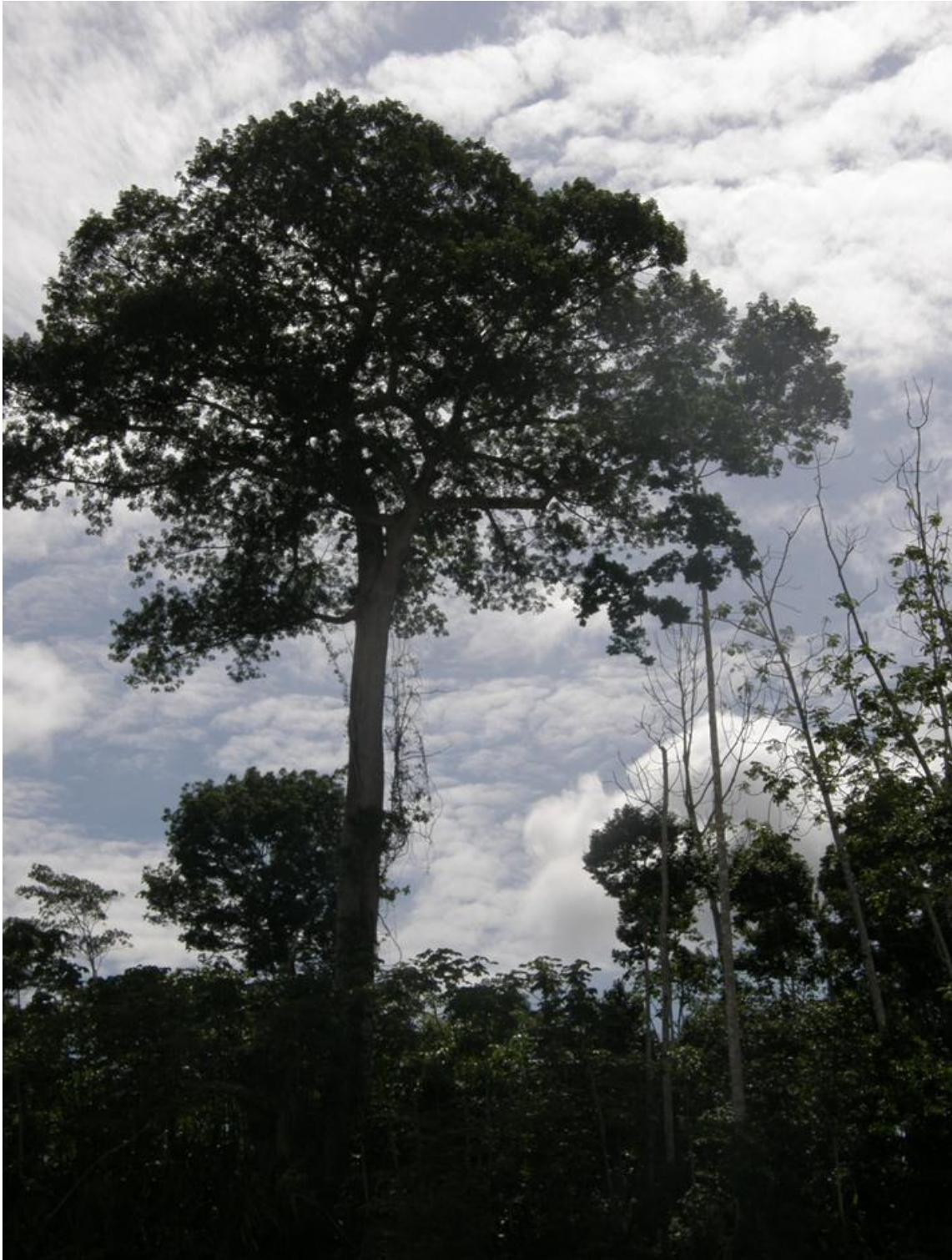
Foto 13. Arvore emergente, 29/11/2010.