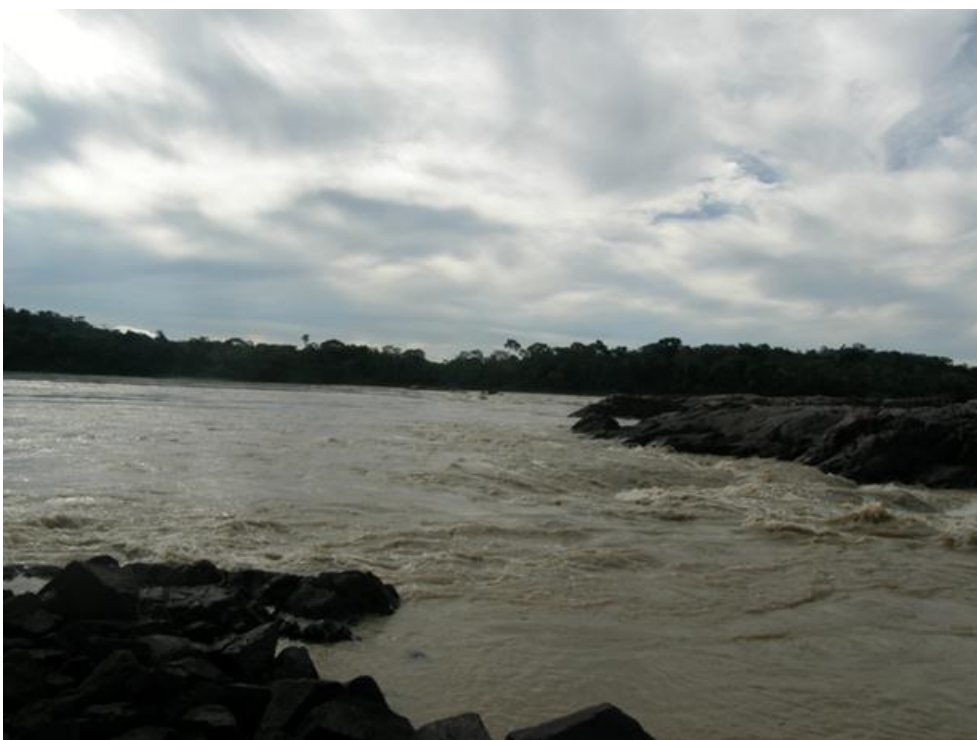
Foto 6. Região de Jirau, Rio Madeira, 01/12/2010.