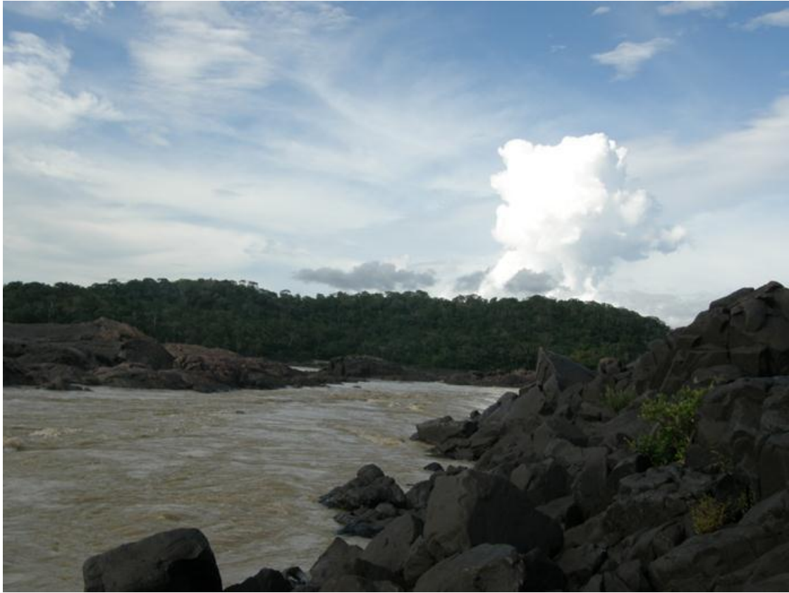
Foto 9. Região de Jirau, Rio Madeira, 01/12/2010.