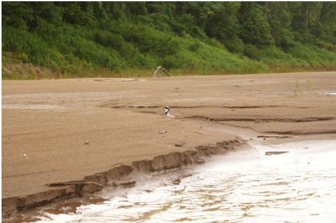
Figura 29. Vanellus cayanus . 18/11/2010.