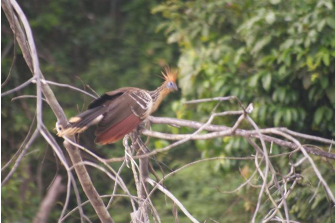
Figura 36. Opisthocomus hoazin . Jaci, 13/12/2010.