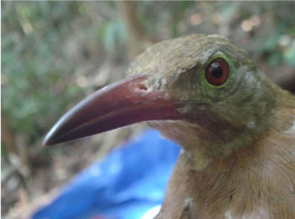
Figura 67. Hylexetastes uniformis . Tres Praias, 06/08/2010.