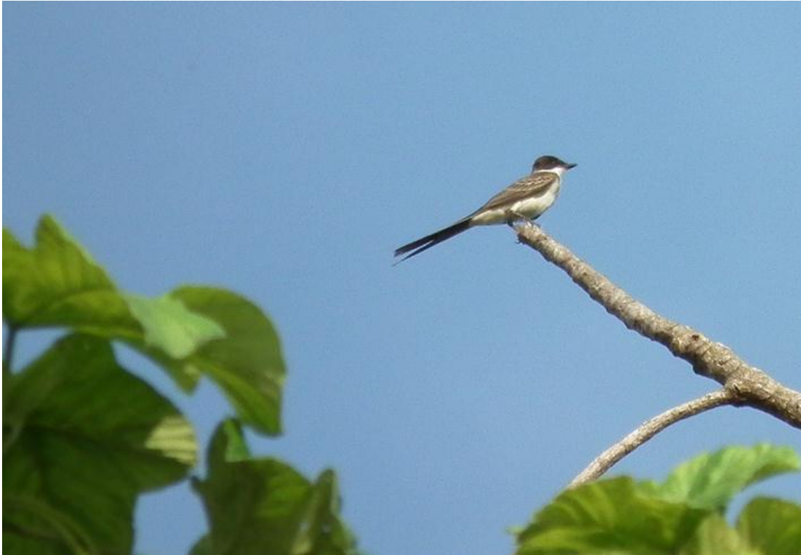
Figura 75. Tyrannus savana . 21/02/2011.