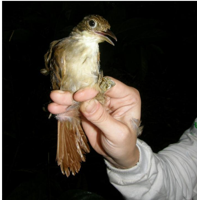
Figura 69. Automolus infuscatus . Ilha das Pedras, 22/11/2010.