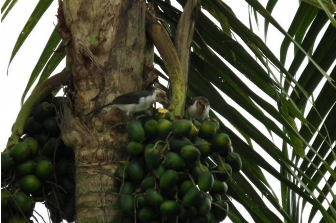
Figura 83. Paroaria gularis (jovem). Rio Jaci, 28/02/2011.