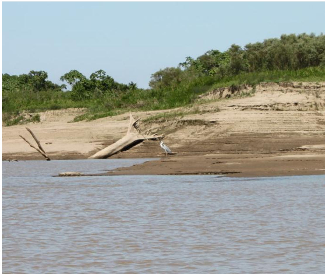
Figura 19. Ardea cocoi . Rio Madeira, julho de 2010.