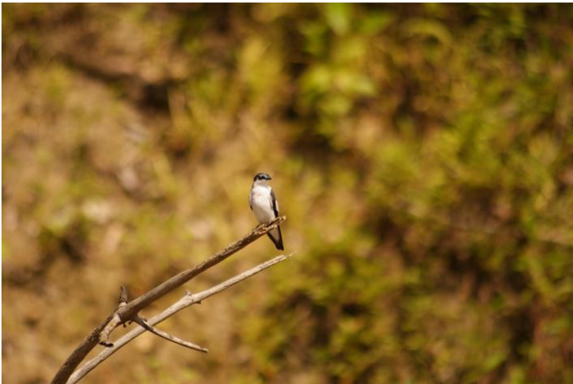
Foto 80. Tachycineta albiventer . Jaci, 13/12/2010.