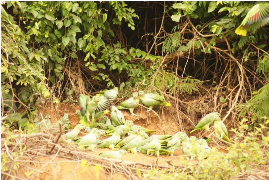
Figura 35. Amazona farinosa no Barreiro 9, 23/11/2010.