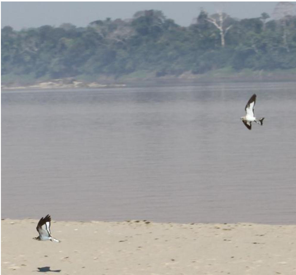
Figura 38. Chordeiles rupestris . Rio Madeira, 25/07/2010.