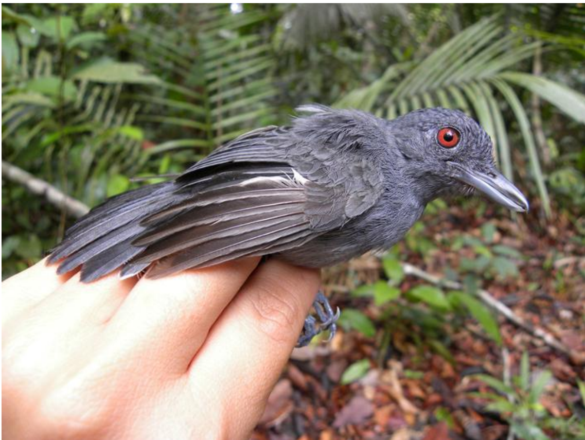
Foto 56. Thamnophilus schistaceus . Jirau, margem direita do Rio Madeira, 04/12/2010.