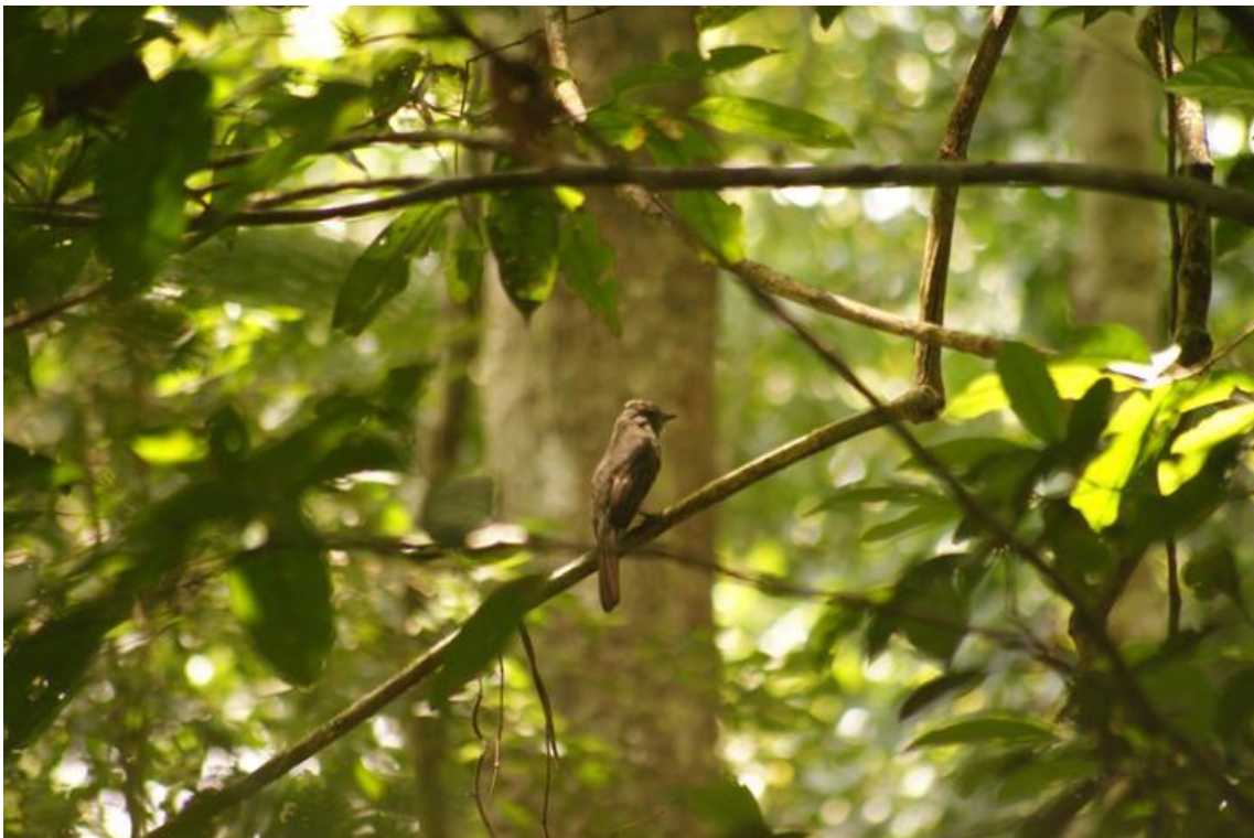
Figura 72. Lipaugus vociferans . Jaci, 12/12/2010.