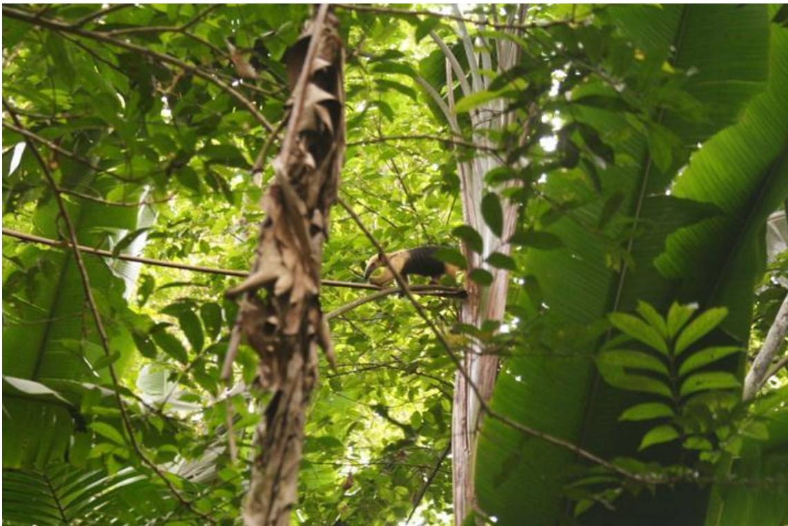
Figura 86. Tamandua mirim. Ilha do Bufalo, 19/11/2010.