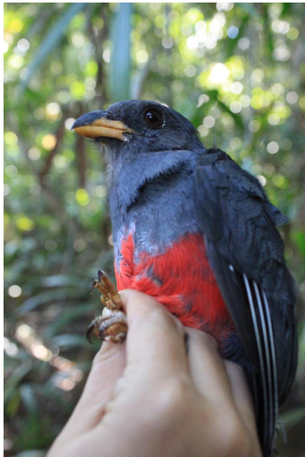
Figura 40. Trogon melanurus . Julho de 2010.