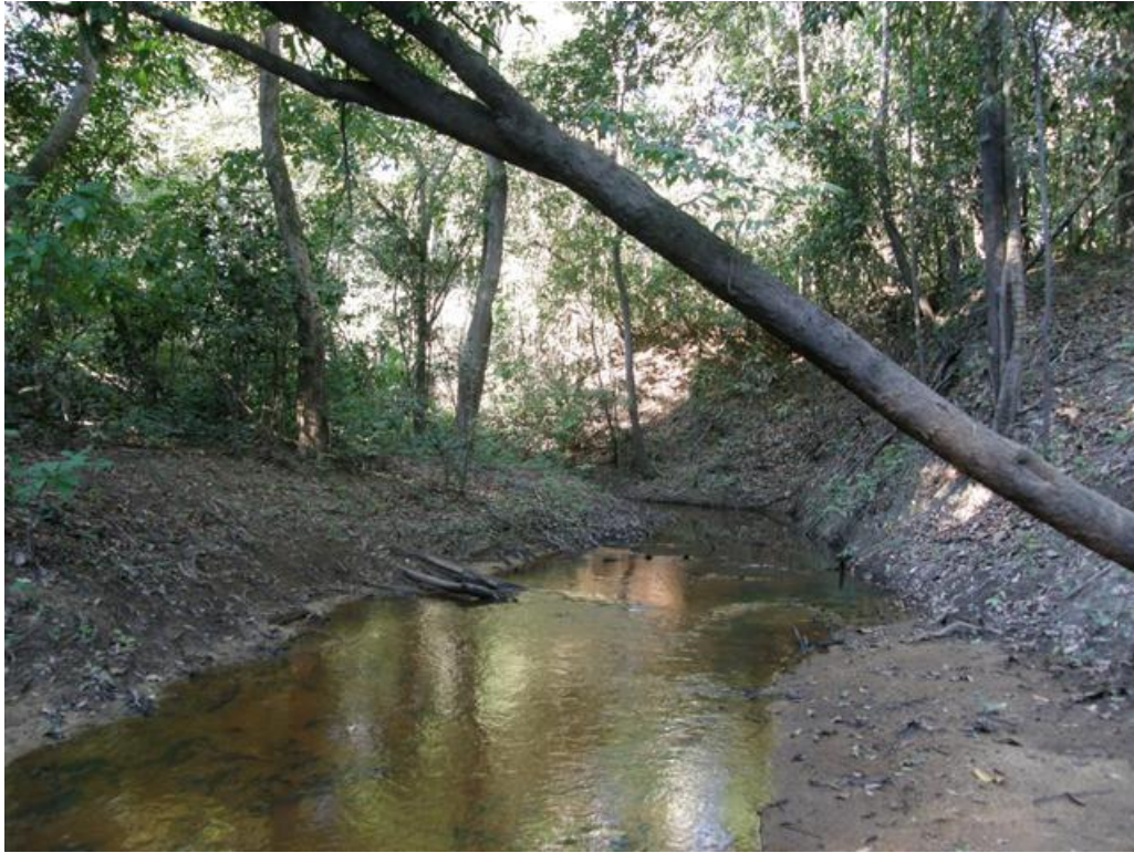
Foto 14. Igarape na Ilha do Bufalo, 24/11/2010.