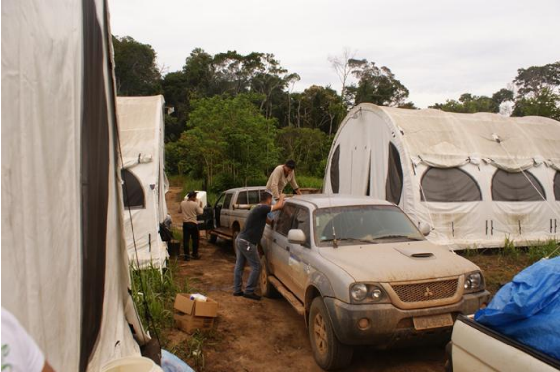
Figura 89. Chegada da equipe ao acampamento. Teotonio, 10/12/2010.