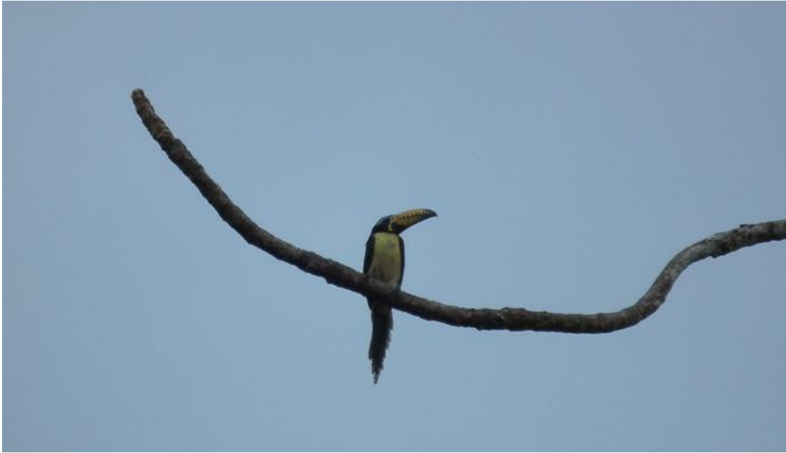
Foto 53. Pteroglossus incriptus . 21/02/2011.