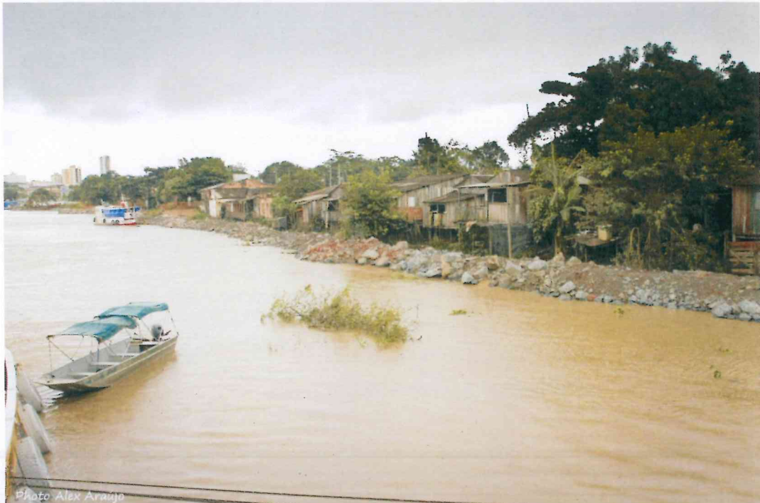
Imediações da Fábrica de Gelo