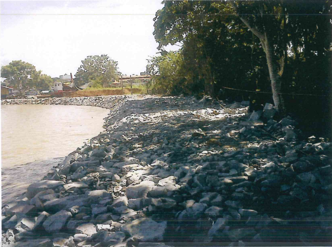
Imediações do Canal Santa Bárbara