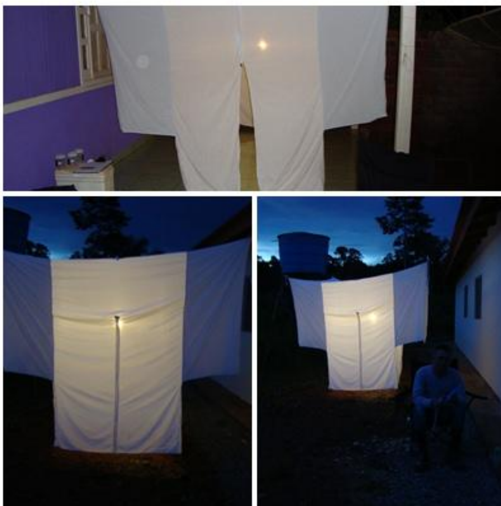
Figura 2. Armadilha Shannon , com atração luminosa, utilizada para a captura de triatomíneos nas áreas de influência da UHE Santo Antônio, Porto Velho – RO.

Foram realizadas buscas ativas diurnas no peridomícilios e intradomicílio das residências e/ou alojamentos da área de influência do empreendimento. Adicionalmente, no período noturno, das 18 h até as 22 h, foram instaladas armadilhas luminosas tipo Shannon (Shannon, 1939) com atração de luz (lâmpião a gás) para a interceptação de vôo (Figura 2).