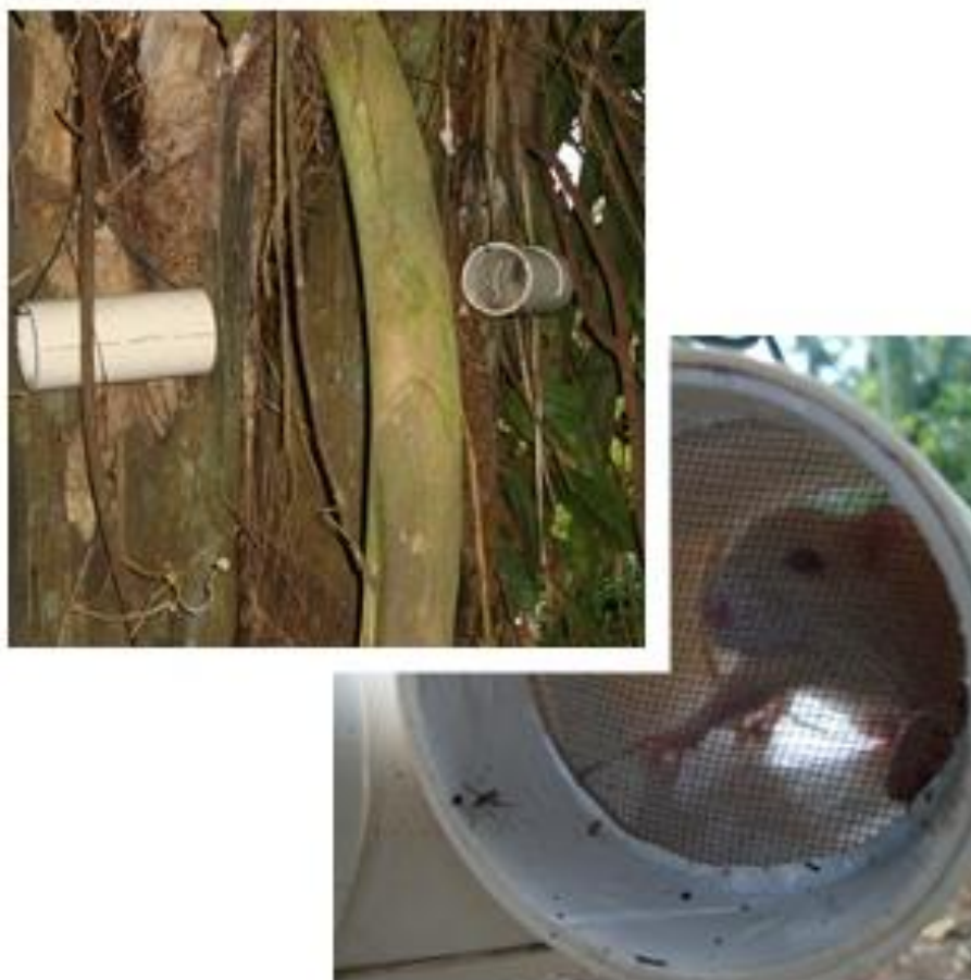
Figura 1. Armadilha de PVC (com atração de isca animal), para captura de triatomíneos, utilizada nas áreas de influência da UHE Santo Antônio, Porto Velho – RO.

Adicionalmente às armadilhas de PVC, foram realizadas buscas diretas (procura ativa) de barbeiros na vegetação do entorno das habitações, principalmente em palmeiras, em ocos de árvores e em tocas de mamíferos.