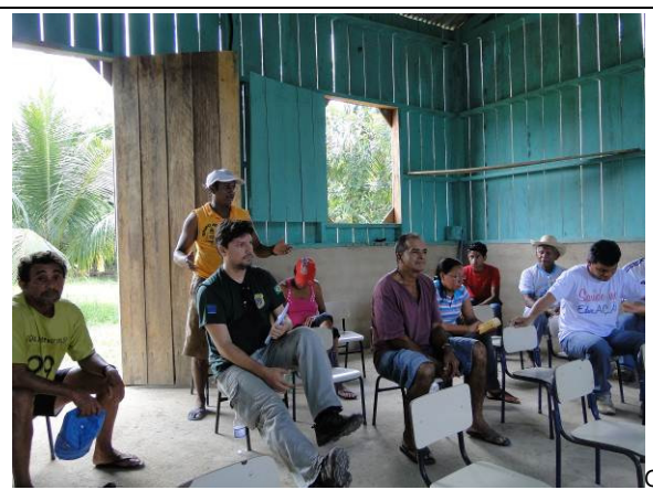
Foto 14 Reunião Associações São Carlos 04/10