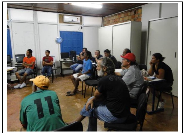
Foto 4 Reunião Associações em Calama 01/10