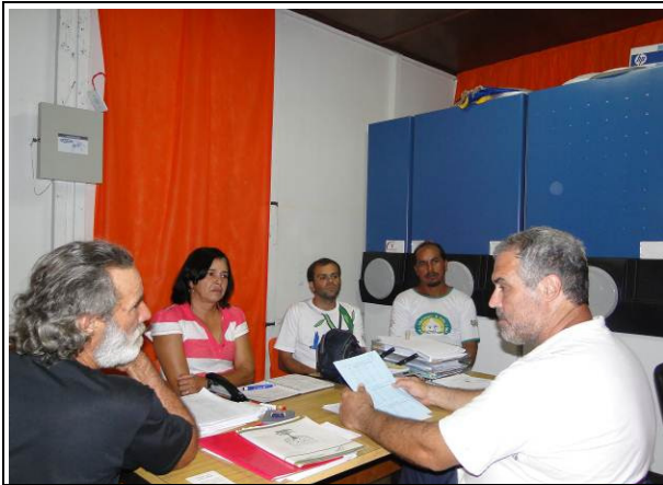
Foto 1 – Reunião preparatória com lideranças para viabilizar reunião com associações em Calama 31/09

Registro fotográfico das reuniões com Associações Comunitárias para apresentação e validação do Planejamento executivo ano 2011, nos distritos de Calama, Cujubim, Nazaré e São Carlos.