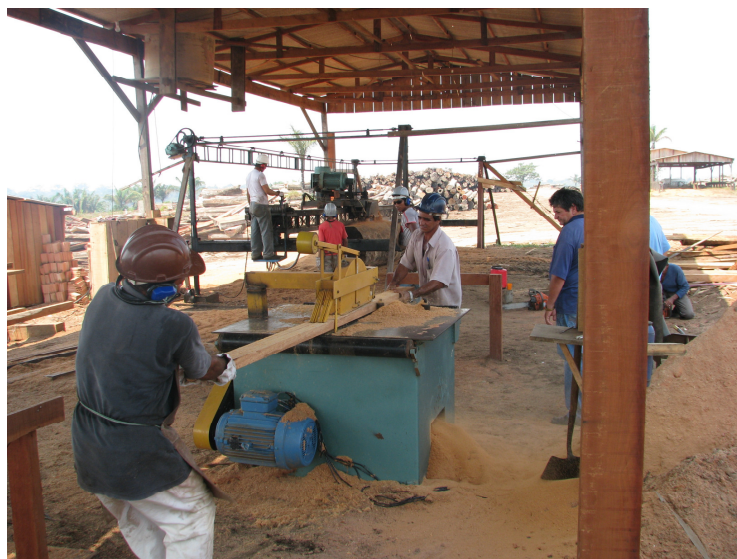
Foto 9 - Serragem de bloco de madeira na serraria HMR.

A madeira destinada para lenha está sendo destinada ao município de Itacoatiara (AM) para utilização em caldeiras de secagem de grãos. O transporte é realizado por balsa via rio Madeira. As fotos 9, 10 e 11 mostram respectivamente a operação de serragem de madeira, carregamento de balsa com lenha e balsa utilizada para transporte.