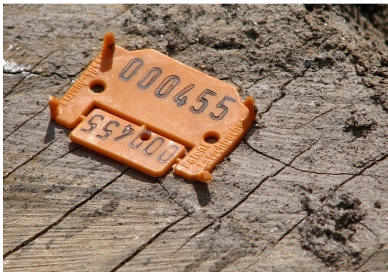
Foto 8 – Plaquetas de identificação de toras utilizada no romaneio.

Após formação das pilhas, as toras são identificadas por meio de plaquetas apropriadas (foto 8) seguido de preenchimento da ficha de romaneio contendo: local do pátio, coordenadas, nome comum e científico e volume em metro cúbico de cada espécie empilhada. Também são plaqueteadas as espécies identificadas como mourões. No caso da madeira fina é feito a medição das pilhas para cálculo do volume empilhado (em esteres). Toda pilha (tora e lenha) é identificada por placas com as devidas coordenadas.