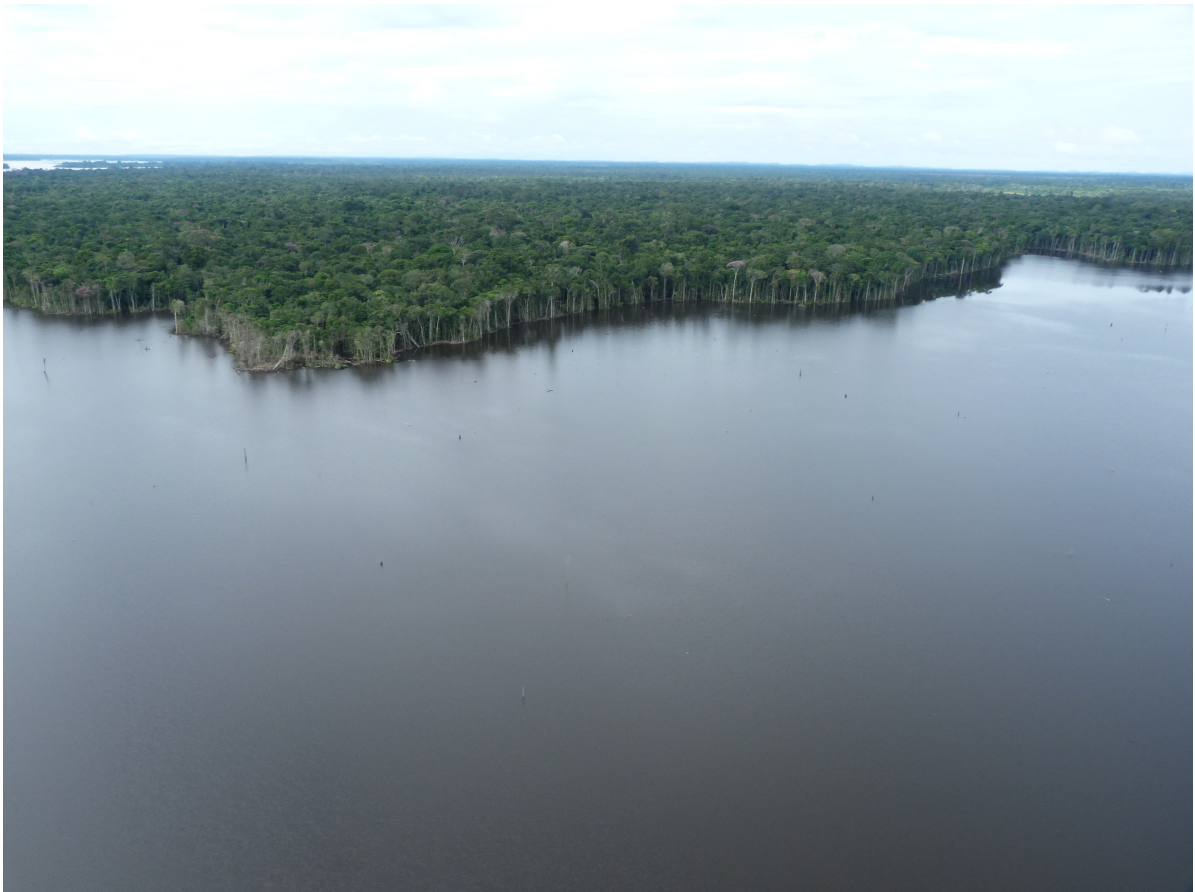
Reservatório da UHE Santo Antônio - Rondônia – Janeiro/2012