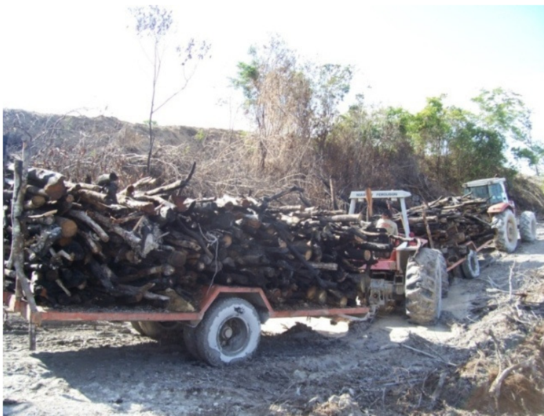
Foto 15 – Operação de transporte de lenha para pátio de estocagem.

As fotos 15 e 16 a seguir, mostram respectivamente, transporte e empilhamento mecanizado de lenha no pátio.