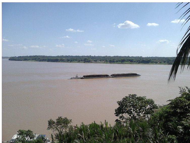
Foto 11 – Transporte de lenha via balsa – destino: Itacoatiara (AM)