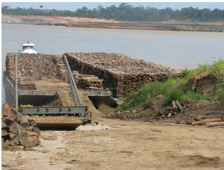
Foto 10 – Empilhamento de lenha na balsa para comercialização (rio Madeira)