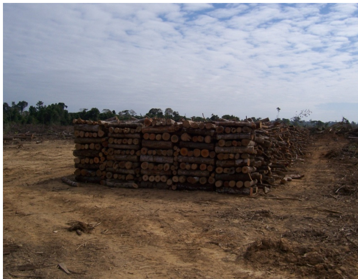
Foto 6 – Madeira para lenha empilhada manualmente no pátio de estocagem.