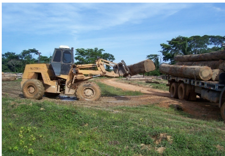
Foto 13 - Descarregamento de toras no pátio de estocagem