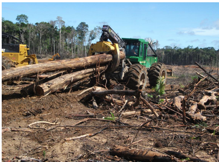
Foto 12 – Skidder com garra transportando tora para o pátio de estocagem

Até o final deste trimestre, a operação de derrubada e arraste de madeira para fora da cota foram concluídas. Estima-se até o próximo trimestre a conclusão das operações de pátios. As fotos 12, 13 e 14, mostram respectivamente, momento de arraste com skidder, descarregamento de toras e aspecto geral do pátio de estocagem.