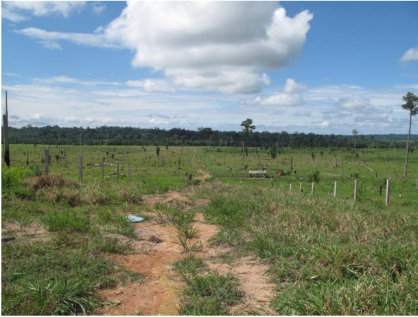
Acesso visto da colina