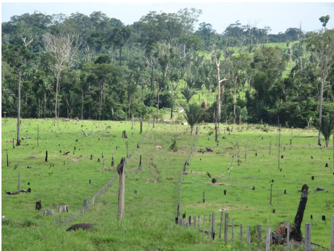
Ponto BH_StAntonio 02 localizado após o igarapé no final do acesso, depois da colina (para chegar ao mesmo deve-se sair deste acesso e circundar a colina).