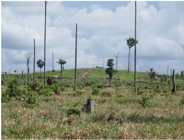
Acesso a colina