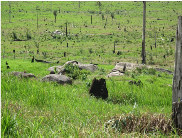
“Pedral” ao sopé da colina