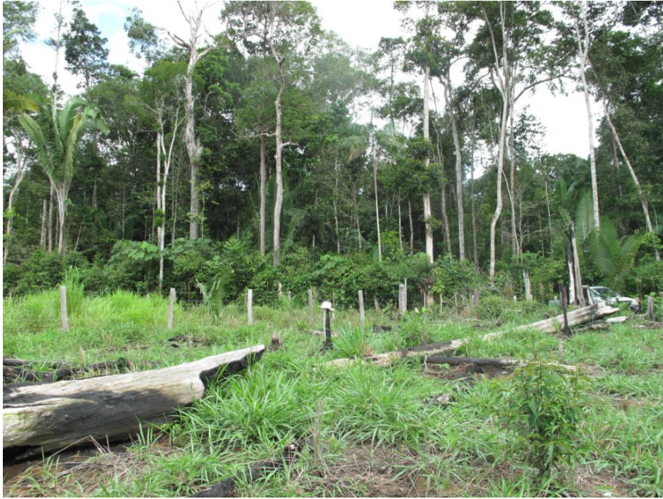
Ponto Alternativo 1