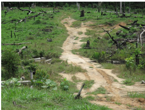
Igarapé com ponte