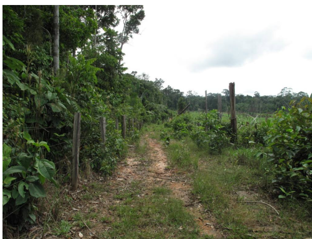
Estrada próxima ao local