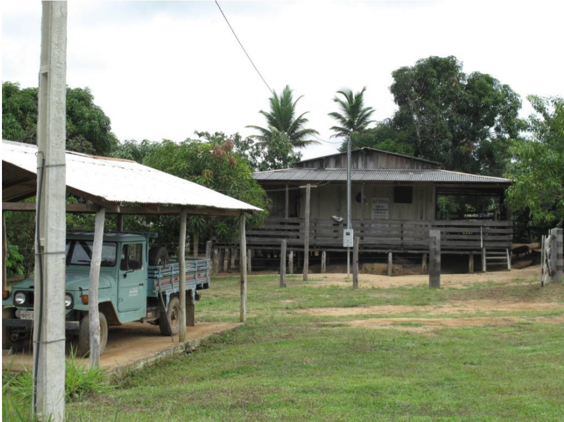
Sítio São Francisco

Na figura a seguir, nota-se que, pelas coordenadas fornecidas pela Geoanalises, o ponto BH_StAntonio 01, localiza-se dentro de uma mata, o que aumenta as dificuldades de instalação da estação.