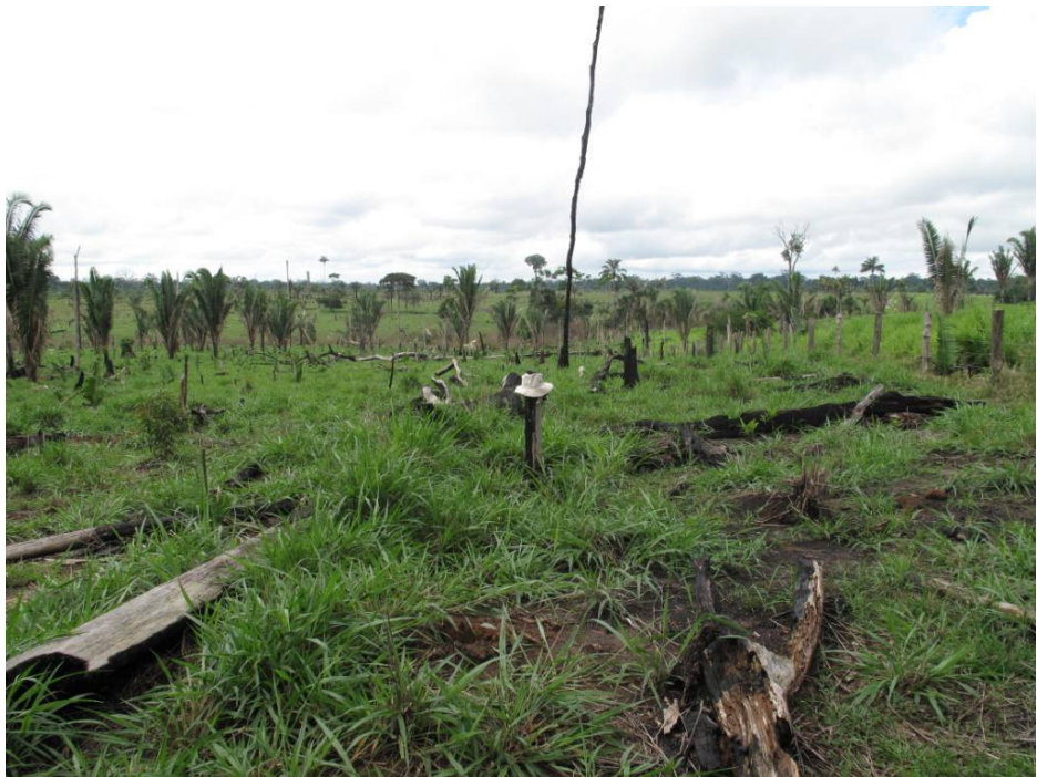
Ponto Alternativo 1