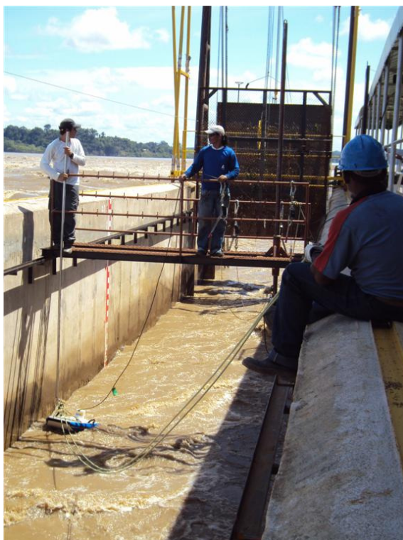
Utilização do ADCP – aparelhagem para medição da vazão e do perfil de velocidade , em tempo real, no interior do canal experimental