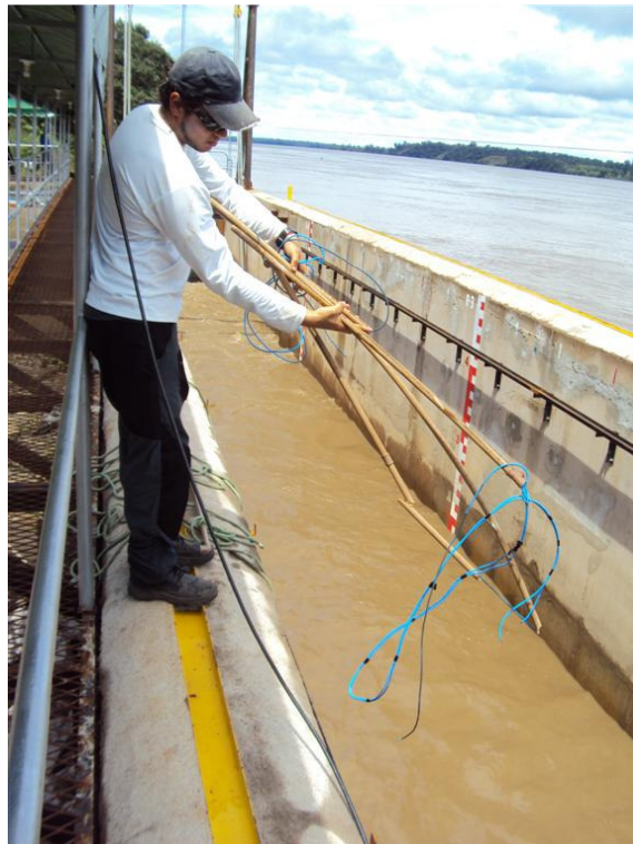
Procedimentos com antena receptora de sinais dos Pit-Tags do sistema RFID