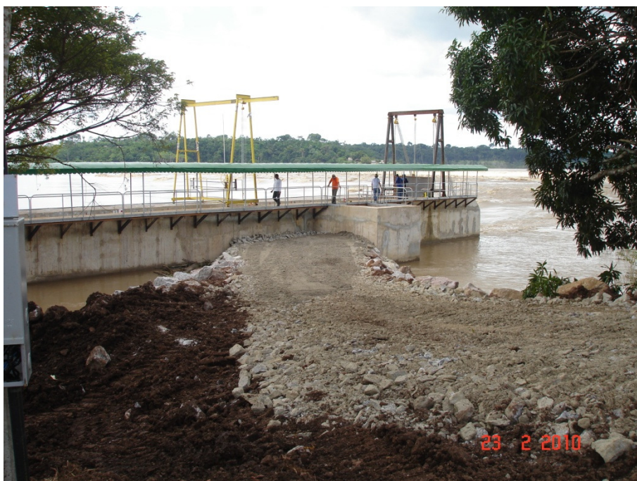
Aspecto geral do canal experimental de transposição de peixes de Teotônio