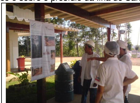
Foto 1 – Colocação dos painéis de arqueologia na área externa do refeitório na margem direita.

Esses painéis contêm dados sobre os sítios arqueológicos, EFMM, etapas do trabalho arqueológico e sobre o presídio da Ilha de Santo Antônio.