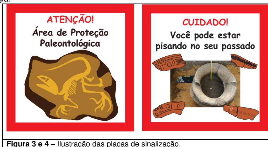
Figura 3 e 4 – Ilustração das placas de sinalização.

Em junho de 2009 foram afixados painéis em diversos pontos dentro do reservatório. Os locais fixados foram: ambas as margens das balsas, entorno do casarão e entorno do sítio arqueológico Vila de Santo Antônio. Além disso, foram criadas e fixadas no canteiro placas de simulação de trânsito para alertar, identificar e divulgar as atividades da arqueologia e paleontologia.