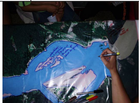
Foto 18 – 29/08/2009 – Detalhe do mapa com dados fornecidos e desenhados pelos participantes.