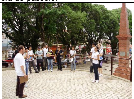
Foto 6 – Capacitação dos agentes culturais – Segunda fase – aula prática em frente ao obelisco.

A seguir, parte do material impresso realizado pela equipe da Scientia Consultoria Científica destinada ao Passeio pelo Centro Histórico de Porto Velho, confeccionado até o dia 29 de Agosto de 2009.