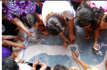
Foto 11 – Construção do mapa de localidade a partir de foto aérea.