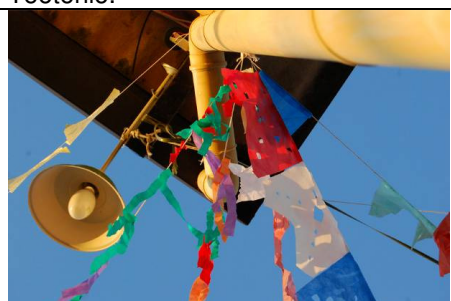
Foto 24 – Enfeites de bandeirinhas coloridas na sede dos pescadores.