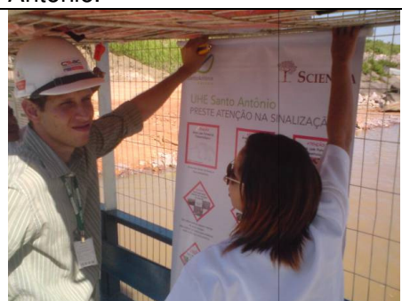
Foto 2 – Colocação dos painéis das placas de sinalização dentro das balsas.

De acordo com cronograma as ações durante os TDSs, junto aos profissionais do canteiro de obras e reservatório, em ambas as margens, iniciaram em 20 de julho de 2009 até 14 de agosto de 2009, totalizando 70 apresentações.