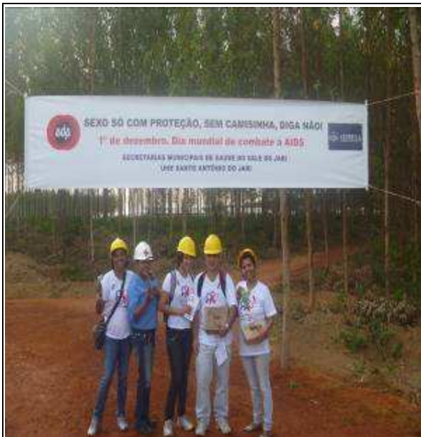
Foto 01. Equipe de saúde em campanha de combate a AIDS, no canteiro de obras da UHE Santo Antonio do Jari.