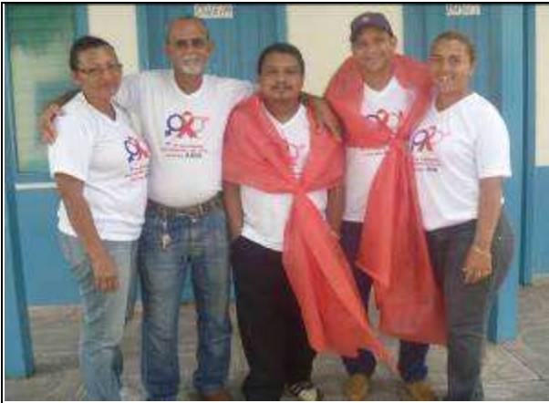
Foto 09. Equipe de ACS de Vitória do Jari-AP no apoio a campanha contra DST/AIDS.