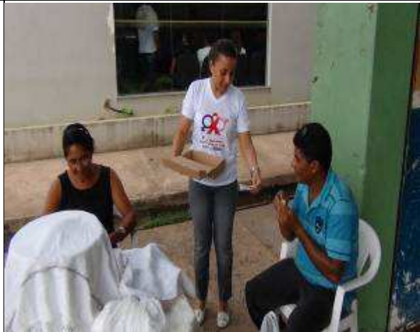
Foto 08. Distribuição de preservativos a população de Monte Dourado-PA.