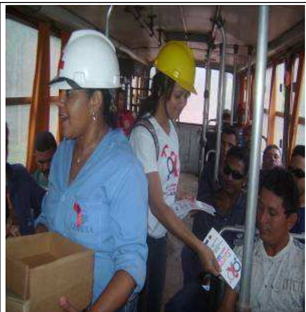
Foto 02. Distribuição de folders no ônibus para os trabalhadores da UHE.