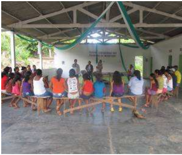
Foto 33. Empreendedor na entrega de mosquiteiros aos moradores da comunidade Iratapuru.