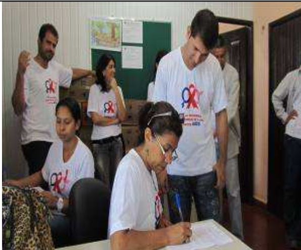
Foto 13. Equipe da empresa EDP realizando teste rápido Anti HIV.