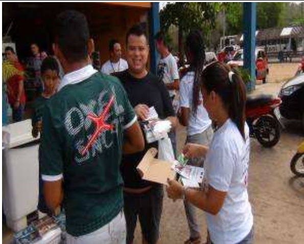
Foto 07. Distribuição de folders na praça central de Monte Dourado-PA.