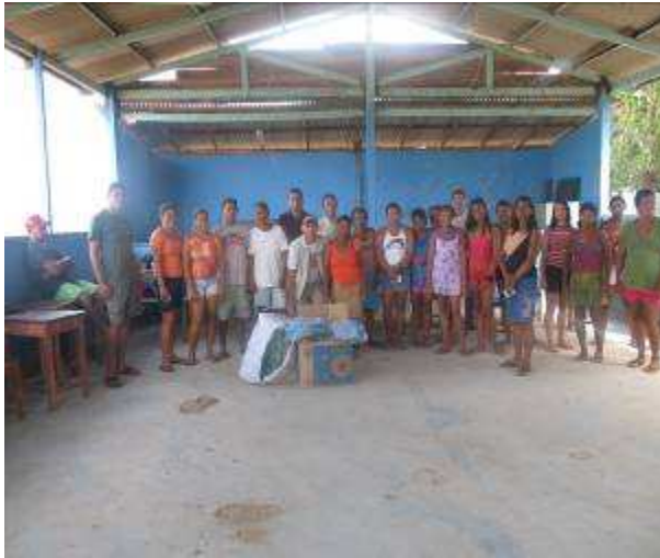
Foto 31. Moradores da Comunidade da Vila Padaria contemplados pelos mosquiteiros impregnados.