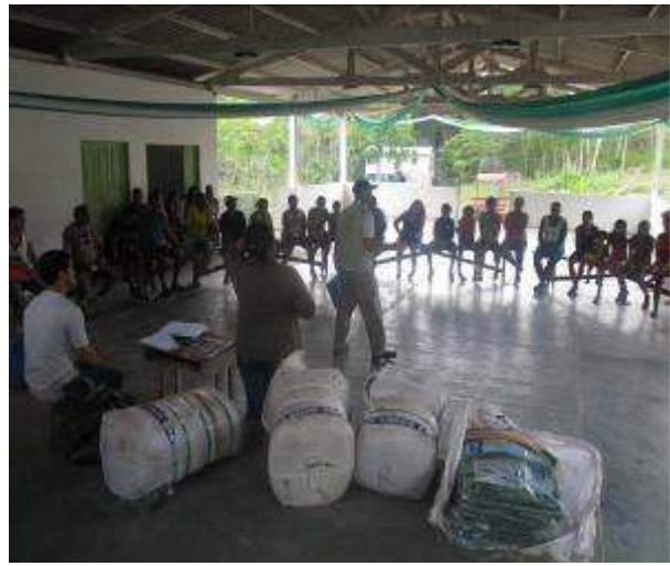
Foto 34. Empreendedor na entrega de mosquiteiros aos moradores da comunidade Iratapuru.