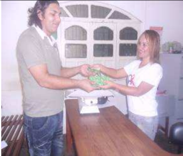
Foto 05. Entrega de preservativo em UBS de Laranjal do Jari-AP.