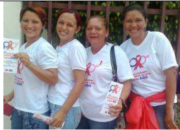
Foto 10. Equipe de ACS de Vitória do Jari-AP no apoio a campanha contra DST/AIDS.