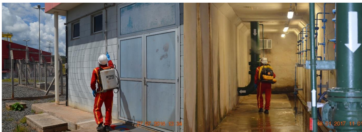
3.3.27-11: Dedetização das áreas de apoio a operação da usina

Ainda se tratando da área operacional da usina, nos meses de julho 2016 e janeiro e junho 2017, foi realizada pela empresa Exterminio, a dedetização das áreas da usina, conforme é possível observar nas imagens de 3.3.27-11 a 3.3.27-13 .