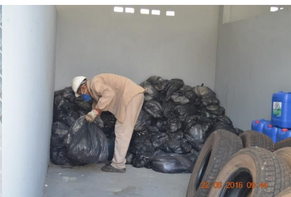
Imagem 3.3.27-2: Coleta de resíduos realizada no mês de setembro de 2016