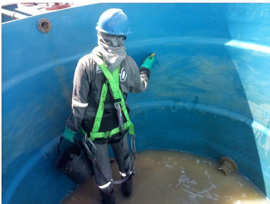
Imagem 3.3.27-18: Lavagem da caixa d'água onde é armazenada a água tratada na ETA