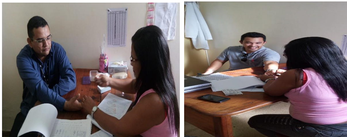
Imagem 3.3.27-25: Exame de gota espessa feita pelos colaboradores da UHE SAJ no Hospital de Laranjal do Jari - dezembro/ 2016