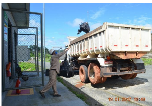
Imagem 3.3.27-5: Coleta de resíduos realizada no mês de janeiro de 2017