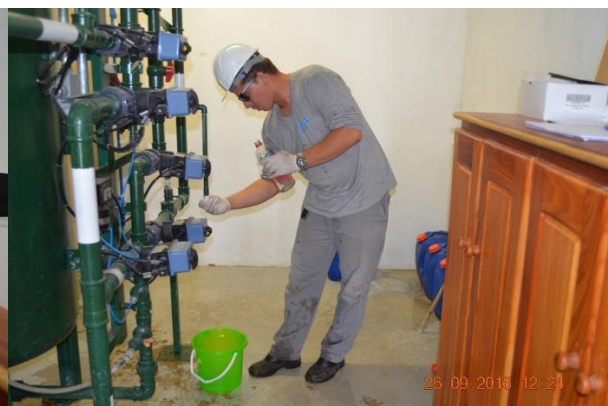
3.3.27-15: Coleta de amostra de água da ETA