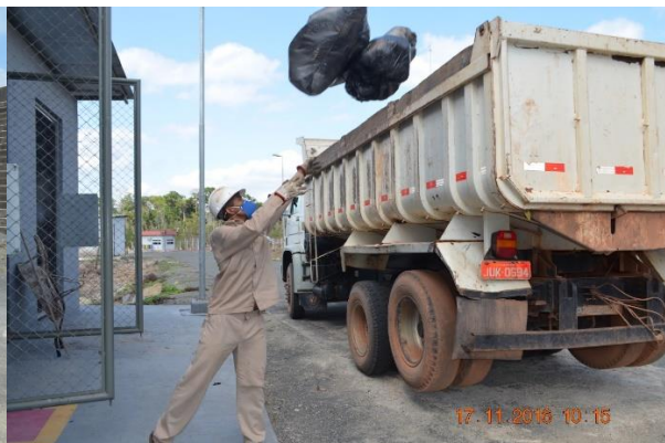
Imagem 3.3.27-4: Coleta de resíduos realizada no mês de novembro de 2016