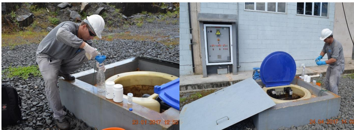
Imagem 3.3.27-22: Coleta da amostra de Efluentes