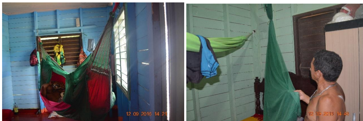
Imagem 3.3.27-24: Levantamento do uso de mosquiteiros nas Vilas de Iratapuru e Santo Antonio