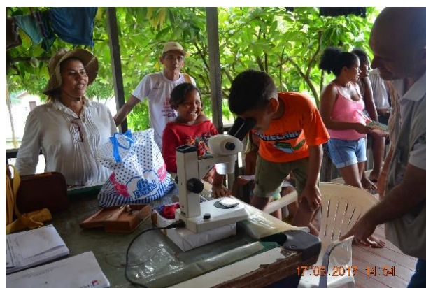
Imagem 3.3.27-26: Campanha de combate à malária realizada nas comunidades do entorno e na usina com colaboradores e terceiros da Jari Energia