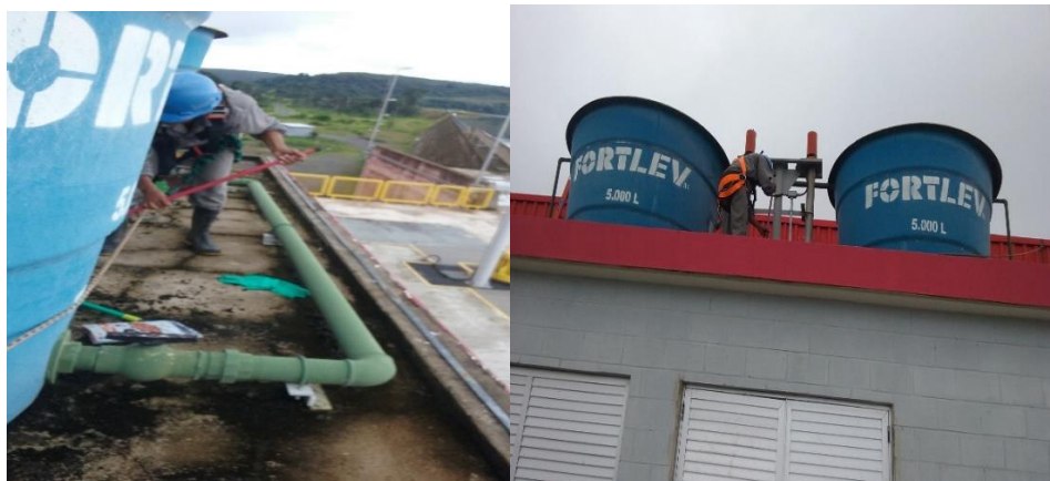
Imagem 3.3.27-20: Realização da limpeza na caixa d'água

A Licença de Operação da empresa que realiza as análises – LIFE, bem como sua Certidão de Termo de Responsabilidade Técnica, encontram-se no Anexo 3.3.27-7 deste Relatório.