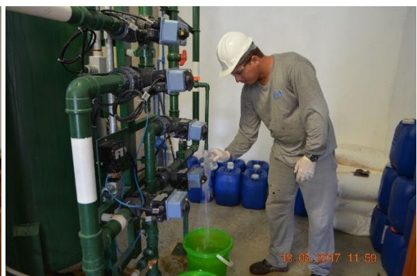
3.3.27-17: Coleta de amostra de água da ETA

Devido a constatação de pequenas alterações em alguns parâmetros destes laudos, foi realizada na ETA, uma limpeza das caixas d'água de fibra que armazenam a água tratada da ETA e ocorre semestralmente, conforme constam nas imagens de 3.3.27-18 a 3.3.27-20 , a fim de regular estes parâmetros.