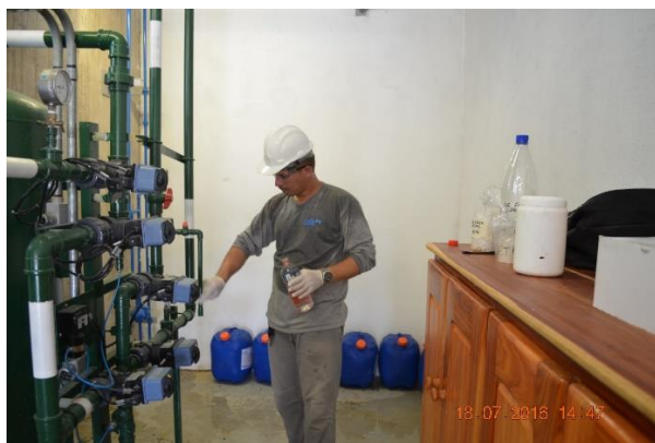
3.3.27-14: Coleta de amostra de água da ETA

Em relação a Estação de Tratamento de Água – ETA, seu funcionamento ocorreu sem anormalidade. Foram realizadas as coletas das amostras mensais para análises laboratoriais, conforme imagens 3.3.27-14 a 3.3.27-17 , e no Anexo 3.3.27-6 , constam os laudos biológicos e físico-químicos.