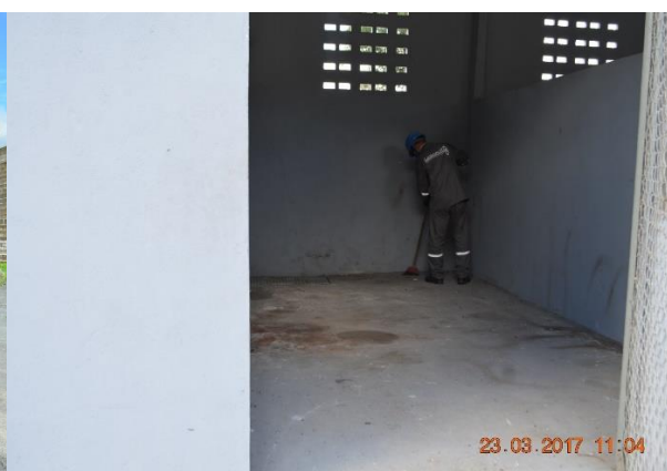
Imagem 3.3.27-6: Coleta de resíduos realizada no mês de março de 2017

Em relação ao refeitório da área operacional, ele está sendo utilizado para os colaboradores realizarem suas refeições. Todos os resíduos orgânicos produzidos neste local são coletados pela empresa A. H. Castro, que realiza este serviço quinzenalmente. O Anexo 3.3.27-1 apresenta os manifestos de resíduos recolhidos por eles, e o Anexo 3.3.27-2 apresenta a Licença de Operação vigente da empresa. Todo o material recolhido pela empresa é encaminhado ao aterro controlado da empresa Jari Celulose. A Licença de Operação do aterro se encontra no Anexo 3.3.27-3 .