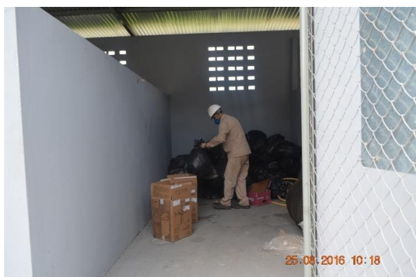
Imagem 3.3.27-1: Coleta de resíduos realizada no mês de agosto 2016

Os galpões para acondicionamento de resíduos gerados na fase de operação da usina continuam sendo utilizados sem nenhuma anormalidade no período deste relatório. As imagens de 3.3.27-1 a 3.3.27-6 apresentam evidências da retirada dos resíduos anteriormente deixadas nos galpões para acondicionamento temporário.