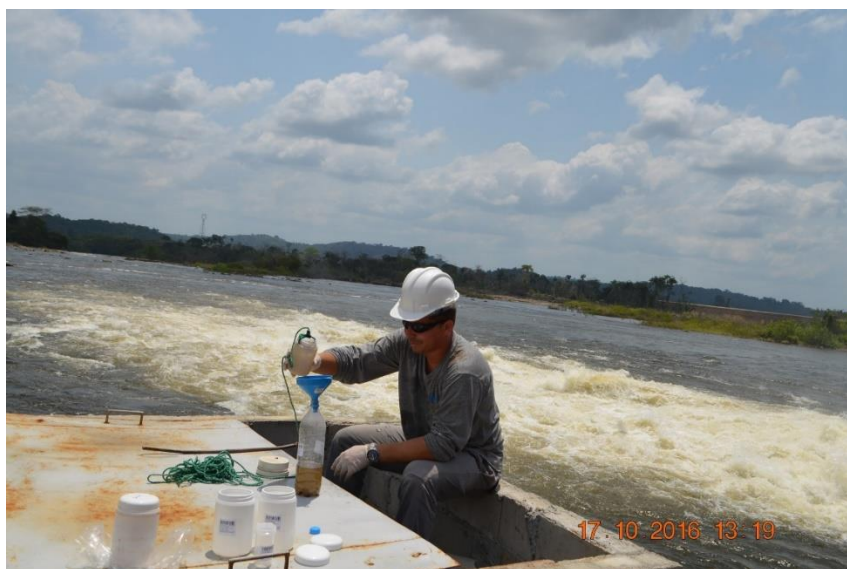
Imagem 3.3.27-21: Realização da coleta de amostra no rio Jari