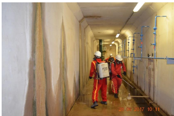
3.3.27-13: Dedetização na casa de máquinas da usina