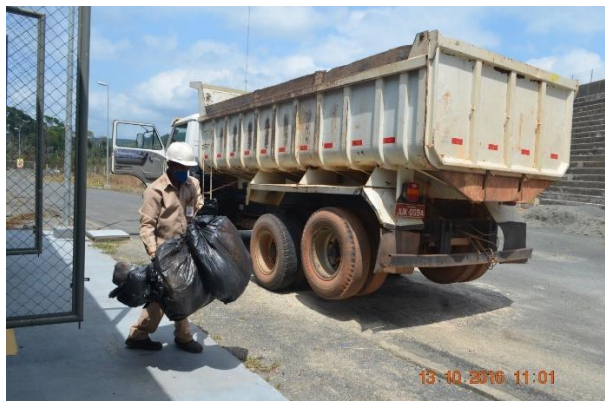
Imagem 3.3.27-3: Coleta de resíduos realizada no mês de outubro de 2016