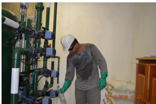
3.3.27-16: Coleta de amostra de água da ETA