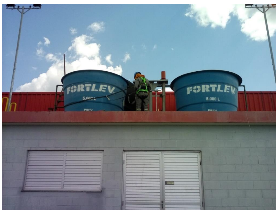
Imagem 3.3.27-19: Realização da limpeza na caixa d'água