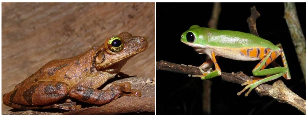
Ilustração 11: Osteocephalus aff. taurinus e Phyllomedusa azurea