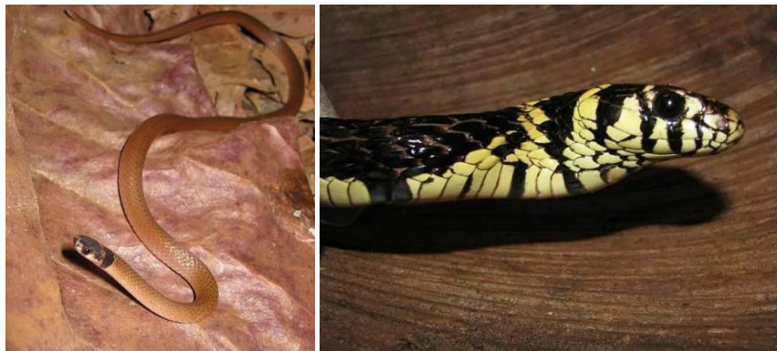
Ilustração 39: Tantilla melanocephala e Spilotes pullatus