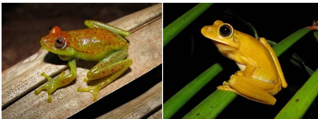
Ilustração 10: Hypsiboas punctatus e Hypsiboas raniceps