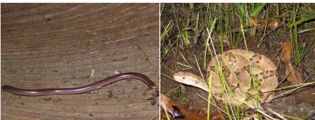
Ilustração 45: Typhlops brongersmianus e Bothrops moojeni