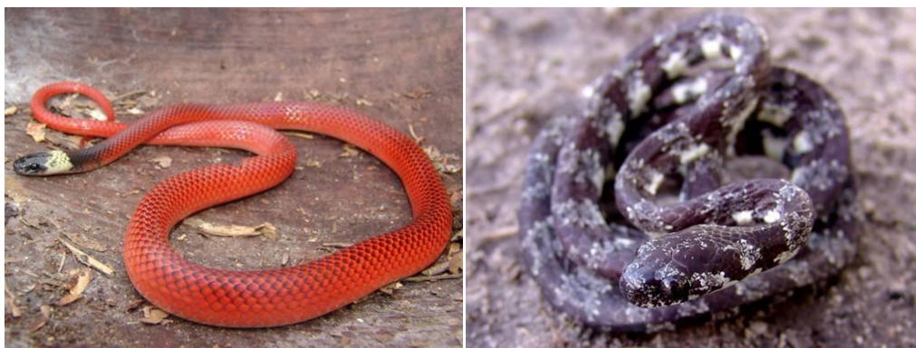
Ilustração 40: Clelia plúmbea e Dipsas indica