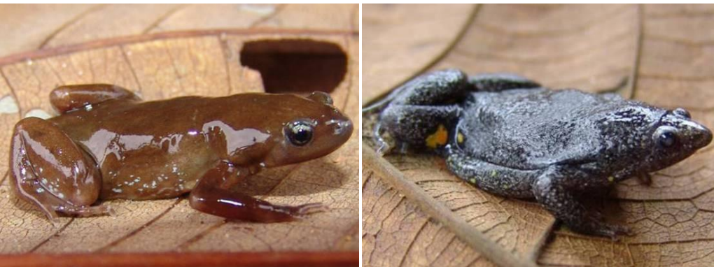
Ilustração 22: Chiasmocleis albopunctata e Elachistocleis cf. ovalis