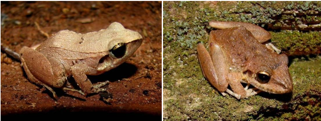
Ilustração 24: Barycholos ternetzi e Pristimantis fenestratus