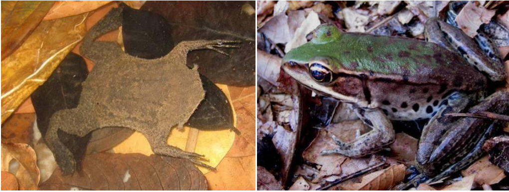
Ilustração 23: Pipa pipa e Lithobates palmipes