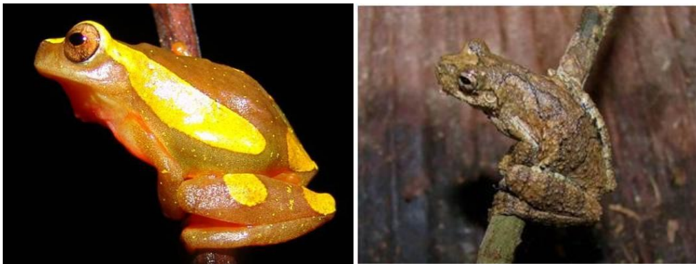
Ilustração 5: Dendropsophus leucophyllatus e Dendropsophus melanargyreus