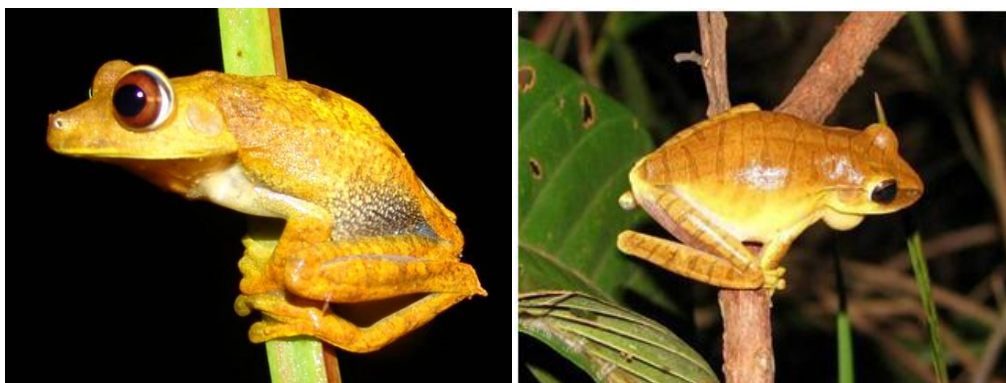
Ilustração 9: Hypsiboas geographicus e Hypsiboas multifasciatus