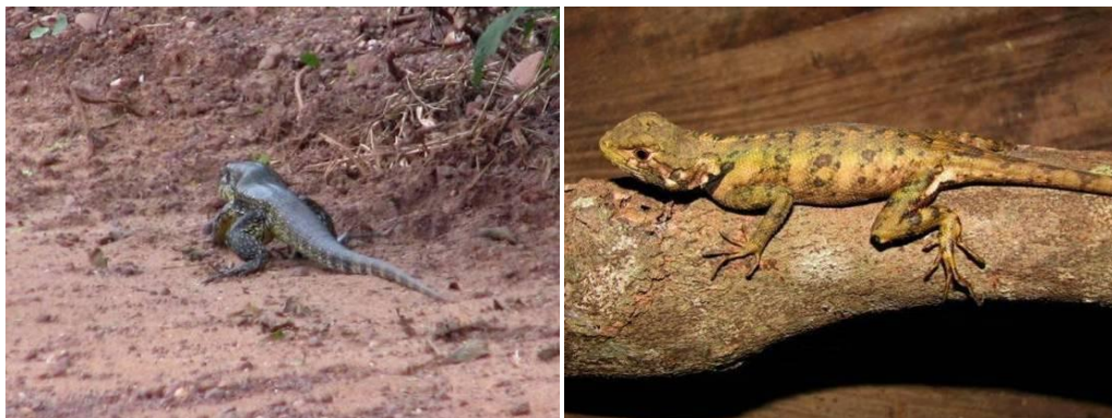
Ilustração 34: Tupinambis teguixin e Plica umbra