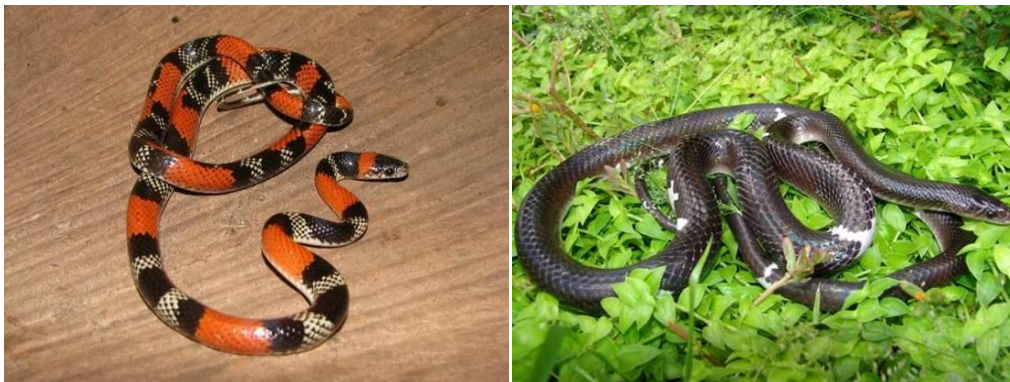
Ilustração 43: Oxyrhopus trigeminus e Pseudoboa nigra