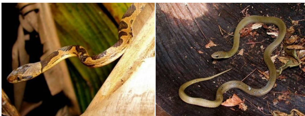
Ilustração 41: Leptodeira annulata e Liophis poecilogyrus