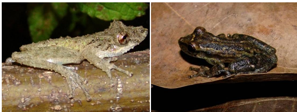
Ilustração 13: Scinax nebulosus e Scinax gr. ruber 1