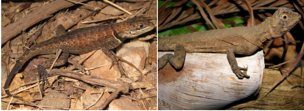
Ilustração 35: Tropidurus oreadicus e Uranoscodon superciliosum