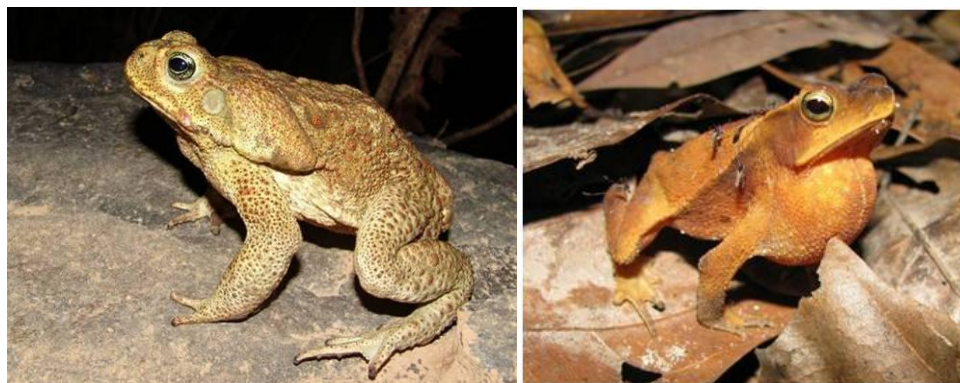
Ilustração 2: Rhinella marina e Rhinella margaritifera