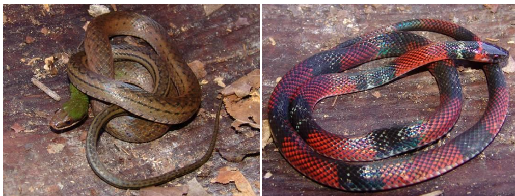
Ilustração 42: Liophis reginae e Oxyrophus melanogenys