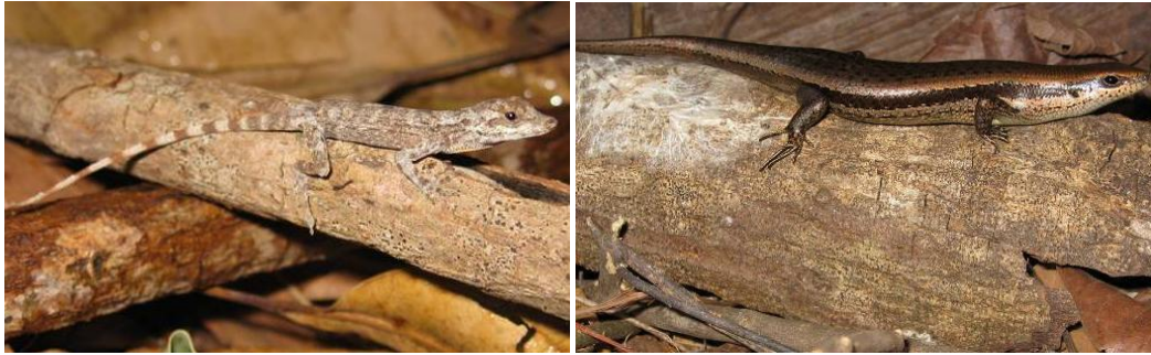
Ilustração 31: Anolis ortonii e Mabuya bistriata