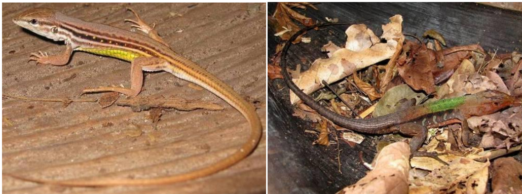
Ilustração 33: Cnemidophorus cf. mumbuca e Kentropyx calcarata