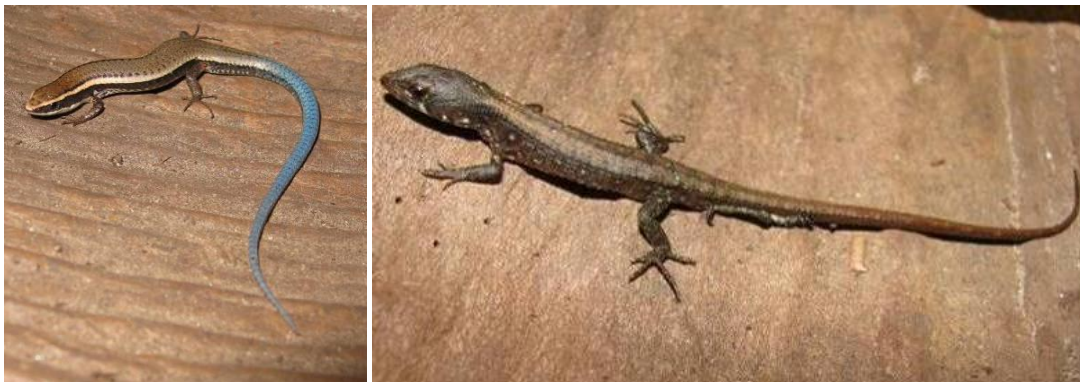
Ilustração 29: Micrablepharus maximiliani e Potamites ecpleopus