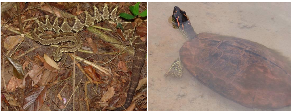
Ilustração 46: Crotalus durissus e Rhynoclemmys punctularia