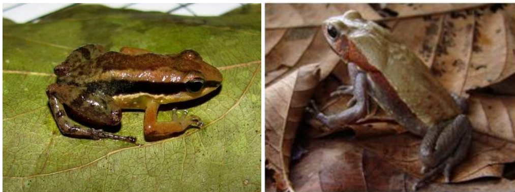
Ilustração 1: Allobates aff. Brunneus e Rhaebo guttatus