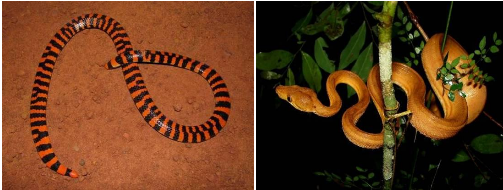
Ilustração 36: Anilius scytale e Corallus hortulanus