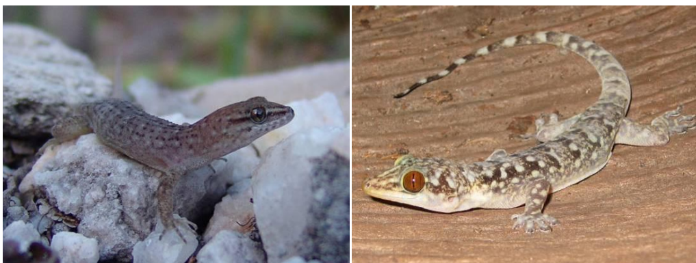
Ilustração 26: Gymnodactylus amarali e Phyllopezus pollicaris