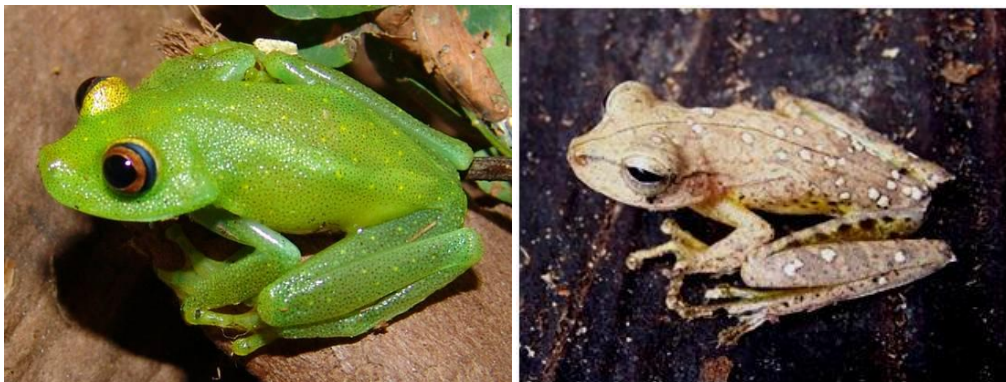
Ilustração 8: Hypsiboas cinerascens e Hypsiboas fasciatus