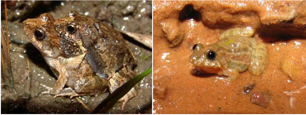
Ilustração 15: Physalaemus sp. e Pseudopaludicola sp1