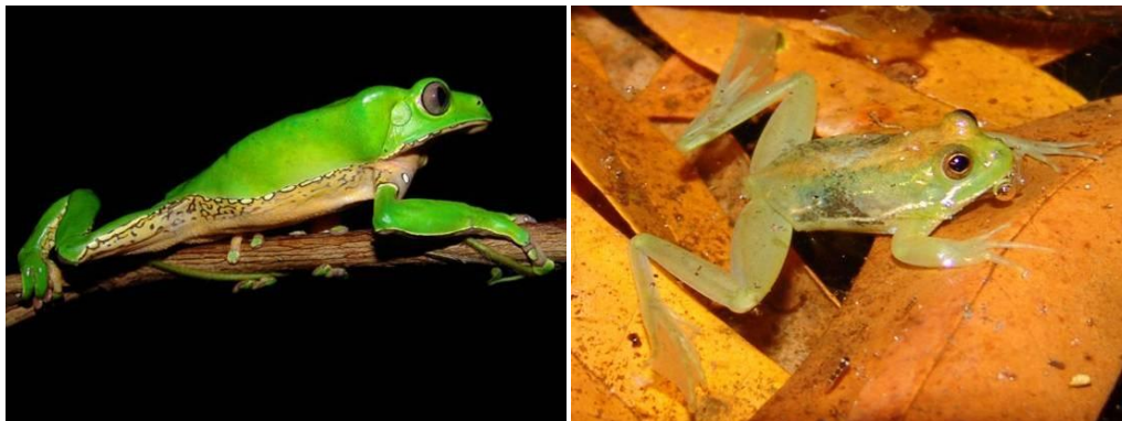
Ilustração 12: Phyllomedusa bicolor e Pseudis caraya