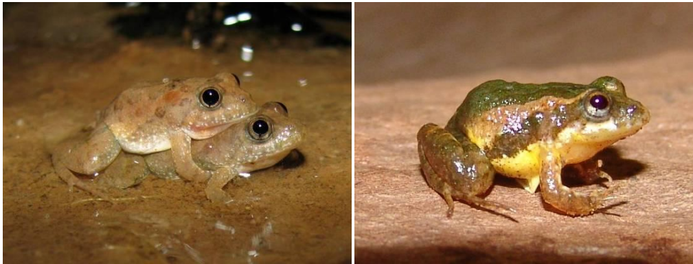
Ilustração 16: Pseudopaludicola sp. 2 e Pseudopaludicola sp. 3