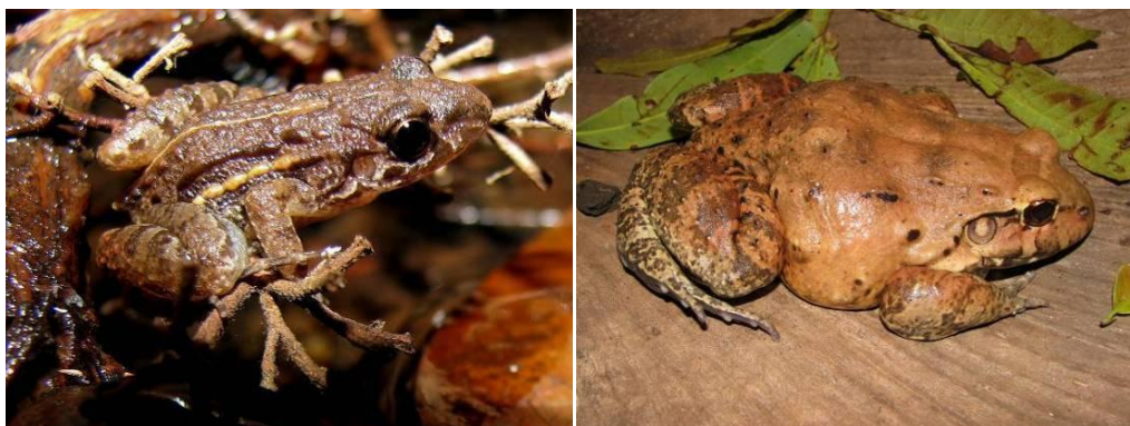
Ilustração 18: Leptodactylus hylaedactylus e Leptodactylus cf. vastus