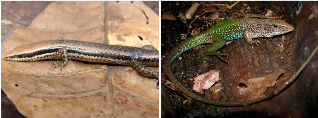
Ilustração 32: Mabuya frenata e Ameiva ameiva