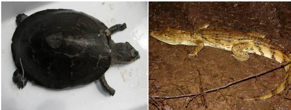
Ilustração 47: Podocnemis expansa e Caiman crocodilus