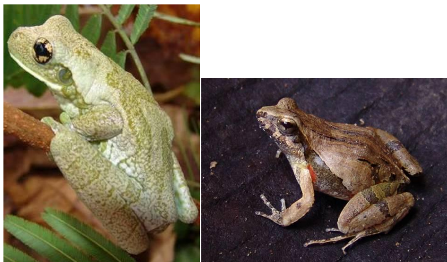
Ilustração 14: Trachycephalus venulosus e Physalaemus cuvieri