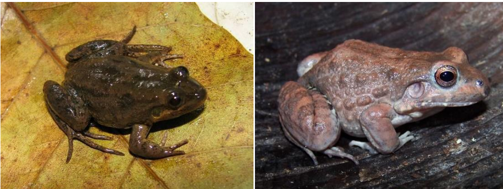
Ilustração 21: Leptodactylus pustulatus e Leptodactylus siphax