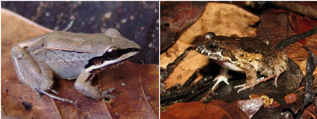
Ilustração 20: Leptodactylus mystaceus e Leptodactylus petersii