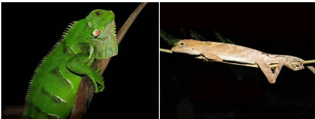
Ilustração 30: Iguana iguana e Anolis chrysolepis