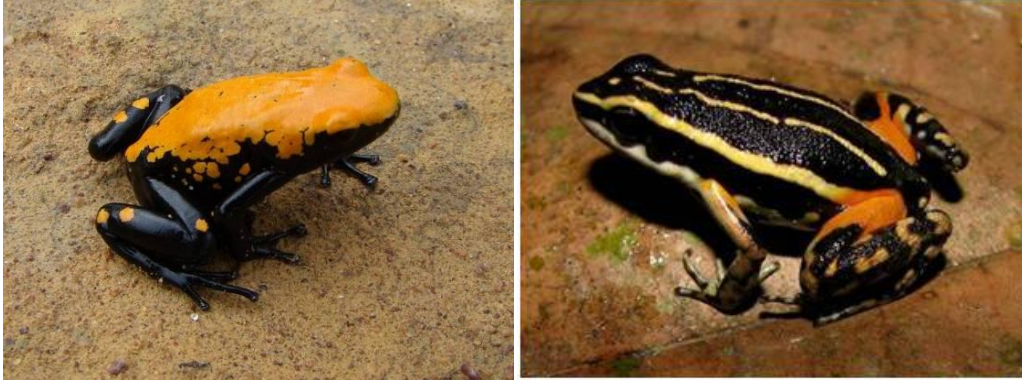
Ilustração 4: Adelphobates galactonotus e Ameerega aff. Bracatta