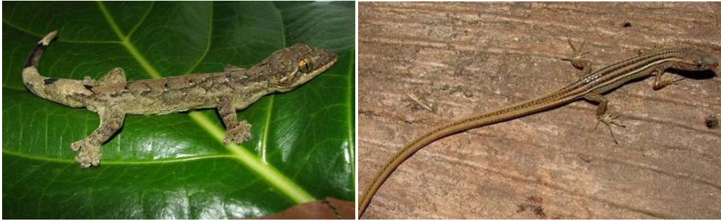
Ilustração 27: Thecadactylus rapicauda e Cercosaura ocellata