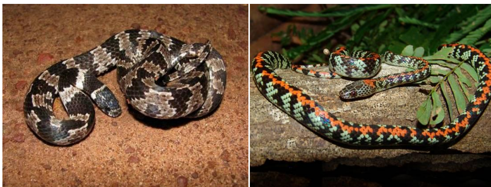
Ilustração 44: Sibynomorphus mikanii e Siphlophis cervinus