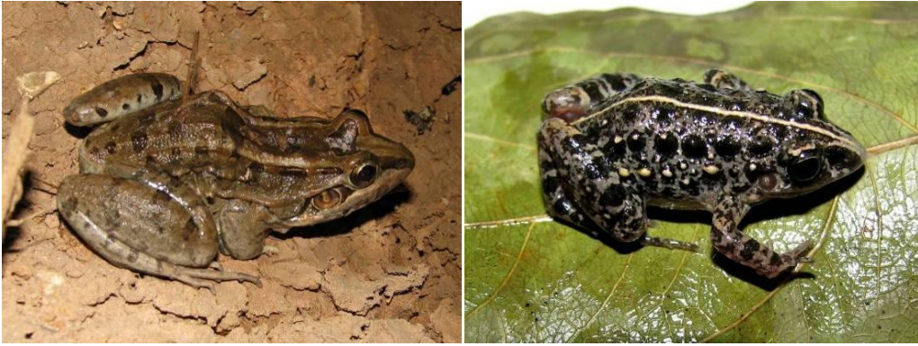
Ilustração 19: Leptodactylus aff. macrosternum e Leptodactylus martinezi