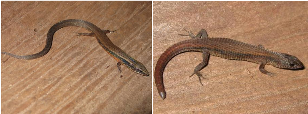
Ilustração 28: Colobosaura modesta e Leposoma percarinatum