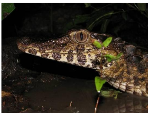
Ilustração 50: Paleosuchus trigonatus