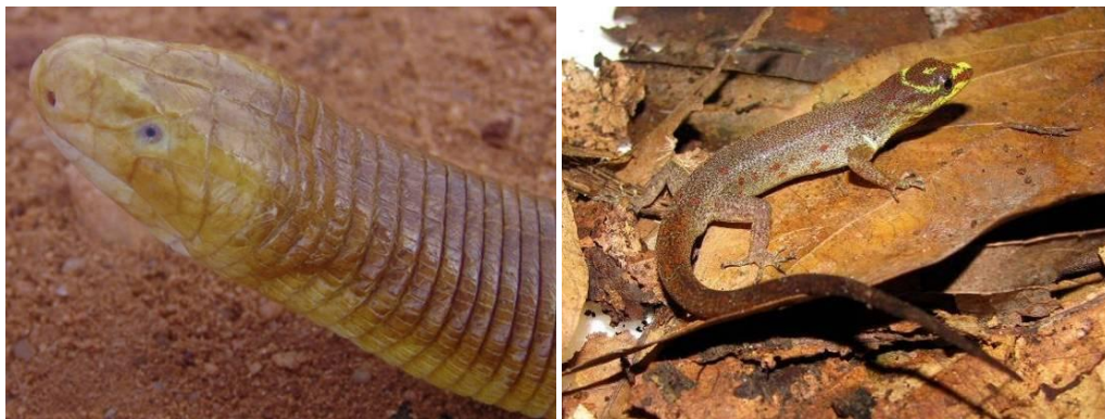
Ilustração 25: Amphisbaena alba e Gonatodes humeralis