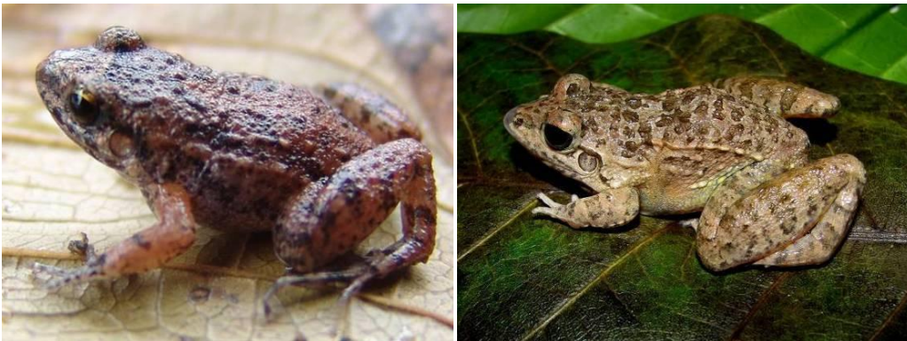
Ilustração 17: Leptodactylus aff. Andreae e Leptodactylus fuscus