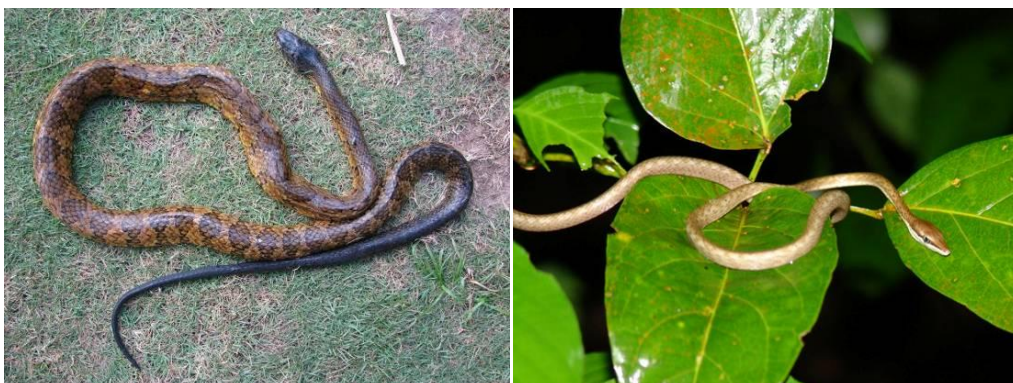
Ilustração 38: Mastigodryas bifossatus e Oxybelis aeneus