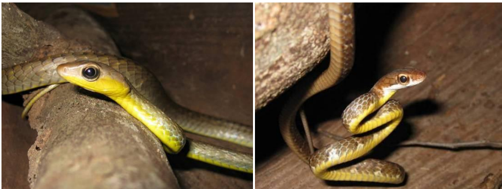
Ilustração 37: Chironius exoletus e Chironius fuscus