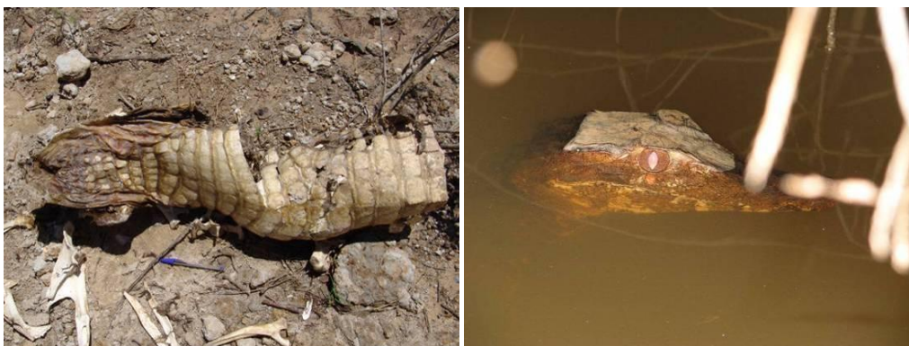
Ilustração 48: Carcaça de Melanosuchus niger e Paleosuchus palpebrosus