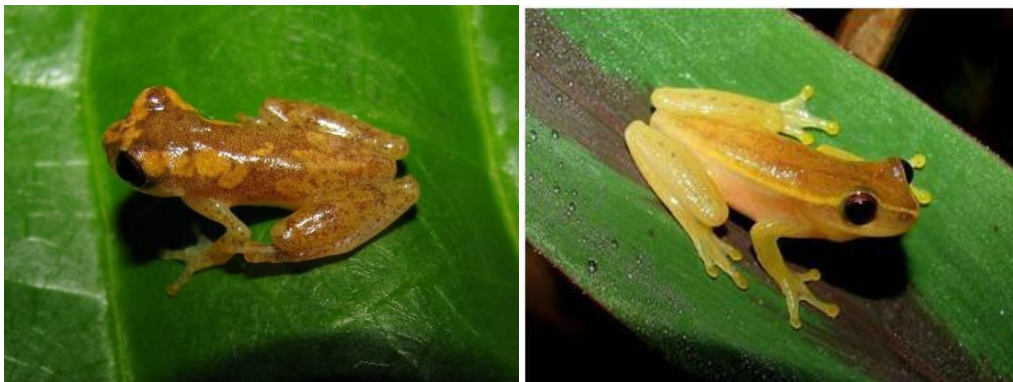
Ilustração 6: Dendropsophus cruzi e Dendropsophus aff. Nanus