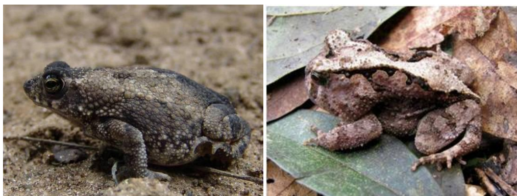
Ilustração 3: Rhinella mirandaribeiroi e Proceratophrys concavitympanum