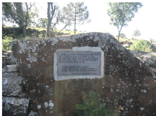
Figura 20 e 21: Caminho para as fazendas do Pouso e da Guarda Velha. Os cemitérios centenários, três somente na estrada, datados do primeiro quartel do século XIX. Compõem o cenário e conjunto paisagístico cultural.