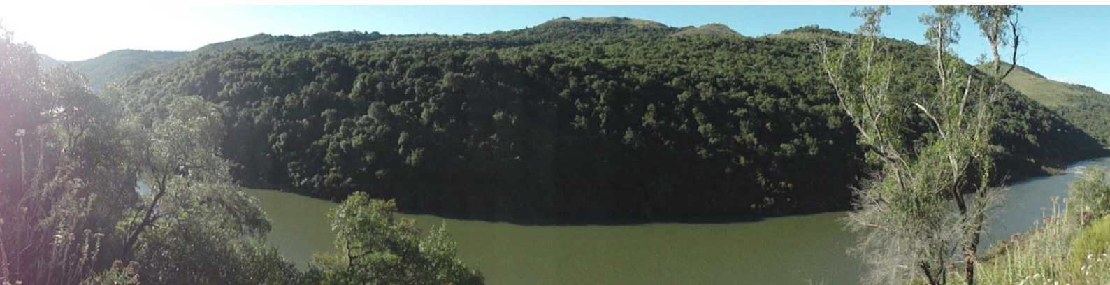
Figura 13: Vista panorâmica do rio Pelotas. Ao centro da fotografia o Passo de Santa Vitória. A esquerda está a confluência do rio dos Touros com o Pelotas. Nas duas margens é possível visualizar as diferenças no nicho ecológico, paisagens e áreas de apropriação do homem pré-histórico e histórico neste ambiente, que foi no passado densamente ocupado.

altura dos muros varia, entre 60 cm a 1 metro. A largura dos muros foi estimada entre 40 a 60 cm. Vislumbram-se processos construtivos diferenciados, entre as ruínas.