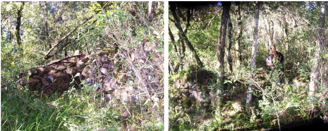
Figura 16 e 17: Fotografia à esquerda, ruínas do sítio Registro de Santa Vitória, próximo aos terracetes.

Consciência Consultoria Científica Ltda.