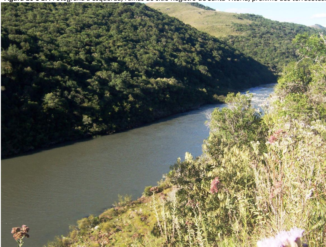
Figura 18 e 19: Vista do Registro de Santa Vitória para o rio Pelotas, na confluência do rio dos Touros.