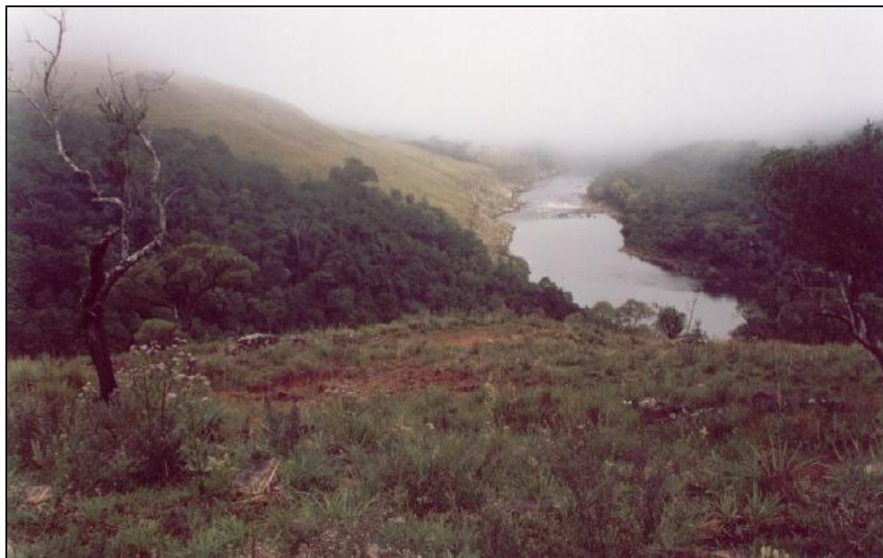
Figura 5: Imagem dos remanescentes, ruínas dos corredores de taipa no caminho das tropas, junto ao Registro de Santa Vitória.