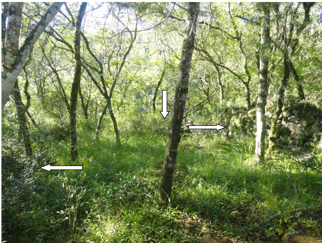
Figura 10: Dentro do sítio avistam-se as ruínas nas laterais e logo abaixo, descendo para a encosta. Existe uma saída para cada lado do sítio, que demonstram serem antrópicas. A vegetação recobre o sítio, mas dentro da área edificada, está menos densa. É possível caminhar na lateral direita e lateral esquerda do sítio.

Consciência Consultoria Científica Ltda.