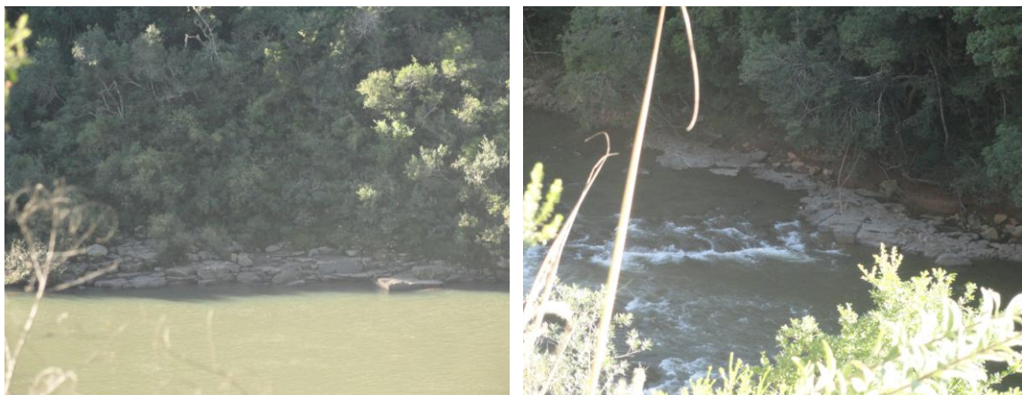
Figura 14 e 15: Fotografia à esquerda, sítio Passo de Santa Vitória, no rio Pelotas, avistado logo abaixo dos patamares, terracetes do Registro. Fotografia à direita, local de afloramento semelhante ao Passo, mas no rio dos Touros há 50 metros da confluência com o Pelotas. Vindo da Fazenda Guarda-Velha, poder-se-ia no passado tropeiro passar por este local para chegar ao Registro de Santa Vitória e dali seguir para o Passo de Santa Vitória.