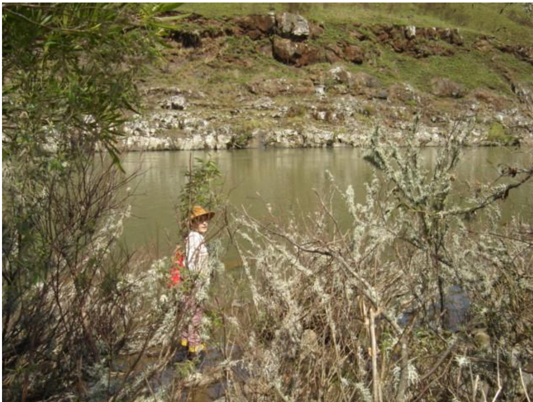
Figura 32: Arqueóloga, vistoriando a margem catarinense do rio Pelotas, junto ao Sítio Passo de Santa Vitória (SC – PQ – 04).

mangueiras visíveis e ainda conservadas. Foram fotografadas as estruturas existentes e os aspectos mais significativos do sítio.