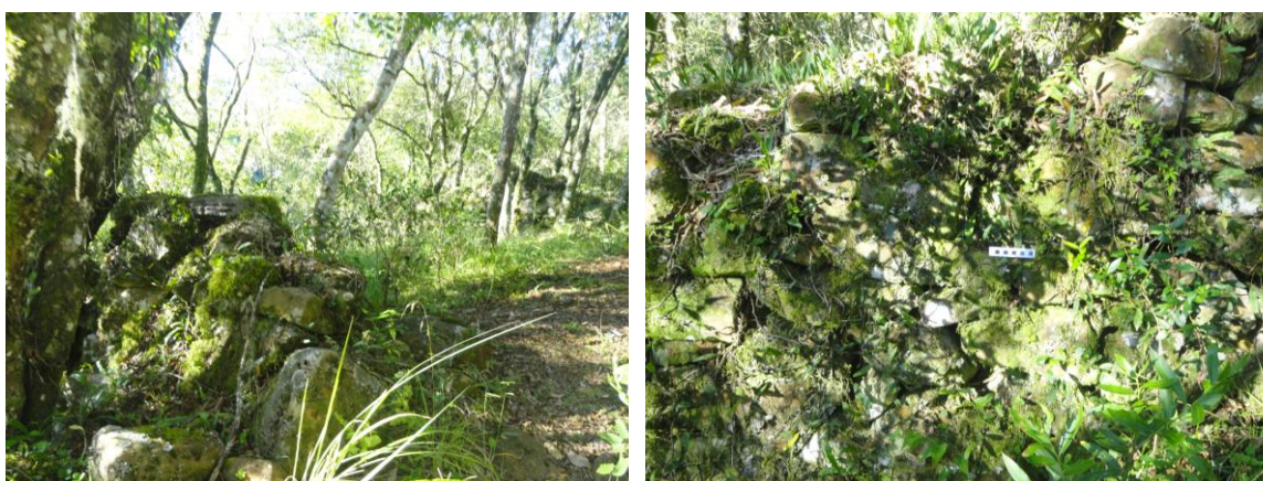
Figura 11 e 12: As duas entradas do sítio estão alinhadas, de um lado chega-se ao rio Pelotas e do outro se chega ao rio dos Touros. De uma entrada a outra entre as áreas de ruínas tem 27 metros de largura. A