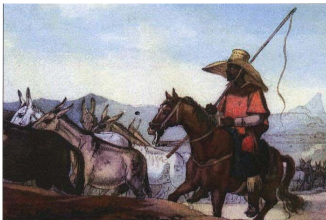
Figura 1 – Aquarela do Pintor Francês Jean Batiste Debret, na obra Viagem Pitoresca e Histórica ao Brasil, 1º. E 2º. Volumes. Fonte: DEBRET, Jean Batiste. Ed. Itatiaia.

Consciência Consultoria Científica Ltda.