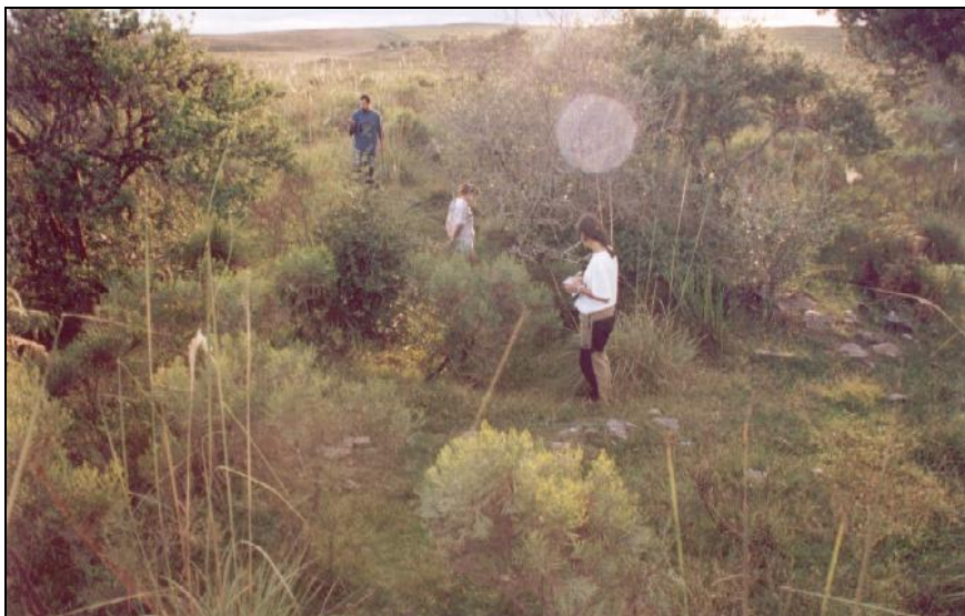
Figura 27: Estrutura de mangueira com banho para animais dentro de um trecho do corredor do caminho das tropas.