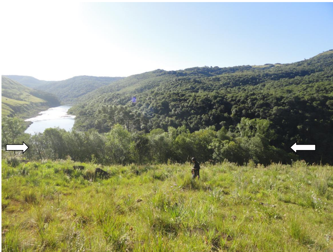
Figura 7: Imagem da vegetação que recobre o sítio registro de Santa Vitória. O nicho ecológico está bem delimitado na área dos remanescentes físicos.

Consciência Consultoria Científica Ltda.