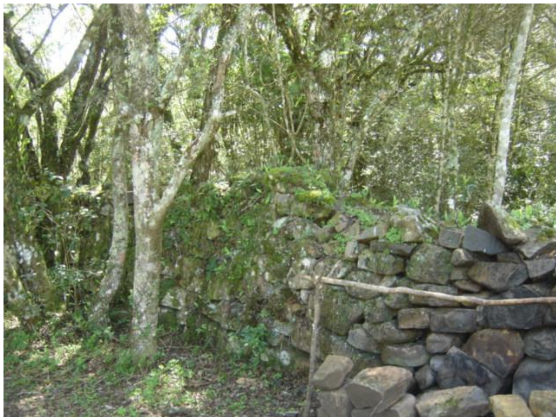
Figura 29: Muros de taipa sem argamassa, que formam conjuntos de mangueiras entre o platô e o peral de chegada ao sítio Passo de Santa Vitória no rio Pelotas. Este rio no passado era denominado rio dos Infernos.

Consciência Consultoria Científica Ltda.