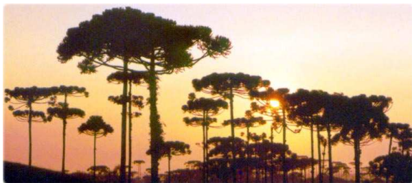
Por do Sol na Coxilha Rica