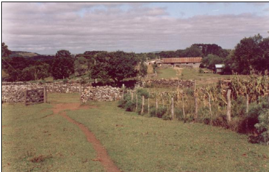
Figura 26: A sede da Fazenda da Guarda Velha, ponto importante do antigo caminho das tropas. Registrado como sítio arqueológico RS-PQ-34. Fonte: COPÉ. (Org) Levantamento Arqueológico na Área Diretamente Afetada da UHE Pai Querê, SC/RS. Relatório Final 01: Levantamento Arqueológico da margem esquerda do rio Pelotas, RS. Florianópolis: Consórcio Pai Querê, UFRGS/IFCH/NUPARq, Scientia Ambiental, jun. 2004, P. 71.

um trabalho de georeferenciamento do antigo caminho até o rio dos Touros, para compor aos mapas atuais do caminho dos tropeiros.