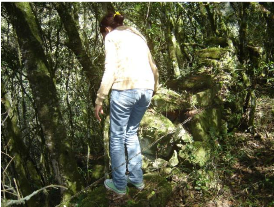
Figura 30 e 31: Detalhe dos muros de taipa que fazem parte do sítio Passo Santa Vitória, Lages/SC. Vista do calçamento, em degraus de pedra que dá acesso aos muros de taipa, e ao rio Pelotas.

Consciência Consultoria Científica Ltda.