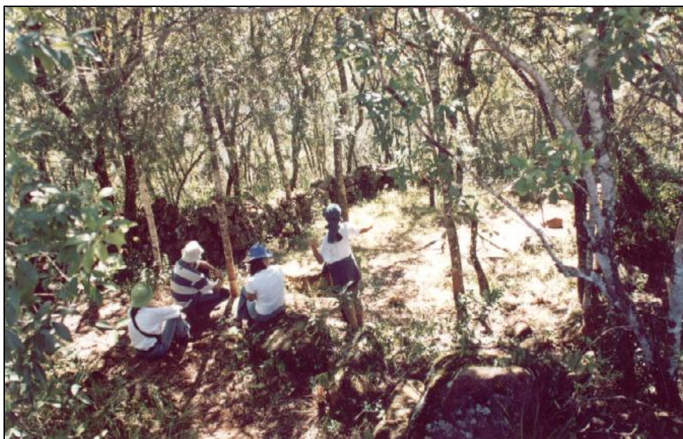
Figura 3: Equipe de Pesquisa do Levantamento Arqueológico dentro da área do sítio Registro de Santa Vitória (sítio RS-PQ-18), com ruínas, remanescentes físicos.

[...] desempenhou um importante papel no cenário econômico e social do Rio Grande do Sul durante o período colonial. Funcionou como um posto de "pedágio" e sua função não ficou limitada a arrecadação de tributos para os 53 cofres da coroa portuguesa, sobre os produtos, principalmente o gado vacum e muar, que por ele passavam, mas também, através deste posto pretendia-se controlar o trânsito de pessoas, evitando a passagem de desertores. (COPÉ, 2004, p. 77-78, In Herberts, 2009)