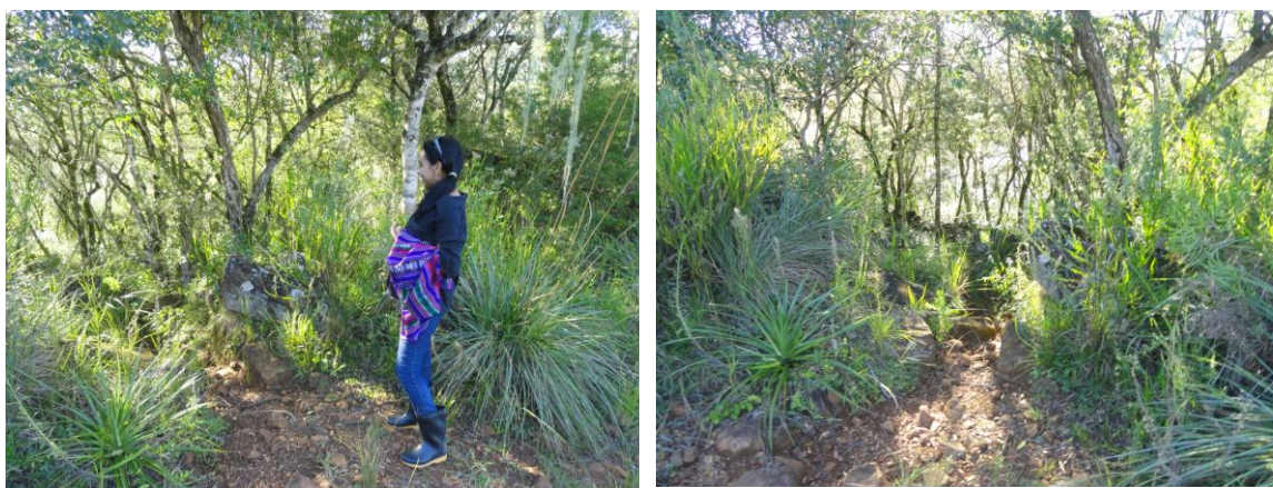
Figura 8 e 9: Entrada na área do sítio. Existe um caminho que leva a entrada do sítio. Depois se segue no mesmo caminho até a descida do rio. A vegetação recobre o sítio, mas dentro dele, é possível caminhar para os lados e logo abaixo. Não é possível descer pelos patamares, pois a encosta é demasiada íngreme.