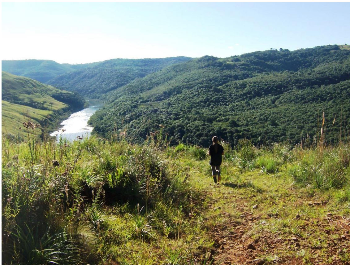
Figura 6: Imagem do rio Pelotas, ao fundo, e o caminho que leva ao sítio do registro de Santa Vitória. Do lado esquerdo, há 50 metros de caminhada é possível avistar o rio dos Touros, e o Passo de Santa Vitória. A direita existe um caminho que leva até a margem do rio Pelotas.

Consciência Consultoria Científica Ltda.