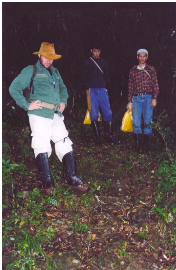
Figuras 33, 34, 35: Corredor de acesso entre o conjunto de mangueiras e o rio Pelotas, em degraus de pedra. Vista do calçamento de pedra no acesso entre o conjunto de mangueiras e o rio Pelotas.