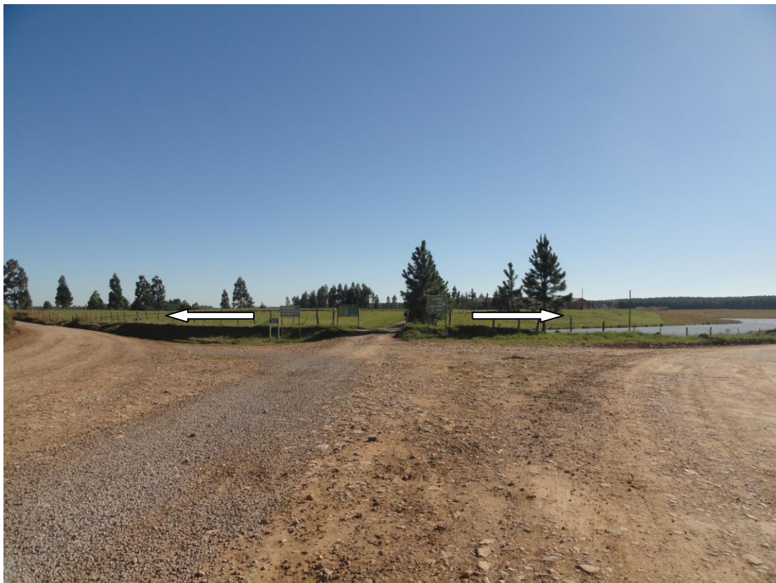
Figura 2: Chegando a bifurcação, o caminho da direita para chegar ao Registro de Santa Vitória e a esquerda para as Fazendas do Pouso e da Guarda Velha.

No entanto, além da ruína do prédio da guarda e coletoria, outras construções se fazem evidentes no entorno do registro. Há grandes currais na atual Fazenda da Guarda, na margem direita do Rio dos Touros (já apontados no tópico 4.3 deste capítulo) e na margem direita do Rio Pelotas, município de Lages/SC, onde, além dos currais, há um corredor calçado com basalto. (Silva, 2006, p. 166)