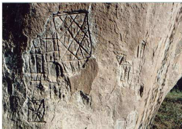
Morro do Avencal – Parte esquerda do painel de gravuras.