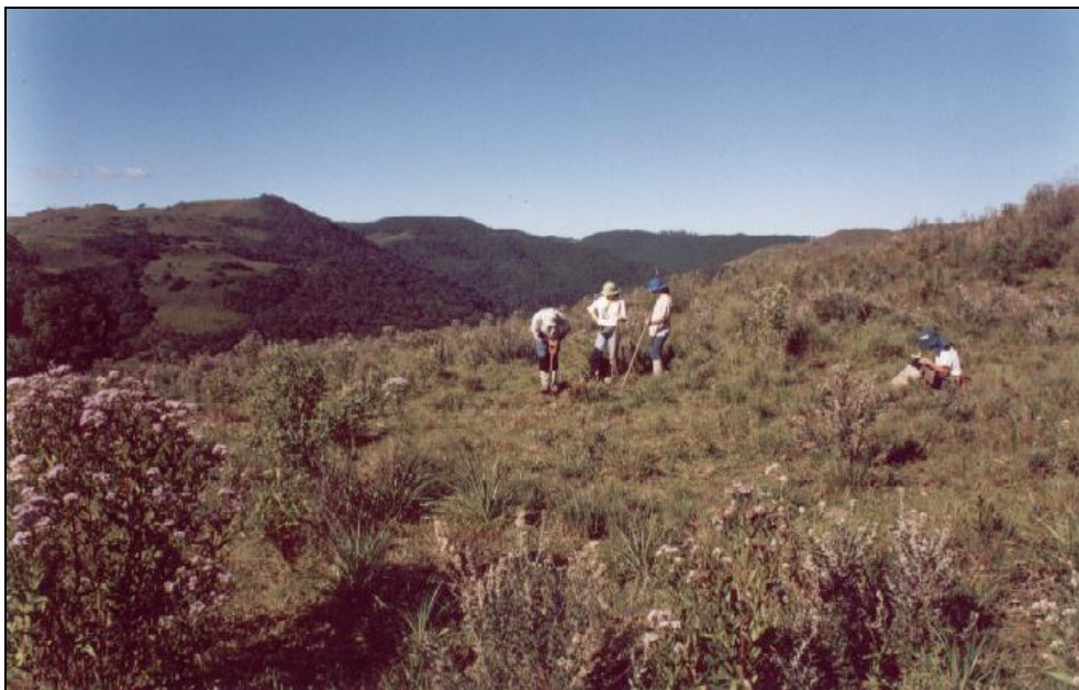
Figura 4: Ainda nos arredores do Registro, fazemos uma sondagem em área plana, sem encontrar vestígios arqueológicos.

Consciência Consultoria Científica Ltda.