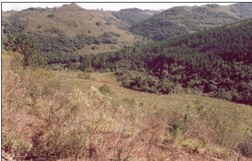
Figura 28: Área de prospecção denominada UP55.01. Trecho com patamares entre o Registro e o rio Cerquinha.

Próximo ao ponto UP 55-01/01, Copé (2004), relata que do outro lado da estrada interna, a cobertura vegetal é composta por vegetação rasteira e mata nativa. Foi aberta uma sondagem de 55 X 55 cm onde o sedimento apresentou-se argiloso, de textura argilo-arenosa e marrom escuro. A sondagem foi até 25 cm de profundidade. Devido à baixa densidade de material arqueológico, esta área foi identificada como local de ocorrência e não sítio arqueológico.