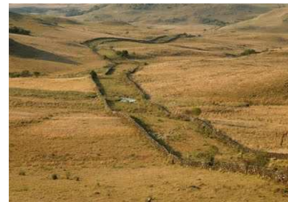
Imagem do Caminho das Tropas, utilizado para o transporte de gado de Viamão (RS) a Sorocaba (SP).

Municípios: Lages e São Joaquim - SC E Bom Jesus - RS