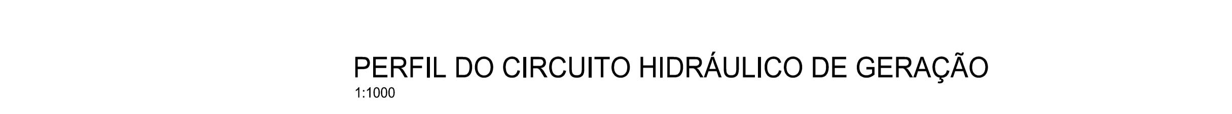
PERFIL DO CIRCUITO HIDRÁULICO DE GERAÇÃO 1:1000