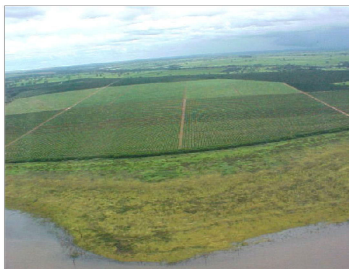
Foto 45 - Área de cultivo na margem esquerda do reservatório