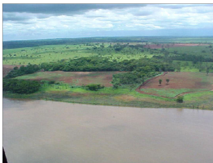
Foto 42 - Vista da margem esquerda do reservatório