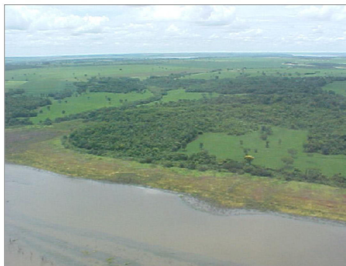
Foto 44 - Margem direita do reservatório