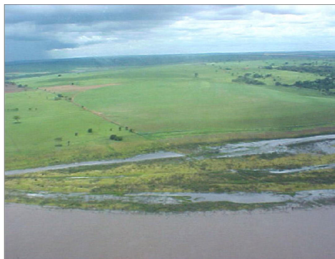
Foto 43 - Margem do reservatório