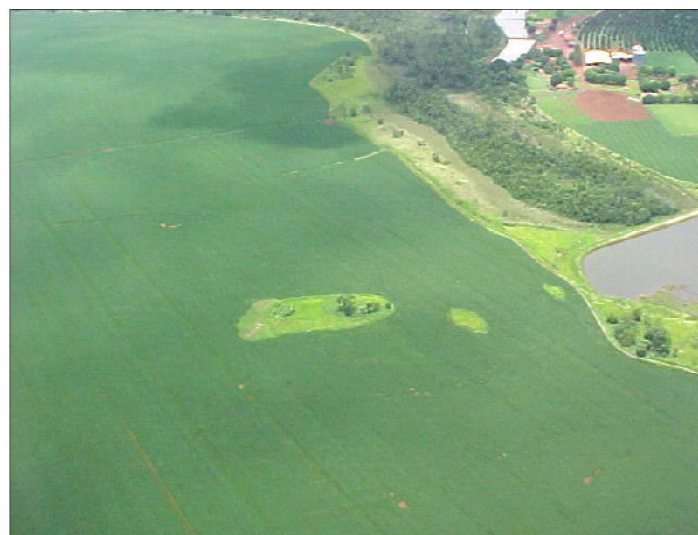
Foto 37 - Área de cultivo