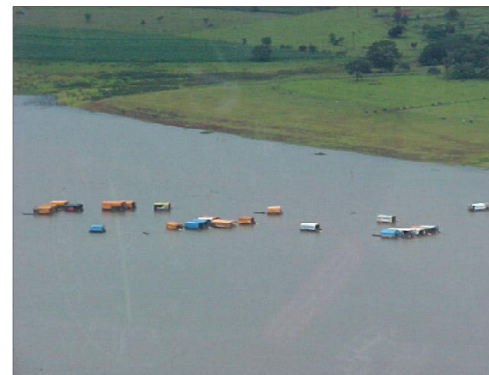
Foto 46 - Exploração mineral no leito do rio Grande