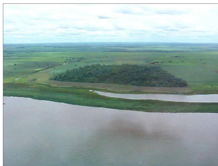
Foto 39 - Fragmento de mata na margem esquerda do reservatório