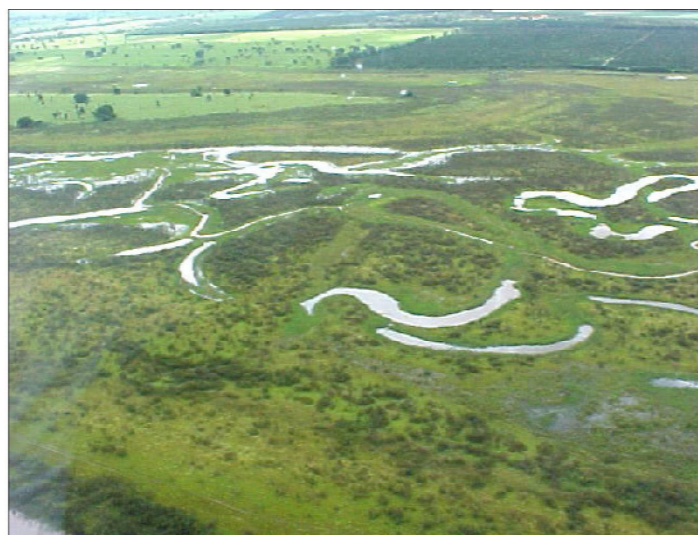
Foto 40 - Área de inundação