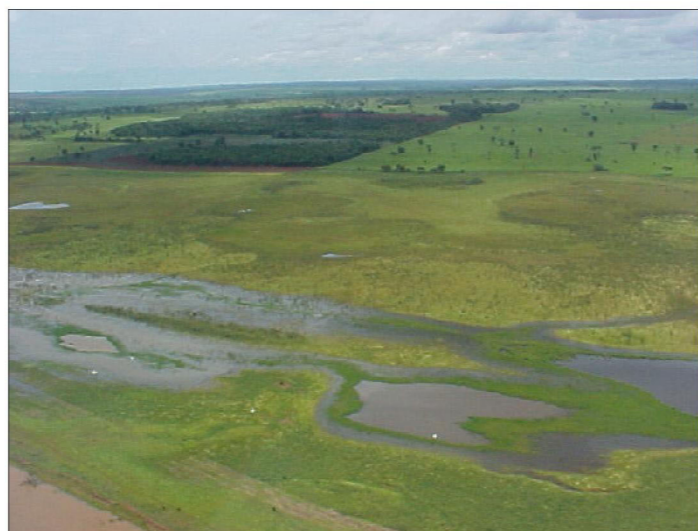
Foto 41 - Área de inundação