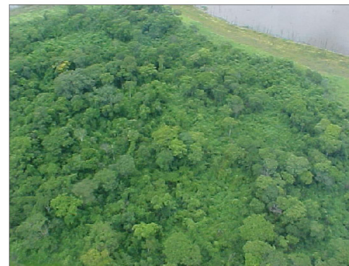
Foto 47 - Fragmento de mata