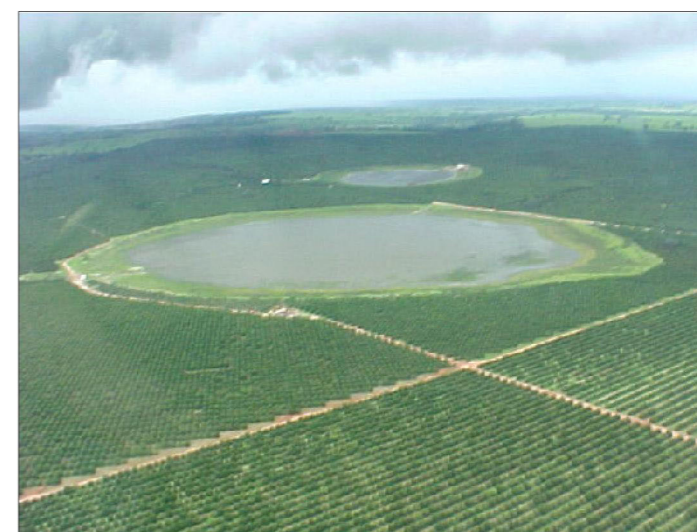
Foto 48 - Área de cultivo e lagoa temporária