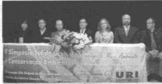
Evento: Inauguração e abertura à discussão ambiental de Depoimentos.

Cum o objetivo de analisar a tecnologia e o meio ambiente, a URI-Campus de Erechim está realizando o Quinto Simpósio Sul de Gestão e Conservação Ambiental. O evento engloba, ainda, a XX Semana Alto Uruguai do Meio Ambiente e o Encontro do Coletivo Educador do Alto Uruguai Gaúcho.