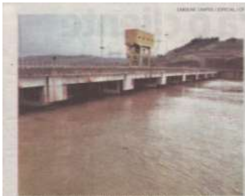
Lago de Machadinho atingiu apenas 29,5% da capacidade máxima

Texto Enviado pela assessoria de comunicação do Consórcio Machadinho