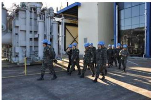
Exército visita UHMA