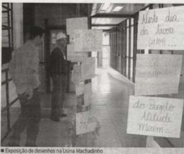
■ Exposição de desenhos na Usina Machadinho

Os desenhos que fazem parte da exposição foram criados por crianças que participam do Projeto Atitude Mirim, desenvolvido pelo CRAS - Centro de Referência em Assistência Social de Maximiliano de Almeida.