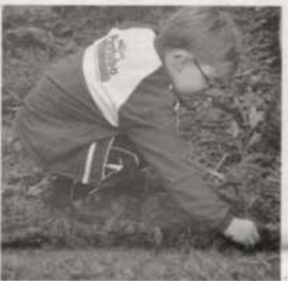
Aprendendo desde cedo

Em outras ações a equipe de educação ambiental também fala sobre a restauração ecológica da Faixa Ciliar e ministra palestras, como a de Harmonia Ambiental, que aborda as formas de utilização dos recursos naturais; a de Importância e Conscientização da Flora, que fala sobre como tratar e recuperar a flora; a de Importância da Água e a de Resíduos Sólidos. Nestes encontros, os alunos recebem todo o material de divulgação dos programas de educação ambiental da Usina Hidrelétrica Machadinho.