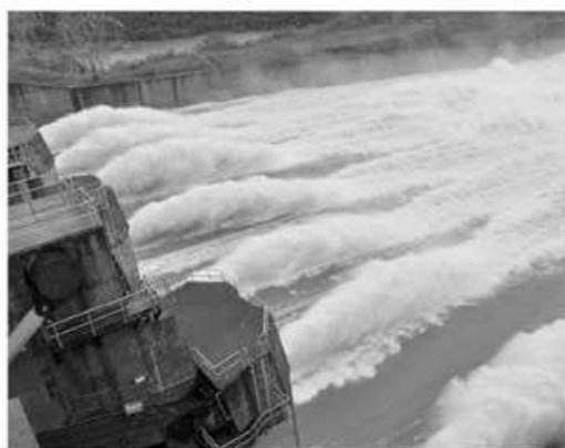
▣ VALOR é referente a compensação da utilização de recursos

Piratuba - Os municípios da área de abrangência da Usina Hidrelétrica Machadinho receberam em agosto aproximadamente R$ 2,1 milhões a título de compensação financeira. O valor foi dividido entre o governo federal, governos do Rio Grande do Sul e Santa Catarina e municípios limieiros.