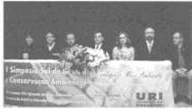
DIVERSAS LIDERANÇAS ACADÊMICAS E CNIS PRESTIGIARAM ABERTURA DO SIMPÓSIO