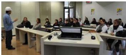
Participantes do Simpósio de URI visitam UHMA

Integrantes do Exército Brasileiro e participantes do Simpósio Sul de Gestão e Conservação Ambiental realizado pela URI – Universidade Regional Integrada – campus Erechim, visitaram nesta quinta-feira, dia 01 de setembro, a Usina Hidrelétrica Machadinho.