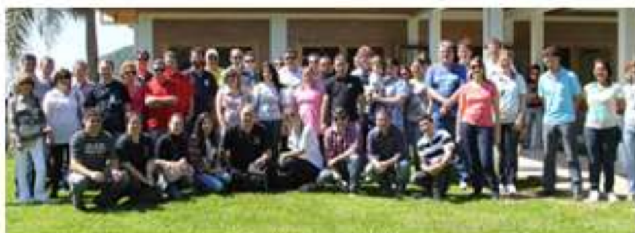
Comunicadores em Piratuba

22/11 - No último sábado (19) o Consórcio Machadinho promoveu o II Encontro de Confraternização da Imprensa Regional. Ao todo participaram mais de 50 comunicadores representando 20 meios de comunicação de toda a região abrangida pela Usina Hidrelétrica Machadinho.