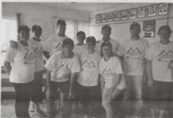
Doadores foram homenageados pelo Consórcio Machadinho

Na ocasião o Consórcio Machadinho distribuiu a cada doador