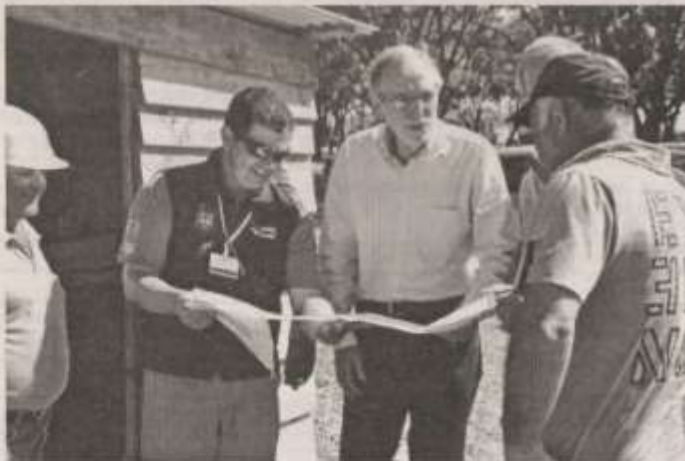
BRIGADA MILITAR MACHADINHO