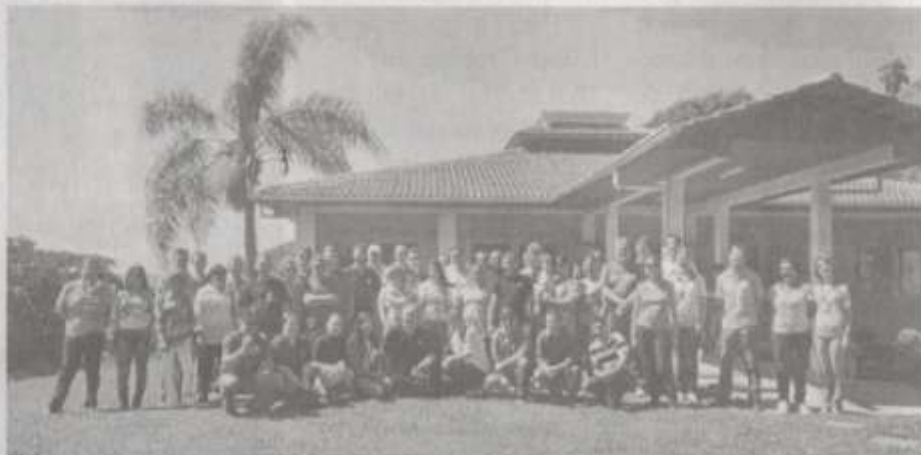
Pelo segundo ano consecutivo o Consórcio Machadinho proporciona encontro entre a imprensa regional

Para obter mais informações sobre a Usina Hidrelétrica Machadinho acesse www.machadinho.com.br . Já para conhecer o trabalho do Centro de Referência em Desenvolvimento Sustentável, ligue para a Secretaria de Educação de Piratuba no número (49) 3553-0078.