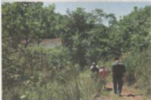
Passeio por trilha fez parte da programação de visita

No último sábado (19) o Consórcio Machadinho promoveu o II Encontro de Confraternização da Imprensa Regional. Ao todo participaram mais de 50 comunicadores representando 20 meios de comunicação de toda a região abrangida pela Usina Hidrelétrica Machadinho.