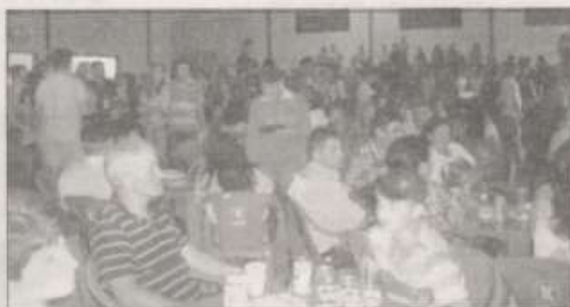
Mais de 800 pessoas participaram da festa

Municípios de circulação do jornal: Vermelha, Sananduva, São José do Ouro, Ibiraiaras, Ibiçá, Cacique Doble, Barracão, Machadinho , Paim Filho, São João da Urtiga, São Jorge, Tupanci do Sul, Santo Expedito do Sul, Caseiros, André da Rocha, Capão Bonito do Sul e Maximiliano de Almeida .