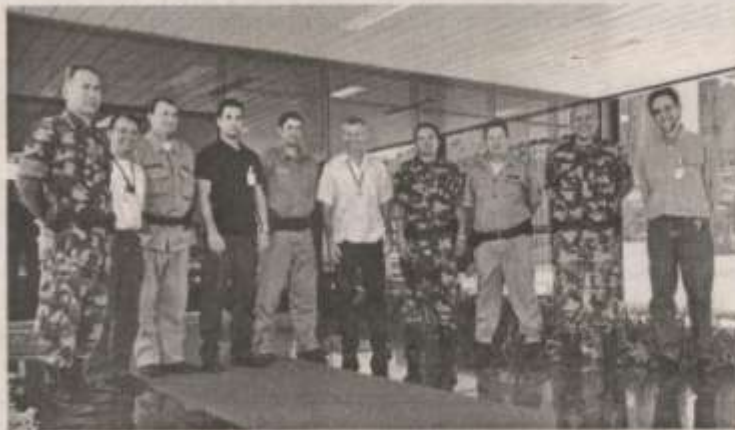
PARTICIPARAM DO TREINAMENTO SEIS POLICIAIS AMBIENTAIS DO RIO GRANDE DO SUL E DE SANTA CATARINA

Este mesmo treinamento já foi disponibilizado para outros policiais ambientais, além de funcionários do Ibama (Instituto Brasileiro de Meio Ambiente), Fatma (Fundação do Meio Ambiente de Santa Catarina) e Fepam (Fundação Estadual de Proteção Ambiental do Rio Grande do Sul). Para conhecer mais sobre as ações do Consórcio Machadinho acesse o site: www.machadinho.com.br