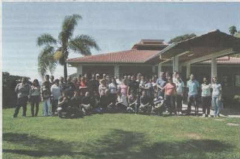
Foto especial do grupo no Centro de Referência em Desenvolvimento Sustentável

O objetivo central do encontro foi estreitar os laços entre os meios de comunicação e o Consórcio Machadinho. “Buscamos a aproximação com toda a comunidade e isto também inclui a mídia local. Este evento é uma forma de aprimorar o relacionamento