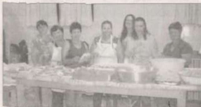
Cozinheiras da festa em São Caetano

Esta é mais uma obra viabilizada devido à implantação da Usina Hidrelétrica Machadinho. Mais informações podem ser obtidas através do site: www.machadinho.com.br