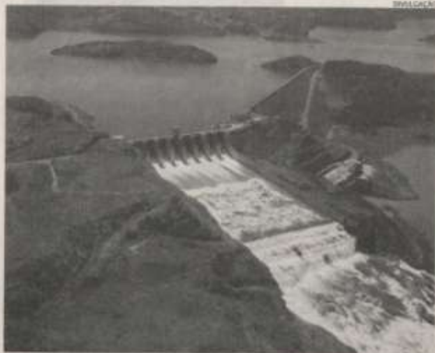
CONSÓRCIO Machadinho repassou R$ 171 milhões em nove anos