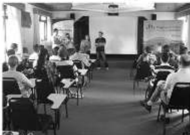
© O ENCONTRO com a imprensa foi realizado no Hotel Vila Germânica.

Piratuba- O Consórcio Machadinho realizou no sábado, dia 19, o II Encontro de confraternização regional da imprensa. O evento aconteceu no Hotel Vila Germânica.