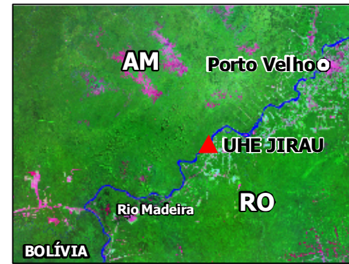
Enquadramento Geográfico Regional