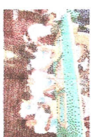
Atividades para alunos de Jaci-Paraná no Centro Integrado de Educação Ambiental