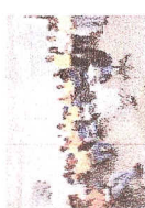
Cobertura de etapas do curso de Formação para Líderes.