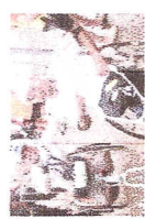
Apoio ao paraatleta de Jirau para participar da Corrida de Reis, em Cuiabá.