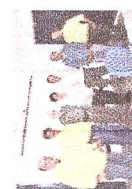
Acompanhamento da visita de Dom Geraldo Verdier à obra