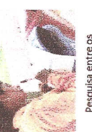
Pesquisa entre os alojados sobre as condições do local