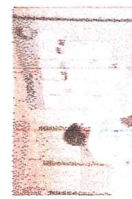
Produção e divulgação dos textos para o jornal mural da obra