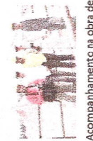
Acompanhamento na obra de jornalistas do jornal 'Crítica de Camargo Corrêa' às obras da UHE Jirau