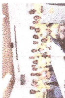
Reconhecimento aos profissionais que participaram do Dia do Bem Fazer