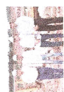
Cobertura e acompanhamento da auditoria realizada em Jirau nos dias 18 a 22/01.