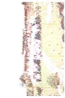
Atividades para alunos de Jaci-Paraná no Centro Integrado de Educação Ambiental