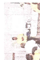
Cobertura de treinamentos para os profissionais da obra: direção defensiva