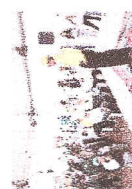
Visita de diretores da ESBR e da Camargo Corrêa a Jirau