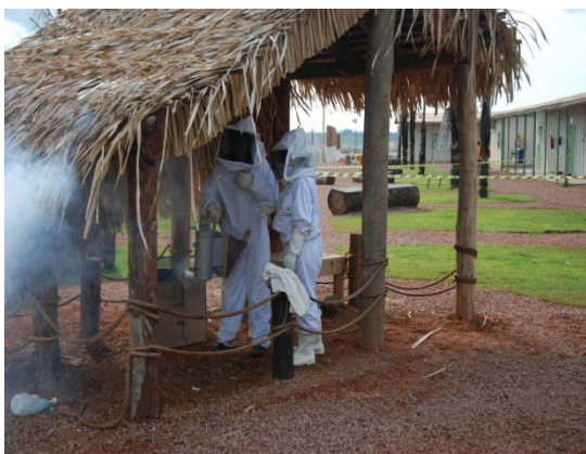
Utilização do fumegador na captura do enxame migratório de Apis mellifera no alojamento definitivo da margem direita.