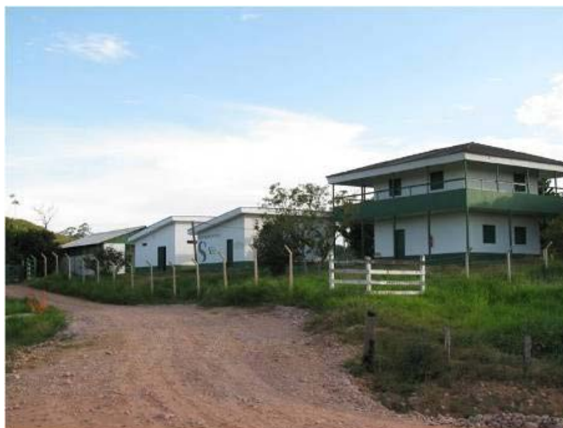
Figura 1. Vista geral da Base de Resgate Provisória.

A Base de Resgate Provisória (BRP) localiza-se na gleba MD 13, antiga propriedade do Sr. Rubem Campos (coordenadas geográficas 20L 0321419 e 8971958) ( Figura 1 ), na margem direita do rio Madeira e apresenta toda a infraestrutura necessária ao atendimento das demandas relativas ao acompanhamento da supressão da vegetação durante a implantação do canteiro de obras da UHE Jirau.