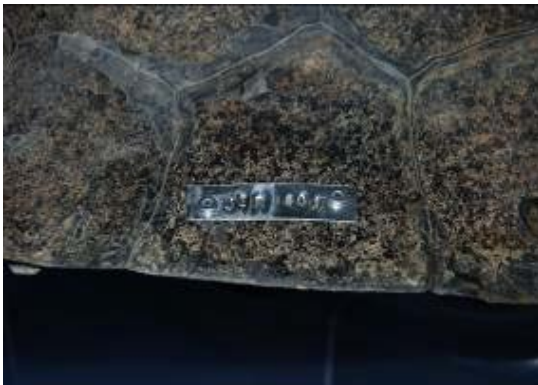
Figura 6. Espécime de quelônio marcado com placa metálica.