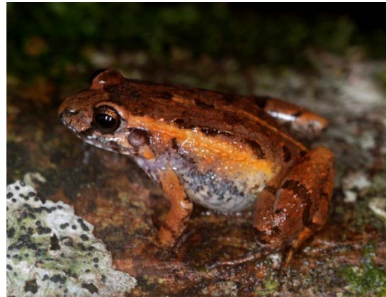
Rã ( Leptodactylus andreae ).