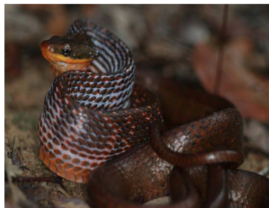
Cobra ( Pseustes poecilonotus )