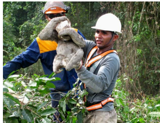
Resgate de um espécime de preguiça-de-coleira ( Bradypus variegatus ) na margem direita.