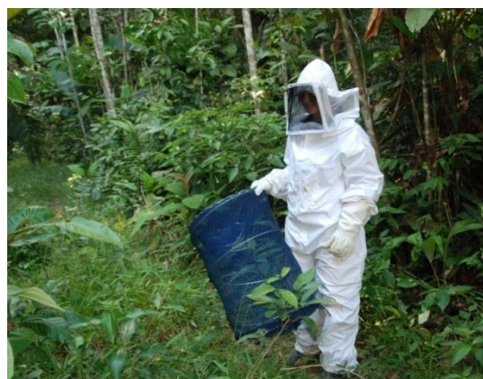
Soltura de enxame migratório de Apis mellifera .