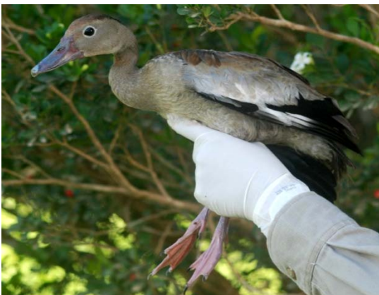
Asa-branca ( Dendrocygna autumnalis ).