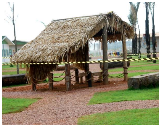
Isolamento da área onde o enxame migratório estava alojado temporariamente.