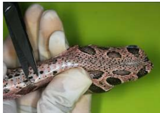
Figura 3. Marcação de serpente com corte na escama ventral.