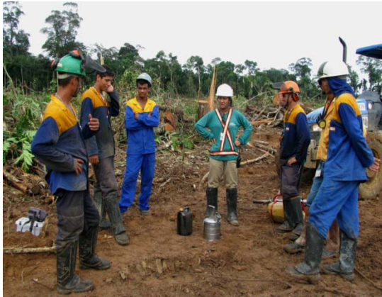
Orientação em relação à fauna silvestre aos trabalhadores da Tercon Construções e Terraplanagem durante o Diálogo Diário de Segurança (DDS) na margem direita.