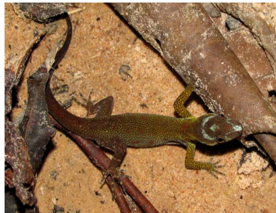
Lagartixa ( Gonatodes humeralis ).