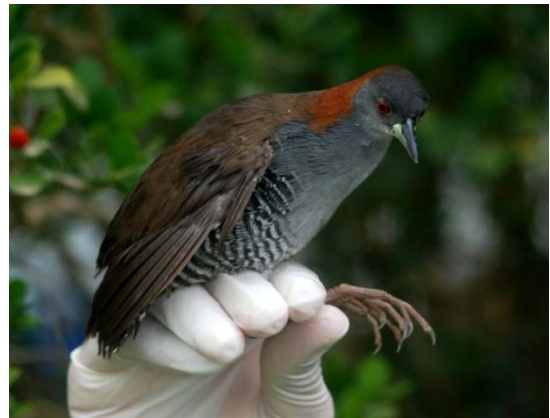
Sanã-do-capim ( Laterallus exilis ).