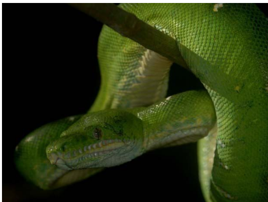
Cobra-papagaio ( Corallus caninus ).