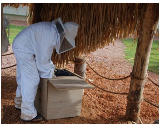
Acomodação do enxame de Apis mellifera para posterior soltura.