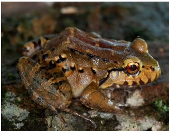
Rã ( Leptodactylus knudseni ).