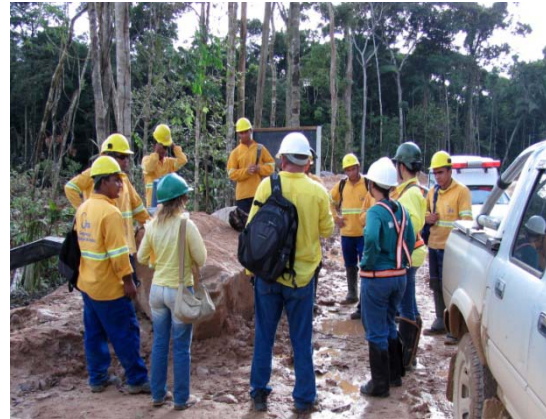
Orientação em relação à fauna silvestre aos trabalhadores da empresa JNS durante o Diálogo Diário de Segurança (DDS) na margem esquerda.