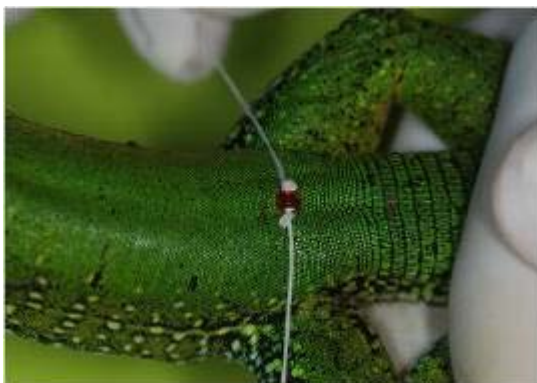
Figura 2. Lagarto marcado com cinto na região inguinal.

Parte dos animais destinados à soltura deverá receber marcação específica, de forma a possibilitar o acompanhamento dos mesmos durante monitoramentos futuros a serem realizados na área. Os métodos de marcações a serem empregados para cada categoria são: a) adaptação de cinto inguinal (Schiesari, 1996) para anfíbios anuros e lagartos (exceto Iguanas) ( Figura 2 ); b) corte de escamas ventrais (Fitch, 1958) para serpentes ( Figura 3 ); c) cortes nos escudos marginais (Cagle, 1939) para quelônios jovens e placa metálica para quelônios adultos ( Figuras 4, 5 e 6 ); d) colar plástico (Esbérard & Daemon, 1999) para Iguanas e pequenos mamíferos; e) tatuagem para mamíferos de médio e grande porte ( Figura 7 ).