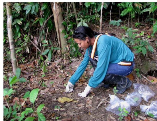
Realização de soltura de animais de pequeno porte (anfíbios e répteis) na margem esquerda.