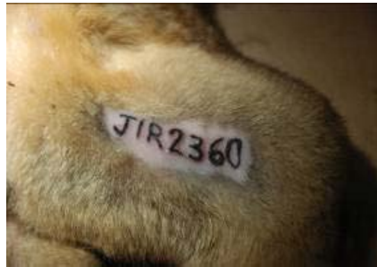
Figura 7. Espécime de mamífero marcado com tatuagem.