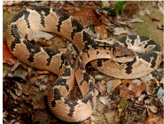
Surucucu ( Lachesis muta ).