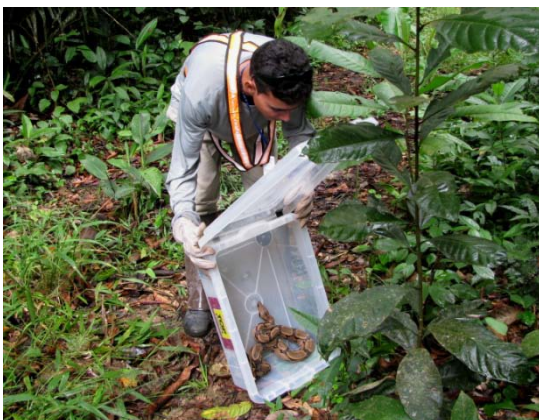
Realização de soltura de um espécime de jibóia ( Boa constrictor ) na margem direita.