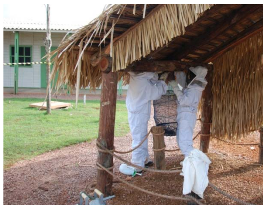
Captura do enxame Apis mellifera no alojamento definitivo da margem direita.