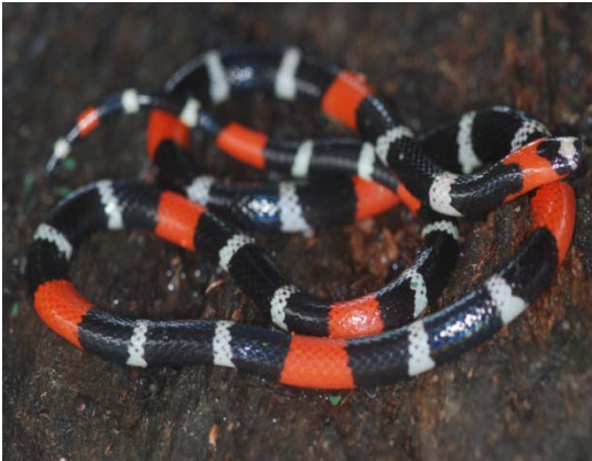
Cobra-coral ( Micrurus lemniscatus ).