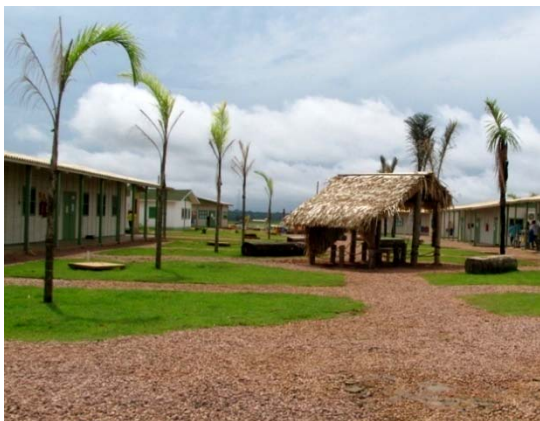
Vista geral da cabana no alojamento definitivo da margem direita, onde encontrava-se o enxame migratório de Apis mellifera .