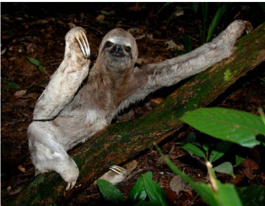
Preguiça-de-coleira ( Bradypus variegatus ).