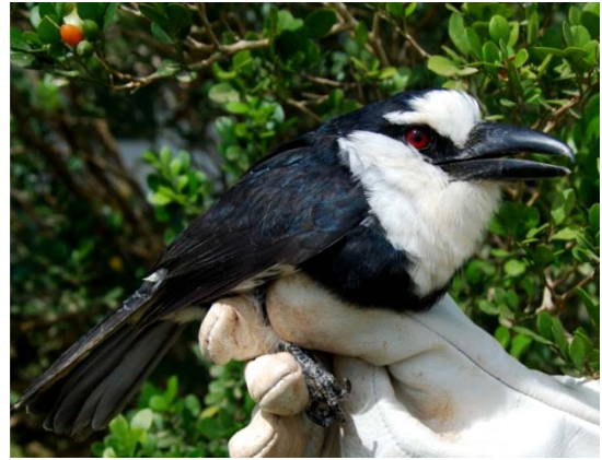
Macuru-de-pescoço-branco ( Notharchus hyperhynchus ).