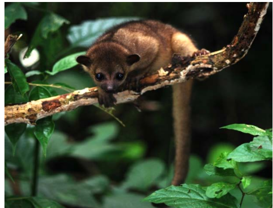
Jupará-verdadeiro ( Potos flavus ).