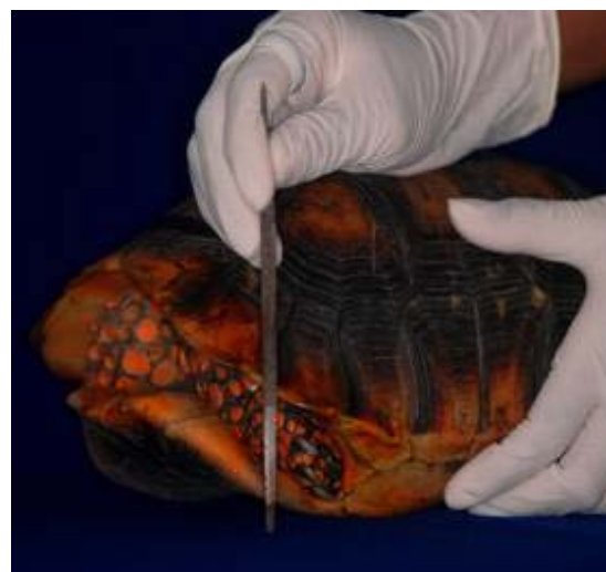
Figura 5. Marcação de quelônio com corte de escudo marginal.