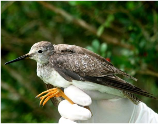
Maçarico-de-perna-amarela ( Tringa flaviceps ).