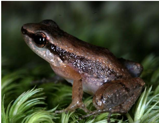
Sapo-venenoso ( Allobates cf. brunneus ).