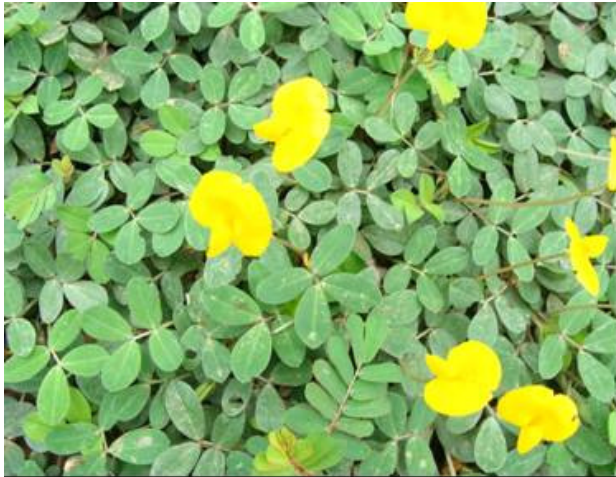
Arachis Pereira-Silva et al 15144