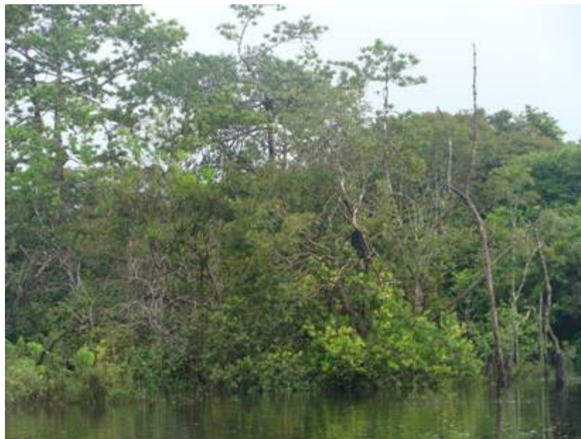
Figura 2: Floresta inundada (Floresta de Igapó) às margens do rio Mutum Paraná.

O material foi coletado com 5 a 8 duplicatas e prensado em campo para garantir a obtenção de amostras de qualidade (Figura 3). A secagem foi realizada em estufas de campo, ao final de cada dia de coleta. As informações sobre o habitat, aspectos ecológicos, morfológicos, dentre outras, foram anotadas em campo em cadernetas com campos pré-estabelecidos.