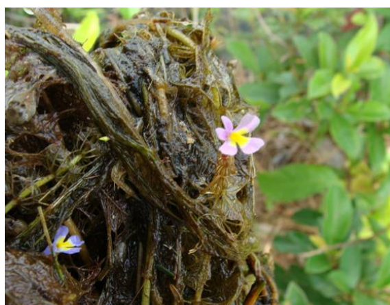
Hydrocleys Pereira-Silva et al 15146