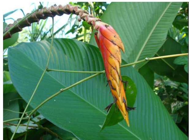
Heliconia Pereira-Silva et al 15099