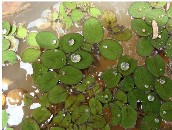
Salvinia auriculata Aubl.