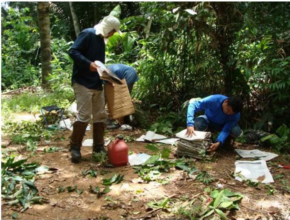
Figura 3: Material botânico sendo preparado em campo para secagem em estufa.