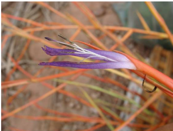
( Bromelia Pereira-Silva et al 15110)

O germoplasma coletado sob a forma de mudas está depositado em casa de vegetação nas dependências da Embrapa Recursos Genéticos e Biotecnologia em Brasília/DF, onde será multiplicado para posterior envio ao viveiro do empreendimento.