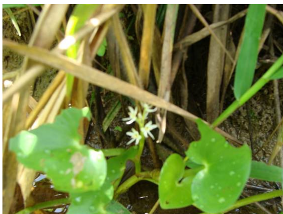
Linnobium Pereira-Silva et al 15046

Nas áreas onde foram desenvolvidas as atividades de coleta, foram observadas e coletadas 07 (sete espécies) de macrófitas aquáticas (Figura 7), localizadas principalmente em áreas de remansos.