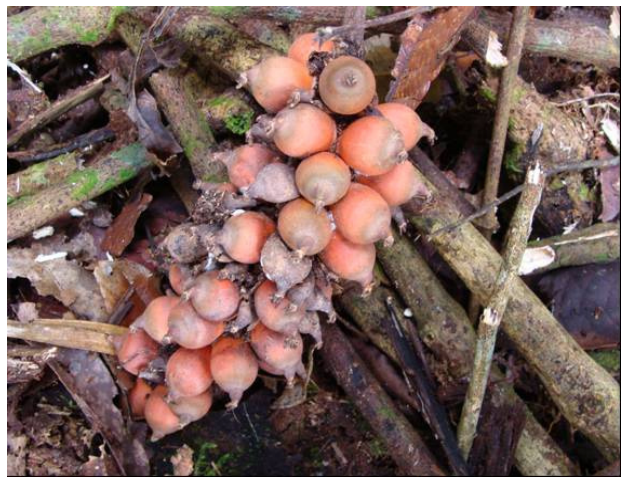
Bactris Pereira-Silva et al 15033