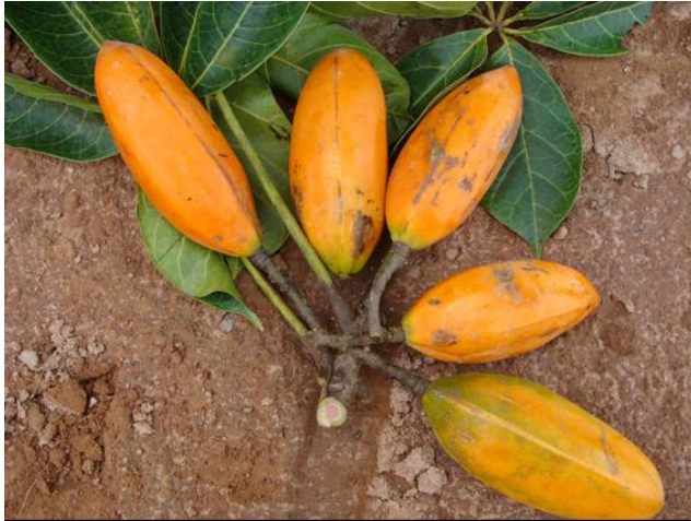
( Cariaca Pereira-Silva et al 14053)