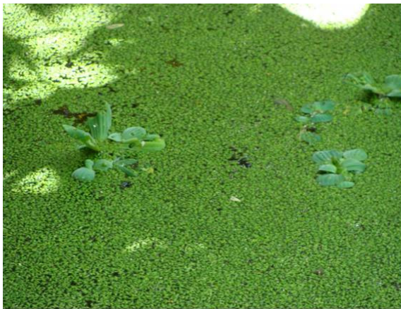
Wolfia e Pistia stratioides (vegetativas)