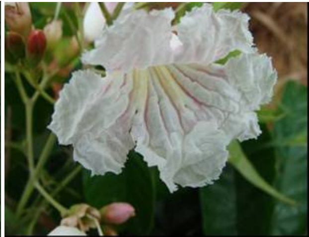
Sparattosperma Pereira-Silva et al 15097