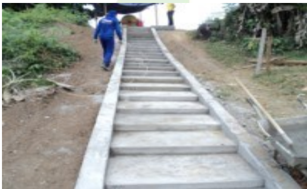
Foto 5-9 – Escada de acesso à praia – Fortaleza do Abunã – 21/05/13