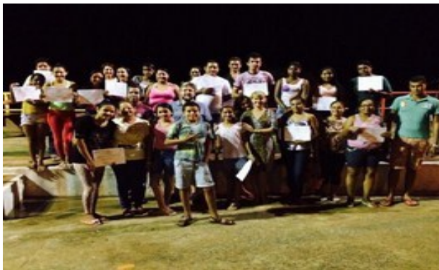
Foto 5-7 – Entrega de certificado do curso de espanhol – Fortaleza do Abunã – 23/08/14