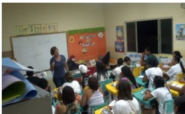
Foto 5-5 – Curso de Inglês - Fortaleza do Abunã –