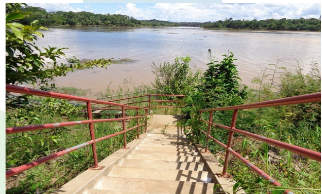
Foto 5-10 – Escada de acesso à praia – Fortaleza do Abunã – 07/01/16