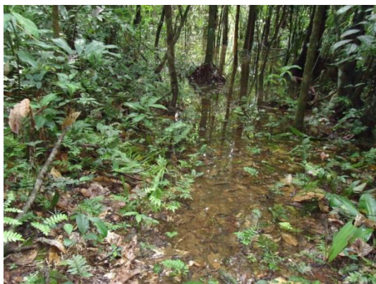
Figura 1. Área alagada onde umas das armadilhas móveis foram retiradas.