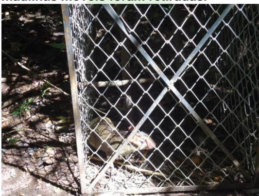
Figura 3. Indivíduo de Dasyprocta sp. foi capturado na armadilha.