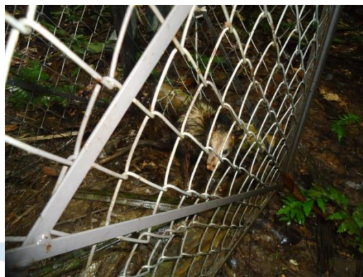
Figura 8. Indivíduo de Didelphis sp. foi capturado na armadilha.