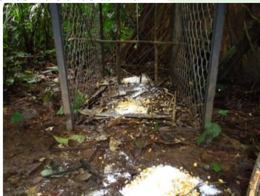
Figura 11. Armadilha de contenção cevada com porta travada durante período de descanso do local.