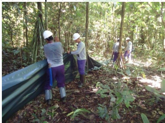
Figura 15. Instalação da lona.