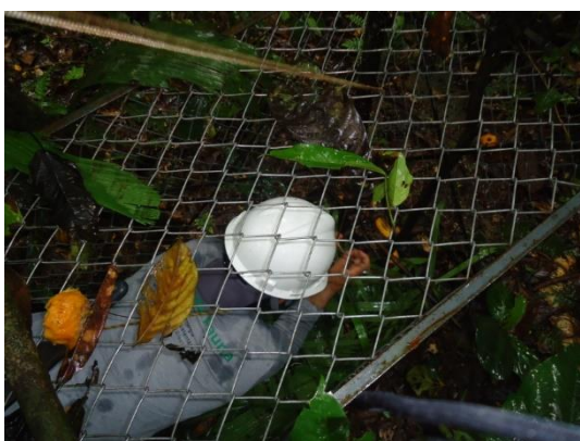
Figura 5. Momento em que a gaiola móvel é armada.