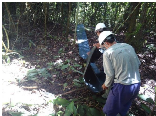
Figura 13. Instalação da lona para isolamento do bando na parte mais alta da ilha de Mutum.