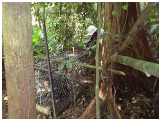
Figura 19. Disparo do anestésico com rifle em indivíduo capturado na armadilha de contenção.