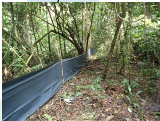
Figura 16. Corredor de lona com 324 metros instalados para isolamento do bando de uma extremidade até a área alagada na Ilha de Mutum.