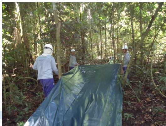
Figura 14. Lona sendo esticada e aberta para posterior instalação.