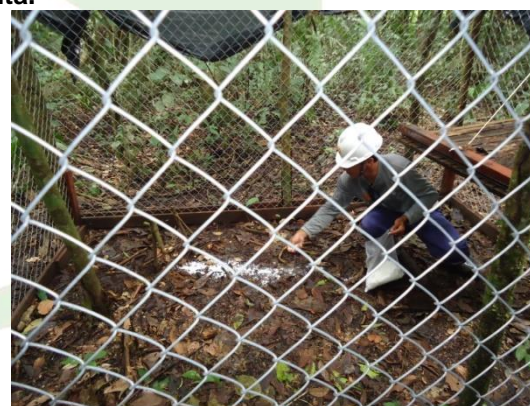
Figura 6. Momento em que o chiqueiro é cevado com sal.