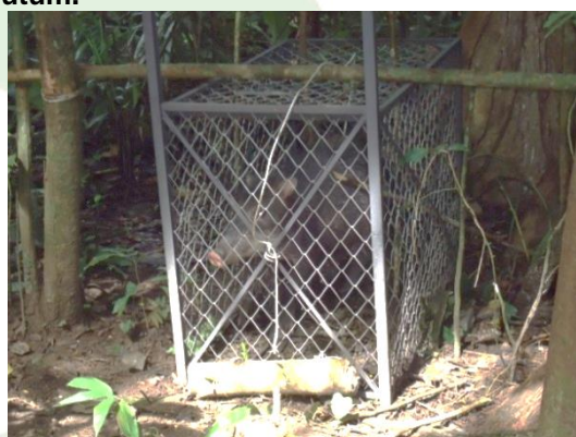
Figura 18. Segundo indivíduo macho de queixada capturado na armadilha de contenção.