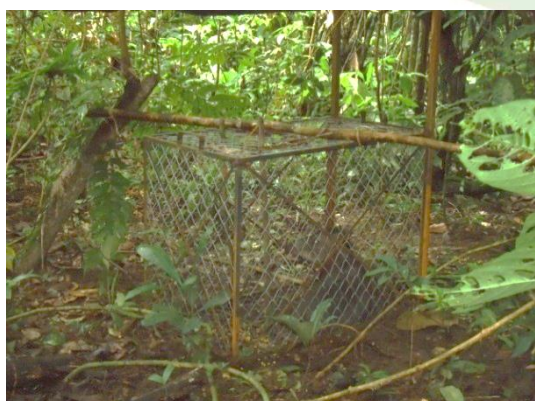
Figura 17. Indivíduo macho de queixada preso na armadilha de contenção.