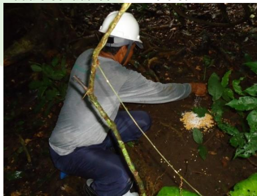
Figura 12. Saleiro sendo preparado em uma área de passagem do bando para forrageio.