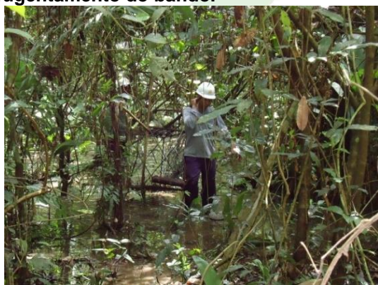
Figura 9. Realocação de armadilhas para partes mais altas da ilha.