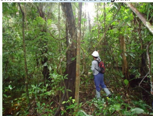
Figura 4. Abertura de trilha na parte de baixo da ilha para afugentamento do bando à parte alta.