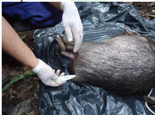
Figura 21. Aferição da temperatura de indivíduo macho de queixada.