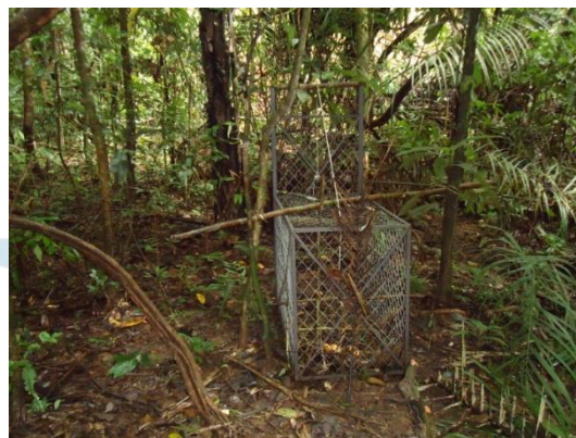
Figura 2. Armadilha móvel relocada para outro ponto devido à área ter sido alagada.