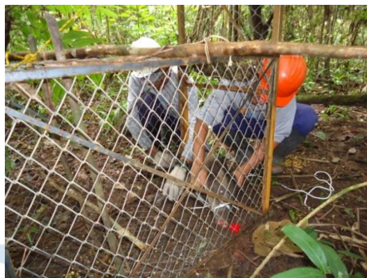
Figura 20. Animal sedado sendo retirado da armadilha.