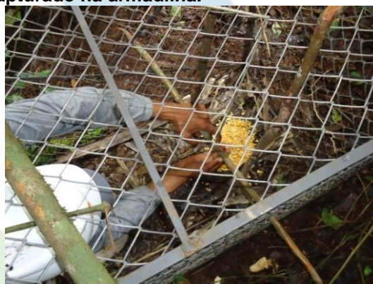
Figura 10. Armadilha de contenção viva sendo armada e cevada com milho e sal.