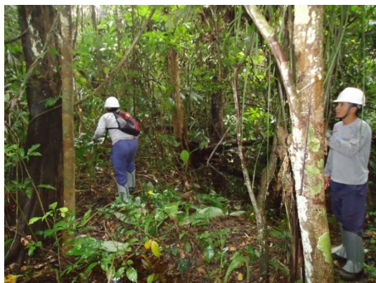
Figura 7. Abertura de trilha para afugentamento do bando.