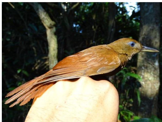
Figura 7- Dendrocincla merula bartletti