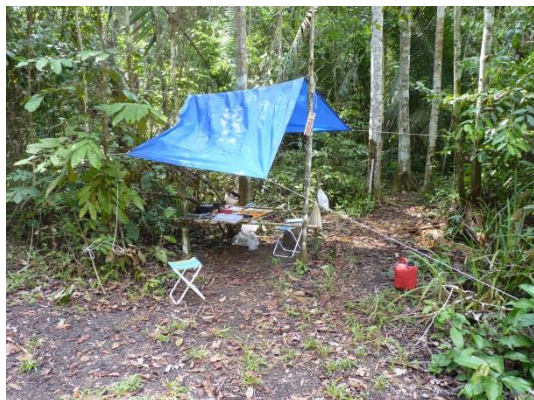
Figura 1- Base de anilhamento utilizada durante as amostragens de captura com rede de neblina.