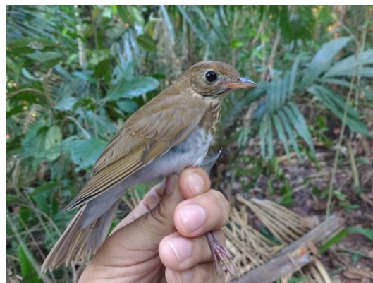
Figura 8- Catharus fuscescens fuscescens