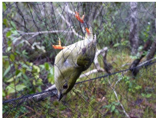
Figura 2- Metodologia de captura através de rede de neblina ( Manacus manacus subpurus ).