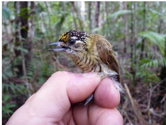
Figura 19- Picumnus aurifrons aurifrons