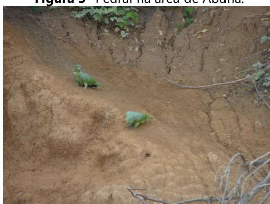
Figura 5- Amazona farinosa farinosa no barreiro A6.