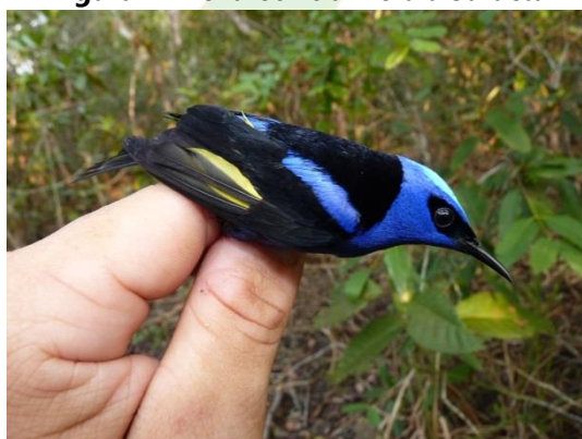
Figura 9- Cyanerpes cyaneus cyaneus