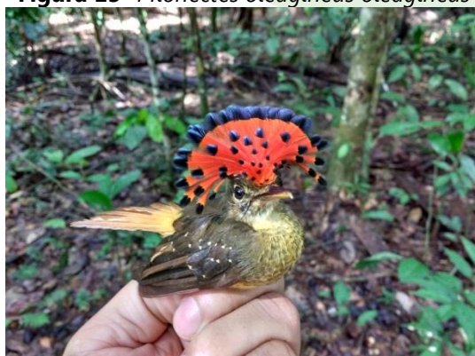
Figura 17- Onychorhynchus coronatus castelnaui