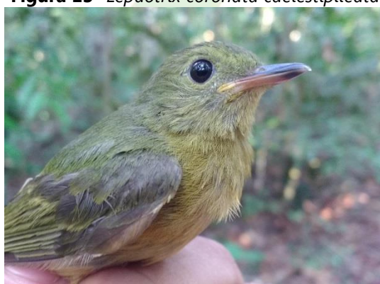
Figura 15- Mionectes oleagineus oleagineus