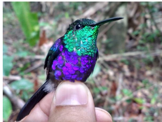
Figura 20- Thalurania furcata balzani