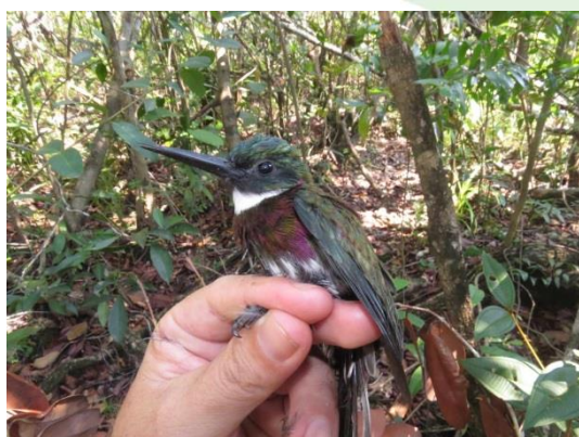
Figura 11- Galbula leucogastra leucogastra