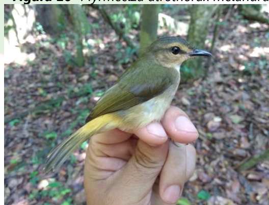
Figura 18- Phaeothlypis fulvicauda fulvicauda