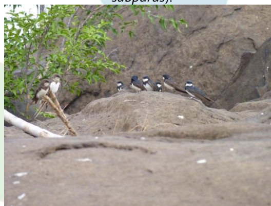
Figura 4- Pedral na área de Abunã.