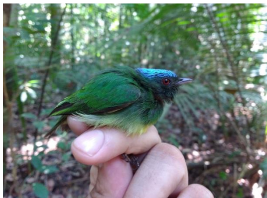
Figura 13- Lepdotrix coronata caelestipileata