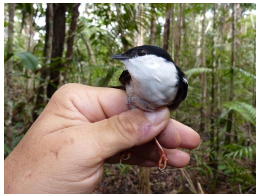
Figura 14- Manacus manacus subpurus