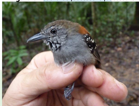
Figura 10- Epinecrophylla haematonota amazonica