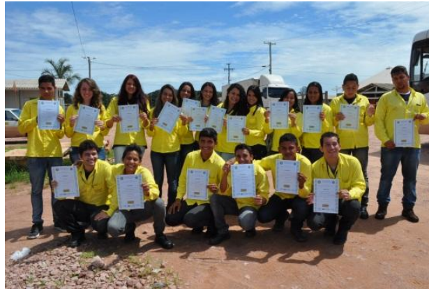
Formandos Jovem Aprendiz

Por Michelly Gomes