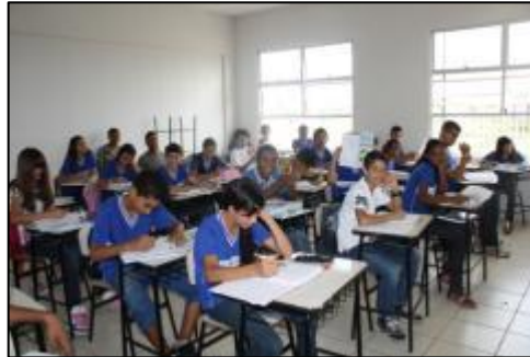
Sala de Aula E.M.E.F. Nossa Senhora de Nazaré

Por Mabline Martiniano