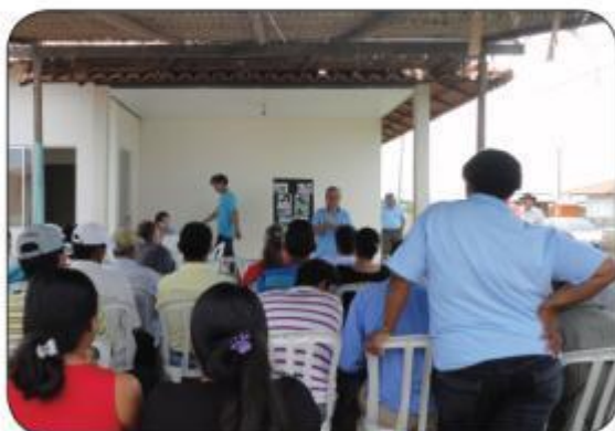
Matéria e Foto Bárbara Dantas

No dia 6 de março, na sede do Observatório Ambiental Jirau, das 8h30 as 13h00, ocorreu a 2ª Assembleia Geral Extraordinária da COOPPROJIRAU.