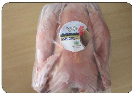
Por Yanamara Canedo e Itajacy Kishi – Equipe Técnica do Observatório Ambiental Jirau

Em outubro de 2011, a COOPPROJIRAU iniciou o Projeto de Criação de Galinha Caipira em Regime Semi Confinado e atualmente a produção é escalonada por um grupo de 08 produtoras a cada 45 dias, totalizando em média 2000 aves. Dessa forma a oferta do produto é constante, não satura o mercado pelo excesso de produção e os produtores tem a possibilidade de experimentar um ciclo completo de produção antes de iniciar um novo ciclo. Esse período serve para cada produtor avaliar a viabilidade da atividade para então decidir se dará continuidade no projeto.