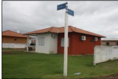
Sede da ECSA em Nova Mutum-Paraná

A ECSA (Engenharia Sócio Ambiental), empresa que presta serviços de Assistência Técnica e Social para a ESBR (Energia Sustentável do Brasil), agora tem um escritório em Nova Mutum – Paraná.