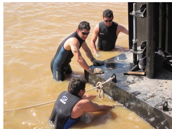
Mergulhadores da Ilha-Sub em atividade

Você conhece a segunda profissão mais perigosa do mundo? Não?