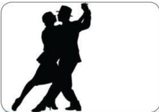
Por Bárbara Dantas

A partir do dia 27 de março, o Observatório Ambiental Jirau oferecerá oficinas de dança e teatro à comunidade.