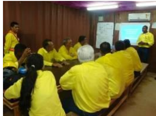
Formação de multiplicadores para combate à exploração sexual de crianças e adolescentes no canteiro de obras