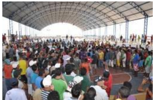
Evento do Dia do Trabalhador reuniu mais de duas mil pessoas na área de convivência da obra