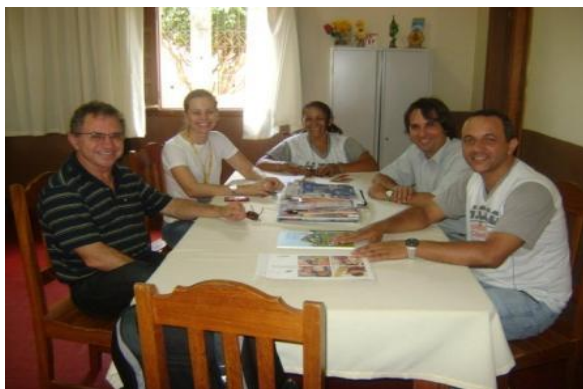
Direcionamento do Programa Escola Ideal

Os professores das escolas públicas de Porto Velho, Jaci-Paraná e Guajará-Mirim responderem aos questionários para implantação do programa no mês de novembro.