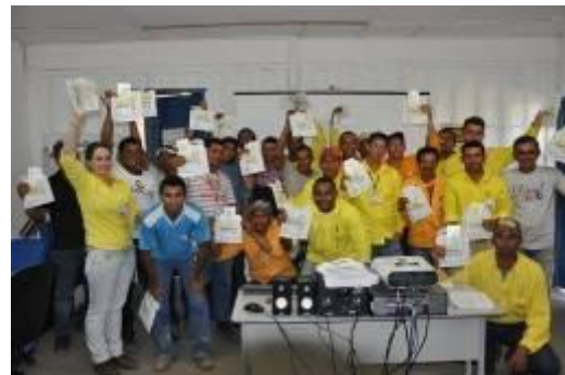
Formação de multiplicadores para ações de combate à exploração sexual de crianças e adolescentes

Os profissionais da UHE Jirau foram treinados e capacitados acerca das ações de Sustentabilidade adotadas pelo grupo Camargo Corrêa. Eles obtiveram novos conhecimentos e trocaram experiências sobre o tripé da sustentabilidade: desenvolvimento econômico, respeito ao meio ambiente e equidade social.