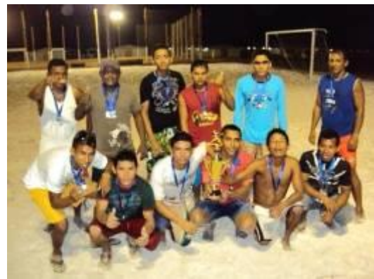
Premiações para os profissionais da UHE Jirau que estão alojados e os vencedores do torneio de futebol de areia