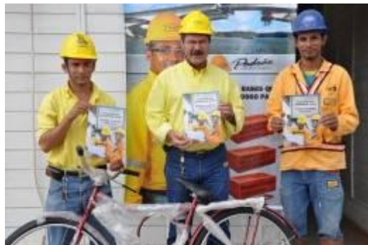
Concurso Padrão Camargo Corrêa teve a participação de diversos profissionais que receberam premiações