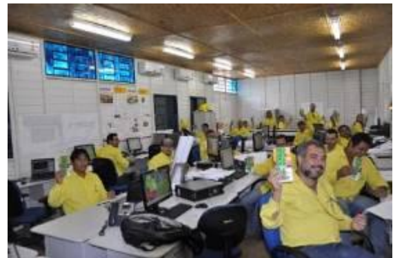
Campanha de combate às Doenças Sexualmente Transmissíveis e AIDS para os profissionais da obra