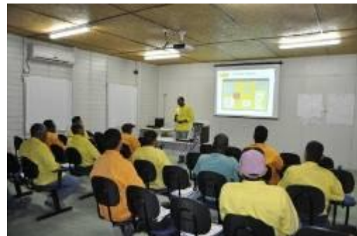
Campanha de Combate à exploração de crianças e adolescentes para os profissionais da UHE Jirau