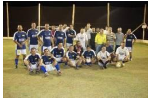
Profissionais de Jirau que estão alojados participam de torneios esportivos na obra