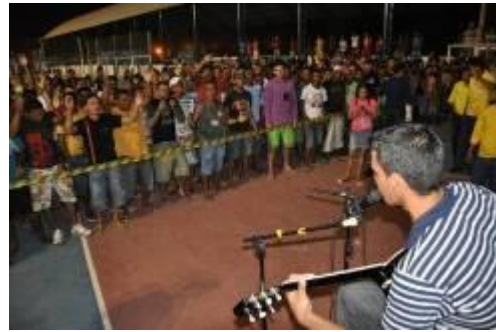
Compositores e intérpretes de Jirau participam da seletiva para o festival Sesi Música 2010