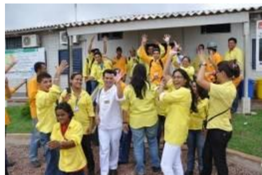
Integração das Pessoas com Deficiência no canteiro de obras da UHE Jirau