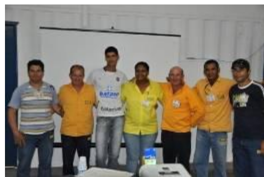
Treinamento sobre Código de Conduta empresarial do Grupo Camargo Corrêa na UHE Jirau