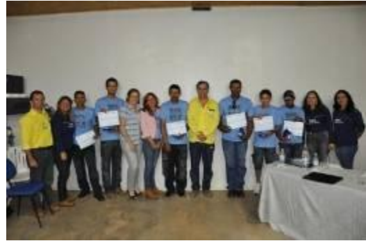
Alunos do Programa Educação de Jovens e Adultos durante a formatura da 1ª turma em Jirau