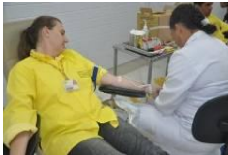
Profissionais de Jirau campanha para doação de sangue e medúla óssea na obra

Metodologia: Campanha de orientação e incentivo à doação de sangue