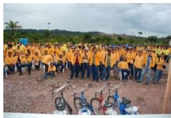
Atividades de conscientização no dia do Trabalhador com premiações aos profissionais da obra