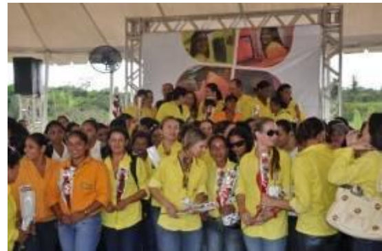
Mulheres que trabalham na UHE Jirau foram homenageadas no dia 8 de Março no canteiro de obras