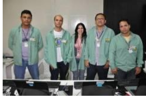
Seção Eleitoral do TRE no canteiro de obras realizou atendimentos aos profissionais da UHE Jirau