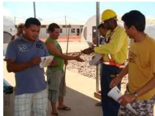
Distribuição do jornal Jirau em ação para profissionais da obra