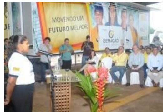
Lançamento do programa Geração Sustentável e as primeiras turmas formadas e capacitadas pelo programa