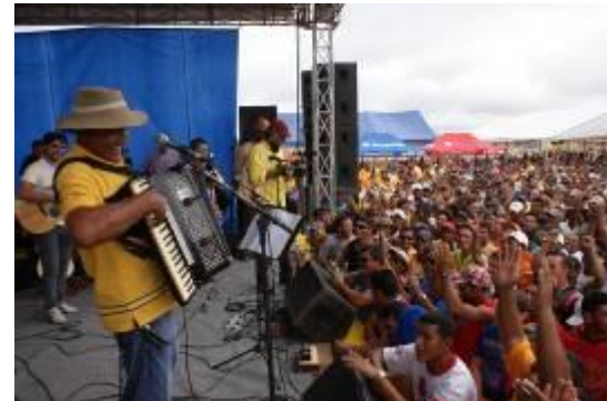
Confraternização de final de ano em Jirau reuniu milhares de profissionais. O evento teve sorteios de prêmios e shows musicais