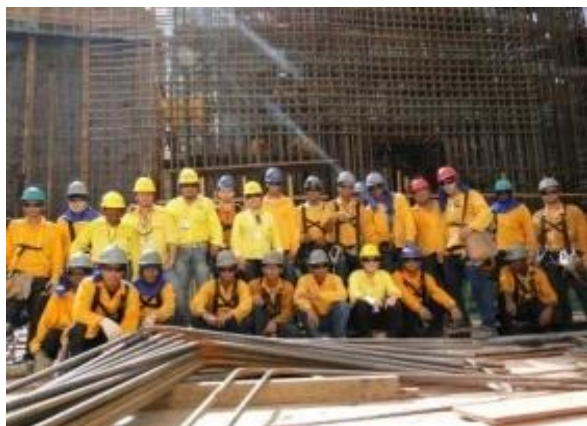
Formatura da 17ª Turma de iniciação Profissional em Armação

Ainda com relação aos treinamentos e cursos oferecidos pela UHE Jirau, foram qualificadas 100 pessoas do município de Guajará-Mirim/RO, nos cursos de Eletricista de Instalações Comerciais, Iniciação Profissional Básica de Carpintaria e Auxiliar Administrativo de Pessoal para pessoas com deficiência (PCDs). A cerimônia de formatura foi realizada no dia 04 de novembro, no Centro Despertar da Criança e do Adolescente no município.