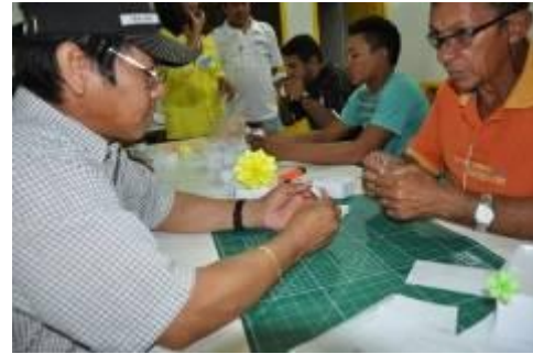
Aulas de artesanato e produção de origamis para profissionais de Jirau nos períodos de folga