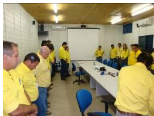
Diálogos Diários de Excelência no canteiro de obras para profissionais de campo e do setor administrativo