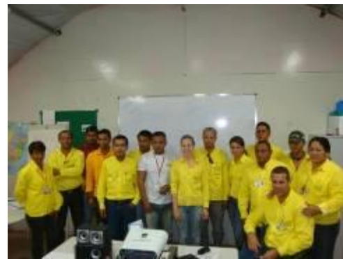
Treinamento sobre sustentabilidade na obra para os profissionais da UHE Jirau

Foram realizados treinamentos e palestras sobre o Código de Conduta Empresarial do Grupo Camargo Corrêa. Os profissionais passaram por um processo de reciclagem, no qual reviram as condutas adotadas enquanto profissional da empresa. Foram realizadas dinâmicas e debates sobre o tema.