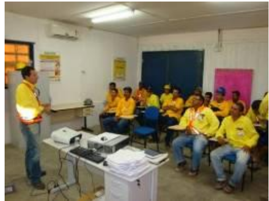
Palestras e sensibilizações durante o mês da Sustentabilidade para os profissionais no canteiro de obras