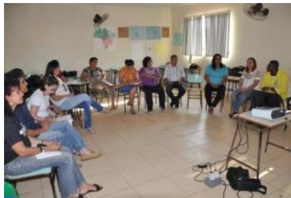
Reunião dos integrantes do Programa Infância Ideal

Foi realizado no dia 06 de Outubro reunião de direcionamento do Programa infância Ideal, no intuito de apresentar os filmes que estão planejados para exibição nas três escolas públicas de Jaci Paraná. A reunião contou com a presença de lideranças comunitárias e entidades envolvidas.