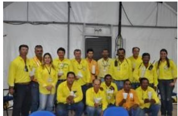
Profissionais da UHE Jirau são sensibilizados nos treinamentos e oficinas para Pessoas com deficiência (PCDs)