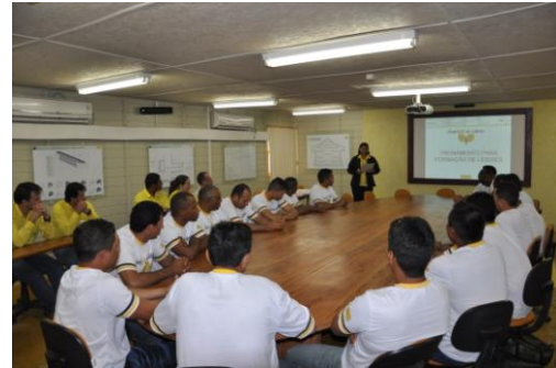
Sensibilizações e palestras durante reuniões e cursos de formação para profissionais