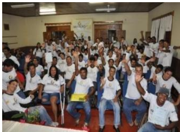
Formação de Pessoas no Programa Geração Sustentável no município de Guajará Mirim