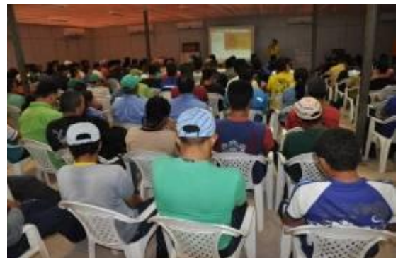
Profissionais recrutados ou transferidos de outras obras participam da integração sobre Responsabilidade Social