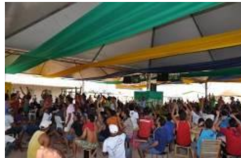
Instalação de televisores na área de convivência da obra nos horários dos jogos do Brasil na copa do mundo