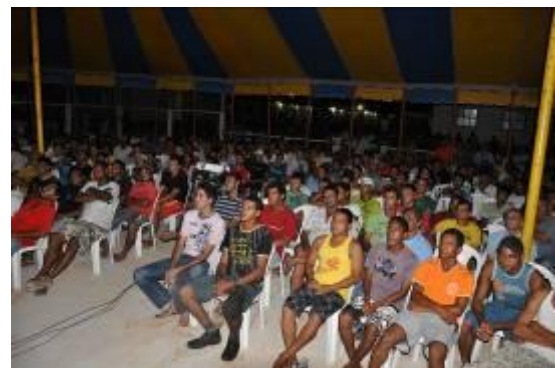
Profissionais de Jirau assistem “O Milagre de Santa Luzia” na área de convivência da obra