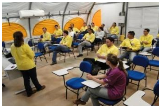
Treinamento de Responsabilidade Social – Profissionais da Obra

As atividades de treinamentos foram intensificadas no mês de novembro, com o treinamento dos líderes da área de produção em RDE's (Reunião Diária de Excelência) para divulgação dos temas de responsabilidade social.