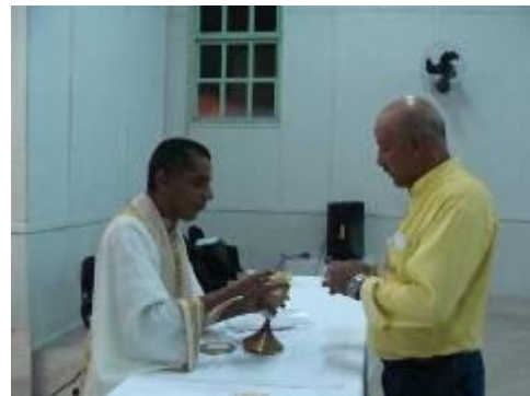
O Centro Ecumênico de Jirau é aberto para a celebração de diversos cultos religiosos