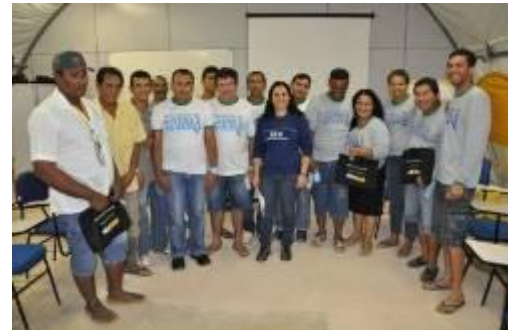
Eventos em comemoração ao Dia do Estudante, com os alunos do programa Educação para Jovens e Adultos