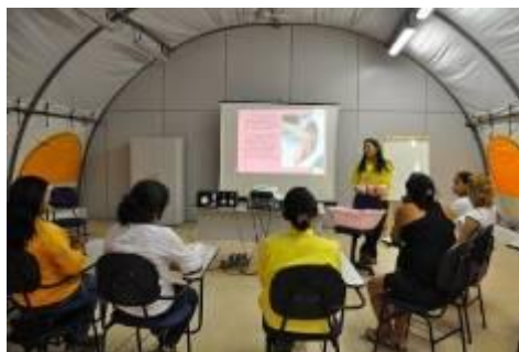
Gestantes que trabalham na UHE Jirau participam do Programa Gesta o Sa de

Metodologia: Curso com 20h sobre Gesta o e Sa de, atrav s de ppt