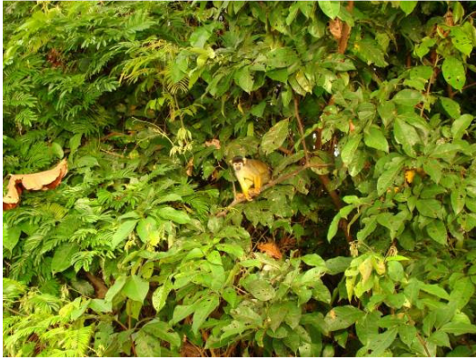
Figura 0-11 - Saimiri boliviensis , macaco-de-cheiro.