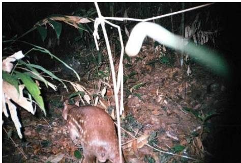
Figura 0-26 - Cuniculus paca , paca, fotografada em Abunã, transecto 11, parcela 1