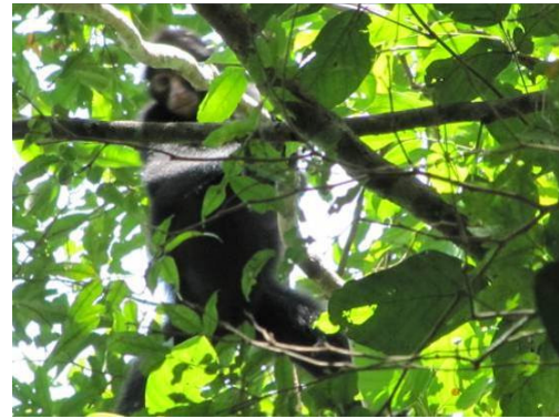
Figura 0-14 - Ateles chamek , macaco-aranha ou macaco-preto, fotografado no transecto 7, em Mutum, próximo a parcela 1 (campanha 2).