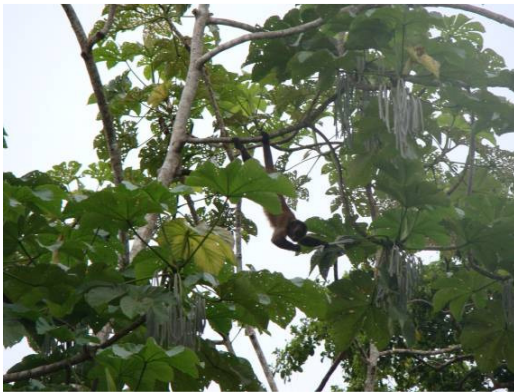
Figura 0-9 - Cebus apella , macaco-prego.