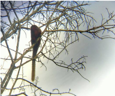
Figura 0-7 - Callicebus dubius , zogue-zogue.