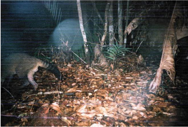
Figura 0-44 - Procyon cancrivorus , mão pelada.