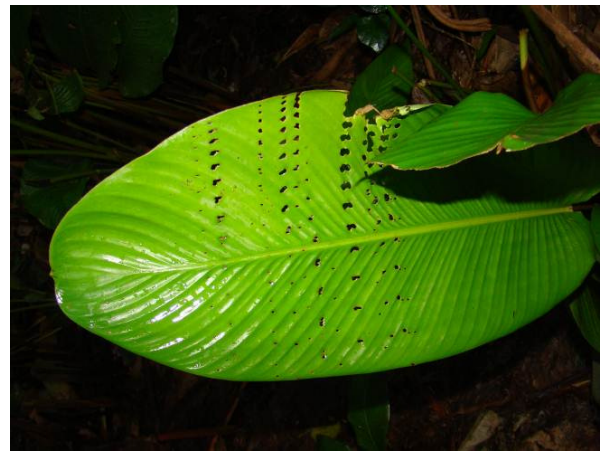
Figura 0-12 - Folha com indícios de mastigação para formação de abrigos encontrada no Transecto 7 nos primeiros 50m.