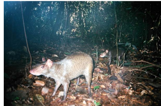
Figura 0-27 - Dasyprocta cf. fuliginosa , cutia, fotografada em Mutum, transecto 7.