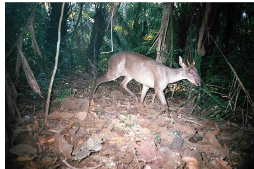
Figura 0-37 - Mazama gouazoupira , fotografado em Abunã.