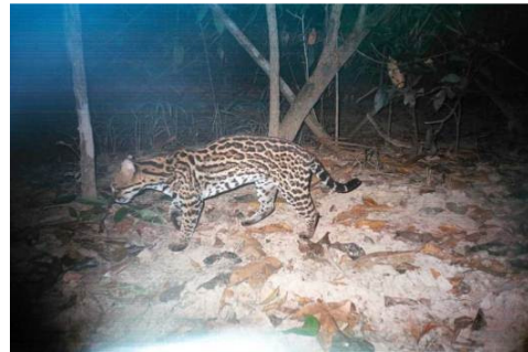
Figura 0-47 - Leopardus pardalis , jaguaririca, fotografada em Abunã, transecto 11, 1600m