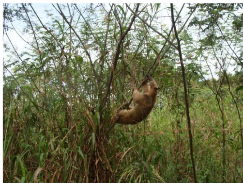
Figura 0-15 - Tamandua tetradactyla , tamanduá-mirim, fotografado atravessando a BR 364, próximo à balsa, em Abunã (campanha 2).