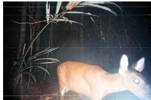
Figura 0-35 - Mazama americana , veado-mateiro.