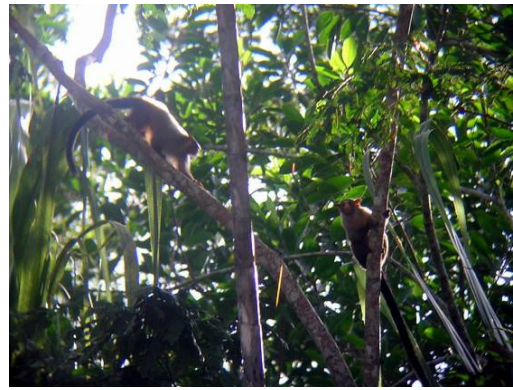
Figura 0-10 - Mico cf. emiliae , soim.