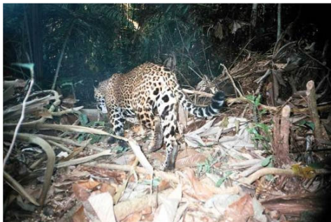
Figura 0-52 - Panthera onca , onça-pintada fotografada em Mutum, parcela 3