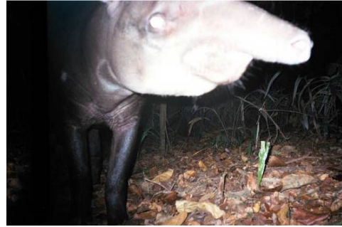
Figura 0-39 - Tapirus terrestris , anta, fotografada em Mutum, transecto 8, parcela 1