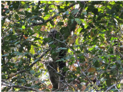
Figura 0-13 - Pithecia irrorata , parauacu, fotografado no transecto 7, em Mutum, próximo a parcela 1 (campanha 2).