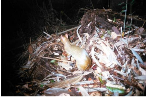
Figura 0-30 - Myoprocta pratii , cutiara, fotografada em Caiçara.