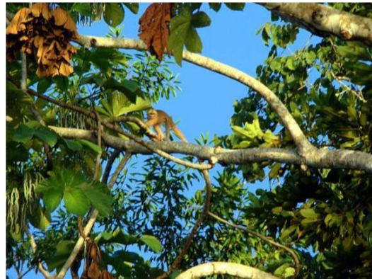
Figura 0-8 - Cebus albifrons , Cairara ou Caiarara, fotografado na margem esquerda do Rio Madeira.