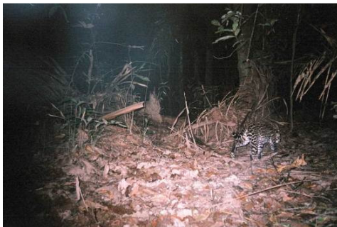
Figura 0-48 - Leopardus pardalis , jaguaririca, fotografada em Abunã, transecto 10