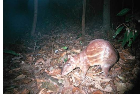
Figura 0-25 - Cuniculus paca , paca, fotografada em Mutum, parcela 2