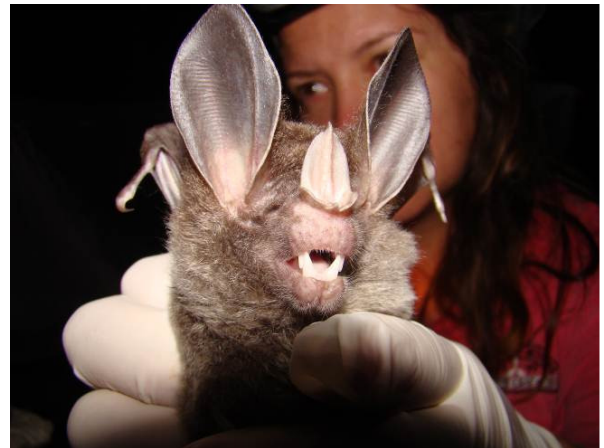
Figura 0-10 - Chrotopterus auritus coletado no Transecto 10, Parcela 2.