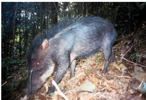
Figura 0-34 - Tayassu pecari , queixada, fotografado em Mutum, parcela 2