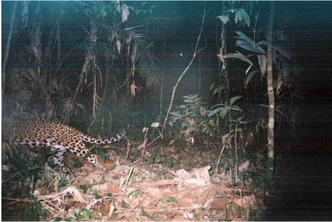
Figura 0-50 - Panthera onca , onça-pintada, fotografada em Abunã, transecto 11, parcela 1.