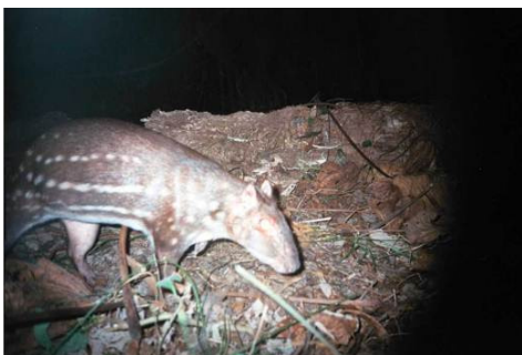
Figura 0-22 - Cuniculus paca , paca, fotografada em Caiçara, no transecto 2, parcela 100m