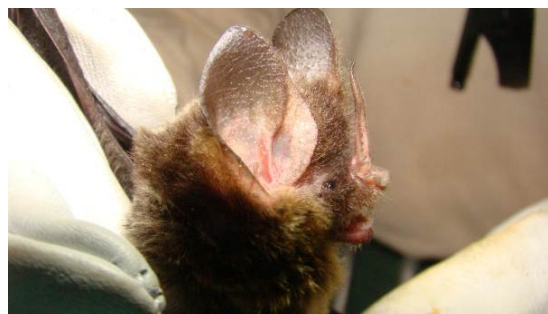
Figura 0-6 - Mimon crenulatum capturado no Transecto 2, na Parcela 4 e 5.