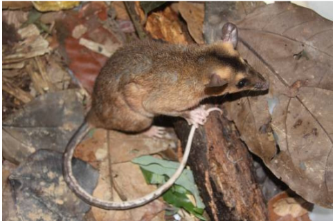
Figura 0-1 - Metachirus nudicaudatus , mucura, capturada em Caiçara, no transecto 2.