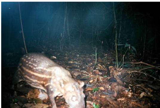
Figura 0-20 - Cuniculus paca , paca, fotografada em Mutum, transecto 7.