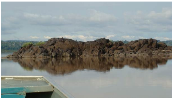
Figura 0-3 - Pedral em Abunã (20L 0242400/8943892UTM). Foto: J. Gualda-Barros..