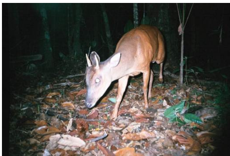
Figura 0-36 - Mazama americana , veado-mateiro.