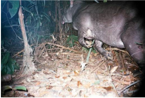
Figura 0-38 - Tapirus terrestris , anta, fotografada em Caiçara, no transecto 3