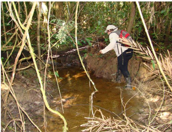
Figura 0-11 - Busca-ativa por abrigos e vestígios no Transecto 5.