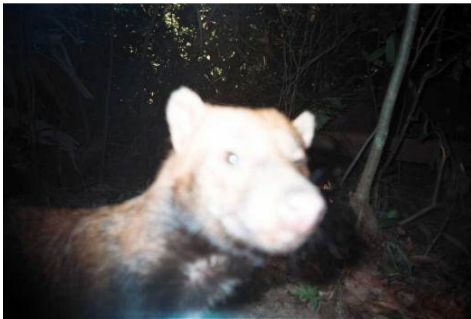
Figura 0-46 - Speothus venaticus , fotografado em Mutum, parcela 2