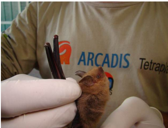
Figura 0-9 - Centronycteris maximiliani coletado no Transecto 3, Parcela 2.