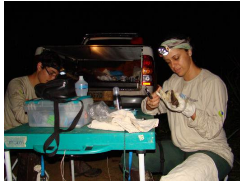
Figura 0-2 - Unidade de triagem instalada no Transecto 2, entre as Parcelas 4 e 5.