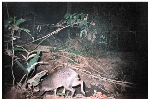
Figura 0-28 - Dasyprocta cf. fuliginosa , cutia, fotografada em Mutum, parcela 3