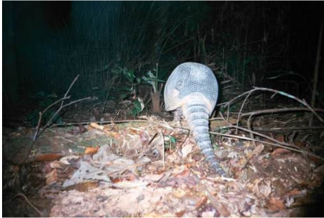
Figura 0-16 - Dasypus sp., tatu, fotografado no transecto 4, parcela 5