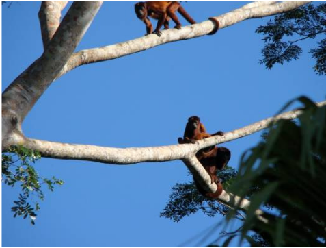
Figura 0-5 - Alouatta cf. puruensis , guariba ruivo.