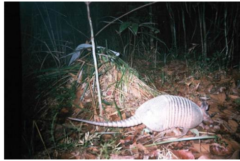
Figura 0-17 - Dasypus cf. novemcinctus , tatu-galinha.