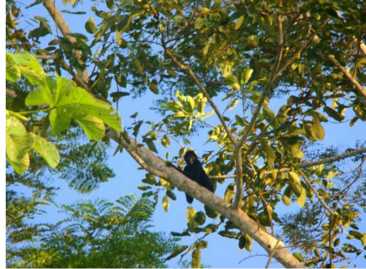
Figura 0-6 - Ateles chamek , macaco-aranha, fotografado na margem esquerda do Rio Madeira.