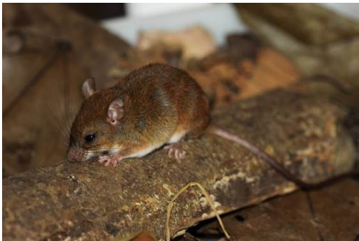
Figura 0-3 - Oecomys cf. bicolor , rato-do-mato, capturado em Mutum, no transecto 8.