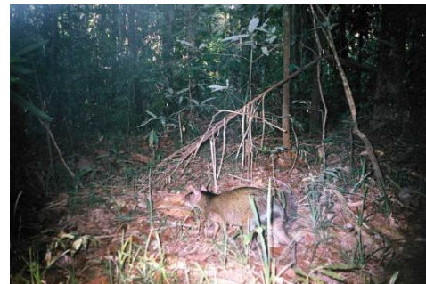
Figura 0-29 - Dasyprocta cf. fuliginosa , cutia, fotografada em Abunã, transecto 10.