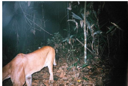
Figura 0-53 - Puma concolor , onça-parda ou suçuarana.