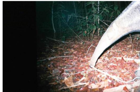
Figura 0-19 - Myrmecophaga tridactyla , tamanduá-bandeira, fotografado em Mutum, transecto 8, parcela 2