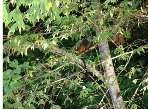
Figura 0-12 - Saguinus fuscicollis weddelli , soim.