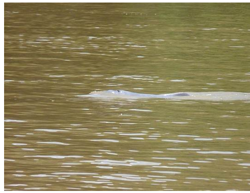
Figura 0-55 - Inia sp.