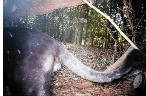
Figura 0-51 - Panthera onca , onça-pintada, fotografada em Abunã, transecto 9, 100m