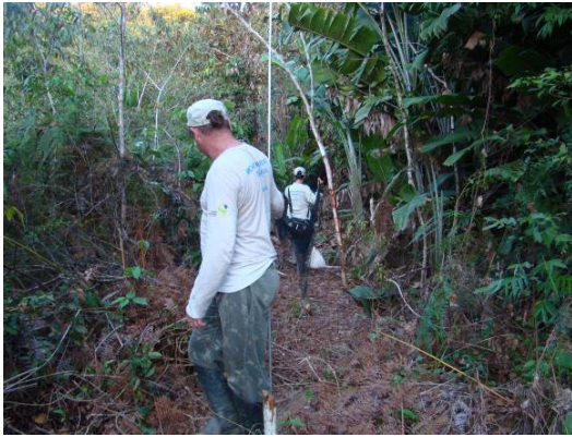
Figura 0-1 - Montagem das redes-de-neblina no Transecto 2, entre as Parcelas 4 e 5.