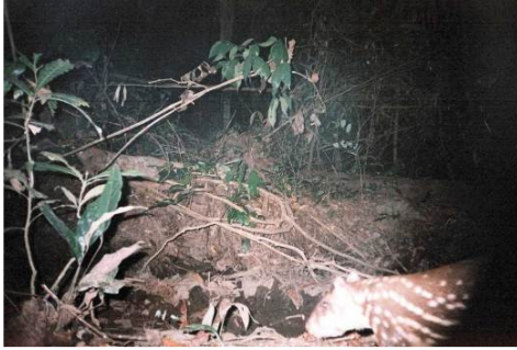
Figura 0-24 - Cuniculus paca , paca, fotografada em Mutum, parcela 3