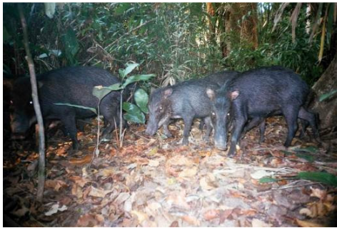
Figura 0-32 - Tayassu pecari , queixada, fotografado em Mutum, transecto 6, parcela 1..