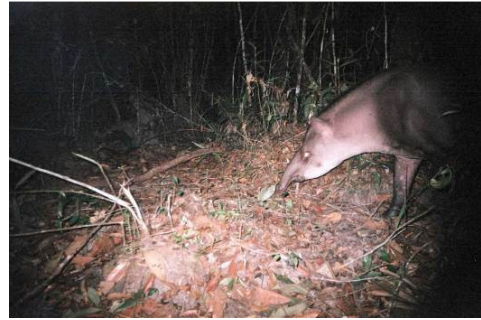
Figura 0-41 - Tapirus terrestris , anta, fotografada em Abunã, transecto 10