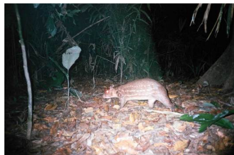
Figura 0-23 - Cuniculus paca , paca, fotografada em Mutum, transecto 6, parcela 1