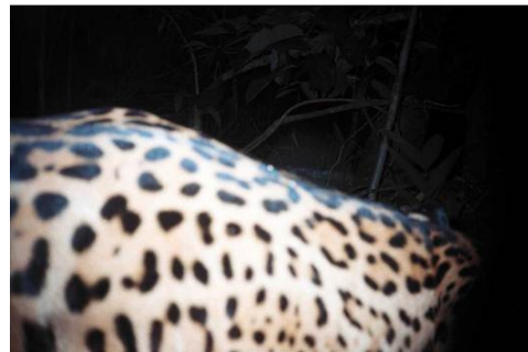
Figura 0-49 - Panthera onca , onça-pintada, fotografada em Abunã, transecto 9, 200m