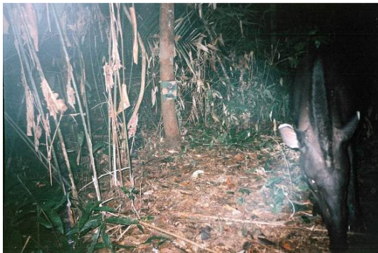
Figura 0-42 - Tapirus terrestris , anta, fotografada em Caiçara, no transecto 1, parcela 2.