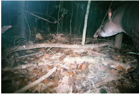
Figura 0-40 - Tapirus terrestris , anta, fotografada em Abunã, transecto 9, parcela 2