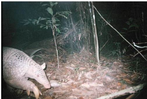
Figura 0-18 - Priodontes maximus , tatu-canastra.