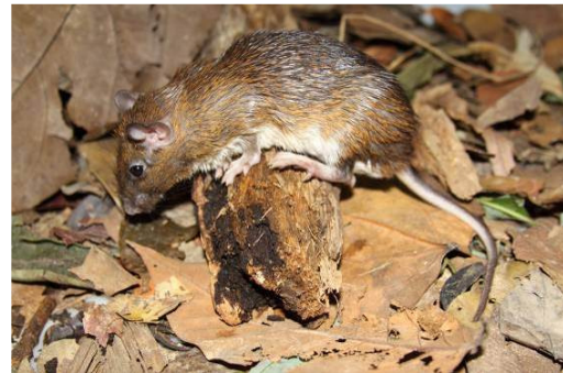
Figura 0-4 - Proechimys , rato-de-espinho ou barriga branca, capturado em Caiçara