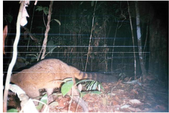
Figura 0-45 - Procyon cancrivorus , mão pelada.