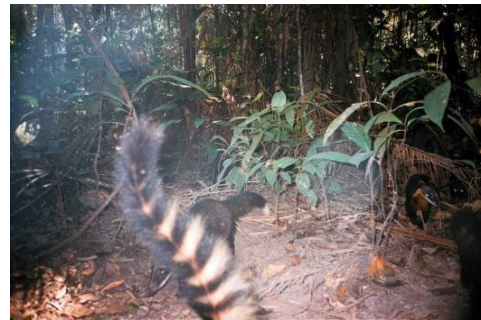
Figura 0-43 - Nasua nasua , quati, fotografados em Mutum, transecto 6, parcela 3