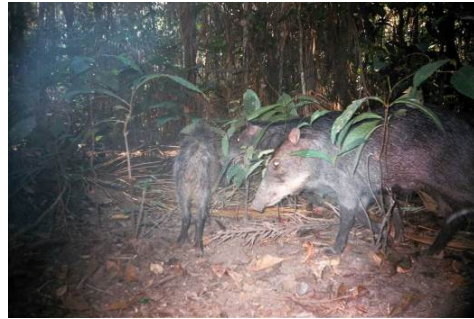
Figura 0-31 - Tayassu pecari , queixada, fotografado em Mutum, transecto 5, parcela 3.