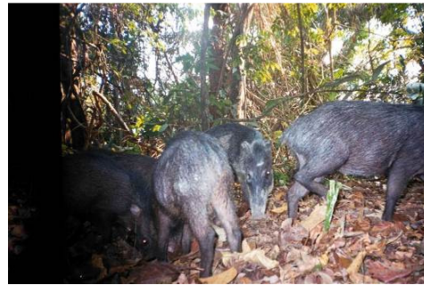
Figura 0-33 - Tayassu pecari , queixada, fotografado em Mutum, transecto 8, parcela 1.