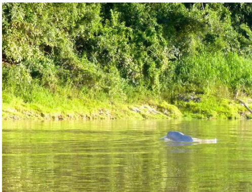
Figura 0-54 – Inia sp.