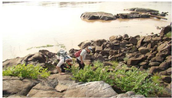
Figura 0-4 - Vistoria no Pedral de Abunã (20L 0242400/8943892UTM).