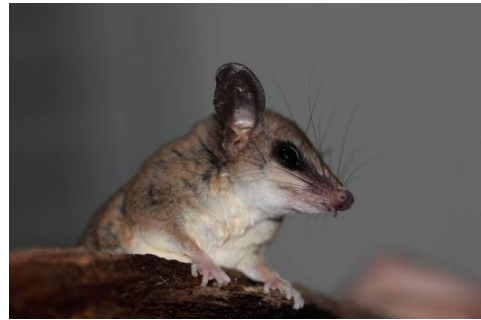
Figura 0-2 - Marmosops cf. parvidens , mucurixica, capturada em Mutum, no transecto 8.