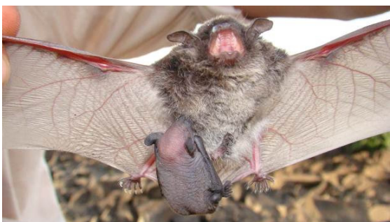
Figura 0-5 - Myotis albescens pertencente a colônia maternidade encontrada no Pedral na região de Abunã (20L 0242400/8943892UTM).