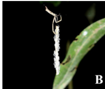
Foto 2 Uloboridae com filhotes