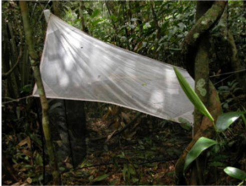
Foto 1 Vista lateral da armadilha Malaise já instalada