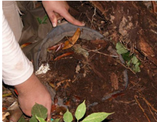
Foto 2 Retirada da cobertura de serapilheira para a extração da fauna local.