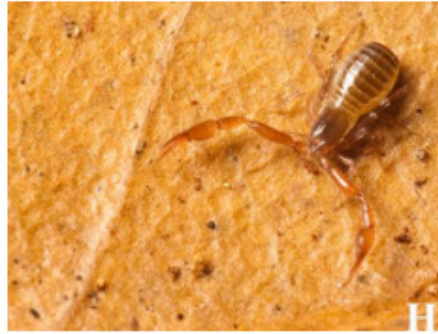
Foto 8 Pseudoscorpiones