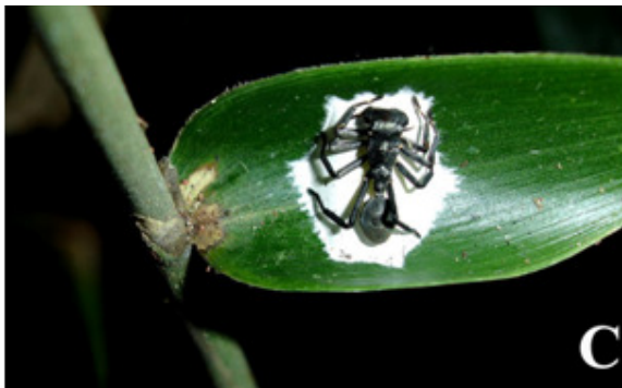
Thomisidae