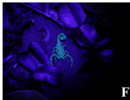
Foto 6 Buthidae sob luz UV