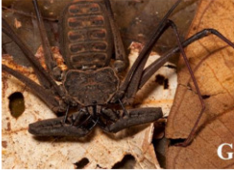
Foto 7 Amblypygi