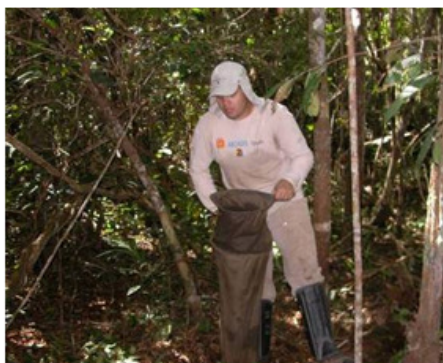
Foto 3 Peneiração da serapilheira para o deslocamento da fauna