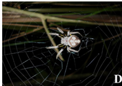
Foto 4 Araneidae