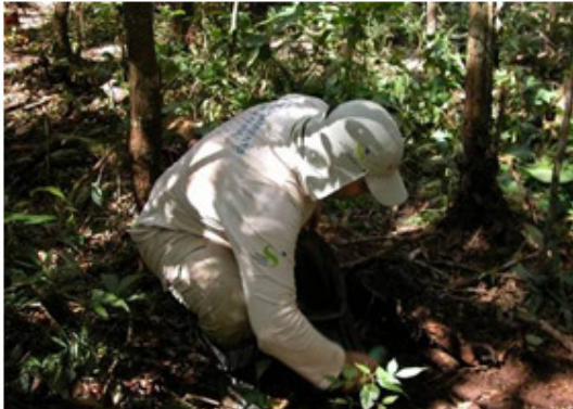
Foto1 Escolha das amostras em campo.