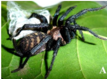
Foto 1 Theraphosidae