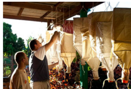
Foto 4 Disposição dos extratores mini-Winkler em Mutum-Paraná