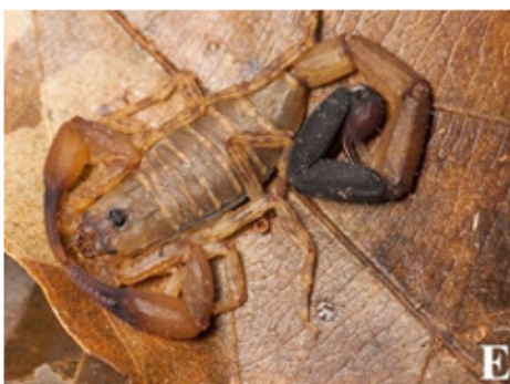
Foto 5 Buthidae